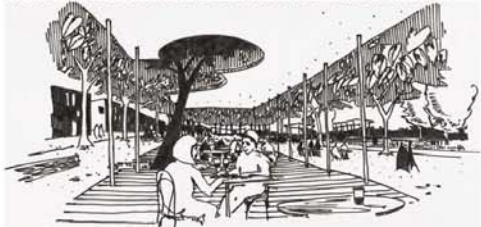
KAVÁRNA S PERGOLOU