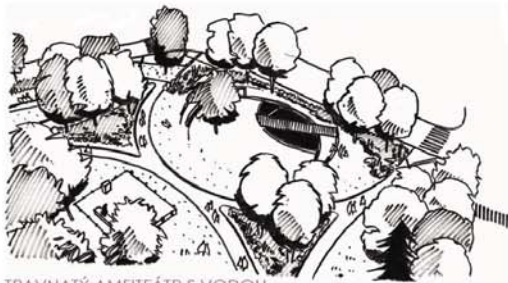
TRAVNATÝ AMFITEÁTR S VODOU