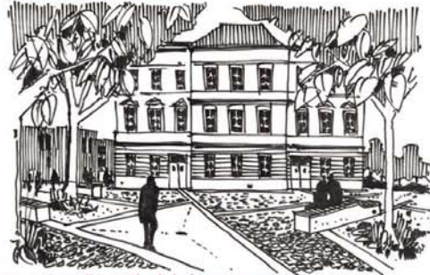
PROSTOR PŘED STÁVÁJÍCÍ KNIHOVNOU