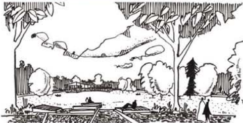
POHLED PŘES SEZENÍ A LEŽENÍ NA ALTÁN