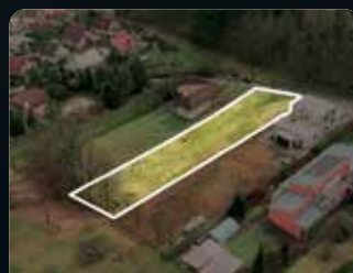
STAVEBNÍ POZEMEK 1 488 m 2 ZLÍN, MLADCOVÁ 8 990 000 Kč