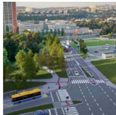
3D vizualizace 2020