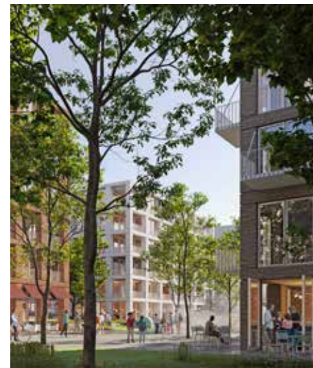
Vizualizace nové čtvrti Březnická