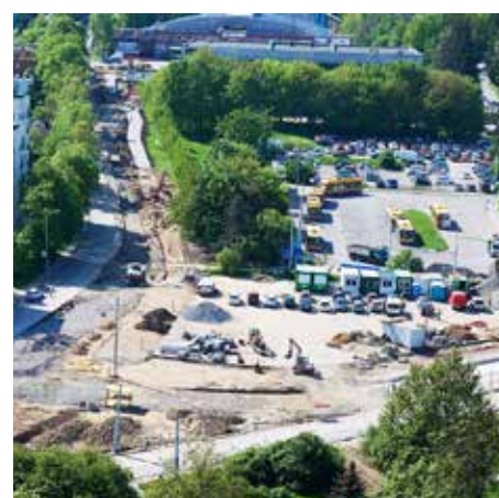
Zařízení staveniště 2023