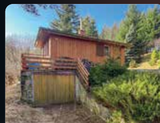
CHATA PODKOPNÁ LHOTA 1 500 000 Kč