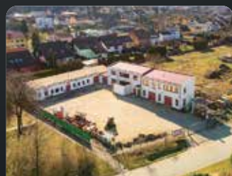
KOMERČNÍ AREÁL S INVESTIČNÍM POTENCIÁLEM ZLÍN, MALENOVICE 39 900 000 Kč