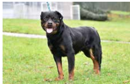
ROCKY – rotvajler, 9 let, zná základy poslušnosti, je zvyklý na náhubek, chodí pravidelně na vycházky s dobrovolníky, vhodný k jednomu zkušenému pejskaři, v útulku čeká 3,5 roku!!!

Studenti Fakulty multimediálních komunikací Univerzity Tomáše Bati ve Zlíně