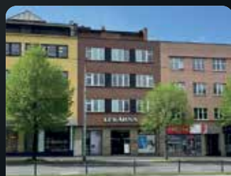
POLYFUNKČNÍ DŮM CENTRUM MĚSTA ZLÍNA Na dotaz v RK