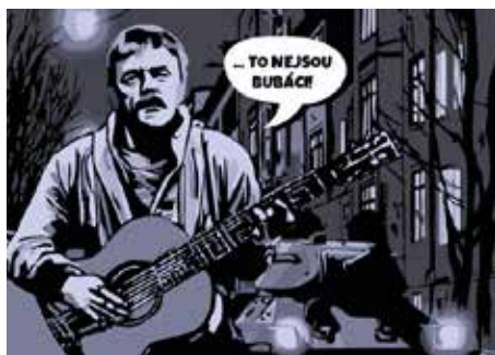
Městské divadlo Zlín uvede novinku Kryl

Zlín se v květnu znovu stane místem, kde se setkává české a slovenské divadelní umění. Festival Setkání Stretnutie letos slaví kulaté narozeniny – už třicet let propojuje dvě divadelní kultury, které si mají pořád co říct. Jubilejní ročník proběhne od 12. do 16. května 2026 a slibuje pět dní plných silných příběhů, inspirativních setkání i neopakovatelné festivalové atmosféry.