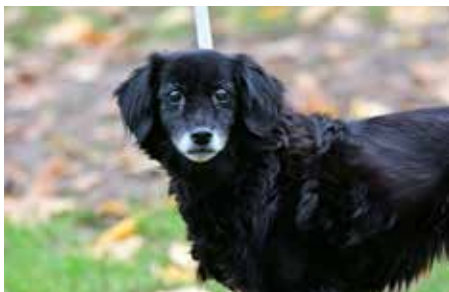
SÁRA – fenka křížence špice, 14 let, přátelská a vděčná, na vycházkách stále vitální, ale potřebuje už svůj klid a trpělivý přístup, vhodná pro staršího člověka

Pro návštěvníky je připraven doprovodný program v čele s oblíbeným venčením pejsků, díky kterému si mohou zájemci vyzkoušet péči o čtyřnohé mazlíčky přímo v terénu. Děti se mohou těšit na nejrůznější sportovní a pohybové aktivity. Jarní atmosféru zde pak doplní možnost opéct si špekáčky či jiné dobroty na otevřeném ohni. Novinkou letošního jarního ročníku bude přednáška o Canisterapii darem – terapii, při které speciálně vycvičení psi pomáhají zlepšovat psychickou pohodu lidí. Setkání