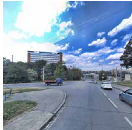
Pamatujete rok 2019, kdy na křižovatce Mostní a Březnická „semafony“ suplovali chodci a vyjet z vedlejší ulice vyžadovalo značnou dávku odvahy?