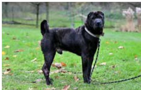
COOPER – šarpej, kastrováný, 11 let, potřebuje dostatek času, aby si na svého pána zvykl, pak je oddaný a důvěřivý pes, uvítal by chom zájemce se zkušenostmi s tímto plemenem

Hlavní ambicí projektu zůstává pomoc místním pejskům a kočičkám a vytvoření příležitosti pro setkání všech milovníků zvířat v příjemném prostředí Útulku pro zvířata v nouzi Zlín-Vršava.