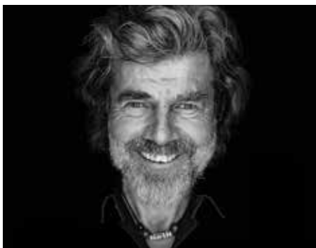
Reinhold Messner, hlavní hvězda letošního festivalu Neznámá Země

„Reinhold Messner je pro nás symbolem odvahy překračovat hranice – nejen ty geografické, ale i ty lidské. Jeho příběh je příběhem člověka, který celý život hledá smysl dobrodružství. Jsme moc rádi, že jednu ze svých posledních veřejných přednášek