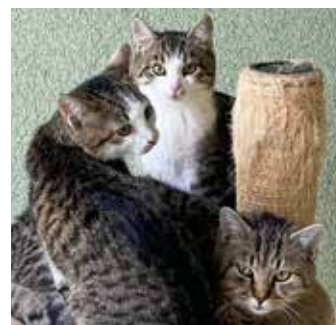
KOČKY A KOŤATA – stále v útulku na vás čeká okolo 60 kočiček, kterým můžete dát nejhezčí dárek – nový domov