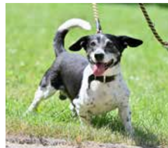
BENN – kříženec jezevčička, vitální, 14 let, vhodný k jednomu člověku, v útulku 1,5 roku