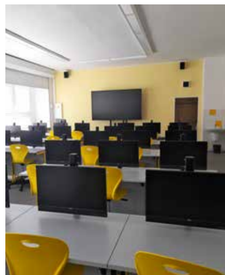
Nová multimediální třída v ZŠ Zlín, Křiby

Dále mohou organizace čerpat další finanční prostředky z různých fondů státního rozpočtu, EU apod.