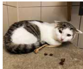
PINOKIO – mladý 1,5 roku starý kocourek, který je trochu plachý, kastrován, očkován, na útulku už čeká 1 rok

vykloubeného kyčelního kloubu. Zhruba šestiletý pejsek Pedro během pobytu v útulku bohužel špatně doskočil a my jsme museli řešit náhlý neurologický problém. Byl na vyšetření na veterinární klinice Jaggy v Brně, kde nám zatím nebyla doporučena operace, ale léčba intenzivní fyzioterapií. V současné době s ním intenzivně rehabilituje naše externí fyzioterapeutka. Budeme moc rádi za jakýkoliv finanční příspěvek na veterinární péči prostřednictvím našeho dárcovského účtu 102987600/2250. Je také možné si zakoupit náš kalendář. Děkuje-me za podporu! /red/