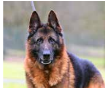
REX – německý ovčák, 12 let, původně odebrán z nevhodných podmínek KVS, dnes je z něho krásný, přátelský a aktivní pes