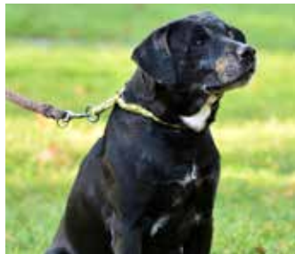
GROOT – hodný x labrador a stařfordský, 13 let, fixovaný na člověka, navzdory věku aktivní, na útulku čeká 3 roky!!!