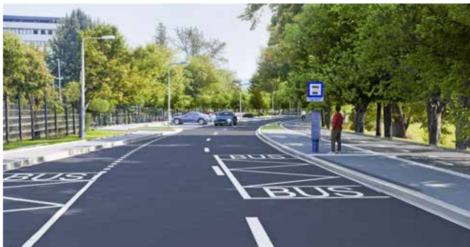
Součástí navrhovaných úprav uličního profilu budou také nové zastávky MHD

Statutární město Zlín připravilo zásadní rekonstrukci Havlíčkova a Peroutkova nábřeží. Projekt za přibližně 120 milionů korun cílí zároveň na potřeby obyvatel, návštěvníků areálu Krajské nemocnice T. Bati a propojení cyklistických tras v zastavěném území města Zlína.