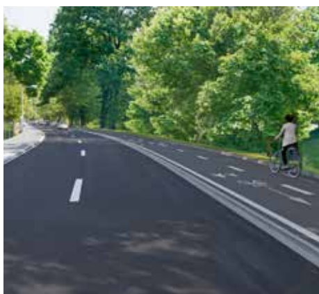
Mezi komunikací a hranou koryta Dřevnice vznikne společná stezka pro pěší a cyklisty. Na straně u nemocnice pak bude nový chodník

Součástí projektu, s jehož realizací i dokončením se počítá v letech 2025 a 2026, je rovněž oprava silnice až po místní část Příluky, kde kostkovicí nahradí nový asfalt. Vzniknou také nová místa pro přecházení a dojde k propojení dalšího úseku s městskou páteří cyklostezkou.