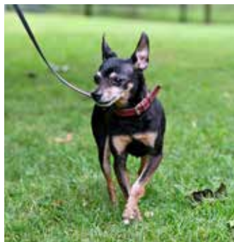
FRED – pražský krysařík, 13 let, potřebuje klidný přístup, je hodně bázlivý, pro jednoho člověka