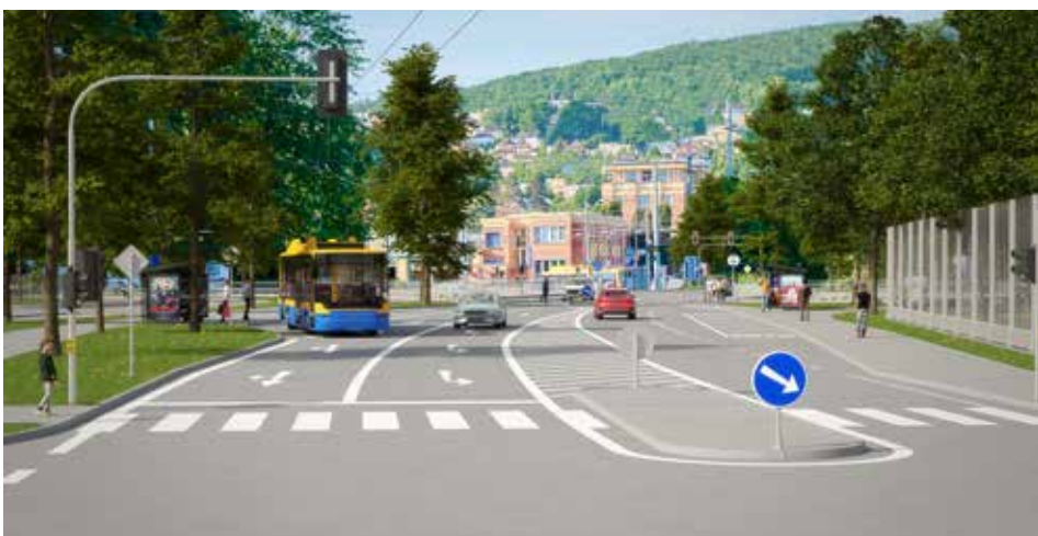
Pohled z obchvatu Zálešná