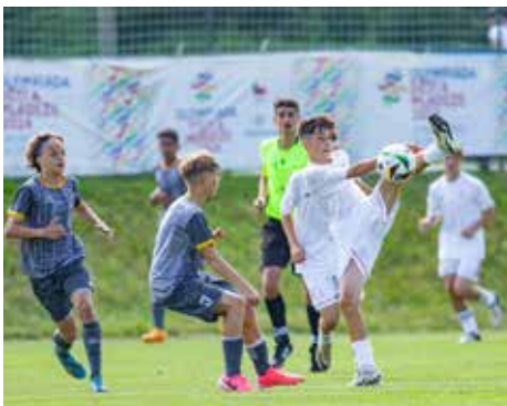
Ilustrační foto www.olympijskytym.cz

„Podpora sportu u dětí a mládeže je nesmírně důležitá, proto jsme například vloni pomohli nastartovat krajské sportovní aka-