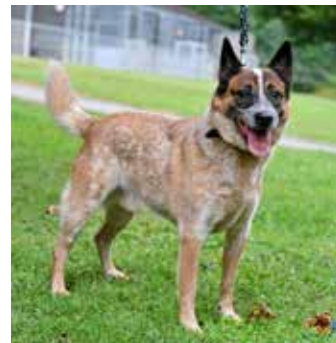
RIKI – australský honácký pes, 9 let, kastrováný, k cizím lidem nedůvěřivý, potřebuje zkušeného kynologa