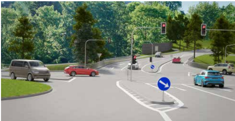
Pohled na napojení obchvatu Zálešná na ulici Sokolská

Společná snaha města Zlína a Zlínského kraje o urychlení stavby dálničního přivaděče získává jasné obrysy. Statutární město Zlín, které se na klíčové akci podílí výstavbou třetího úseku známého jako obchvat Zálešné, už získalo pro svou část stavby územní rozhodnutí, vybralo zhotovitele dokumentace pro stavební záměr a ještě do konce letošního roku chce zahájit další vlnu výkupů garáží za novou odhadní cenu.