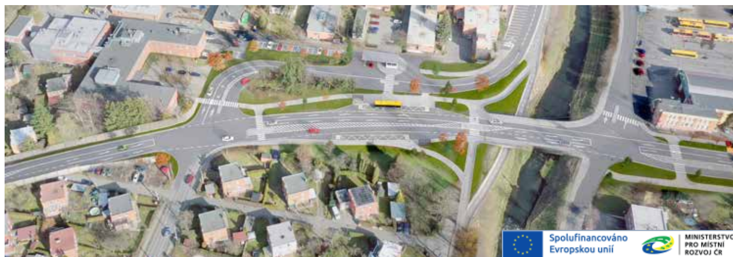
Další navazující část uceleného dopravního i architektonického řešení je pak přichystána v projektu obchvatu Zálešná, který město Zlín připravuje v nadcházejících letech společně s přestavbou krajské nemocnice. Součástí jsou nové cyklopodjezdy a nové přechody pro chodce.