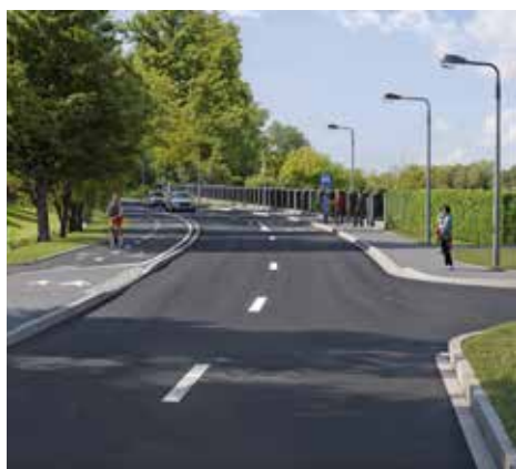
Součástí je i oprava silnice až po místní část Příluky, kde kostky nahradí nový asfalt a dojde k propojení dalšího úseku páteří cyklostezky