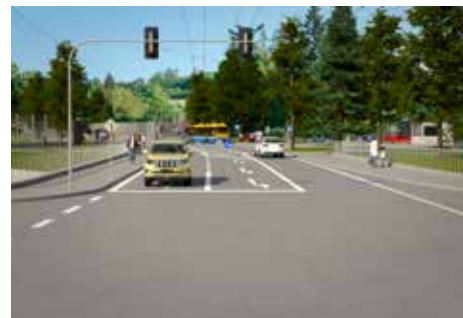
Pohled na nový přechod přes most u Krajské nemocnice Tomáše Bati

Vláda ČR uvolnila pro Zlínský kraj na výstavbu přivaděče a obchvatu Zálešné 780 milionů korun, což představuje méně než polovinu všech nákladů na propojení dálnice D49 a I/49. Tento záměr prošel i centrální komisí Státního fondu dopravní infrastruktury a nyní už bude záležet na samotné přípravě stavby, která po svém dokončení významně uleví řidičům, kteří se budou moci při průjezdu krajským městem vyhnout jeho centru a pokračovat dál směrem na Vizovice.