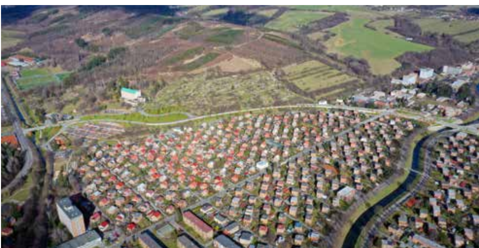
Statutární město Zlín, které se na klíčové akci podílí výstavbou třetího úseku známého jako obchvat Zálešné