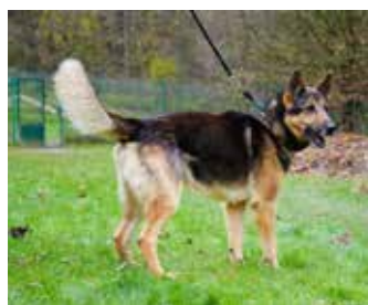
KIM – krásný mohutný ovčák, 9 let, na své lidi přátelský, zná základní povely, umí hlídat