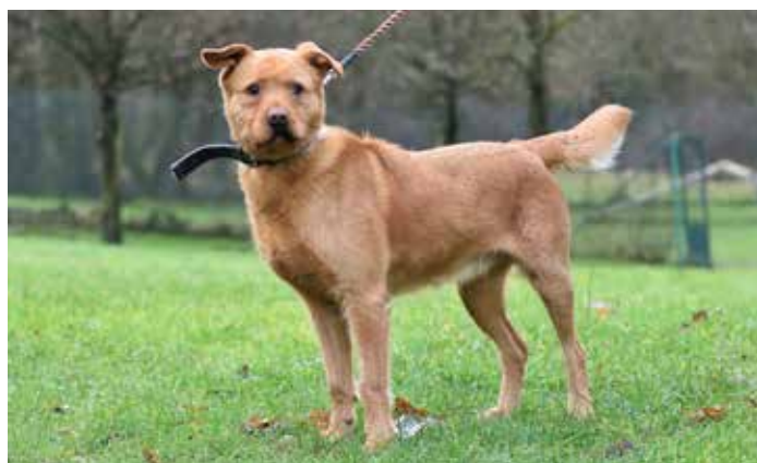
BETTY – fena křížence teriéra, živé torpédo, hodná, 8 let, kastrovaná, na útulku čeká rok

Z hlediska oprav a technického zázemí útulku došlo v minulém roce taky k několika nutným úpravám. Chtěli bychom poděkovat městu za zhotovení přístřešku pro příjem koček na karanténě a jeho následného oplocení. Bylo také nutné koupit nový telefon, aby nedocházelo k přerušování hovoru s návštěvníky. Na začátku tohoto roku dojde k úpravám chodníků v rámci areálu. I když se to nezdá, náš útulek již stojí 19 let a potřebuje sem tam něco modernizovat. /red/