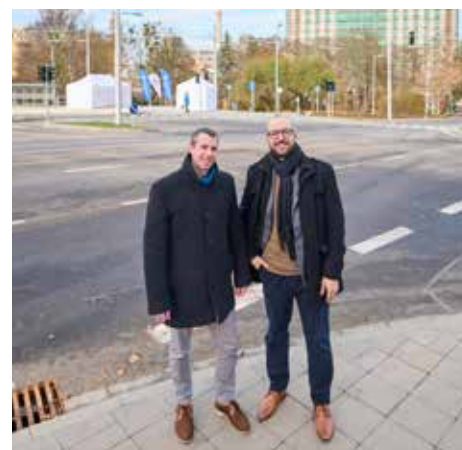
Primátor Jiří Korec, náměstek primátora Michal Čížek

Práce pro statutární město Zlín a Ředitelství silnic Zlínského kraje provedlo sdružení firem SMO a. s. a EUROVIA CS a. s. Stavba, která si vyžádala náklady za přibližně 150 milionů korun, funguje od 30. listopadu ve zkušebním provozu s tím, že kolaudace bude následovat v příštím roce. Město Zlín na ni čerpalo dotační prostředky z Integrovaného regionálního operačního programu Ministerstva pro místní rozvoj ČR (40. výzva IROP – Infrastruktura pro bezpečnou nemotorovou dopravu – SC 6.1) ve výši 25,5 milionu korun. /ara/