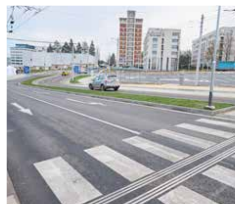
Bezpečnost chodců v Mostní ulici zvýšil nový přechod