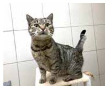
JARUŠKA – umazlená mladá dospělá kočka, očkovaná a kastrovaná