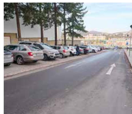
Součástí rekonstrukce byly i komunikace u Velkého kina