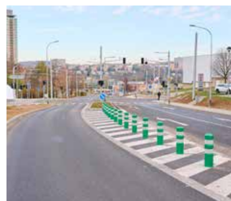
Úpravy v Březnické ulici jsou nepřehlédnutelné