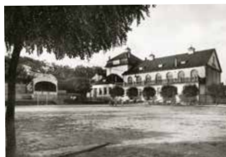
Zlínská sokolovna v roce 1930

V té době už ale na pozemku u holešovské cesty stála skvostná novostavba dnešní sokolovny. Zde sokolové nejen cvičili, ale také pořádali koncerty, plesy, přednášky, divadelní a loutková představení a budova otevřená v roce 1921 tak plnila v době první republiky funkci důležitého kulturně-společenského centra města.