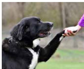
BRUNO / kříženec velkého plemene, 10 let, v útulku 4 roky (!), pro zkušeného pejskaře, ideálně do rodinného domu