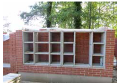
Nové kolumbárium je největší letošní investicí

V investicích bude Pohřebnictví Zlín pokračovat i v roce 2024. Například na hřbitově v Loukách