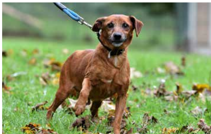
ALÍK / milý a aktivní kříženec pinče, 11 let, v útulku 2 roky, nutná jaterní dieta, hledáme mu spokojený domov na stáří

zjistili, že má vyřezlou plotýnku a jelikož je to mladý psík, dali jsme mu šanci a nechali ho operovat na veterinární klinice v Brně. Čeká ho ještě dlouhá cesta rehabilitace, a to také díky dobrovolnosti jedné hodné fyzioterapeutky, ale díky vašim darům dostal šanci na plnohodnotný život. Moc si vaší podpory ceníme a na konci roku bychom vám za nynějších zhruba 50 psů a 50 koček chtěli popřát klidné vánoční svátečky v přítomnosti vašich blízkých a vašich chlupatých rodinných členů, ať už jsou nebo nejsou z útulku. Do nového roku vám přejeme hodně šťastných chvil s vašimi čtyřnohými miláčky či parťáky. Děkuje vám za vaši celoroční podporu. Návštěvní doba v době svátků bude uveřejněna na našem webu a Facebooku Útlek Zlín. /red/