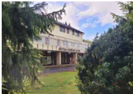
Pohřební služba v sídle společnosti na Lesním hřbitově

Podnikání v oboru pohřebnictví vyžaduje velkou dávku empatie a porozumění. Klienti se vyrovnávají se ztrátou svých blízkých, se zvýšenou citlivostí proto očekávají od poskytovatele pohřebních služeb kvalitu a profesionalitu.