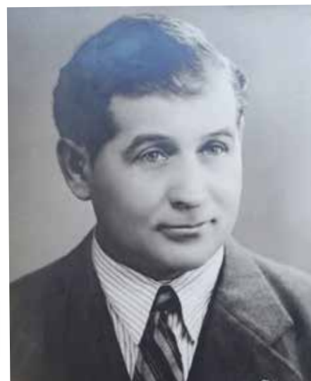
Nejúspěšnějším sportovcem zlínského Sokola byl několikanásobný olympijský medailista, gymnasta Ladislav Vácha