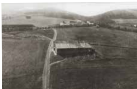
Sokolská buda stávala na místě současného náměstí Práce

Tělocvičná jednota Sokol se v roce 1898 stala prvním sportovně zaměřeným spolkem, který ve Zlíně povolily tehdejší rakouské úřady. Na rozdíl od většiny ostatních sportovních organizací se však Sokol věnoval – a dodnes věnuje – také výchově k vlastenectví a rozvoji kulturního života. Například hned v roce 1899 vznikl v rámci zlínského Sokola ochotnický divadelní soubor.