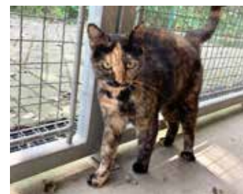
ŤAPKA / dospělá kočena, 1,5 roku, mírně bázlivá, po navrácení z adopce na ni chceme upozornit, očkovaná, kastrovaná