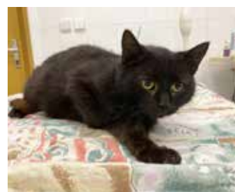
ŠPAGETKA / starší (8-9 let) kočička, klidná, čistotná, v útulku čeká rok (!)