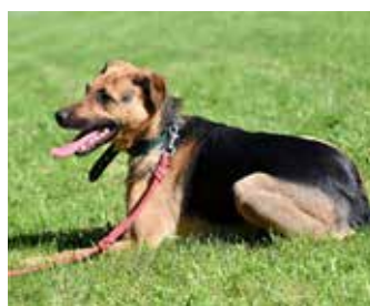
ARLO / drobný kříženec německého ovčáka, 3 roky, vhodný do bytu, do klidné rodiny