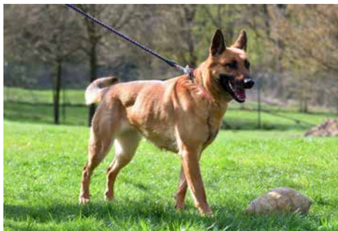
ARYA / fena x belgického ovčáka, temperamentní, hravá, 5 let, kastrovaná, vhodná pro znalce plemene

focení a grafickou úpravu fotografií chceme poděkovat Vítku Huspeninovi. Za grafické zpracování kalendáře a přípravu pro tisk děkujeme Janě Dosoudilové a Rostislavu Illíkovi z Fakulty multimediálních komunikací UTB ve Zlíně. Velké poděkování patří našim sponzorům, jejichž loga jsou viditelná na liště tohoto kalendáře. Jejich sponzorský dar byl použit pro celkovou úhradu tisku. Cena kalendáře zůstává stejná, 180 Kč. Jednotlivá prodejní místa našeho kalendáře budou průběžně zveřejňována na našem webu, Facebooku a Instagramu „Útlek Zlín“. Je také možnost napsat nám na e-mail utulekzlin@utulekzlin.cz a my vám kalendář rádi zašleme. Doufáme, že i vám bude náš kalendář dělat radost celý příští rok. /red/