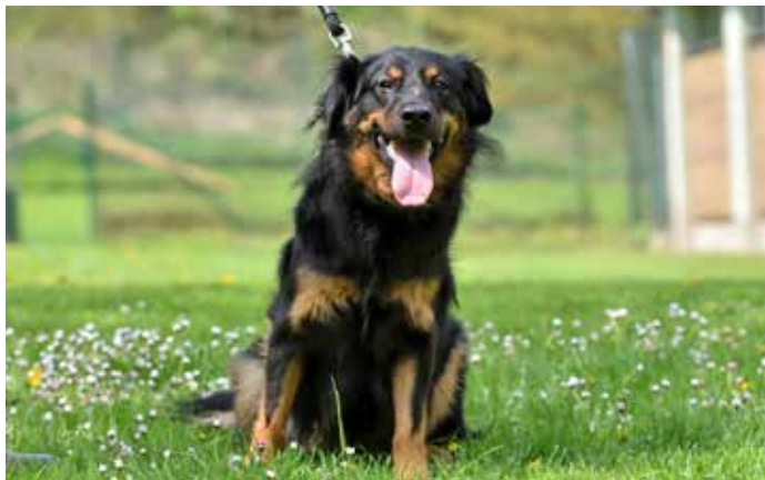
MATTY / kříženec střední velikosti, 2 roky, vhodný pro jednoho člověka, v útulku od 4/2022