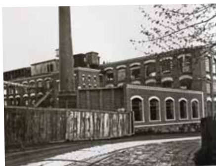
Tovární budovy u zlínského nádraží v první polovině 20. let

Stojíme na rozcestí – buď zastavíme výrobu a propustíme veškeré zaměstnance, jak to již mnoho továren udělalo, anebo přizpůsobíme výrobní náklady novým poměrům. Pro náš závod byl by nejprospěšnější způsob první, poněvadž bychom takto byli s to za přiměřené ceny s nejmenší ztrátou prodati velké zásoby připravené pro podzimní sezonu a vyčkatí s nákupem zásob nových až se ceny na trhu surovin přizpůsobí cenám světovým. Tímto ovšem velice byl by poškozen celý hospodářský život a nejhůře dělnictvo. Rozhodli jsme se pro udržení výroby v plném rozsahu, avšak snížili výrobní náklady tak, abychom ihned mohli obuv prodávati průměrně o polovici levněji nežli jsme prodávali tohoto jara. Toto veliké snížení obuvi nelze již ušetřiti na režiiích a bylo nutno sáhnouti ku snížení mezd zřízencům, pracujícím