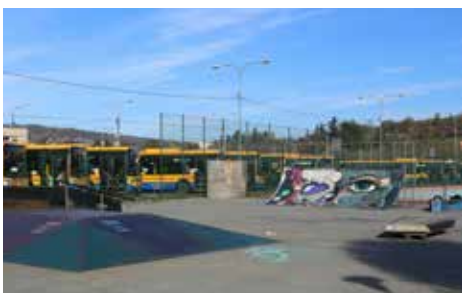
Modernizace skateparku BARTOŠKA