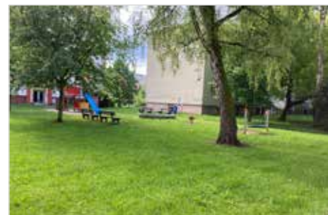
Revitalizace dětského hřiště č. 18 mezi domy u Podvesné IV