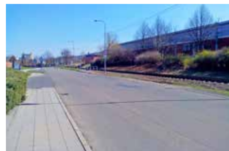
Kultivace zastávky autobusové linky č. 33 Broučkova – směr Bartošova čtvrť