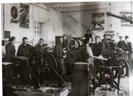
Tiskárna firmy Baťa chrlící reklamní plakáty, rok 1924

K nejskloňovanějším slovům posledních týdnů patří bezesporu krize. Ekonomické turbulence a zvraty nebyly v historii žádnou výjimkou. Říká se také, že každá krize vytváří příležitost k růstu.