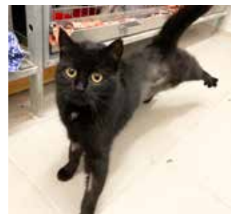
MIA / umazlená a přítulná, asi 5 let stará kočička, po operaci břišní dutiny, očkováná, kastrována