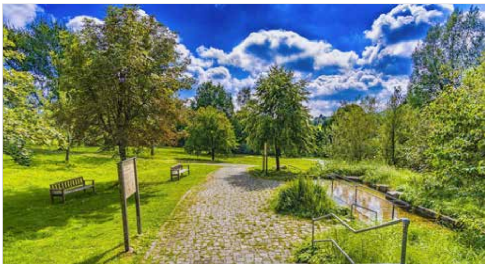
700let Zlína: Stromy & lidé