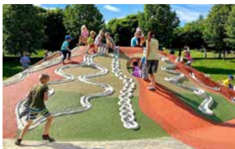
Kuličková dráha ve Zlíně