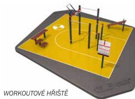
WORKOUTOVÉ HŘIŠTĚ Zálešná