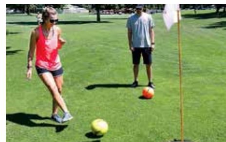
FootGolfové hřiště ve Zlíně