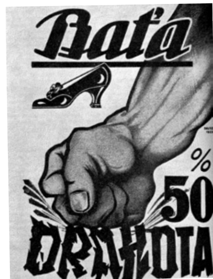
Známý plakát „Baťa drtí drahotu“, který v roce 1922 zaplavil Československo

na čas o 40 % a sazby úkolové této redukcí přizpůsobiti. Naproti tomu budeme až do té doby, pokud hladina cen neklesne, opatřovati všem našim zaměstnancům potraviny, oděv a ostatní běžné životní potřeby za polovičku té ceny, která byla na trhu v květnu tohoto roku požadována.“