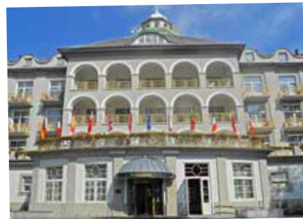
Lázeňský dům Priessnitz