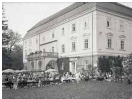
Zlínský zámek

Touto úpravou byl pozměněn i výraz celé stavby – východní průčelí starého paláce bylo půdorysně zasunuto za průčelí bývalé věže. Do vznik-