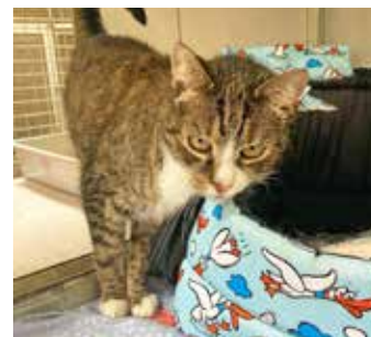
SANDRA / bílounouřatá kočka, 10 let, zvyklá v bytě, útlek bere psychicky moc špatně

Kalendář můžete zakoupit na více místech, jsou to veterinární ordinace, zverimexy, multikino GAC, některé školy, různé firmy a jednotlivci, kteří nám tak bezplatně pomáhají a podporují tuto myšlenku. Patří jim od nás velký dík. Pokud jste z daleka, není problém napsat na náš e-mail utulekzlin@utulekzlin.cz a my vám kalendář pošleme poštou. /red/