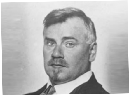
Leopold Bauer

Letos v září jsme si připomněli 150 let od narození významného rakouského, ale především slezského architekta Leopolda Bauera. Svou nepřehlédnutelnou stopu zanechal i ve Zlíně, je autorem přestavby zlínského zámku, která se uskutečnila počátkem 20. století.