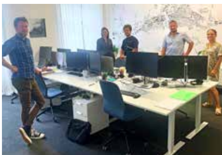
Ředitel KAM (vlevo) se svým týmem

„Před 4 lety jsme měli vizi, aby město Zlín začalo koncepčně pracovat s veřejným prostorem, baťovskými čtvrtěmi a rozvíjelo se na základě jasného plánu. Vytvoření KAMu bylo prvním krokem k tomu, aby se tak stalo. Těší mě, že KAM se postupně etabloval a začal pracovat na přípravě regenerace baťovských čtvrtí a koncepčně navrhovat úpravu veřejného prostoru a podmínky pro výstavbu v rámci celého města. Věřím, že díky jejich práci bude veřejný prostor města realizován kvalitně a bude přívětivější pro obyvatele města. Chtěl bych také, aby KAM koordinoval jednotlivé stavby a procesy ve městě tak, aby na sebe navazovaly a vzájemně se doplňovaly. Čím dál důležitější bude také sladění zájmu obyvatel, města a investorů. Očekávám, že už u prvního projektu, který připravují, totiž regenerace veřejného prostoru ve čtvrti Obecní, zapojí veřejnost do samotného projektu, což bude jejich důležitá a nenahraditelná funkce.