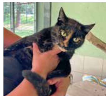
HERMIONA / žíhaná kastrováná kočička, 2-4 roky, přítulná, vhodná do klidné domácnosti