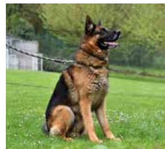
RON / německý ovčák, 5 let, temperamentní, přátelský, pro aktivního člověka