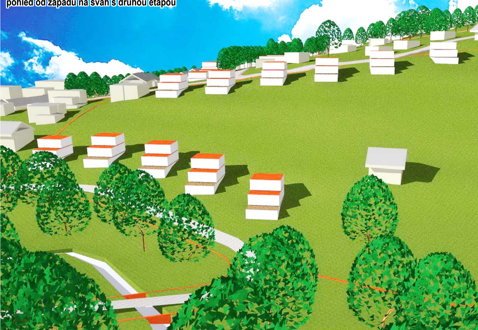
pohled od západu na svah s druhou etapou