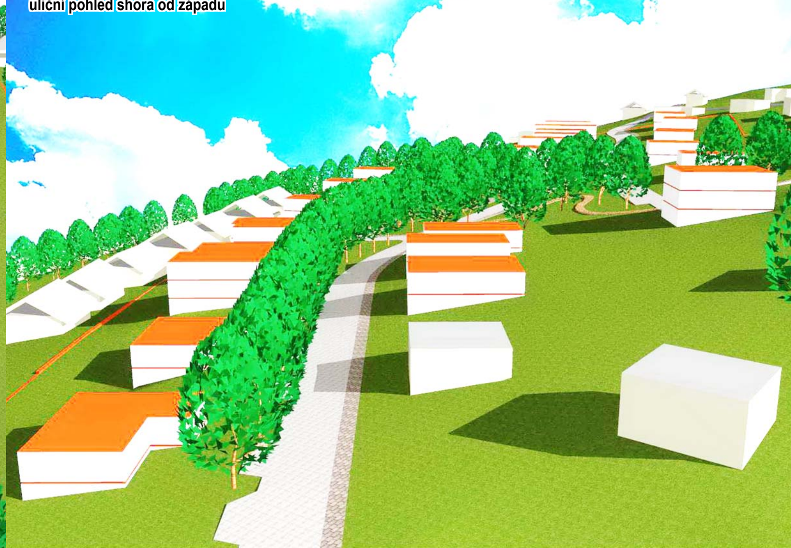
uliční pohled shora od západu