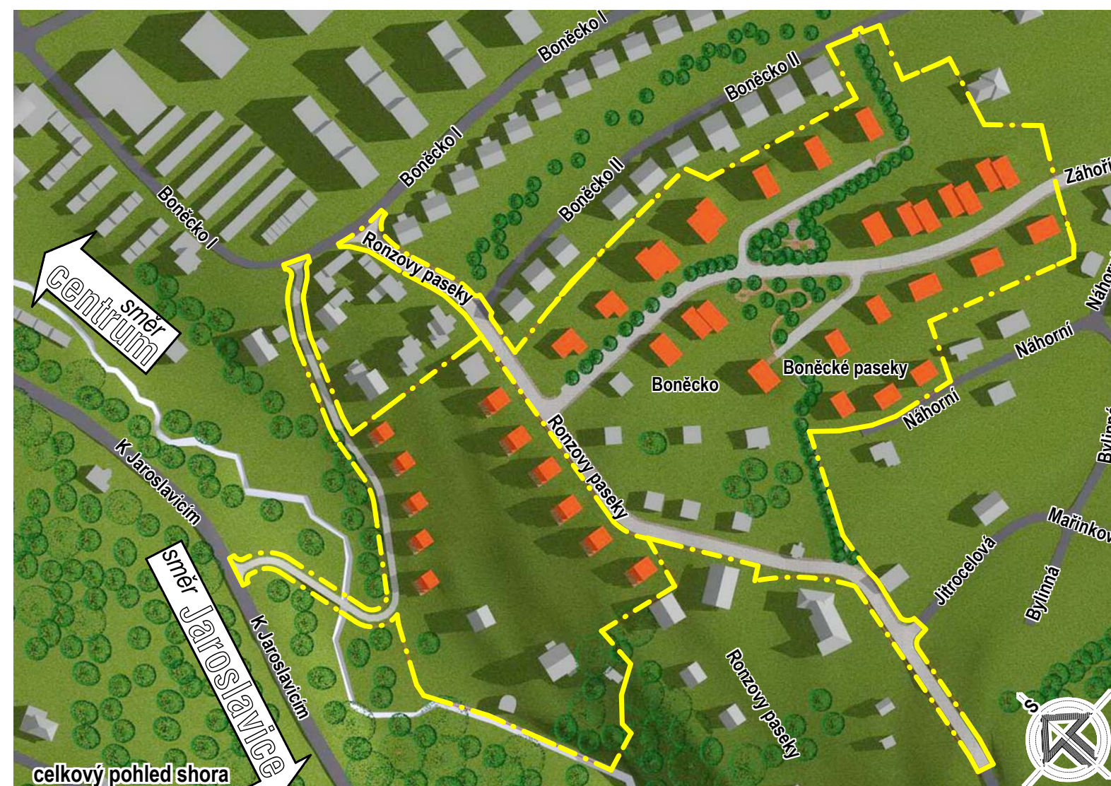
celkový pohled shora