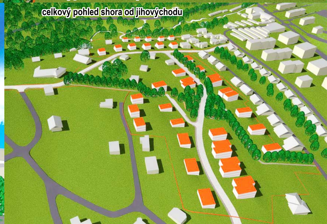
celkový pohled shora od jihovýchodu