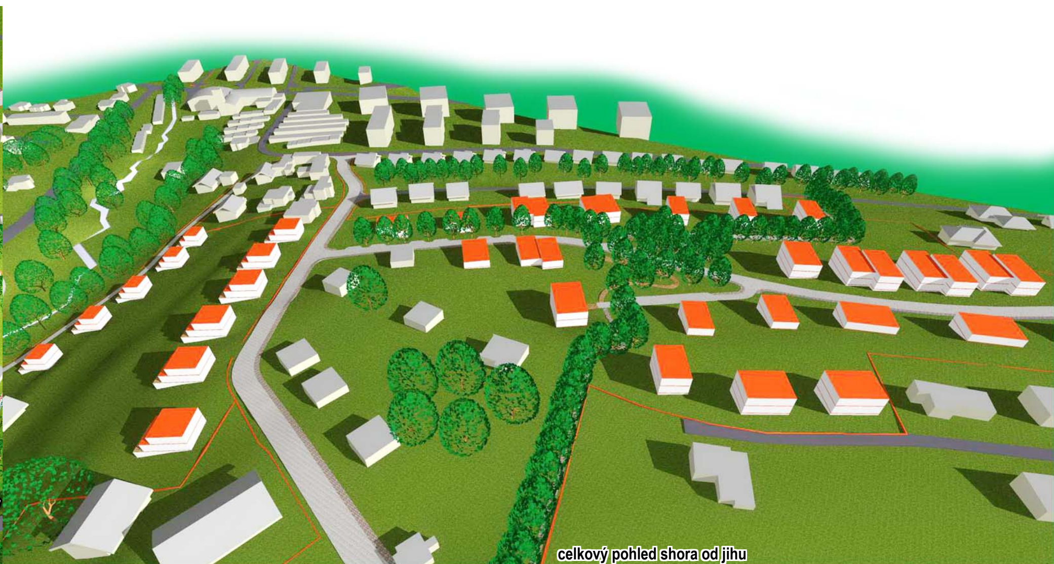
celkový pohled shora od jihu