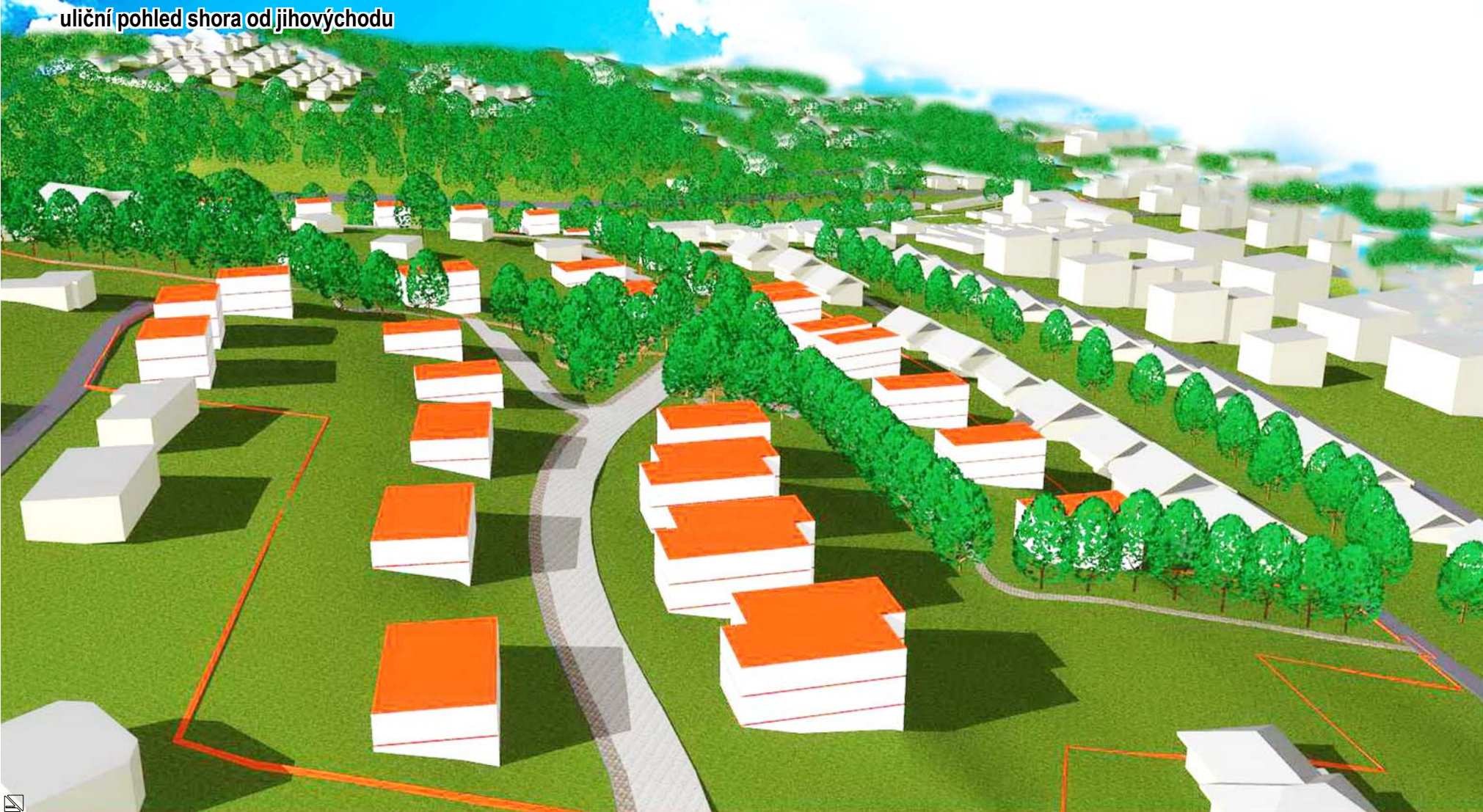
uliční pohled shora od jihovýchodu