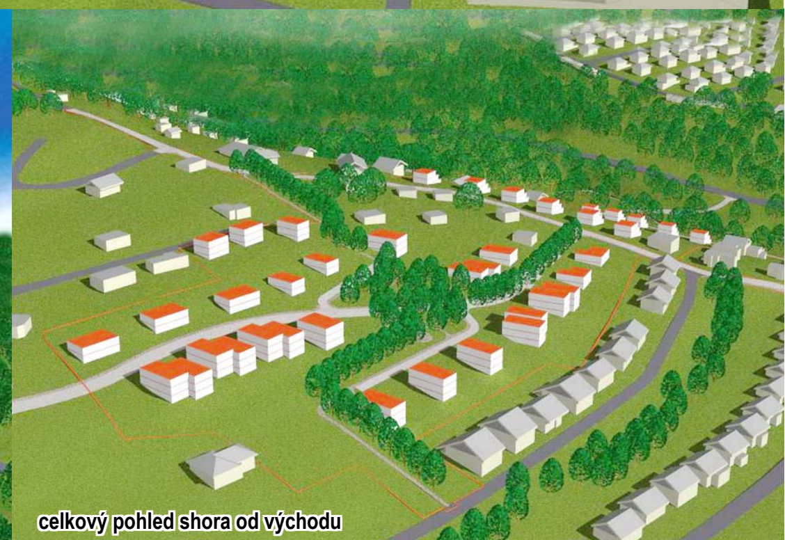
celkový pohled shora od východu