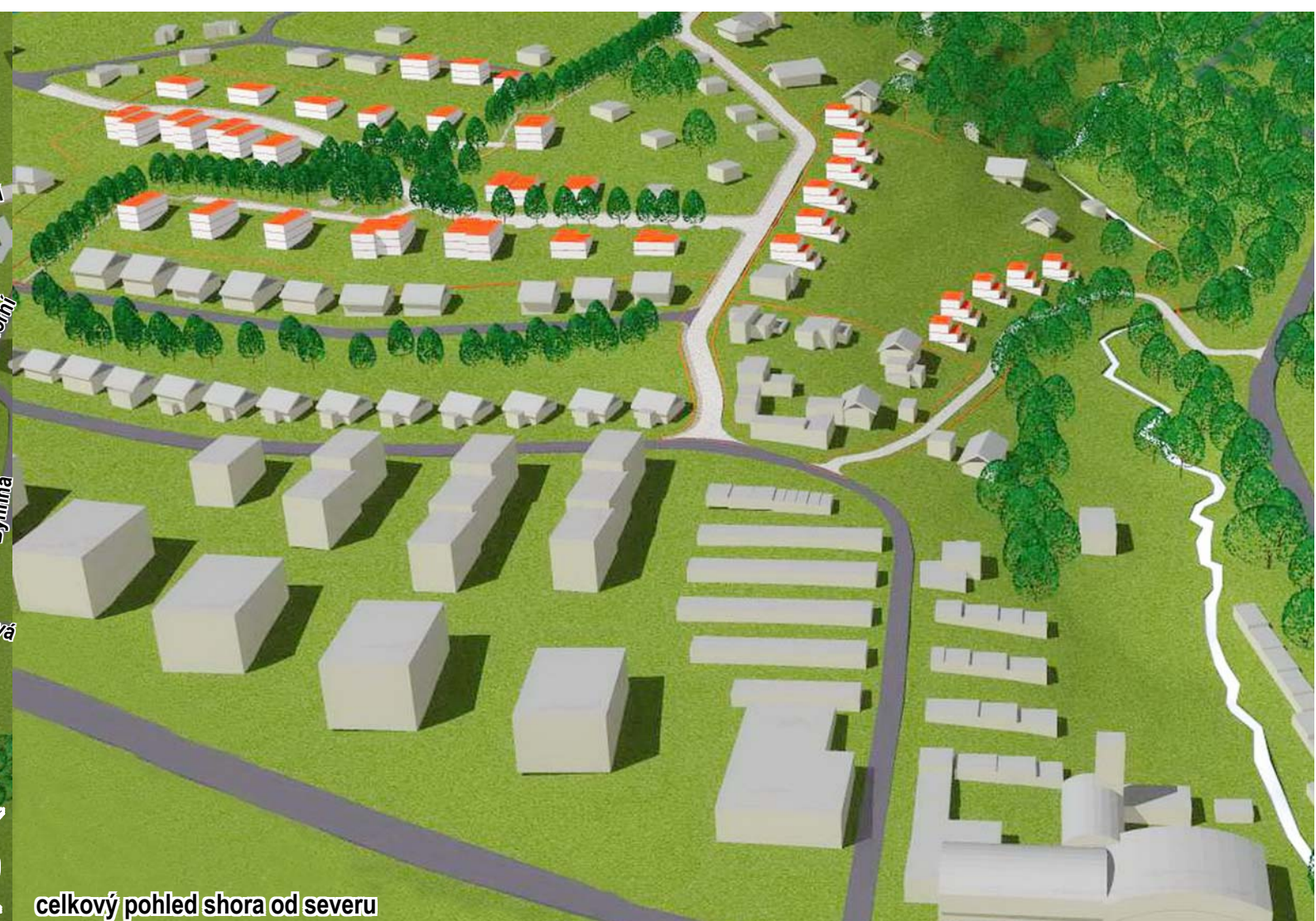
celkový pohled shora od severu