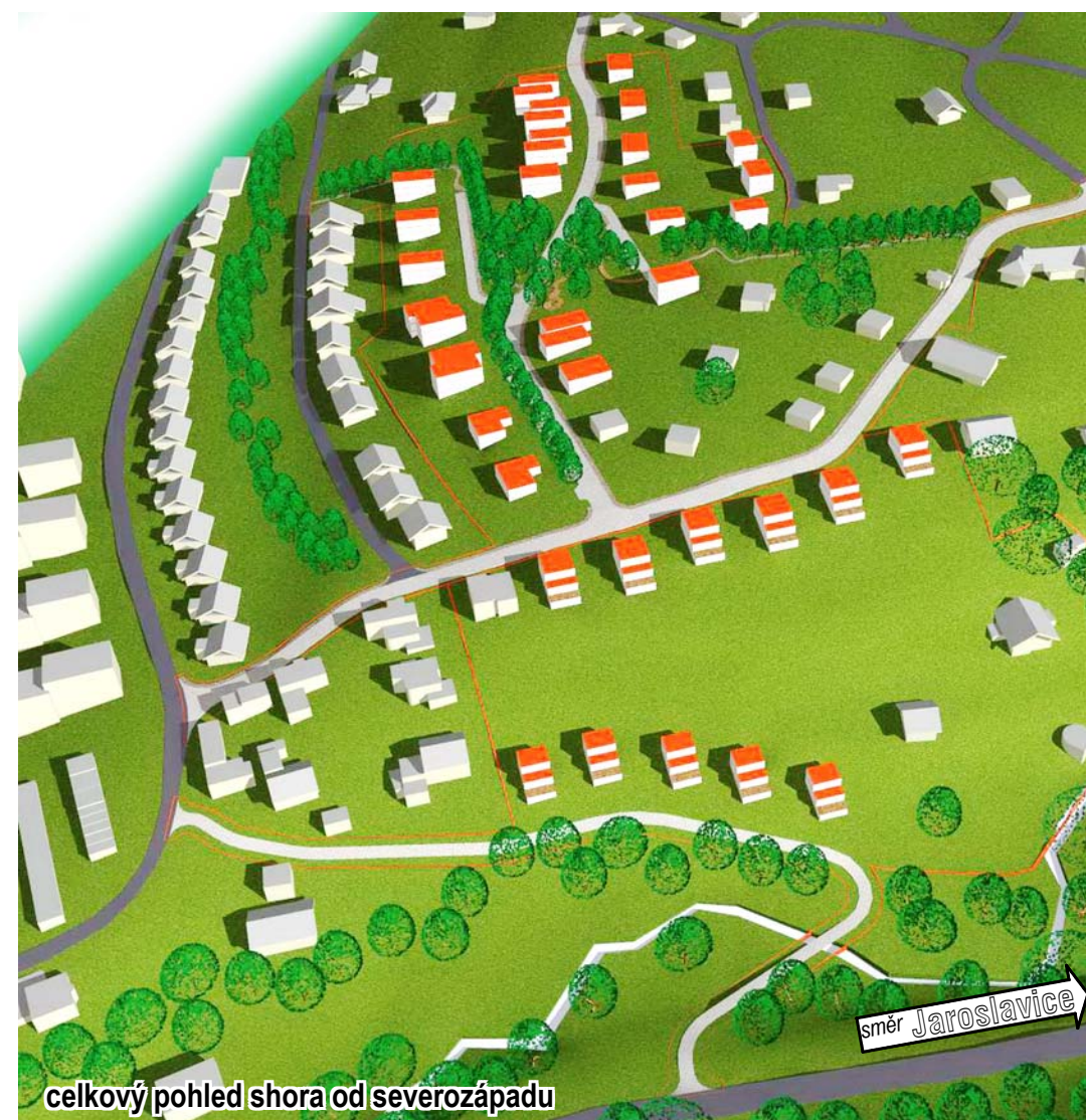
celkový pohled shora od severozápadu