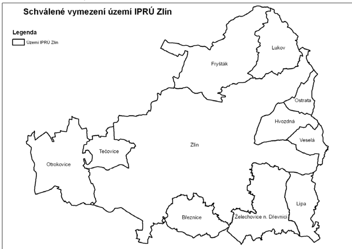
Obrázek 3: Schválené vymezení území IPRÚ Zlín

V rámci identifikace tak byly vybírány subjekty, které mají sídlo (příp. bydliště) na území vymezených obcí nebo subjekty, které jsou jinak činné ve vymezeném území.