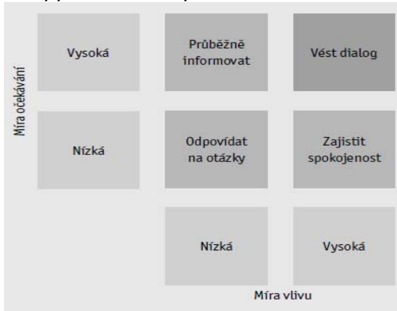
Obrázek 1: Matice analýzy vlivu zainteresovaných stran