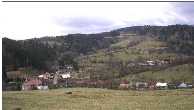
Pohled na ves z okolních, bezlesích svahů (vlevo od SZ na Sýkornici, vpravo od JV z úpatí Sýkornice) - charakteristická liniová struktura vsi v údolí obklopená svahy