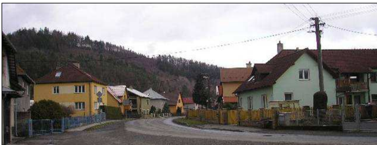
Střední část obce od JZ s přestavovanou zástavbou liniového charakteru