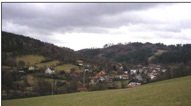
Pohled na zástavbu vsi od SV - vlevo novodobé domy nevhodně vystupují do svahu a nerespektují tak charakter soustředěné zástavby v údolí Držkovského potoka.