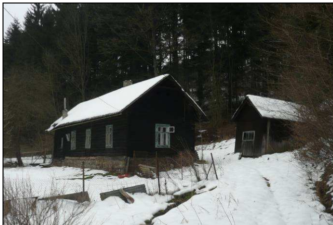
Původní stodola v enklávě Májová v údolí Držkovského potoka a roubenka v části Salajka v údolí Dřevnice.