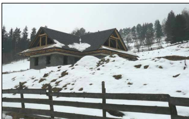
Novostavba roubenky ve stylu kanadského srubu na navážce na Nivkách a RD půdorysu T ve volné krajině v údolí Dřevnice