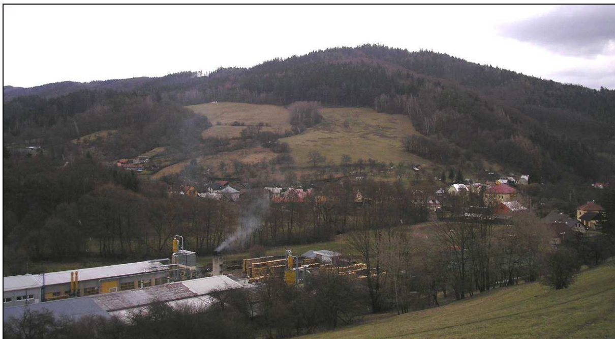
Pohled od SZ přes rozsáhlý výrobní areál na liniovou zástavbu vsi v údolí stáčející se pod masivem Sýkornice