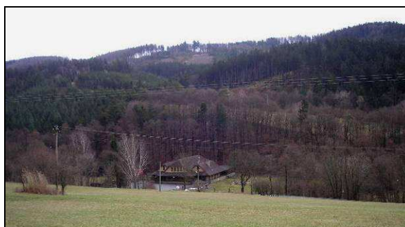
Novodobé stavby v okolí vsi - vlevo městský vila-dům na místě bývalé chaty na svahu Sýkornice, vpravo hlavní budova rekreačního areálu ve stylu motorestu 90. let