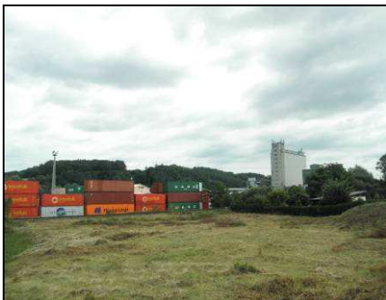
Dva odlišné příklady zástavby (vlevo venkovská v prostoru původní silniční vsi, uprostřed plošná v lokalitě Malé levé) a vpravo pohled na netypické, industriální dominanty sídla - výšková dominanty sila a plošně dominující areál kontejnerového překladiště