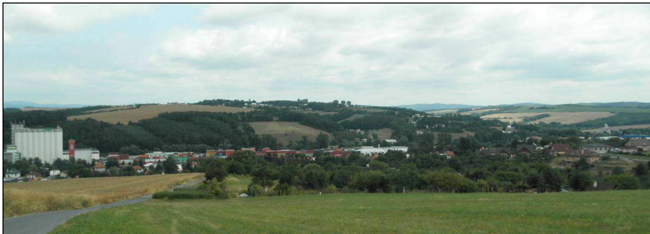
Pohled na zástavbu Lípy od JZ, v níž se vedle dominanty sila významně uplatňuje i rozsáhlé kontejnerové překladiště a novodobá plošná zástavba Na potůčkách - historická zástavba v prostoru původní silniční vsi je pohledově skryta