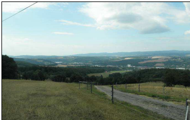
Dva pohledy do údolí Dřevnice z okolí Terasové vyhlídky - vlevo osově protažená zástavba Lípy s rozsáhlou průmyslovou zónou a dominantním objektem síla, vpravo zřetelná urbanizace údolí táhnoucí se od Zlína (od hřbetu Lysé po východní konec Lípy)