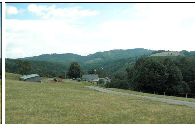
Vlevo pohled na SV z luk pod Drdolem v části Nová dědina s ukrytou usedlostí v zeleni zahrady, vpravo pohled přes fungující zemědělskou usedlost - farmu v části Rybníčky a Zelené údolí na výrazný hřbet Komonce