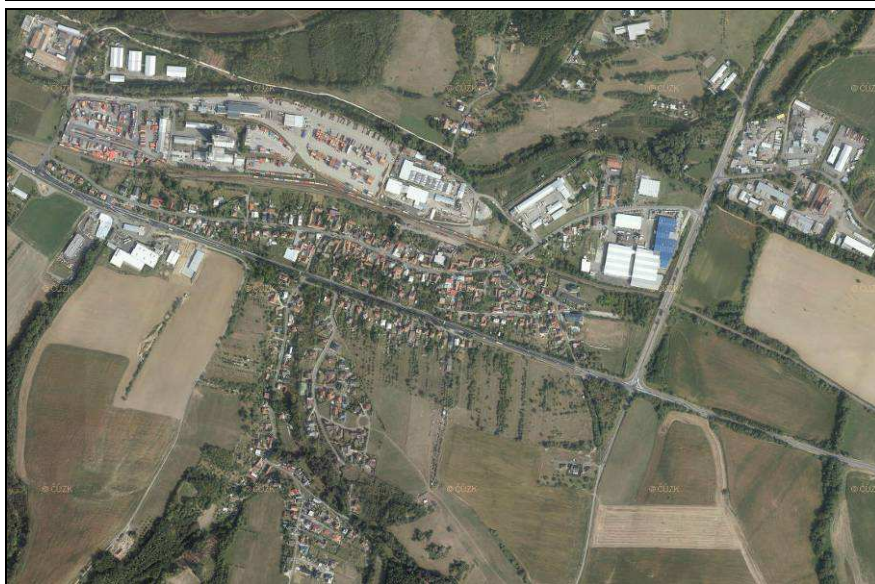
Historický (1950) a současný letecký snímek