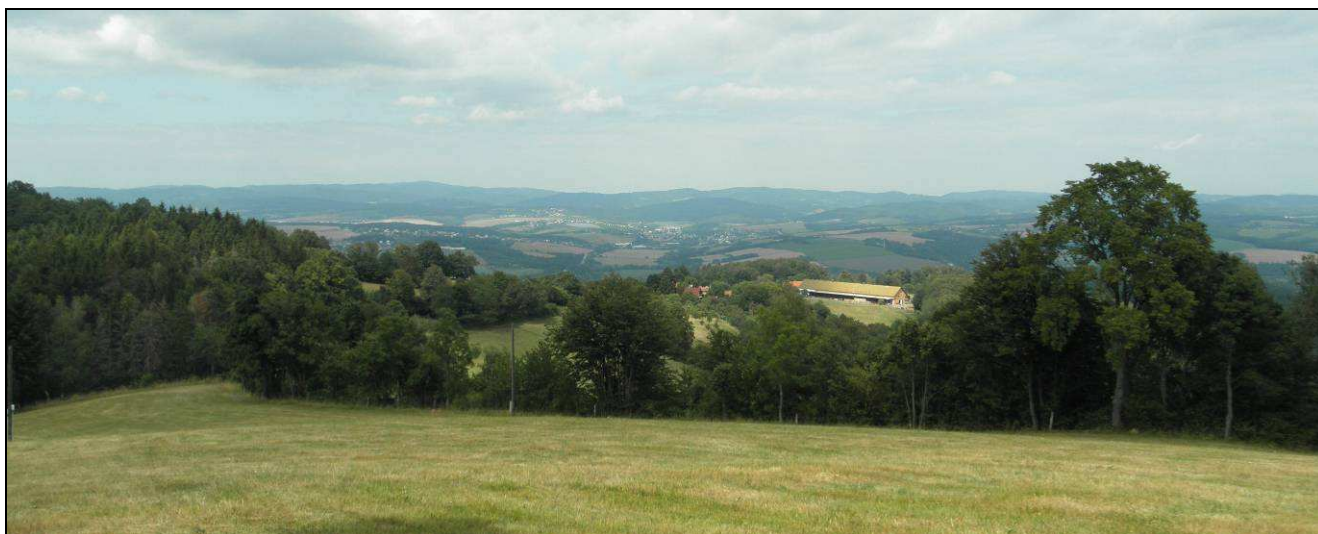
Dálkový výhled z vrcholu Drdolu na S údolím Dřevnice na Hostýnsko-vsetínskou hornatinu