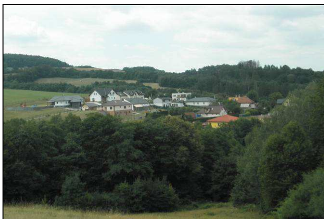
Dva pohledy na novodobou plošnou zástavbu příměstského typu, navíc v pohledově exponovaných polohách, negující urbanistickou strukturu sídla i jeho obraz - vlevo od Z lokalita Na potůčkách, vpravo od SV lokalita Malé levé