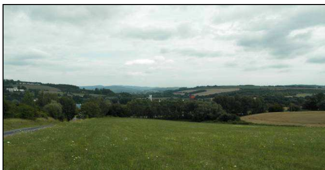
Dva pohledy od J na dosud nedotčenou lokalitu Kráčíny nevhodně určenou ke komerční zástavbě - vlevo z nadhledu ze zpevněné plochy v lokalitě Kuse ve směru údolí Dřevnice, vpravo z luk zahrnutých do samotné zastavitelné plochy