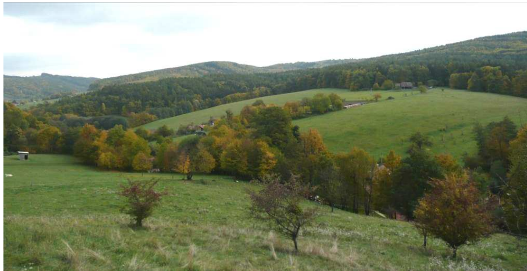
Pohled od severozápadu na východní část údolí Láze nad stejnojmennou enklávou rámovanou lesnatými hřbety Zlínského lesa. Rozptýlená zeleň obsadila neobhospodařovatelné pozemky svažující se k potoku a stala výrazným krajinným prvkem.

Údolí potoka Láze patří mezi nejhodnotnější partie řešeného území, kde se nejlépe dochovala krajinná struktura rozptýleného osídlení. Zvláště v enklávách s členitějším reliéfem je dodnes patrné historické členění úsekové plužiny, neboť zde zemědělská kolektivizace nedokázala docílit plošného zcelení pozemků, tak jako v zemědělsky příhodnějších polohách. Hrany původních pozemků jsou často zvýrazněny rozptýlenou zelení a místy se na nich dochovaly i ovocné stromy. V minulosti byla velká část zemědělské půdy zorněna a ovocné stromy rozptýleny volně v obdělávané plužině. Dnes je téměř bezzbytku zatravněna a pozůstatky výsadby ovocných dřevin připomínají staré sady.