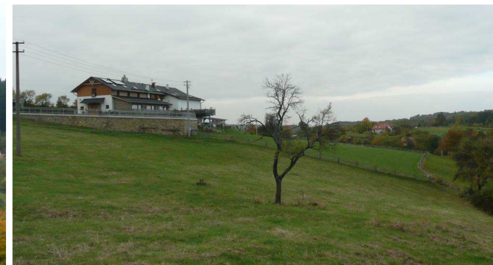
V podstatě novostavba penzionu Na Pinduli na místě staré hospody. Zvýšení o patro a zejména nasazení objektu na mohutné opěrné zdi z něj udělaly další zbytečnou dominantu údolí.