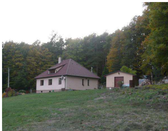
Později přestavovaný, poválečný dům na zcela novém místě nad Pasekami s téměř čtvercovým půdorysem a stanovou střechou. Kvůli exponovanosti a absenci vzrostlých dřevin se jeho netradiční vzhled nemálo pohledově uplatňuje.