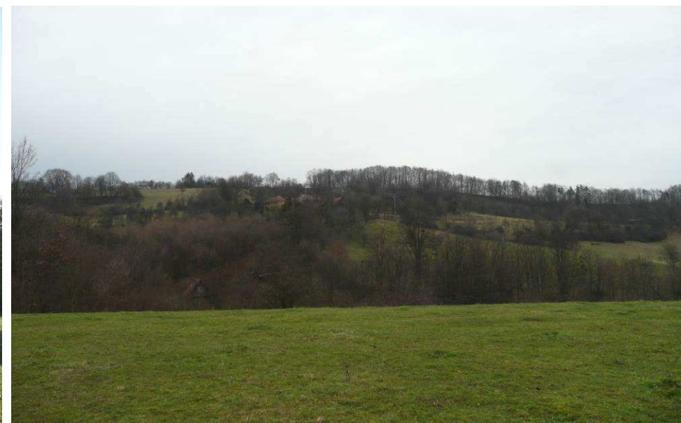
Rozsáhlejší usedlost na jižním svahu nad Lázemi se ztrácí ve stromoví, i když je bez listí.