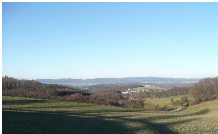
Okraj řešeného území směrem k Jaroslavicím.