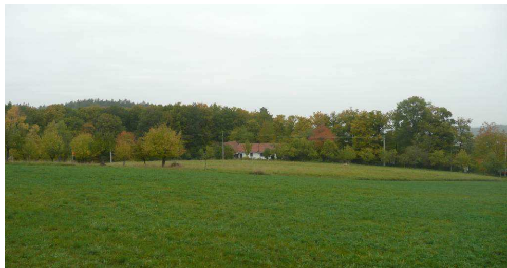
Dochovaná usedlost na Švambovcích je téměř zcela obklopena dřevinami.

U rozptýlené zástavby se kvůli vzájemným prostorovým odstupům pohledově uplatňuje téměř každá stavba. Proto je pro vzhled krajiny zásadní, jak jsou do ní jednotlivé stavby umístěny - zasazeny do terénu i do krajinné zeleně. Vzhledem k omezeným technickým možnostem, náročnosti a malé smysluplnosti byly v minulosti terénní práce u zakládání staveb, co nejmenší. Výsledkem bylo citlivé zapojení objektu do terénu dle daných podmínek.