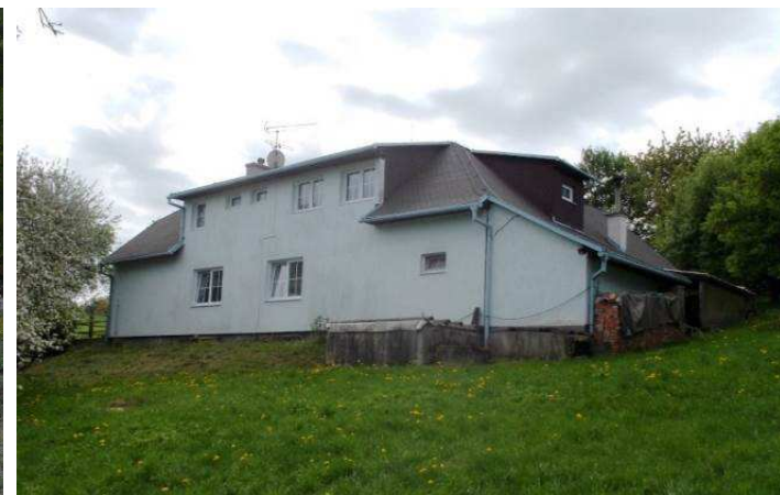
Kompletní přestavba na Švambovcích s nesourodým tvaroslovím a objemově rozříštěným řešením. Na opačné straně je navíc vystavěno značně rozměrné, otevřené garážované stání, které se více pohledově uplatňuje než samotné stavení.