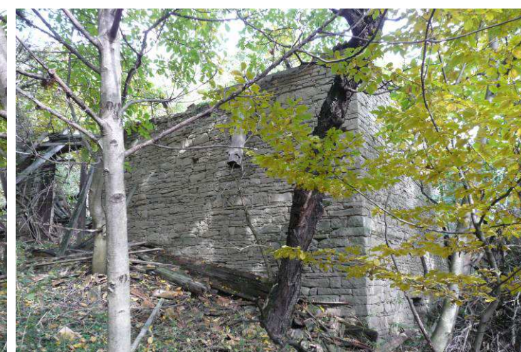
Rozsáhlá zchátralá usedlost nad Lázemi. Zřejmě až nedávno vyrabovaná sušárna ovoce (vlevo) a menší patrový objekt (uprostřed) ještě stojí a jistě by zasluhovaly pro svou vypovídající hodnotu zachovat. Alespoň nejnutnější opravy je však nutné provést, co nejdříve. Jinak dopadnou jako hlavní obytná a hospodářská část, která je již jen ruinami.