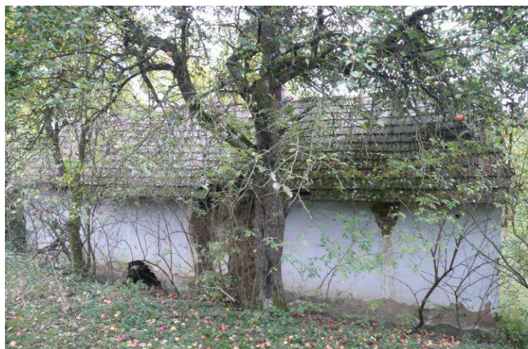
Značně chátrající menší stavení ve svahu bezprostředně pod novodobou rezidencí na Lebavinách již zřejmě zachránit nepůjde.