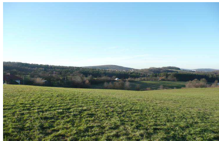
Pohled přes místní část Uhliska na Lysou.