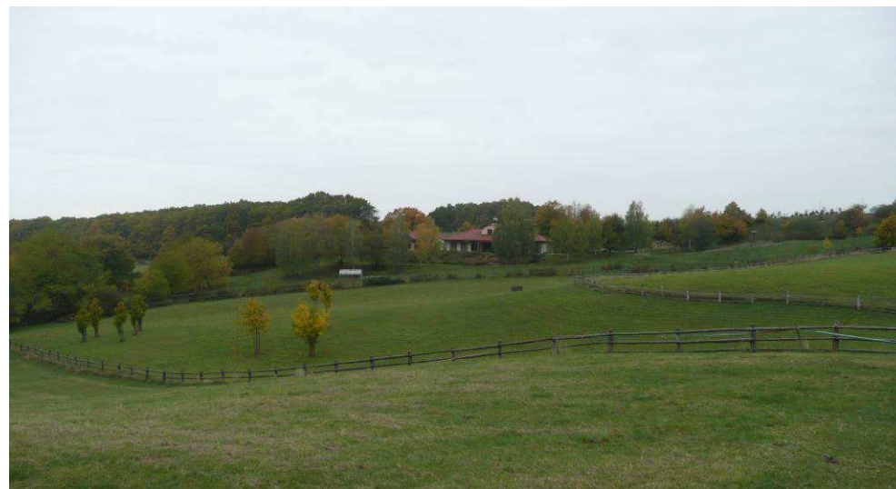
Velmi rozsáhlá stavba novodobé rezidence na Skalce se kvůli svému měřítku a řešení může do krajiny zapojit jen velmi těžko, a to i přes clonící vzrostlou zeleň a usazení pod cestou.