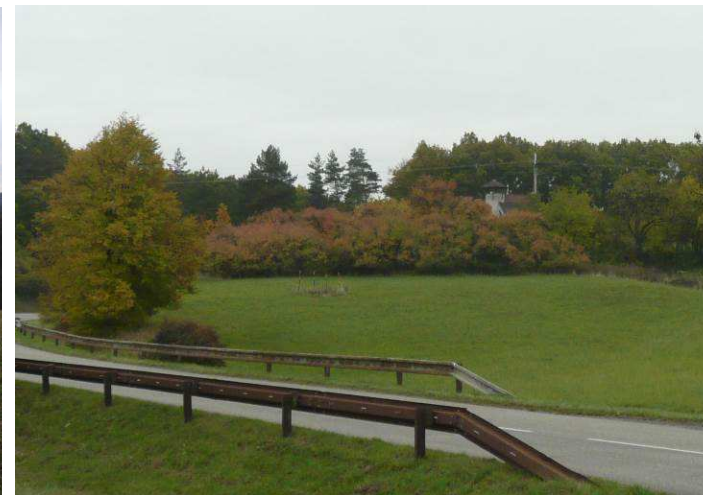
Soukromá vyhlídková věžička situovaná na exponovaném temenu, jež je součástí krajinného ohraničení, ovlivňuje i přes svou malou velikost vnímání veřejného prostoru - krajiny.