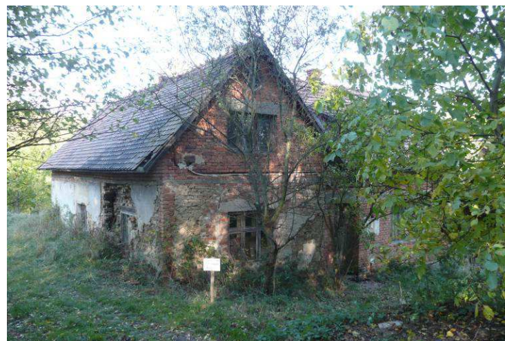
Chátrající usedlost na dolním konci Hulajek je snad ještě možné částečně opravit.