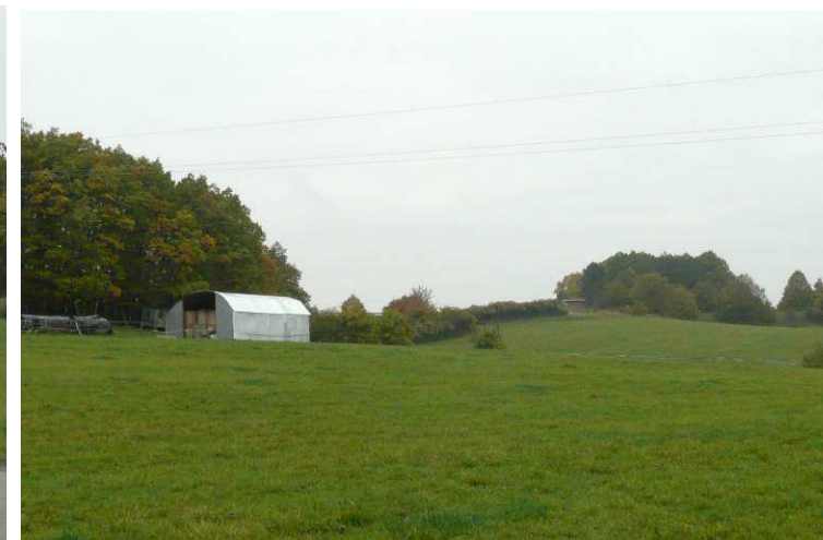
Přes svoje funkční opodstatnění a spojení s obhospodařovanou krajinou se i nevhodně umístěný a zejména ztvárněný seník může stát nechtěnou lokální dominantou.