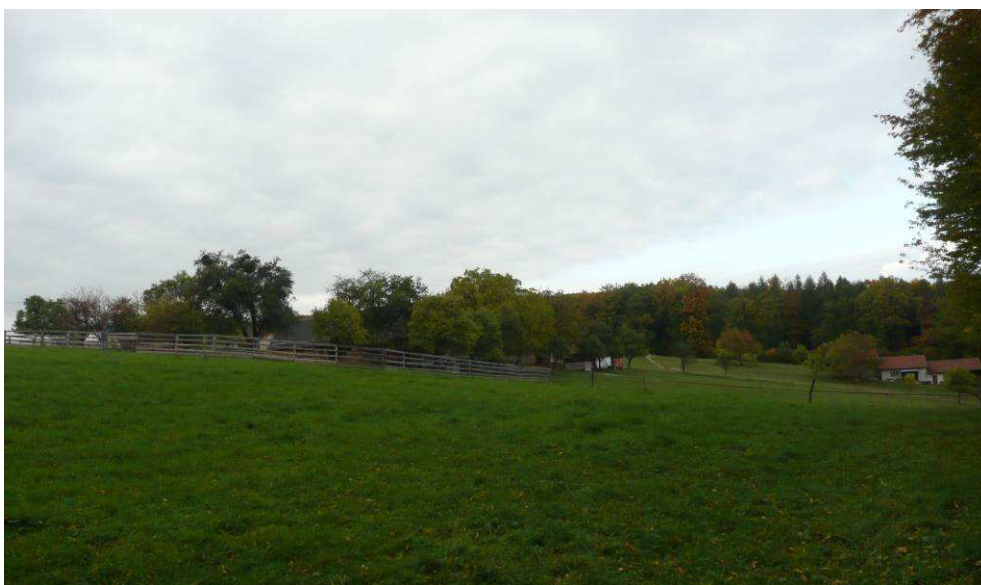
Vzrostlá zeleň téměř zcela skrývá nepříliš zdařilou přestavbu usedlosti na farmu na Nových Pasekách. Vpravo je lépe viditelná dochovaná usedlost.