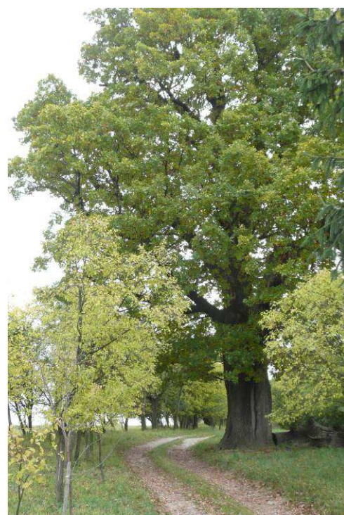
Památný dub na Pinduli u polní cesty.