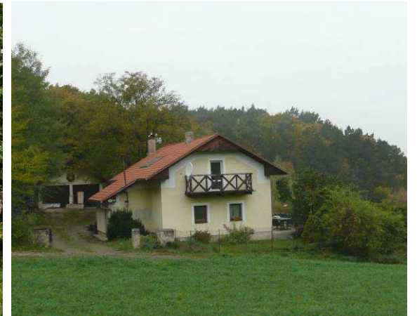
Kompletní přestavba na Švambovcích se zvýšenou a přetaženou střechou mírného sklonu, s bedněním krokvi a balkonem ve štítech. Tyto stavební prvky tradiční venkovské stavby postrádaly.