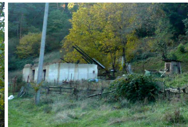
Vyhořelý dům v údolí Milenova, který zřejmě čeká na kompletní rekonstrukce.