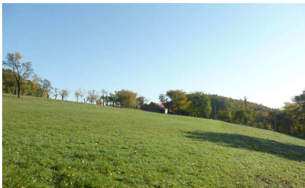
Usedlost na jižním svahu Lysé je zasazena do svahu pod cestou.