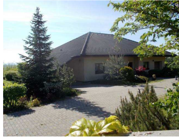
Dva příklady novostaveb bungalového typu, jež jsou pro místní krajinu zcela atypické a vycházejí ze stavitelství městských satelitů. Snížená, valbová až stanová střecha zcela promění proporce i dispoziční řešení. Objekt vlevo navíc obsadil velmi pohledově exponovaný hřbet na Nových Pasekách. Nedávná novostavba vpravo zase stojí na místě historického budovy, již zcela popírá. Výsledkem je hned dvojnásobné narušení rázovitosti krajiny - ztráta další historické stavby a její náhrada nevhodným objektem.