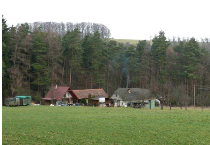
Menší novostavba na Uhliskách v prostorové návaznosti na historickou usedlost. Přestože užívá i nevhodné stavební prvky (přetažená střecha s pavlačí), svou velikostí a jednoduchých tvarem není v krajině výrazně rušivým elementem.