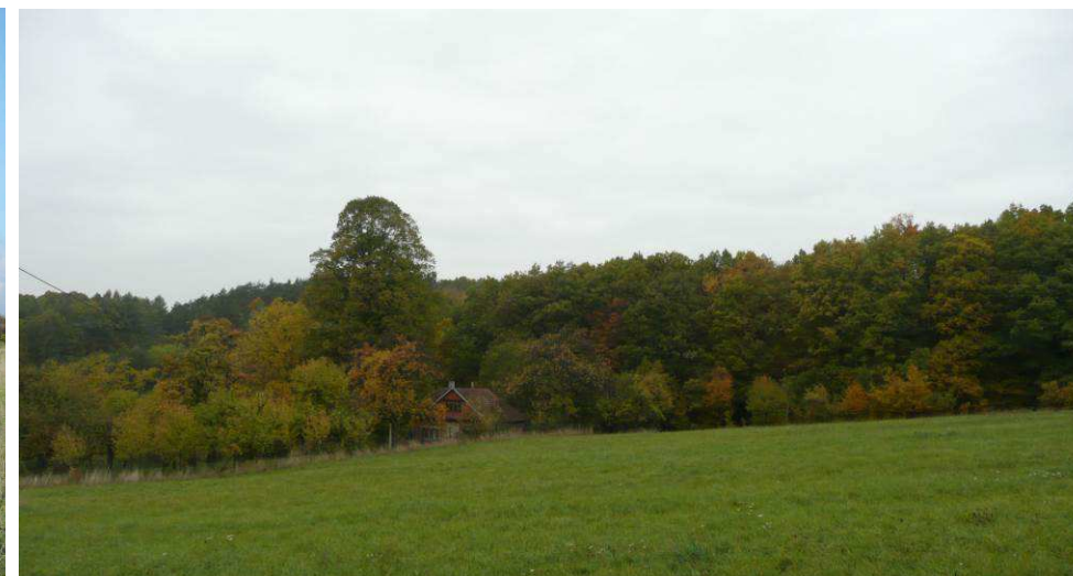
Po válce přestavěná usedlost na Filíkových Pasekách, stále však obklopena stromy.