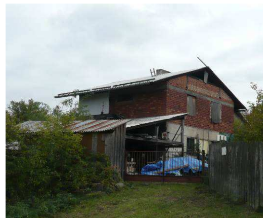
Jeden ze starších, dvoupatrových domů na Pinduli, které volně vycházejí z tvarosloví alpských domů, které je pro místní krajinu zcela cizorodé.