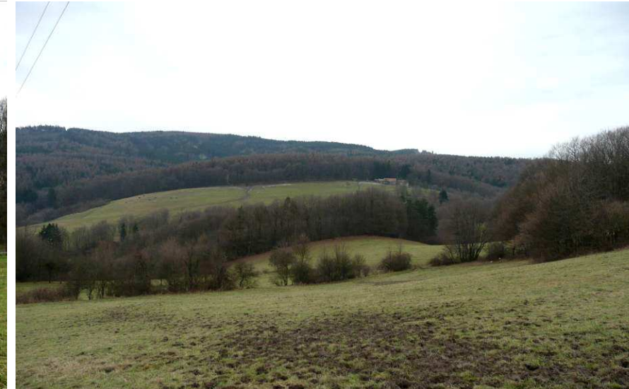
Střední část údolí Láze od severu, kde jsou stále patrné hrany zemědělských pozemků, dnes zvýrazněné vzrostlými dřevinami.