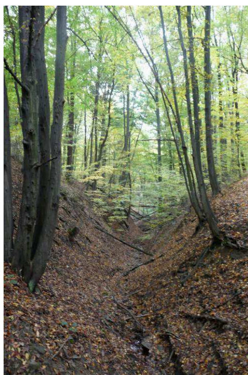
Většinou listnaté lesy zaujímají kamenitá temena i strmě se zařezávající vodoteče.