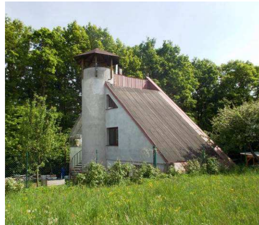
Značně atypický chatový objekt s vyhlídkovou věžičkou u silnice mezi Pindulí a Kudlovem nemá s venkovskou architekturou pranic společného. Navíc je situován v exponované části na temeni, jež je součástí krajinného ohraničení.