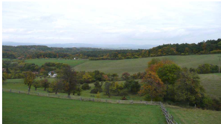
Pohled směrem na východ přes údolí Láze, v popředí pastvina se vzrostlými dřevinami, převážně ovocnými.