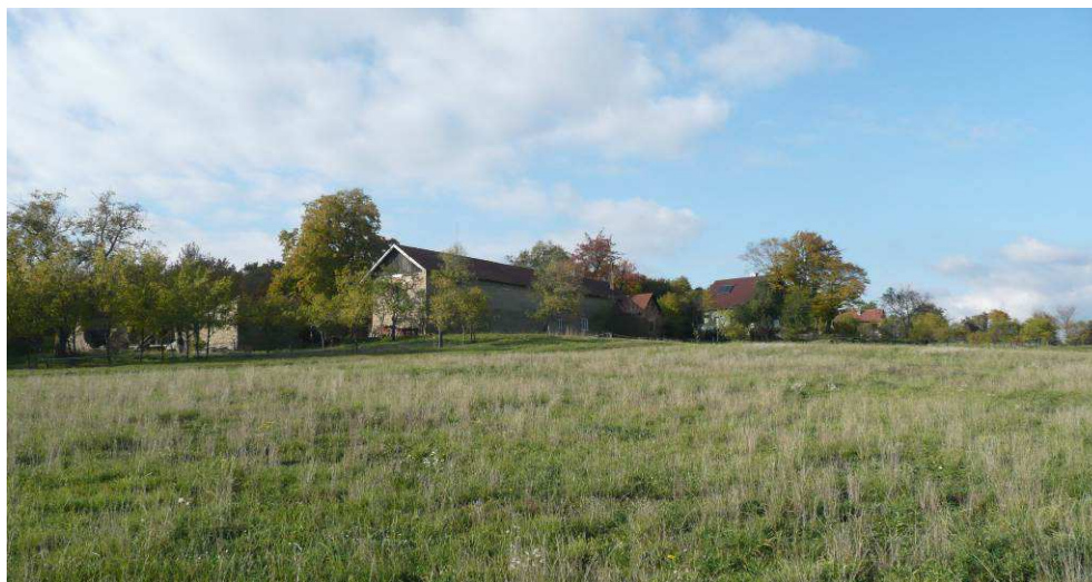
I rozsáhlou, historickou usedlost na Podhoří částečně pohledově kryjí vzrostlé stromy.