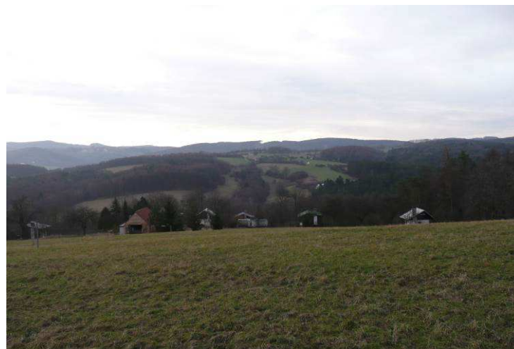
Jižní svahy Lysé směrem na Uhliska - i relativně malé objekty se mohou výrazně pohledově uplatňovat, jsou-li na exponovaném místě, v tomto případě na krajinné vedutě.