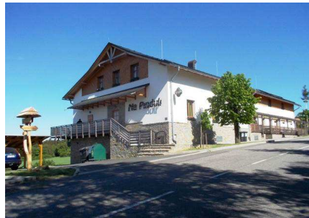
Patrová novostavba penzionu Na Pinduli z původního stavení vychází jen velmi málo. Svým řešením a vzhledem se podobá kapacitním rekreačním objektům v horských oblastech, a proto se stěží může stát součástí okolní krajiny menšího měřítka.