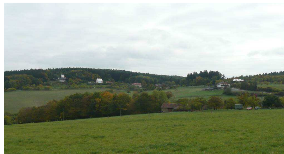
Z širokého okolí pohledově nejvýraznější stavby na Pinduli: zleva chátrající rekreační komplex, patrový dům s bílou střechou, nový penzion Na Pinduli a za ním ploché, světlé střechy dvoupatrových domů.