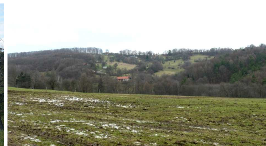
Svahy Jaroslavických Pasek a Podhoří z protilehlé strany údolí. I bez listů je většina staveb podhledově cloněna vzrostlými dřevinami.