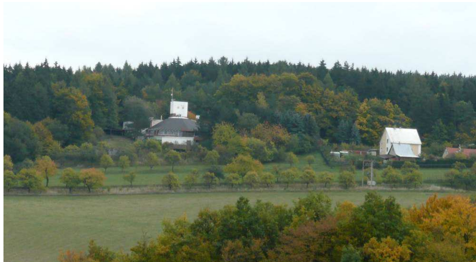
Z okraje lesního porostu na Pinduli vyčnívá svým měřítkem i ztvárněním zcela neadekvátní rekreační objekt, vpravo od něj pohled upoutá zase dvoupatrový dům s bílou střechou.