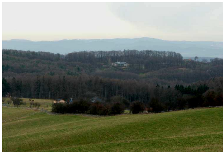
Umístění novostavby rezidence na Lebvínách z ní udělalo pohledově exponovanou stavbu viditelnou z většiny údolí Láze. Svým vzhledem proto ovlivňuje a pozměňuje vnímání celé okolní krajiny.