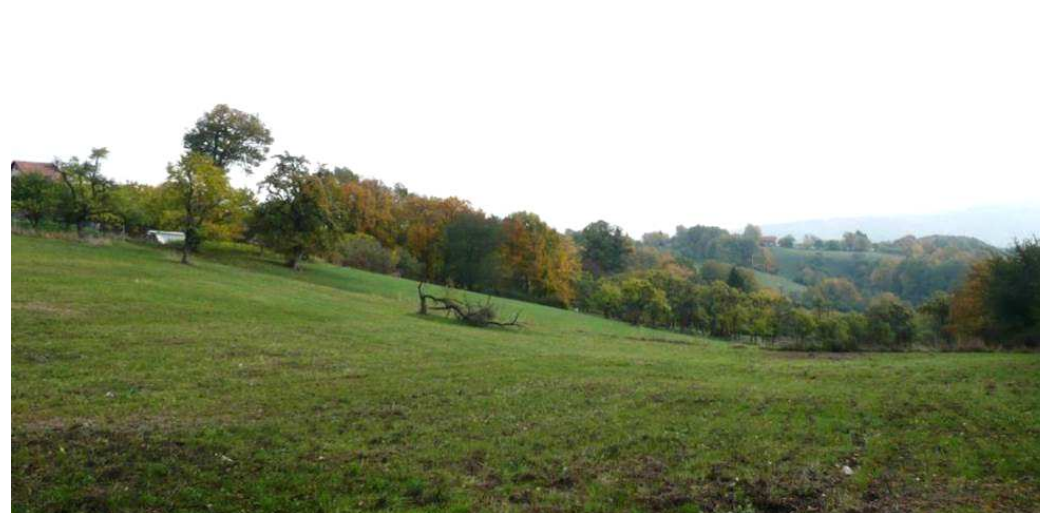
Pohled do bočního údolí Láze na svahy pod enklávou Podhoří, kde se stále nachází poměrně hodně ovocných stromů roztroušených v plužině. Velká část z nich je však přestálá a postupně dožívá.