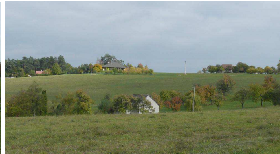
Novostavba bungalového typu na pohledově exponovaném hřbetu na Nových Pasekách. I přes zeleň vyčnívá netradiční tvar střechy, která je kvůli své poloze viditelná z celého širokého okolí.