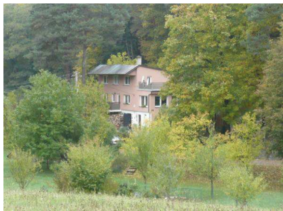
Nesourodá stavba na Filíkových Pasekách zřejmě vznikla několika přestavbami. Výsledkem je dvoupatrový objekt podobající se menší bytovce s asymetrickou střechou a balkony.