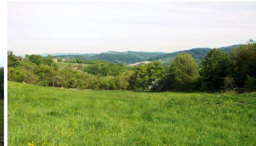
Jihovýchodní pohled ze svahu Jaroslavických Pasek přes údolí Láze a Obůrku na lesnaté svahy Vizovických vrchů, které od jihu výrazně rámuji celé řešené území.