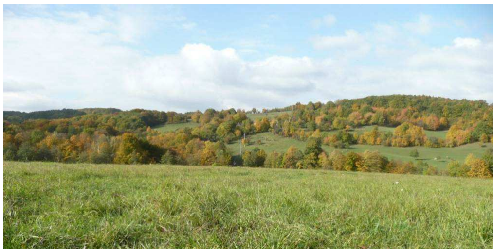
Jižní svahy údolí Láze z protilehlé strany, na nichž je dobře patrné členění pozemků rozptýlenou zelení, temena pokrývají menší, vesměs listnaté lesní porosty.