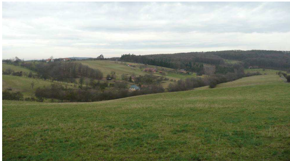
Jihovýchodní pohled na východní svahy údolí s usedlostmi, obklopenými ovocnými dřevinami a rozptýlenou zelení.

Počátek údolí Láze s enklávou Nové Paseky, kde se rozptýlené osídlení poměrně dobře dochovalo. Zatímco ve východní polovině údolí byla struktura zemědělských pozemků scelením téměř zcela setřena, druhá polovina s usedlostmi si její členění i charakter částečně zachoval dodnes, včetně roztroušených ovocných stromů. Ve značném kontrastu s dochovanou krajinou je však nesourodá, rozrůstající se zástavba na Pinduli a v nedaleké chatové osadě.