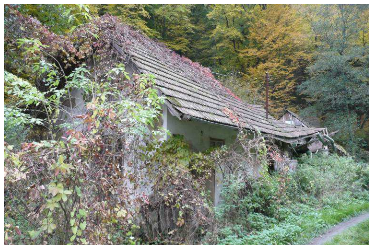
Zbořeníště menší usedlosti v údolí Láze u potoka. Hned naproti se nachází několik starších chatových objektů.