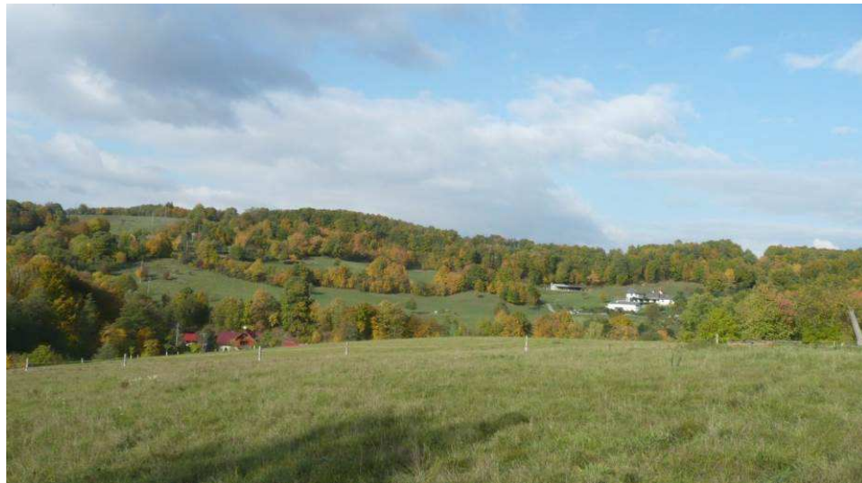
Dvě současné novostavby se staly v údolí Láze novými dominantami, přestože vznikly na místě původních stavení. Zejména bílá, manýristická stavba farmy změnila vnímání celého svého okolí.

Způsobů, jak novostavbou či kompletní rekonstrukcí v krajině vytvořit neadekvátní dominantu, která nerespektuje její charakter, je celá řada. Nejčastější je nevhodná lokace objektu a usazení v terénu, dále nepřiměřený objem stavby, výrazně atypické ztvárnění či řešení obvodového pláště a nepřítomnost či likvidace vzrostlých dřevin v bezprostředním okolí. Problémem takovýchto staveb je především narušení přítomných krajinných charakteristik a hodnot území, které se projeví změnou celého krajinného obrazu. Zvláště to platí právě pro enklávy s rozptýleným osídlením, kde se většina objektů pohledově uplatňuje.