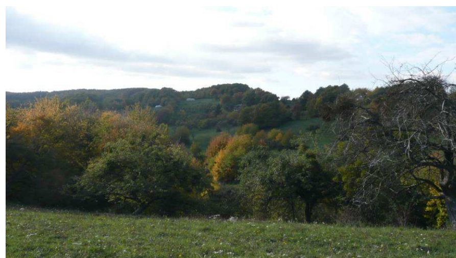
Podobný pohled ovšem z nižší polohy mezi starými ovocnými stromy, bez náhrady dožívajícími.