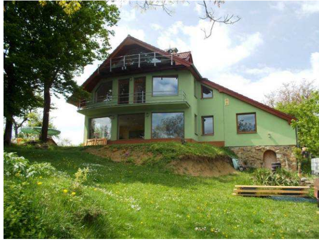
Patrová novostavba na Podhoří zcela ignoruje svoje okolí - asymetrická, jednostranně přetažená střecha s trojúhelníkovým vikýřem, prosklený štít se dvěma balkóny, vyvýšená na navážce navíc na pohledově exponovaném místě.

Řada usedlostí byla kompletně přestavěna, jedná se spíše o novostavby na místě původních stavení, některé objekty vznikly i na zcela nových lokalitách. Značná část staveb pochází až z porevolučního období a vůbec nerespektuje typické znaky místních venkovských usedlostí. Často naopak vnáší do krajiny nové, přenesené architektonické prvky. Některé z objektů zcela ignorují i nezákladnější zásady pro výstavbu ve venkovském prostředí, často se v krajině pasekářského osídlení stanou pohledově dominantní a negativně ovlivňují celý její obraz.