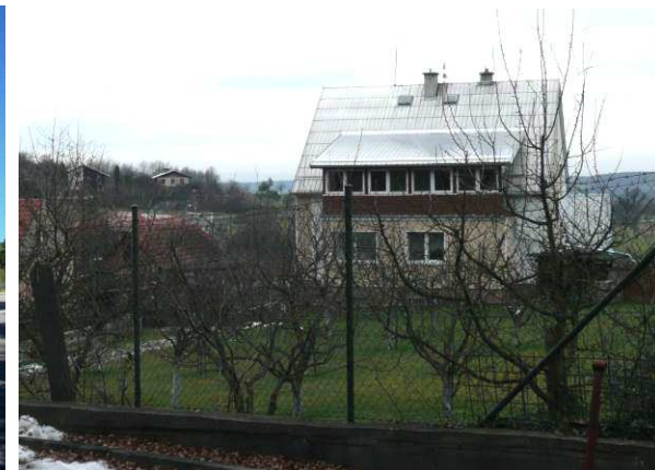
Starší novostavba na Pinduli se stala lokální dominantou kvůli výšce a zejména sklonitější, z daleka viditelné, světlé plechové střechě. V dálce vlevo od ní dva patrové domy s naopak atypicky mírně sklonitými střechami.