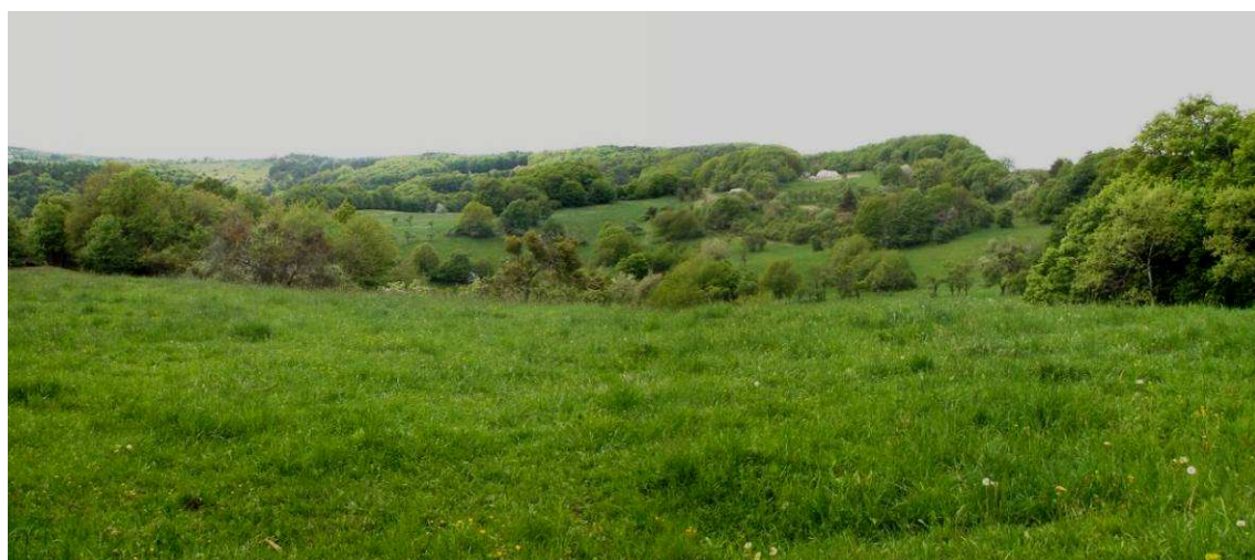
Svahy Jaroslavických Pasek - Podhoří z bočního hřbetu od východu, odkud je dobře patrná krajinná struktura díky poměrně velkému převýšení.