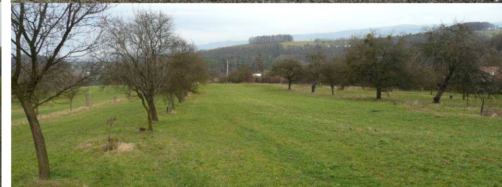
Zachovalé řady ovocných stromů v plužině: nahoře na orné půdě - v minulosti běžné, dnes vzácné (Láze), dole na zatravněných pozemcích (Uhliska), v dálce vystupuje hřbet Lysé s remízem a sadem.