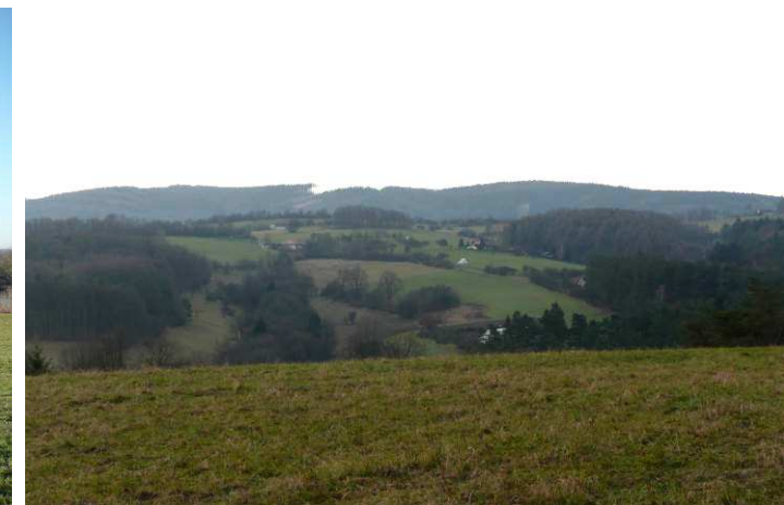
Pohled z hřbetu Lysé na rozptýlené osídlení území Jaroslavičkých pasek.