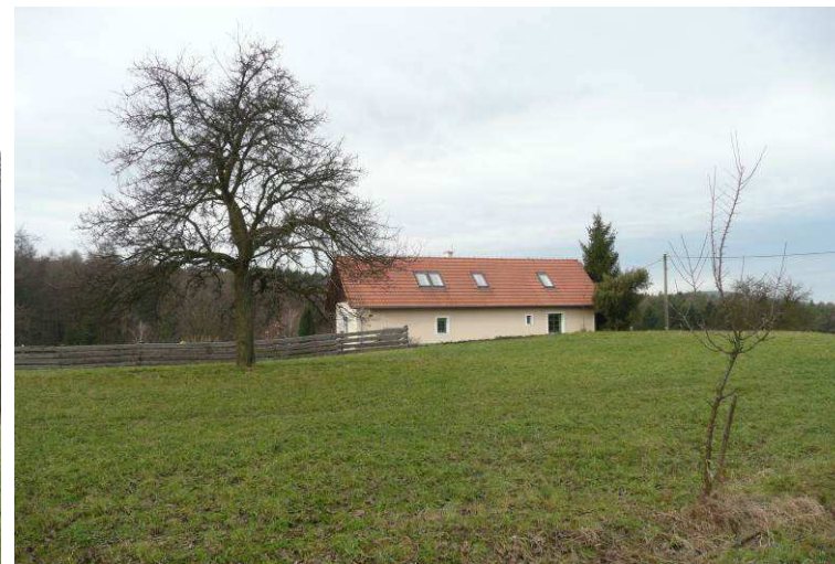
Kompletní rekonstrukce a částečná novostavba na původním půdorysu na Uhliskách. Přestože v části obrácené do dvora užívá i méně vhodné stavební prvky (přetažená střecha větší terasy), do veřejného prostoru, tj. od přístupové komunikace, si zachovala původní vzhled a zasazení do krajiny.