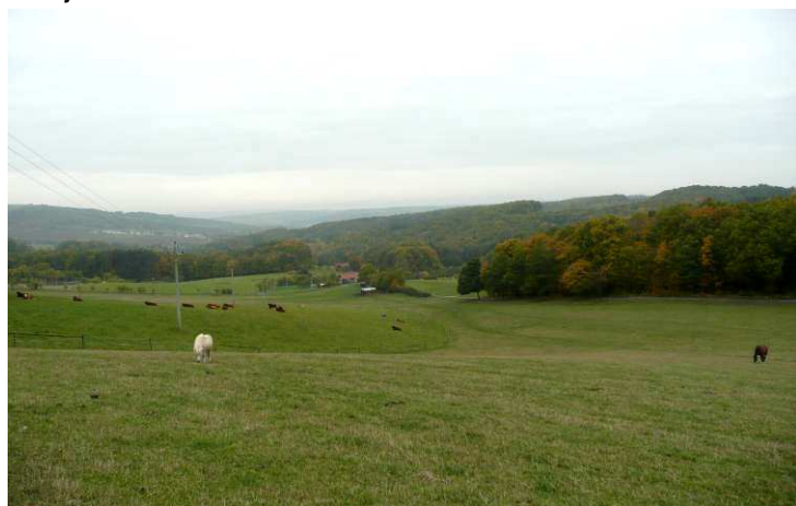
Filíkovy Paseky nad údolím Březnice od východu.