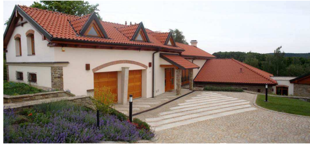
Rozsáhlá novostavba rezidenčního charakteru je směsí řady architektonických prvků, často nesourodých, které z venkovské architektury příliš nevycházejí. Na atypickém půdorysu vzniklý komplex se skládá z rozdílně objemově i materiálově řešených částí. Svým vzhledem okazuje na příměstské suburbie, což platí i pro řešení okolní zahrady a oplocením k ulici (zděný plot s podezdívkou a kovanými výplněmi).