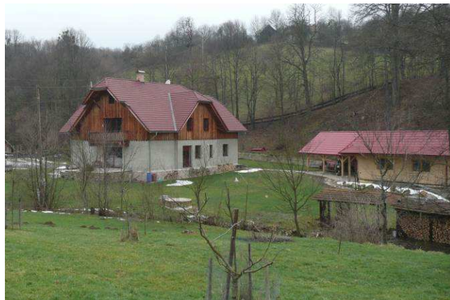
Novostavba v nivě Láze sice volně vychází z prvků venkovských staveb, ovšem pracuje s nimi značně svévolně. Na složitějším půdorysu vznikl i objemově členitý a vyvýšený objekt s přetaženou střechou s polovalbičkami, falešným bočním štítem a balkonem.