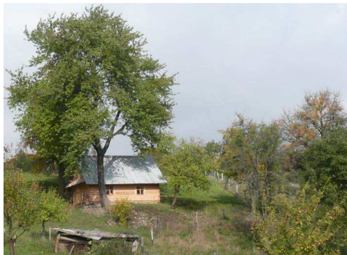
Roubená, drobná novostavba doslovně citující nejstarší dřevěné stavby, které se již prakticky nedochovaly. Nebýt okenních otvorů odpovídala by svou velikostí spíše menším hospodářským objektům.

Nostaveb, které vhodně respektují a navazují na typické znaky venkovských usedlostí rozptýleného osídlení je v řešeném území Jaroslavických pasek velmi málo.