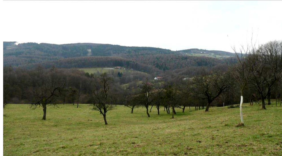
Střední část údolí Láze od severu, kde se dodnes dochovaly výsadby ovocných stromů.