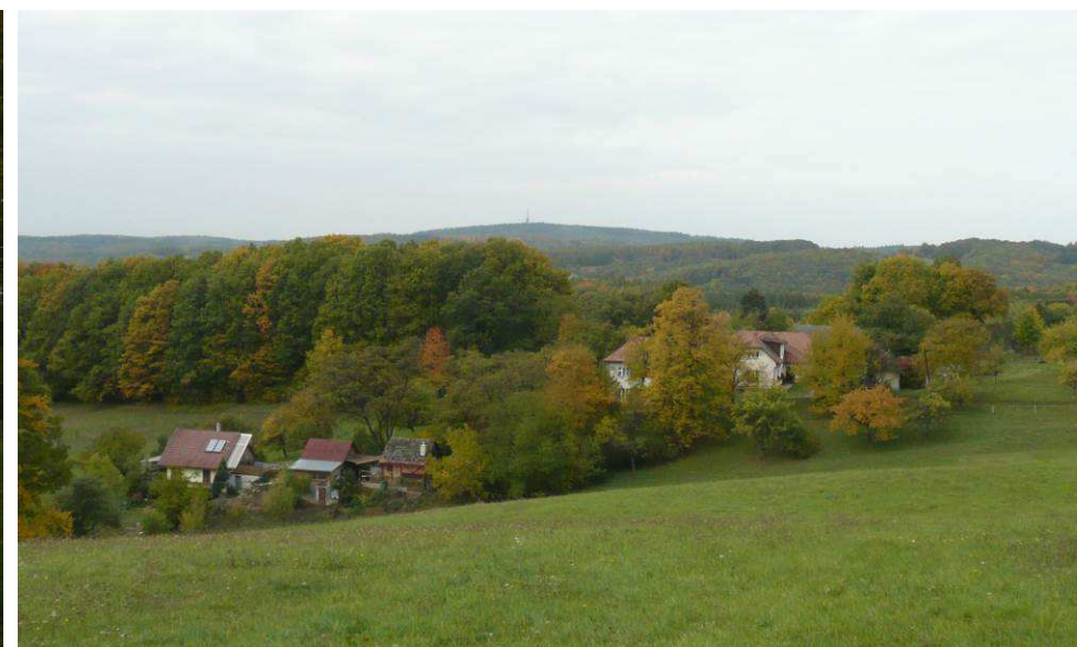
Původní usedlost je obklopena vzrostlými stromy, které ji částečně kryjí, i když byla přestavěna na patrovou. To však již zcela neplatí pro trojici chat na místě zbouraného, vedlejšího stavení.