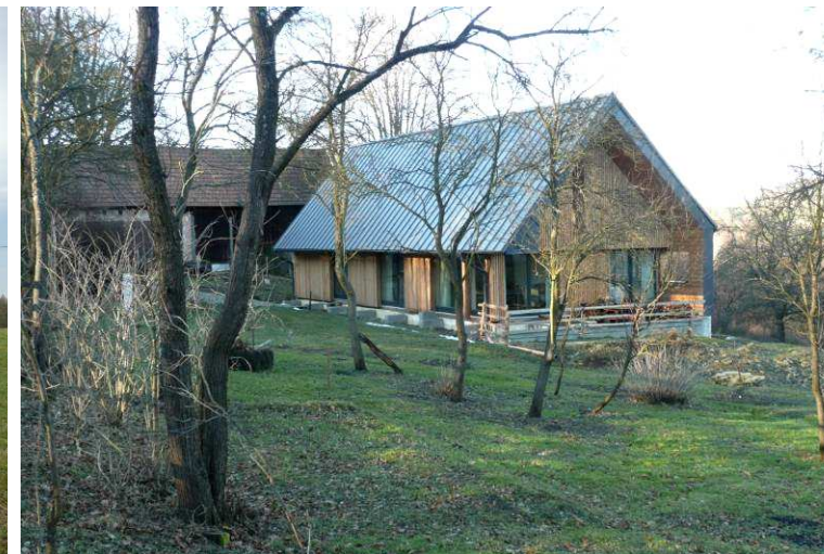
Novostavba na místě původní usedlosti na Vavruškách již za hranici řešeného území. Přestože některé typické architektonické detaily interpretuje dosti volně (stavební otvory, lehce asymetrická střecha a její výrazné přetažení přes štít), zásadní znaky venkovské architektury respektuje (obdélný protažený půdorys, sedlová střecha běžného sklonu, zasazení v terénu). Celkovým jednoduchým řešením a relativně prostým vzhledem se snaží o citlivé zasazení do krajiny.

Přestože v řešeném území narůstá tlak na novou zástavbu na nových lokalitách, nachází se v něm nemálo chátrajících objektů nebo vyložených zbořeníšť.