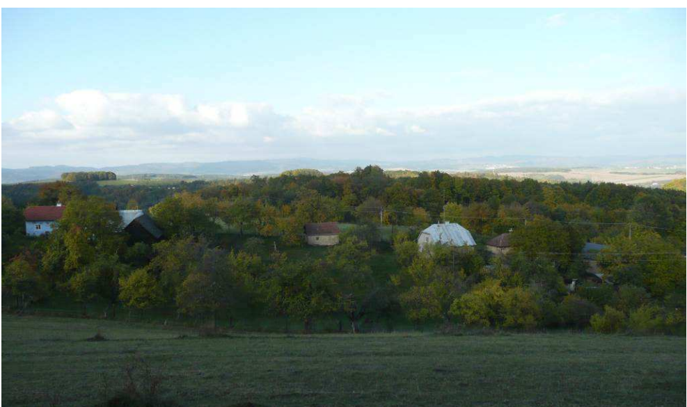
Vzrostlé ovocné stromy obklopují skupinu usedlostí zasazených do svahu na Hulajkách. Téměř odnikud nejsou viditelné všechny naráz a i jednotlivá stavení je vidět jen zčásti.