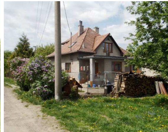
Patrová stavba z druhé poloviny 20. století na Podhoří na historicky nezastavěném místě. Zejména čtvercový půdorys, stanová střecha a falešné štíty odkazují na městské stavby vilkového typu.