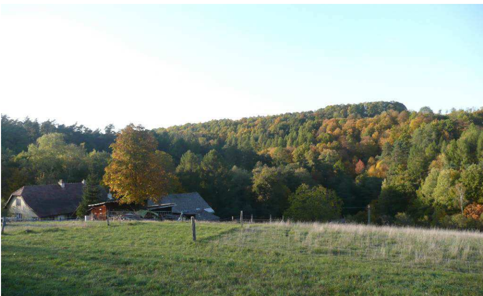
Usedlost na Uhliskách nad údolím Milenova je zasazena do svahu pod oblým hřbetem.