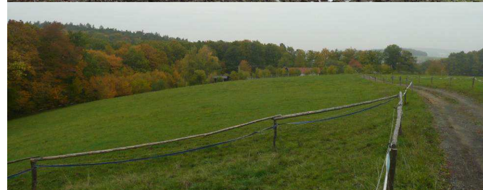
Nemalá část travních porostů je dnes využívána k pastvě, zpravidla extenzivní.