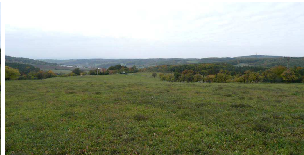
Pohled směrem na západ do údolí Březnice z plochého, nedávno ještě zorněného hřbetu, jenž tvoří rozmezí oblastí krajinného rázu. Chatová osada je pohledově skryta za hranou údolí.