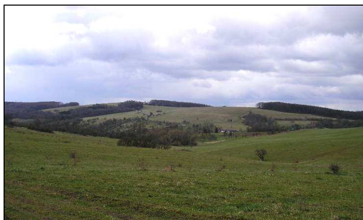
Vlevo pohled od JV na zástavbu v údolí v prostoru historické návsi, kde se dochovalo i hodnotné historické členění navazujících záhumenic stoupajících do svahu za jednotlivými usedlostmi, vpravo stejné záhumenice na východní svahu údolí při pohledu od S (zástavba je pohledově skryta).