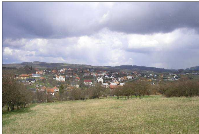
Dva pohledy od JZ na převážně novodobější část sídla na západním svahu údolí– vlevo z plochého temena Doubí v ose sníženiny směrem na Březůvky (u obou vsí obsadila mladší zástavba pohledově exponované polohy), vpravo bližší pohled na stejnou lokalitu z dochovaných záhumenic.