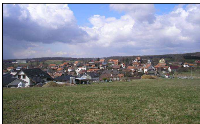
Vlevo pohled od Z na novodobou zástavbu plošného charakteru na protilehlém svahu údolí, vpravo pohled z tohoto svahu přes JV okraj nejmladší zástavby na svah zastavěný až téměř po temeno.