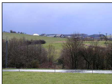
Soudobé novostavby rozsáhlé rozvojové plochy na západním svahu na JV sídla – vlevo nejvýše položená slepá ulice s konvenčními stavbami příměstského typu, uprostřed o něco starší stavby pod nimi, vpravo pohled na východní okraj zástavby, která převýšila ohraničení mírného sedla.