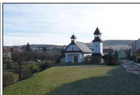
Vlevo novodobá ulice z dob socialismu, uprostřed dominantní objekt zemědělsko-výrobního areálu nad SZ okrajem vsi, vpravo novodobá kaple sv. Vojtěcha z počátku 21. století v prostoru historické návsi.