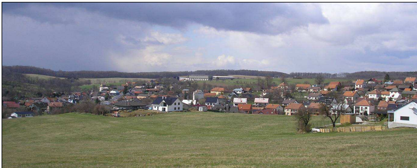
Při pohledu ze svahu od JV lze dobře odlišit charakterově odlišné části sídla – vlevo v údolí zástavba v prostoru historické návěsí vsi, vpravo převážně novodobá zástavba vystupující na pohledově exponovaný svah, uprostřed v dálce vizuálně dominantní objekt zemědělsko-výrobního areálu.