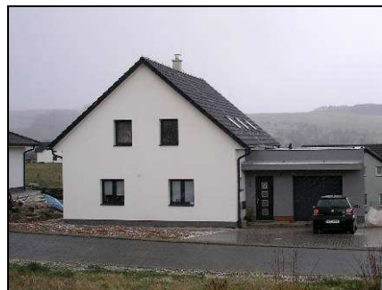
Vlevo historická zástavba podél cesty na Březůvky, uprostřed a vpravo příklady novostaveb rámcově respektujících venkovský charakter zástavby.