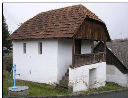
Jedny z mála dochovaných historicky cenných, zděných staveb, které si velmi dobře uchovaly znaky místního venkovského stavitelství.