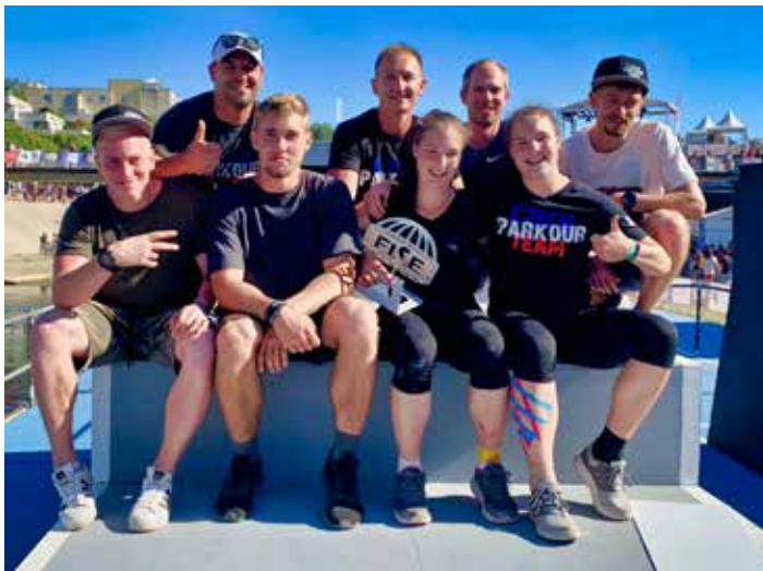
Týmové foto ze světového poháru v Montpellier (Francie).