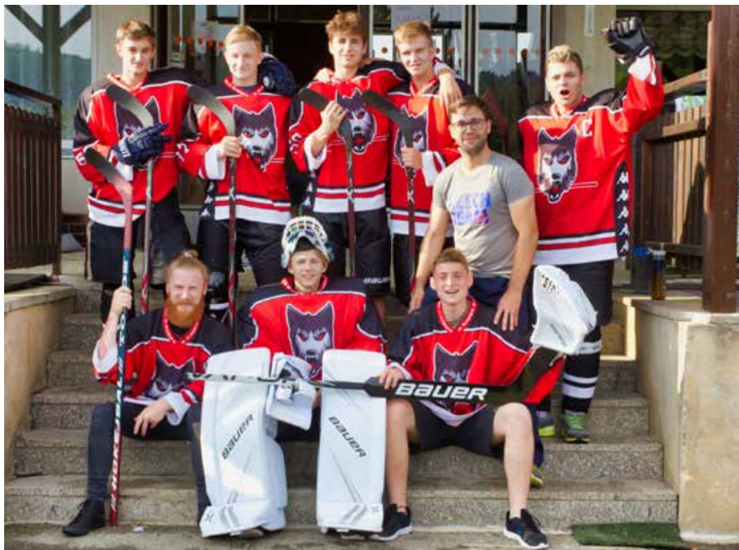
Tématem filmu je i šikana ve sportovním prostředí.

„Podle výzkumů se téměř každé páté dítě stává obětí šikany. O šikaně se obvykle hovoří pouze v souvislosti se školstvím. Ze své zkušenosti však vím, že mládežnické sportovní kolektivy jsou jí plné, a často je mnohem brutálnější než šikana na školách,“ vysvětluje Tomáš Polenský a dodává, že hlavní linie filmu sleduje příběh šestnáctiletého hokejového brankáře Davida, který nastupuje do nového hokejového týmu,