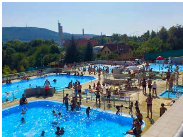
Mezi vyhledávaná sportovní zařízení patří i zlínská koupaliště.

Zapůjčení disků a bodovacích kartiček je možné v cykloprodejně ForRide pod II. segmentem. V podobném odpočinkovém duchu se dá hrát s celou rodinou i petang. Ve Zlíně jsou k této hře tři hřiště, z nichž poslední vzniklo nedávno ve čtvrti na Majáku. V této části Zlína je navíc v plánu i vybudová-