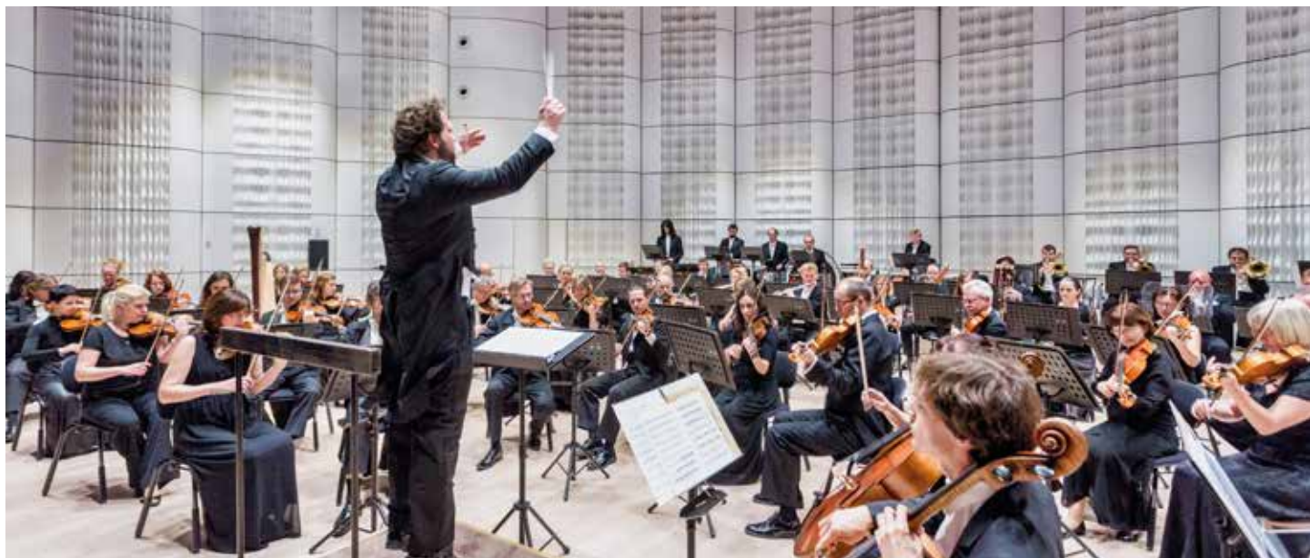
Při zkoušce orchestru.