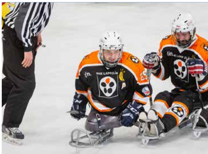
Hráči SHK Lapp Zlín.

Na devátý ročník sledge hokejového turnaje LAPP Cup Zlín 2019 se do Zlína sjedou týmy z pěti evropských zemí. Domácí tým Zlína doplní švédské Malmö,