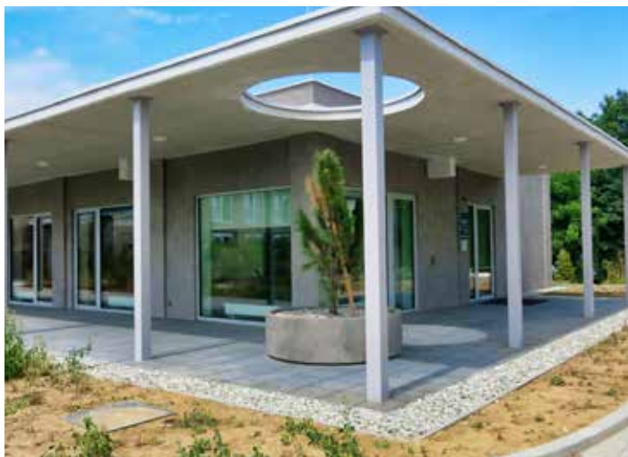
Budova je postavena přímo „na míru“ seniorům.

Náklady na realizaci stavby včetně úpravy venkovních prostor a vybudování hřiště na petanque a kuželky jsou 17,5 milionu Kč bez DPH. [io]