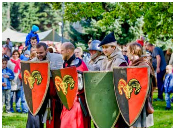
Živý Zlín vždy přichází s atraktivním programem.

Zážitková středověká akce představí někdejší řemesla – bednáře, krejčího, zpracování vlny, kováře, ranhojiče, písařku. Těšte se na ukázky soubojů, historické přednášky, středověké hry, mletí mouky, pečení placek či výrobu svíček. Díky sdružení Čeládka řemeslná se na akci chystá také středověká kuchyně. [žž]