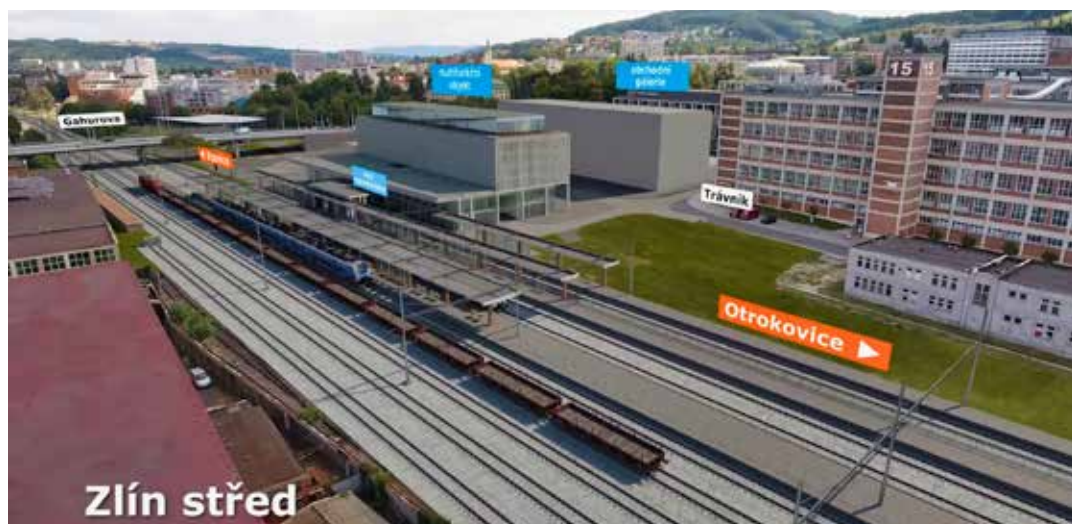
Podoba nového dopravního terminálu propojujícího vlakovou, autobusovou a MHD dopravu.

strany Správy železničních a dopravních cest (SŽDC), a to s ohledem na bezpečnost. Dopravní přestavby se dotknou také části Podvesná. Zde má