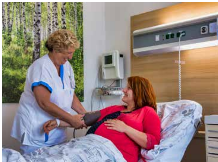
Lůžka prošla rekonstrukcí.

Oddělení rizikového a patologického těhotenství a šestinedělí se nachází v pátém patře budovy číslo 31 v areálu nemocnice. Pro klientky jsou zde vybudovány a moderně vybaveny jak dvoulůžkové pokoje, tak pokoje jednolůžkové s charakteristikou