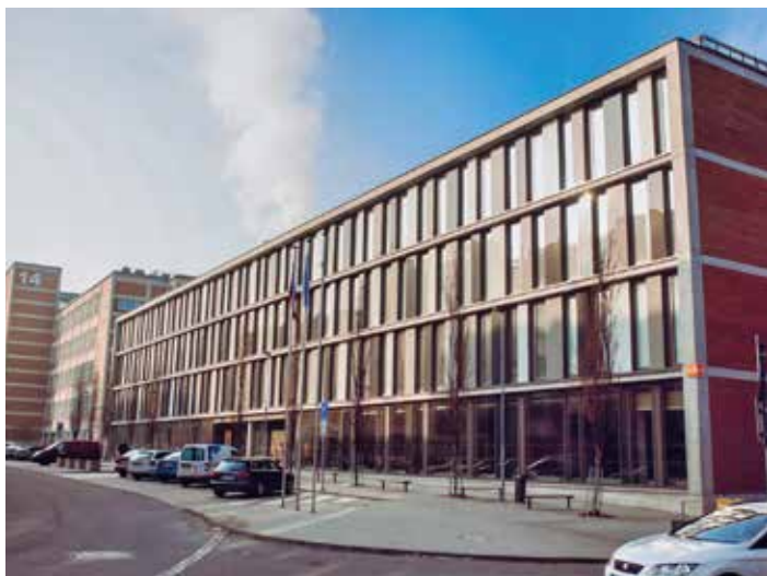
Moderní prostory fakulty. / foto: UTB