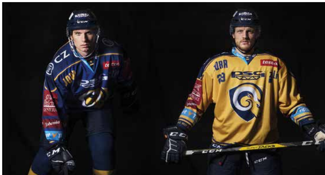
Nové dresy hokejistů na sezonu 2019/2020.