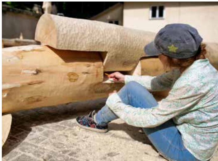
Díla studentů vyzdobí město.