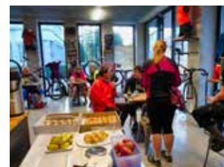
Snídání je zdarma.

Záříjové výzvy se může zúčastnit kdokoli a zdarma, bez účastnického poplatku. Do práce na kole nebo pěšky dojždělo v květnu i několik desítek zaměstnanců magistrátu a přidružených organizací. Více na www.dopracenakole.cz . [dnk]