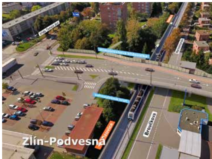
Ve Zlíně na Podvesné vznikne mimoúrovňová křižovátka se zahloubenou tratí.

a dopravních cest (SŽDC) doplnit jednotlivými stavbami, které jsou zásadními body pro dopravu ve Zlíně. „Z mého pohledu má naprostou prioritu tzv. Prštenská příčka. Zde dojde ke zrušení železničního přejezdu v jeho současné podobě a auta mířící do Prštného se budou s vlaky míjet mimoúrovňově. Na tuto křižovátku chceme navázat novou komunikací vedoucí kolem řeky Dřevnice, jejíž součástí bude i most přes Šedesátou ulici směrem do bývalého areálu Svit, čímž zpřístupníme třetí vstup do areálu. V příštím roce představíme hotovou studii celého řešení včetně nových MHD zastávek, pěších tras a lávek pro chodce. Samotná stavba pak započne až po dokončení stavebních částí SŽDC, abychom nenarušili možné objízdné trasy při realizaci elektrifikace,“