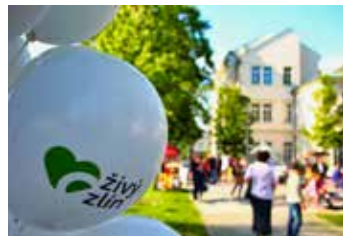
Projekt pokračuje i v září.

Chcete se podílet na aktivitách ve veřejném prostoru města? Máte díky projektu Živý Zlín možnost. Právě teď můžete zaslat svůj nápad, či návrh na kulturní,