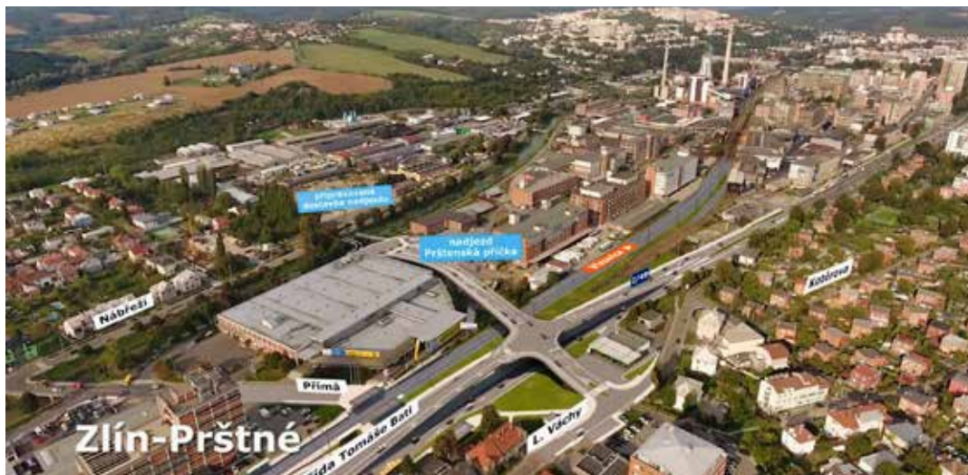
Na křižovatce v Prštném vznikne most nesený sloupy, který v této části povede přes hlavní tah, koleje i řeku Dřevnici.

vzniknout nové mimoúrovňové křížení železnice se silnicí. Na tento úsek pak naváže městská stavba obchvatu Zálešné, na který pak přímo navazuje krajská stavba dálničního přivaděče. Poslední důležitou tepnou je výstavba dálnice D49, která je pod taktovkou ŘSD. Po letitých průtazích by měla mít stavba D49 stavební povolení v roce 2020. V neposlední řadě se velká přestavba v rámci modernizace trati odehraje i na Příluku, kdy bude stávající most nahrazen mostem pro pěší a cyklisty a vznikne zde nové napojení na průmyslovou zónu. „V roce 2020 bychom rádi zahájili realizaci stavby napojení průmyslové zóny Příluky. Čekáme na stavební povolení a připravujeme detaily k financování projektu. Součástí dopravního uzlu by mělo být i nově plánované záchytné parkoviště (P+R), multifunkční hřiště i místo pro stojany na kola (B+R),“ komentuje věc Michal Čížek . Přestože je stavba dosud v přípravné fázi, řešení jednotlivých problematických bodů je klíčem vedoucím k finalizaci celého projektu. [mel]