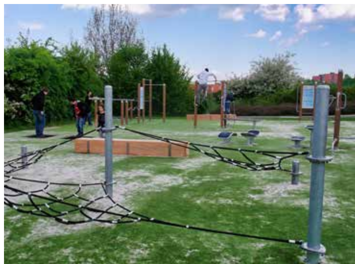
Hřiště se nestaví jen pro nejmenší. Na své si přijde i mládež či dospělí.

Největší sportoviště má ve své správě oddělení prevence kriminality a sportovišť. Mezi aktuální úkoly tohoto oddělení tak patří například vybudování umělého osvětlení na paseckém hřišti, výměna palubovky ve sportovní hale Zelené či částečné zastřešení tribuny na Stadionu mládeže. Zpracovává se studie na vylepšení zázemí pro sportovce v Malenovicích a v přípravě je modernizace hřišť a zázemí u sokolovny. V roce 2020 by se také mohla uskutečnit modernizace skateparku v Bartošově čtvrti, kde by mělo díky novým materiálům (odhlučněný beton) dojít k odhlučnění tohoto sportu. Projekt také počítá s vybudováním lezecké stěny. Mezi ty největší úkoly pak patří převod fotbalového stadionu do majetku města a jeho následná rekonstrukce. „Nechali jsme si zpracovat technický audit areálu stadionu a dnes již víme, jaké jsou nejpálčivější problémy stadionu. Všeobecná filozofie je, že město převezme všechna sportoviště pod sebe a vloží peníze do údržby vlastního majetku. Město se má starat o sportoviště od dětských hřišť až po ta velká,“ uvedl Miroslav Adámek , náměstek primátora pro oblast sportu. Stejný osud, tedy převzetí do majetku města, čeká i zimní stadion. Sledovat chce město i osud lyžařského svahu J. Šperky, který je ve vlastnictví Sportovních klubů Zlín, toho času na prodej. [fab]