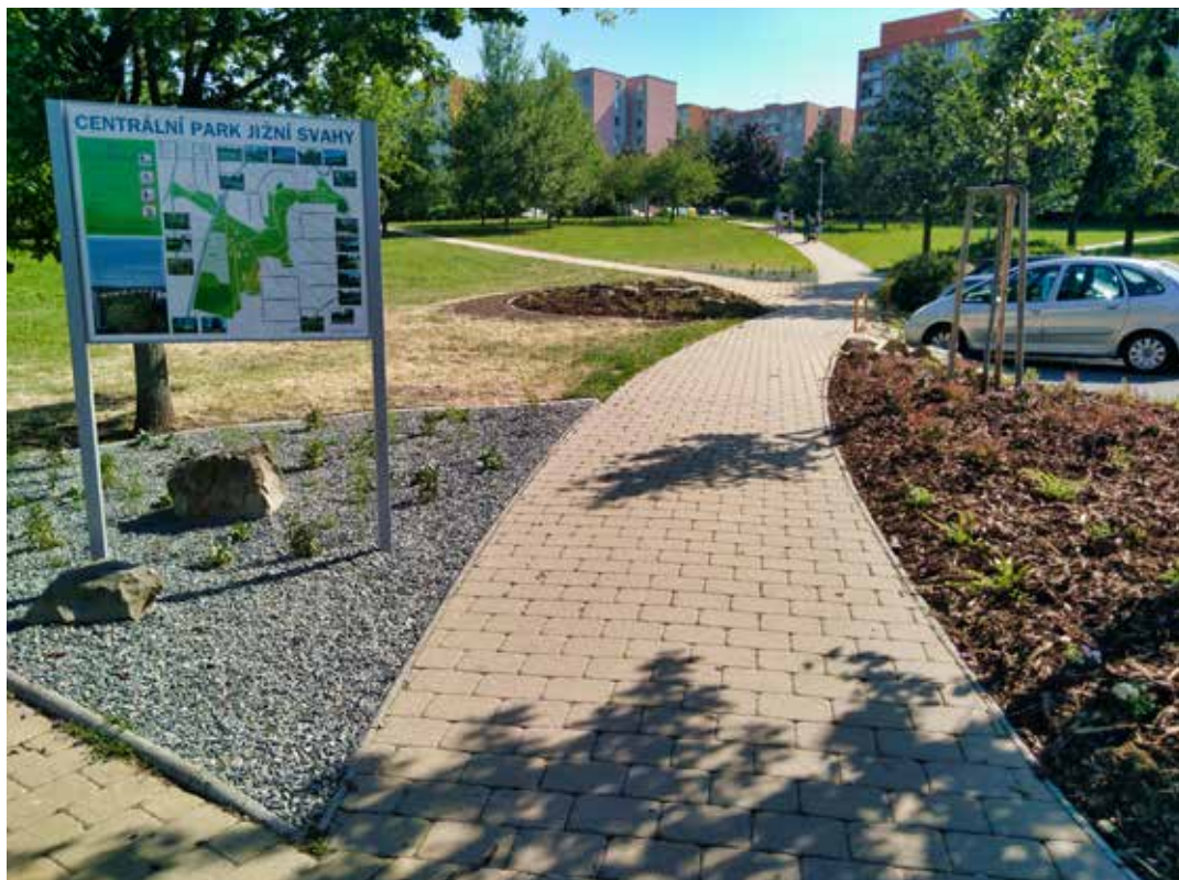
V Centrálním parku dochází k obměně záhonů.