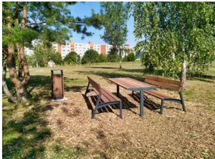
Nově přibyl mobiliář k trávení volných chvil.

umístit piknikové sety – mobiliář k posezení v přírodě pro relaxaci