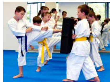
Mladé sportovní naděje

Není. S tréninkem lze začít v jakémkoliv věku bez ohledu na pohlaví nebo aktuální fyzickou zdatnost. Proto jej dnes praktikují