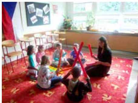
Praktická výuka.

Střední škola pedagogická a sociální Zlín sídlí v klidné lokalitě sídliště Jižních Svahů s výbornou dostupností MHD. Mimožlínští mají zajištěno ubytování v Domově mládeže ve Zlíně. Více o škole na www.sspgs-zlin.cz