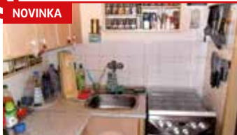
2+1 Zlín - Kolektivní dům N08608

Zděný byt 2+1 v centru Zlína, 8. patro/8, plocha 50 m 2 , krásný výhled, nová okna, bytové jádro po rekonstrukci.