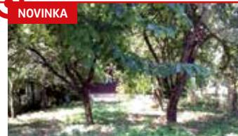
Stav. pozemek Zlín - Prštné N08605

Exkluzivní stavební pozemek ve velmi klidné a příjemné lokalitě ve vilové čtvrti, plocha 606 m 2 , všechny IS.