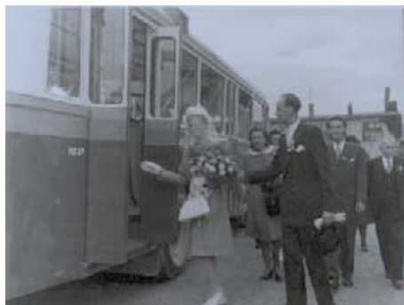
Trolejbusy vozily i celé svatby.

Prvních několik měsíců jsem jezdila jen na lince C z náměstí Práce na Lesní čtvrť a zpátky přes Školní ulici. To už jsem vět-