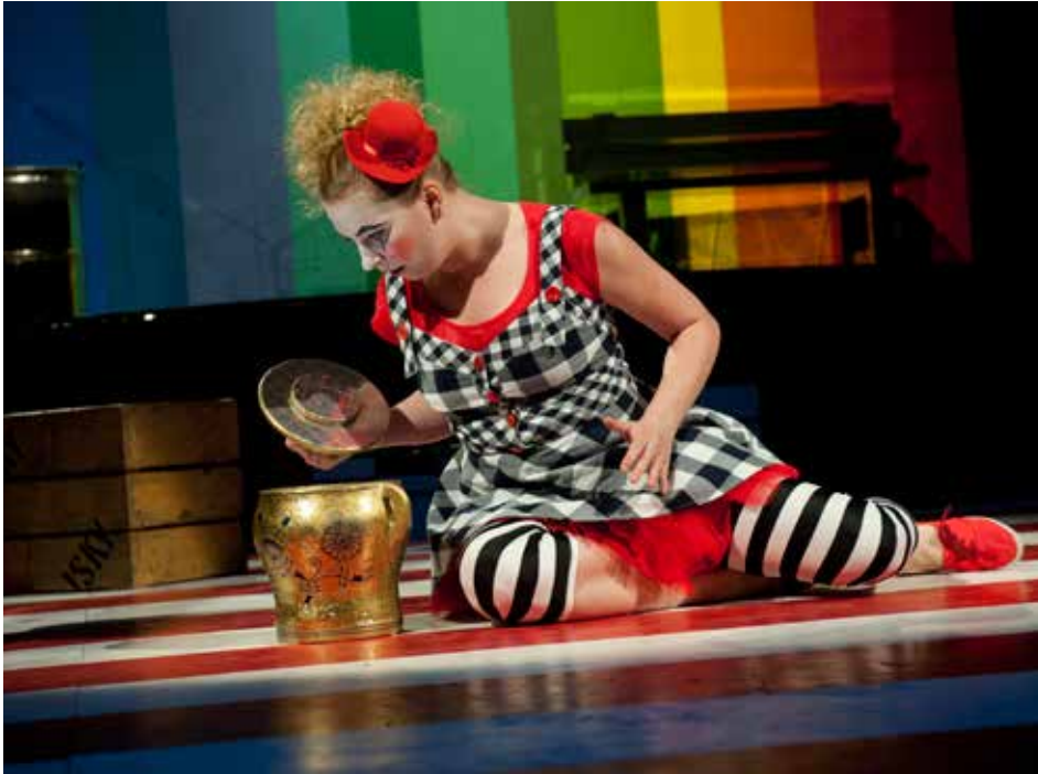
Představení Divotvorný hrnec.