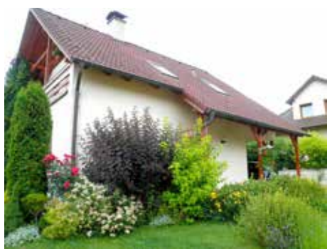
U Vitovjácových.

Vítězové XVII. ročníku soutěže Rozkvetlé město budou slavnostně vyhlášeni v úterý 17. září 2013 v 16.00 v prostorách kulturního institutu Alternativa za účasti zástupců Magistrátu města Zlína. Věcným darem od našich sponzorů budou oceněni všichni účastníci soutěže. Součástí slavnostního vyhodnocení soutěže budou také přednášky na odborná zahradnická témata.