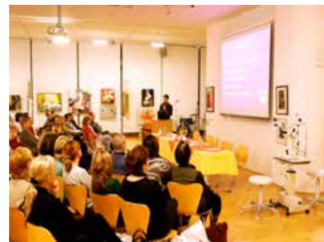
Institut nabízí zajímavé přednášky.

Alternativa zahajuje program desátého výročí vernisáží výstavy zlínského výtvarníka Františka Květoně, v úterý 3. září v 17.00 hodin. Výstava pod názvem Inventura potrvá do 28. září. Další na řadě je v úterý 10. září v 18.00 povídání nejen o cestování s Miroslavem Náplavou a Petrem Horkým. V pondělí 16. září v 18.00 v Alternativě opět