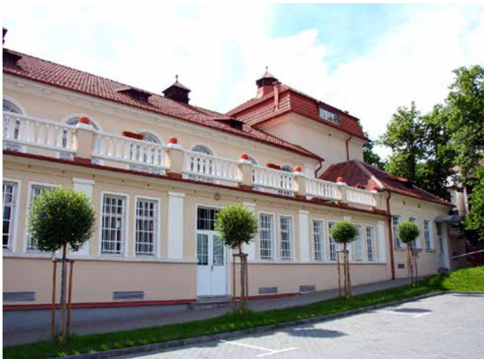
Budova sokolovny ve Zlíně.

V současné době nabízí TJ Sokol Zlín všestranné sportovní využití volného času. V sokolovně se koná i pravidelné cvičení pro seniory a nácvik veřejných vystoupení, aerobik a zdravotní cvičení pro ženy, jóga, pohybové aktivity pro batolata, sportovní gymnastika a florbal. [red]