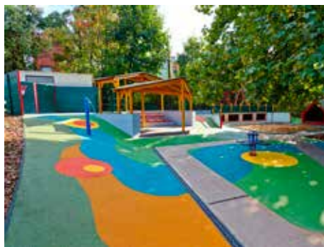
Areál zahrady školky.

Nové atraktivní herní prvky a zeleň čekají na děti, které začnou od září navštěvovat Mateřskou školu na Štefánikově ulici. Areál zahrady prošel významnou regenerací. Na zahradě se nyní nově nachází skluzavka, houpadlo na pružině, houpačka ve tvaru ptačího hnízda, dvě přitahovadla a čtyři tabule na kreslení. „Došlo také ke zpevně-