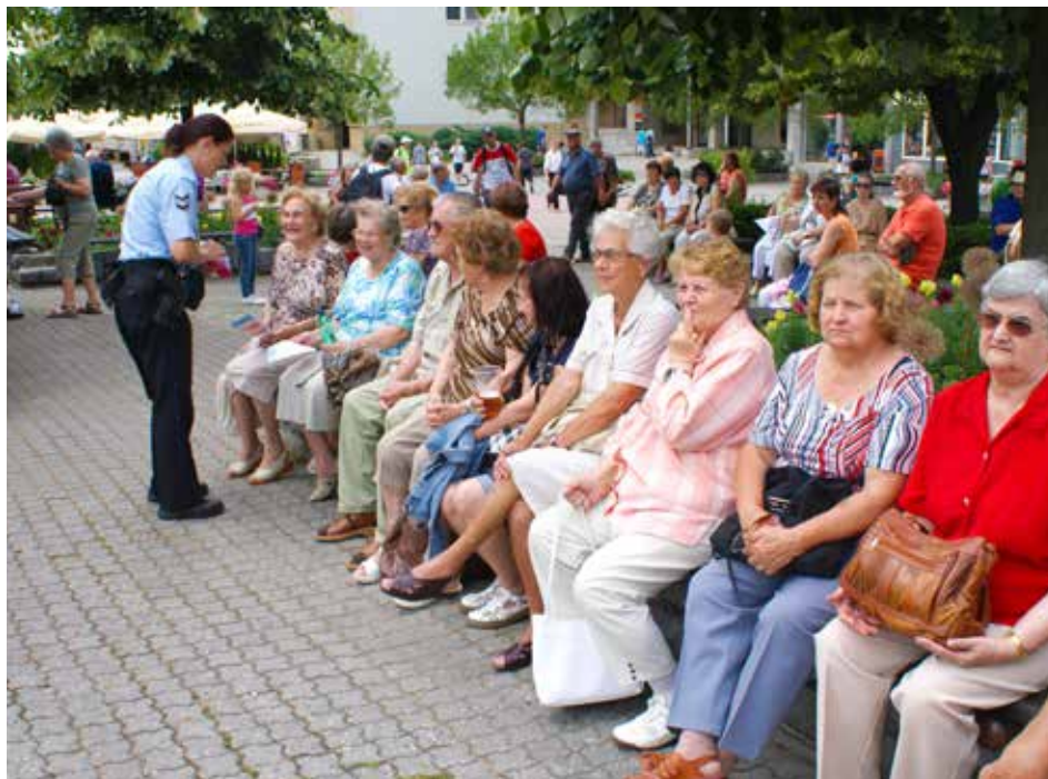
Senior akademie je další akcí města a strážníků pro dříve narozené.

Z besed by si měli účastníci odnést konkrétní poznatky, které budou moci využít v praxi. „Dostanou informace o prevenci kriminality seniorů, o bezpečnosti ve Zlíne,