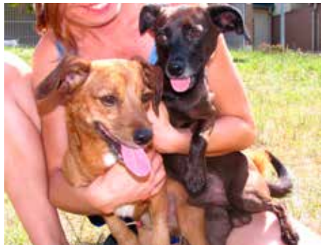
Dafi a Blek.

Manka - je nádherná a umazlená asi 1,5 roku stará kočička, která v útulku porodila koťátka, o která se vzorně starala. V současné době je Manka již vykastrovaná a trpělivě čeká na nového majitele