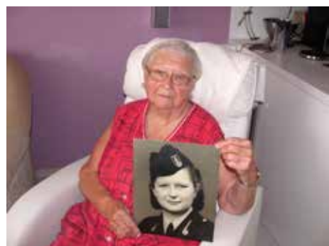
Emílie Bušinová.

Některé spoje byly zaplněny do posledního místa. Vzpomínám si, že ráno jsme mohli na točně Lesní čtvrť pustit do vozidla maximálně 60 cestujících. Třicet lidí si pak mohlo přistoupit na Příkré a deset u škol. Lidé se cpali dovnitř, i když už byl tento počet vyčerpán. Často nám pomáhal i revizor odhánět ty, kteří už byli nadpočetní. Také jsme mohli dovolit přepravu nejvýše jednoho dětského kočárku. Setkávala