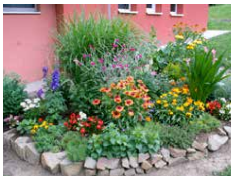
U Lackových.