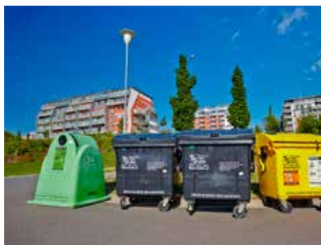
Odpadové hospodářství se stále vyvíjí.

lze spalovat pouze suché dřevo neznečištěné chemickými látkami. Úplný text vyhlášky je k dispozici na internetových stránkách www.mestozlin.eu nebo na Odboru životního prostředí a zemědělství Magistrátu města Zlína.