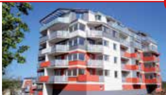
2+kk Zlín - U Centrálního parku II N05427

Nový zděný byt 2+kk v novostavbě bytového domu poblíž Centrálního parku, plocha 48 m 2 + velká terasa.