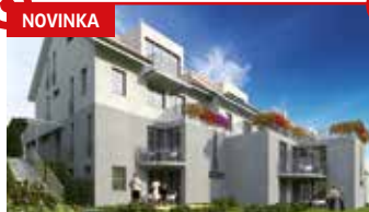
3+kk Zlín - Vršava N08532

Nový byt v atraktivní lokalitě nedaleko centra, plocha 70 m 2 , lodžie, možnost garáže, MHD u domu, dokončení 2014.