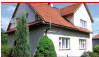
Želechovice u Zlína N08333

Pěkný a udržovaný RD 5+1, okrasná zahrada s pergolou, 2 garáže, klidná lokalita, výborná dostupnost do Zlína.