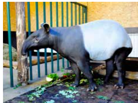
Tapír čabrákový.

ní pavilon a vodní plochu rozbily stožáry a natažená lana. V expozici se zabydlel pár asijských gibbonů lar a oficiálně se jí začalo říkat „Rybník gibbonů“. Na další změnu čekala expozice sedmnáct let. V roce 2013 proběhla nejen úprava vodní nádrže a břehů, ale také vnitřních ubikací a celého okolí expozice nově nazývané Hala Bala. Gibboni lar se před rekonstrukcí přesunuli do bývalé expozice medvědů