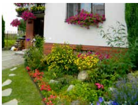
U Urikových.

Do druhé kategorie, květinová výzdoba oken a balkonů, se přihlásilo 16 účastníků. Třetí