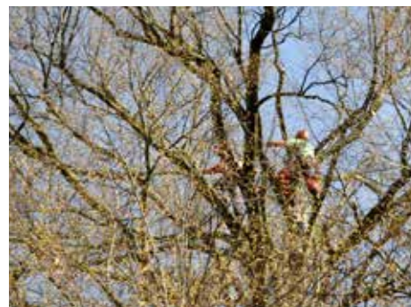
Vítězný strom je odborně ošetřen.

dočkala během oslav Dne Země ošetření arboristy. [vp]