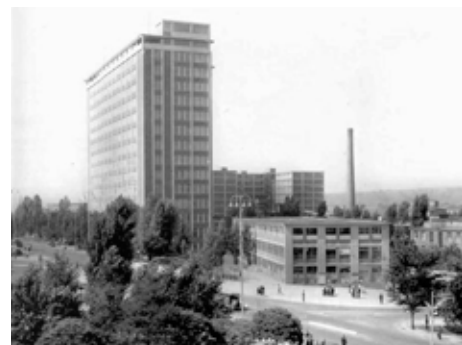
Budova 21.