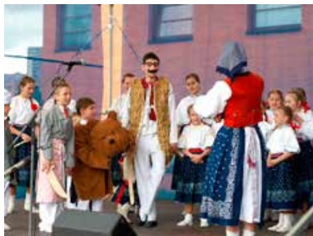
Trnečka se věnuje dětem od 3 do 16 let.

Pět let působí ve Zlíně dětský folklorní soubor Trnečka. Jeho zřizovatelem je Orel jednota Zlín. Oslavy pátého výročí folklorního souboru Trnečka, které se konají v sobotu 8. září, se stanou součástí dne otevřených dveří v Orlovně na ulici Štefánikova. Orel jednota Zlín totiž letos slaví 110. výročí zahájení činnosti. Trnečku mohou návštěvníci Orlovny vidět od 15.30 ve velkém sále.