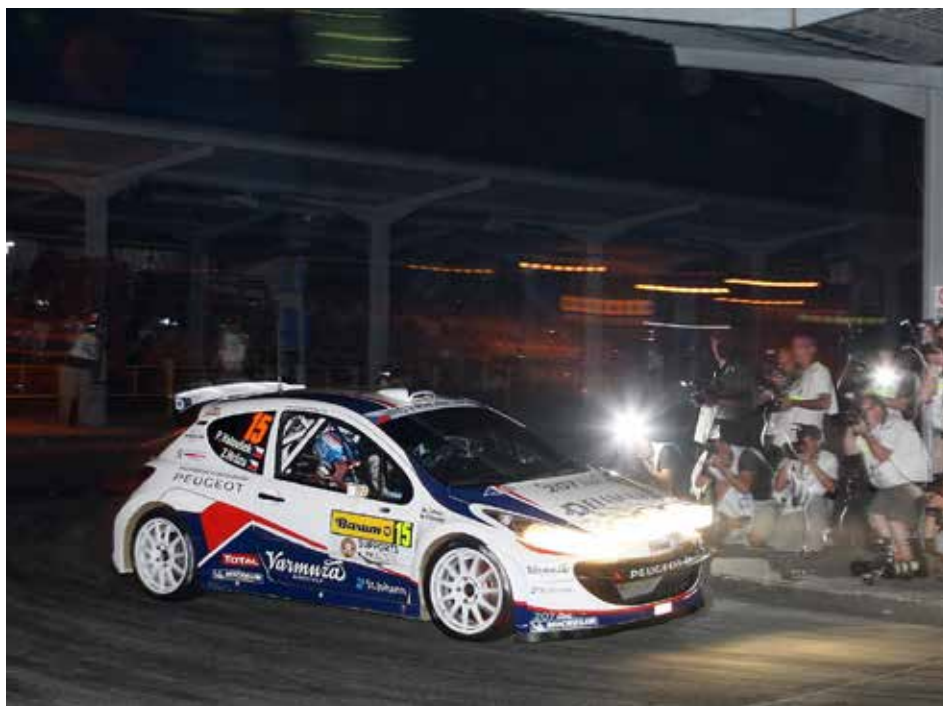
Zlínská noční rychlostní zkouška je perlou rally.