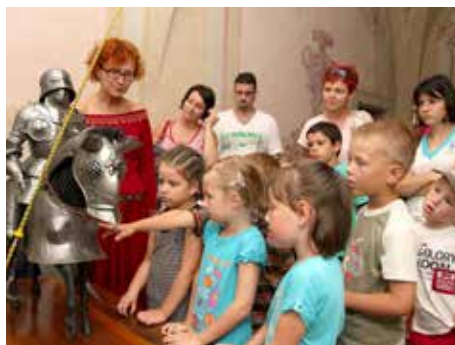
Hrad je pro děti atraktivní.

„V březnu, jakmile to počasí konečně dovolilo, začaly na hradě plánované