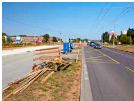
Na silnici I/49 stavbaři finišují.

vybudovali nový most přes Hleděnovský potok s ohledem na protipovodňová opatření proti stoleté vodě. V souběhu komunikace I/49 se sídlištěm Malenovice byla dokončena protihluková opatření, která zvýší kvalitu bydlení v dané lokalitě. Úplné dokončení stavby je předpokládáno do července 2013. „Stavba se od svého počátku potýkala s nedostatkem