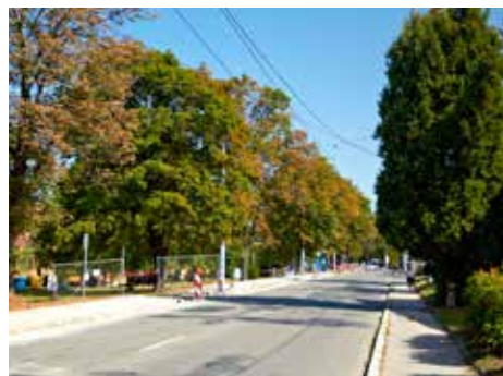
Do databáze přibily další stromy.

Po zadání klíčového slova Zlín se objeví fotografická mapa s červenými kolečky, která po „rozkliknutí“ ukáže údaje