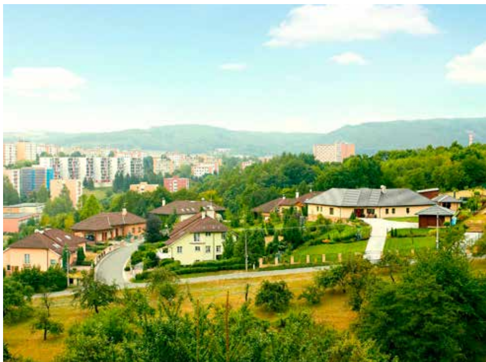
Zvyšování daně z nemovitosti se Zlíňanů netýká.