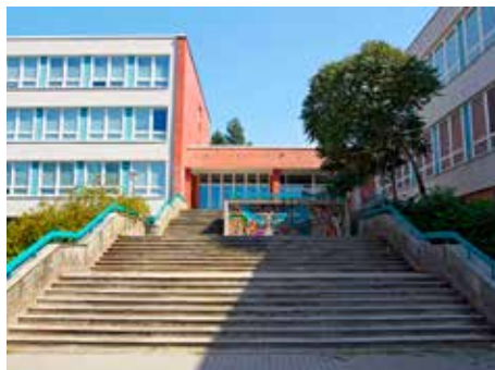
ZŠ Okružní se dočká opravy schodiště.

Desítky milionů korun letos proinvestuje město do rekonstrukcí a modernizací svých školských budov. Největším projektem z hlediska objemu vynaložených peněz je rekonstrukce kuchyně ZŠ Okružní, kde se ročně uvaří kolem 100 tisíc obědů. V rámci investice za asi 12 a půl milionu korun se zde během letních prázdnin výrazně vylepšila například technologie pro vaření