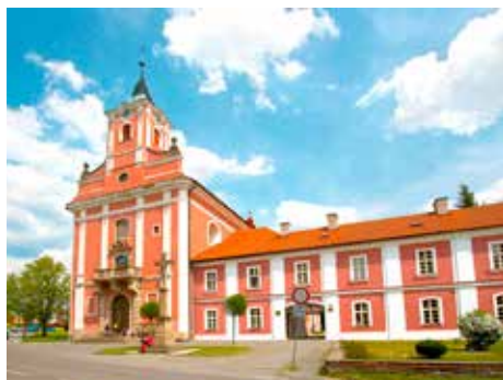
Současná podoba kostela.

Lidová zbožnost, jež byla pevnou součástí života našich předků, nacházela s oblibou ukončení na řadě poutních míst, většinou mariánského zasvěcení. Nejvýznamnějším na Moravě je bezesporu Hostýn, ale vedle něj tu nacházíme i jiné mariánské poutní cíle přitahující pozornost věřících. V blízkém okolí Zlína je to Provodov a především Štípa, kam ještě před sto lety mířila poutnická procesí třeba i z jižní Hané.