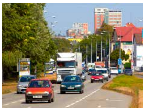
Pro vrácení ŘP je nezbytný psychologický test.

Jmenovitý seznam akreditovaných psychologů je umístěn na internetových stránkách ministerstva dopravy, www.mdcz.cz , pod odkazem /silniční doprava/udělené akreditace k provádění dopravně psychologického vyšetření. Akreditaci uděluje na základě žádosti psychologa po splnění zákonných podmínek přímo ministerstvo dopravy.