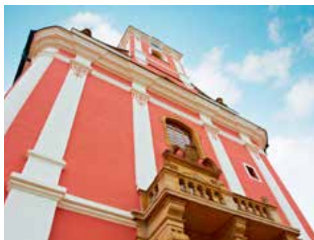
Kostel je dominantou Štípy.

To spolu s probíhající úpravou Mariánského náměstí by mělo být podstatným vkladem naší generace k dějinám památného poutního místa, jež v zázemí moderního Zlína a v sousedství krásné Zoologické zahrady Lešná představuje malebné místo se silným duchovním nábojem. Marcel Sladkowski