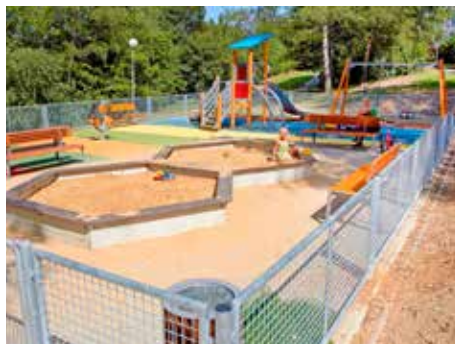
Dětské hřiště na Jižních Svazích.