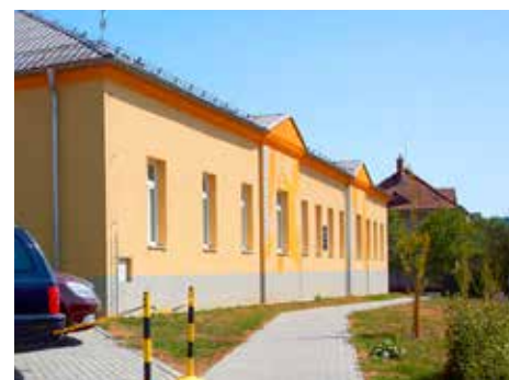
MŠ v Mladcové září novotou.