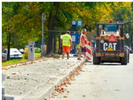
Rada chodníků opravu nutně potřebuje.

stavů investovat částku až 17 milionů korun. Práce budou postupovat v souladu s unikátní metodikou loni zahájeného projektu Chodníky 300. Ta umožňuje zlevnit rekonstrukce komunikací pro pěší v průměru o 40 procent ve srovnání s minulými roky. Metr čtvereční chodníku nyní město opravuje průměrně za 1 401 korun včetně DPH, dříve to bylo za cca 2 300 korun včetně DPH. Únosnost chodníků se přitom výrazně zvýšila a to zásluhou modernějších pracovních postupů. Loni se takto opravily chodníky na ulicích Hornomlýnská, Broučkova, Mokrá, Fr. Bartoše, Tečovská, Husova, Štefánikova, Okružní a Hony III. Seznam lokalit, kde se budou chodníky letos opravovat, je již hotový. Pokud se nám podaří dosáhnout při samotné realizaci úspor, doplníme do seznamu další akce,“ slíbil radní Josef Novák , jenž se opravami chodníků zabývá. Díky projektu Chodníky 300 mají obyvatelé města možnost zjistit, v jakém technickém stavu jsou komunikace, po kterých chodí, a kdy dojde – v případech, kdy jsou poškozené – k jejich rekonstrukci. „Tyto informace najdou na našem webu, kde je na pravé straně úvodní stránky umístěn banner Chodníky 300. Rozlišení skutečného technického stavu je provedeno barevně,“ prozradil zastupitel města Jiří Viktorín . [dvo]