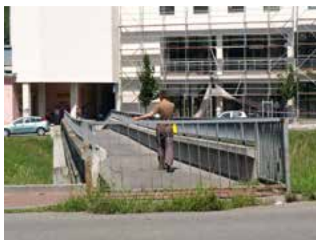
Lávka u stadionu se dočká rekonstrukce.