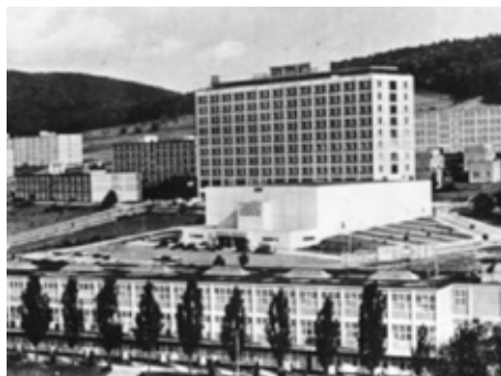
Objekt hotelu.

Text uvedeného díla je výsledkem osobních setkání s Ing. arch. Vladimírem Karfíkem. Setkání vrcholila zhruba v roce 1987, kdy jsme se rozhodli v cílených otázkách a odpovědích zachytit názory tohoto předního českého architekta na vývoj funkcionalismu a konstruktivismu