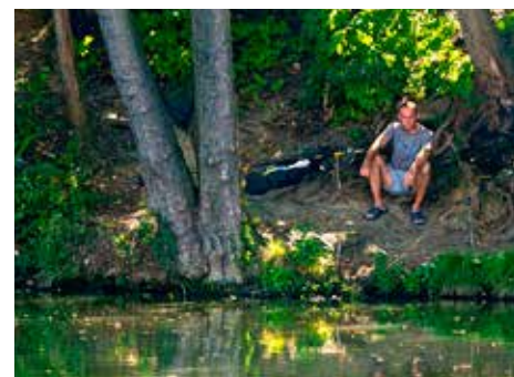
Ilustrační foto.

doklady – povolenku pro vody mimopstruhové, případně i další pro vody pstruhové. Na magistrátu si zakoupíte rybářský lístek a přihlásíte se k odpracování stanoveného počtu brigádnických hodin. Z této povinnosti se lze vykoupit složením stanovené částky. Pro děti nabízí Dům dětí a mládeže Astra několik rybářských kroužků, které začínají vždy na přelomu září a října. [sve]