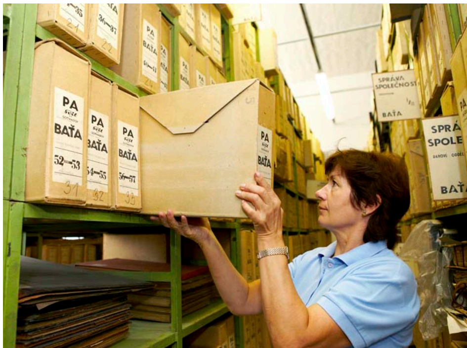
Moravský zemský archiv - pracoviště Zlín / foto: Ivo Hercík