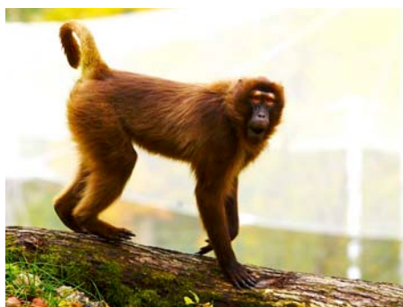
Zoo Lešná je vyhledávaná

Lešná tak v loňském roce obsadila čtvrtou příčku v TOP pěti nejnavštěvovanějších zoologických zahrad v ČR. [bk]