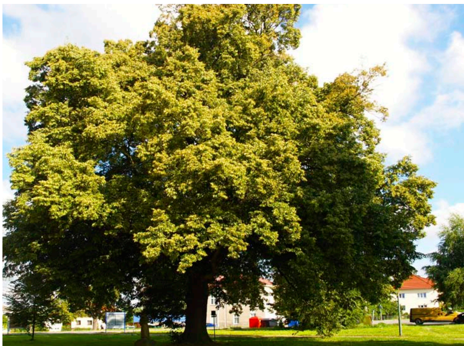
Lípu ze Štípy přihlásily děti z místního Ekokroužku