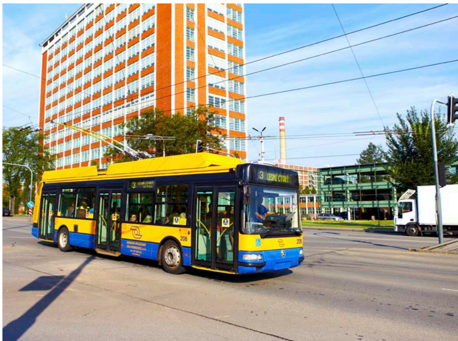
Provoz MHD dotují města