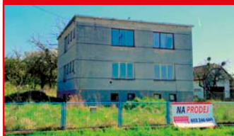
Zlín - Kostelec N04712

Prostorný rodinný dům se započatou rekonstrukcí a s pozemky o velikosti cca 4.200 m 2 . Garáž. Sleva 1.650.000 Kč! tel.: 603 246 680 4.300.000 Kč