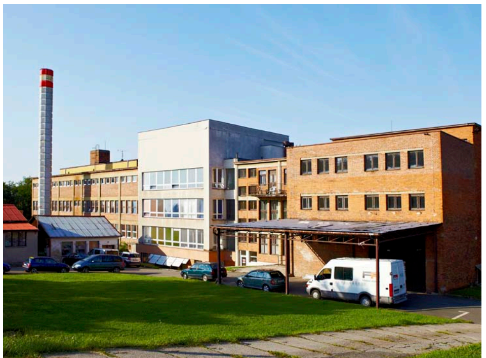
Filmové ateliéry

Informace o stavu připravenosti tohoto integrovaného projektu k realizaci byla předána na Zlínský kraj, k zařazení lokality Filmových ateliérů mezi potenciální rozvojové zóny Zlínského kraje. [red]