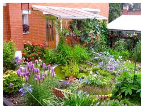
Vítěz kategorie III