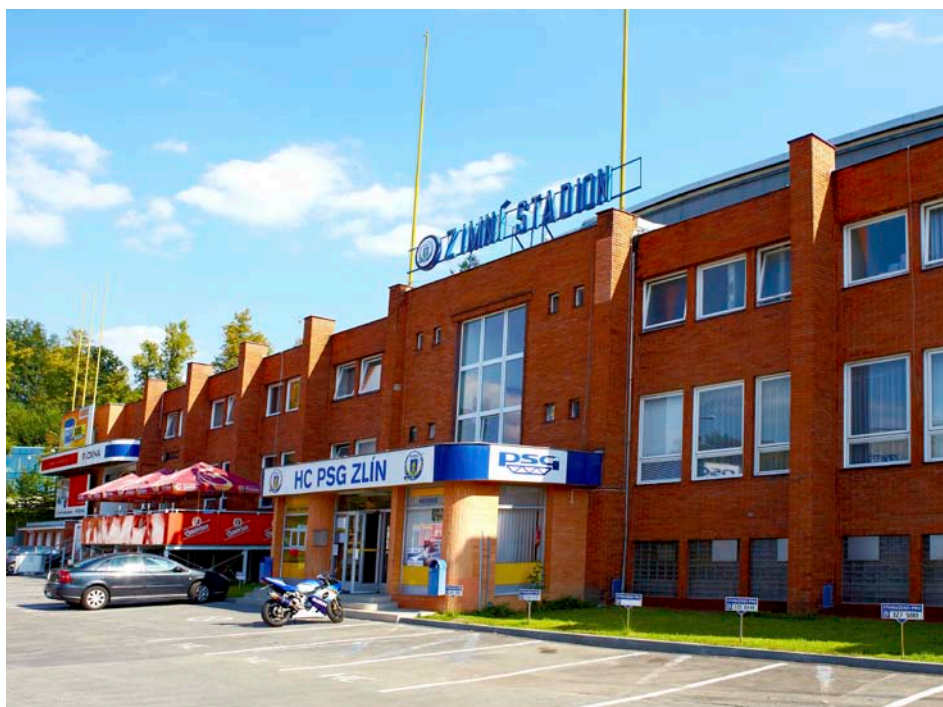
Město Zlín podporuje hokej

Víte, co spojuje Pohřebnictví Zlín, Dopravní společnost Zlín–Otrokovice nebo třeba hokejové PSG Zlín? Jde o společnosti, ve kterých má město Zlín majetkový podíl a je tedy jejich vlastníkem, nebo významným spoluvlastníkem.