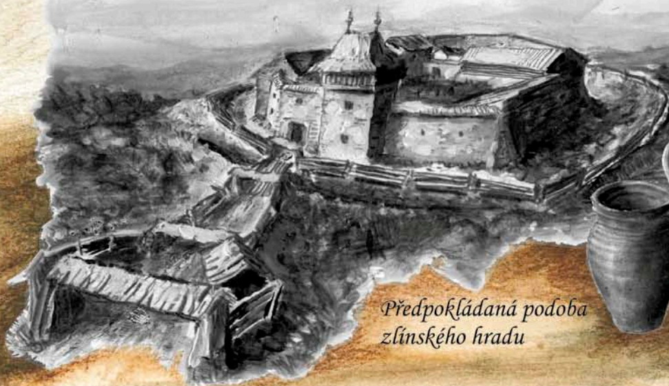
Předpokládaná podoba zlínského hradu