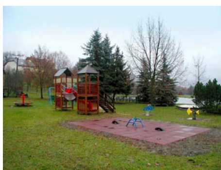
Klečůvka / foto: Archiv MMZ