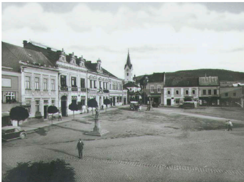
Občanská záložna od architekta Dominika Feye – dům se třemi neorenesančními štíty, foto 1930, Státní okresní archiv Zlín