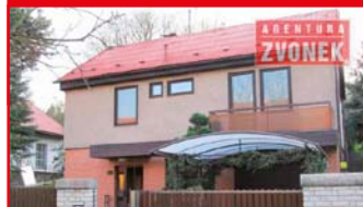
Zlín - Mokrá N04703

Dům v klidné a zajímavé lokalitě Zlín - Mokrá s garáží. Sauna, terasa s výstupem na zahradu (plocha 677 m 2 ). tel.: 603 246 680 3.599.000 Kč