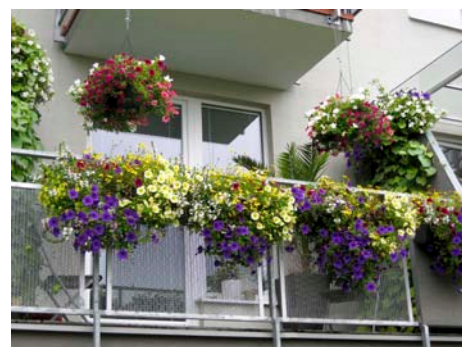
Vítěz kategorie II