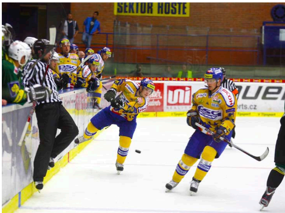
Cílem pro letošní sezonu je především postup do play-off

V kolébce českého sledge hokeje se po čtyřech letech opět obnovuje tradice klubového turnaje s mezinárodní účastí. Díky významné podpoře statutárního města Zlína a nového generálního partnera nejstaršího tuzemského klubu zahájí evropští sledge hokejisté další sezonu turnajem pro šest týmů. LAPP Cup Zlín 2011 je též „výběrovým turnajem“, neboť kromě pořadajícího vicemistra ČR SHK LAPP Zlín, Bremen Pirates z Německa a South Tyrol Eagles z Itálie se na ledě PSG Arény ve Zlíně utkají také výběry ČR, Velké Británie a nováčka na sledge hokejové mapě Rakouska. O jejich optimální pohodu a snadnou orientaci ve Zlíně se postará pořadatelský tým, výrazně posílený studenty zdejší Fakulty humanitních studií Univerzity Tomáše Bati. Utkání každého s každým jsou naplánována na čtvrtek 1. září a pátek 2. září, kdy bude odehráno 15 zápasů ve zkráceném formátu 2x15 minut, zápasy o celkové umístění jsou naplánovány na sobotu 3. září, na všechna utkání je vstup volný. Podrobnosti nejen k tomuto turnaji, ale též k dvanáctileté historii zlínského sledge hokeje naleznete na www.sledgehokejzlin.cz , tam i v ochozech PSG Arény se na vaši podporu těší SHK LAPP Zlín. (rh)