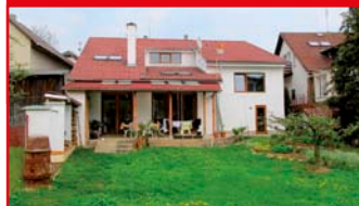
Zlín - Kostelec N04762

Atraktivní dům v klidné lokalitě Zlín, Kostelec s prostornou zahradou. Zastřešená terasa, krb, MHD. Cena k jednání! tel.: 603 246 680 3.499.000 Kč