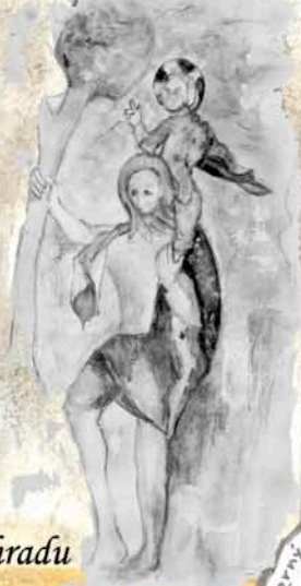
Středověké fresky z kostela v Tečovicích a z malenovického hradu