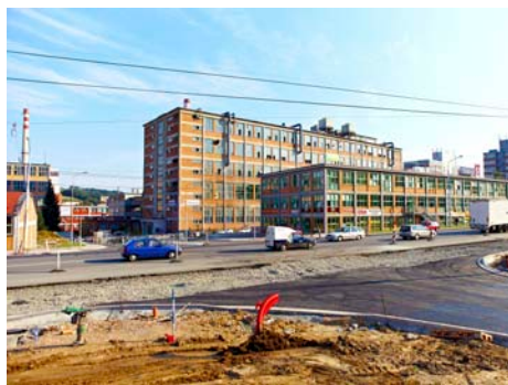
Staveniště křižovatky

Příjemnější přístup k poliklinice, moderní zastávky MHD, nová točna pro trolejbusy a autobusy, ale také rozšíření frekventované komunikace na tř. T. Bati ze čtyř do šesti pruhů. Spoustu změn přináší pro obyvatele Zlína výstavba křižovatky Antonínova a na ni navazující projekty.