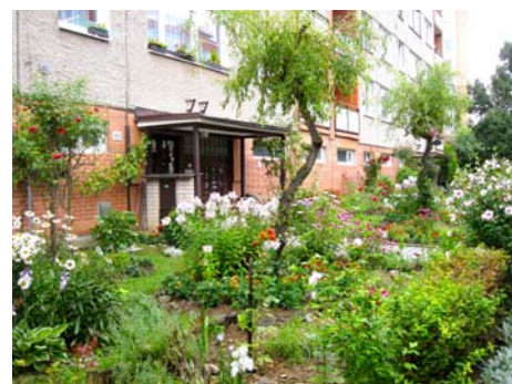
Vítěz kategorie Ib