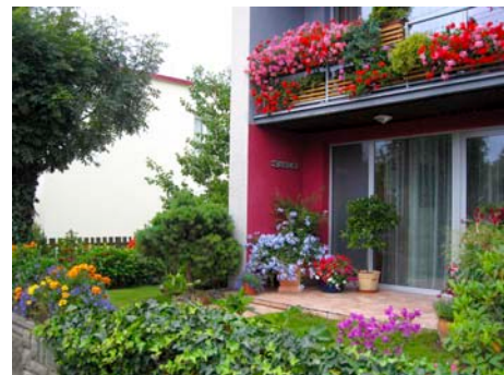
Vítěz kategorie Ia