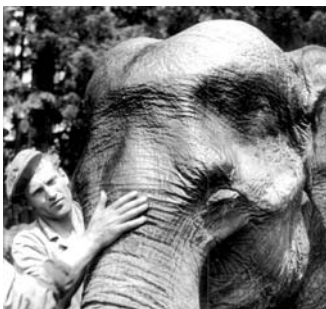
Slonice Sumatra v ZOO Lešná v roce 1958

Díky přesunu sbírek dosud uložených na hradě v Malenovicích do nových depozitářů v Otrokovcích budeme moci v uvolněných prostorách instalovat novou přírodovědeckou expozici. V její první části využijeme našeho bohatého sbírkového fondu a hodláme ukázat rozmanitost fauny na Zemi podle zoogeografických oblastí. Rádi bychom též naznačili nejrůznější aspekty vztahů mezi lidmi a zvířaty (člověk lovec, člověk ochránce, člověk vědec a podobně).