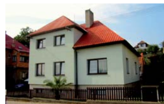
Rodinný dům Tečovice (okr. ZL)

Cihlový, celopodsklepený dům rozdělený na 2 bytové jednotky 3+1, s prostornou půdou, plyn. topení, garáž. ☎ 736 785 182 4.660.000 Kč