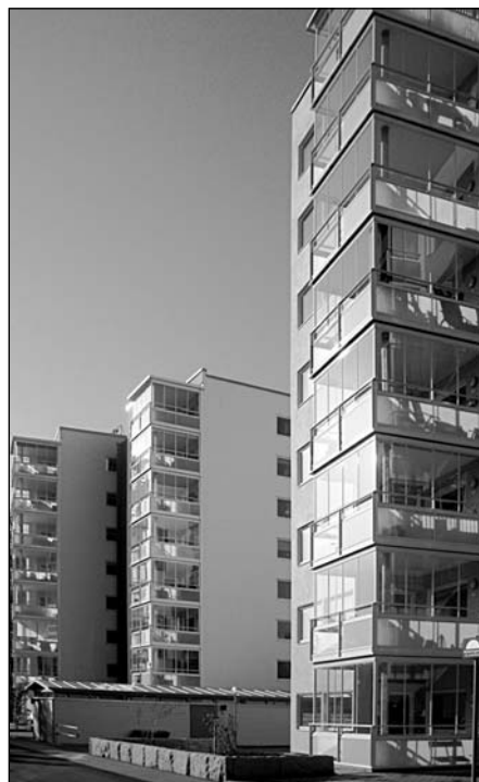
Nízkoenergetické bytové domy ve Falkenbergu.