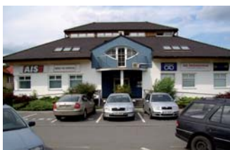
Komerční objekt Zlín - Příluky

Prostorný, slunný byt, po kompletní rekonstrukci, vana i sprch. kout, 82 m 2 , zasklená lodžie, krásný výhled na Zlín. ☎ 736 631 212 1.790.000 Kč