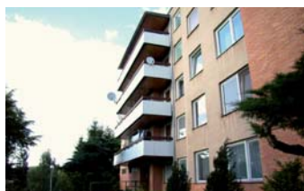
Byt 1+1 Zlín - Družstevní

Samostatně stojící RD s velkou zahradou, v klidné části, ústřední plynové topení, dům je zateplený, velká garáž, zahradní domek. ☎ 739 686 851 2.999.000 Kč