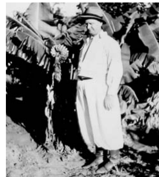
Jan Antonín Baťa v brazilské Indianě