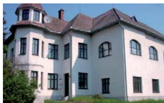
Nadstandardní vila Březnice u Zlína

Nadstandardní vila po celkové rekonstrukci, v atraktivní lokalitě u Zlína. Vhodná i pro komerční využití. Velká zahrada. ☎ 737 261 283 Super cena!