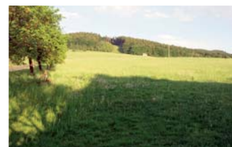
Pozemek Provodov (okr. ZL) SUPER!

Nemovitost ke komerčním účelům v průmyslové zóně krajského města, parkování pro cca 20 aut. Provozní plocha 737 m 2 . ☎ 737 261 283 Cena v RK