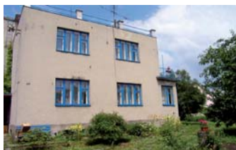
RD Zlín - Malenovice

Nadstandardní vila po celkové rekonstrukci, v atraktivní lokalitě u Zlína. Vhodná i pro komerční využití. Velká zahrada. ☎ 737 261 283 Super cena!