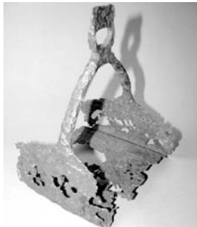
Unikátní železné předměty s prolamovanými body