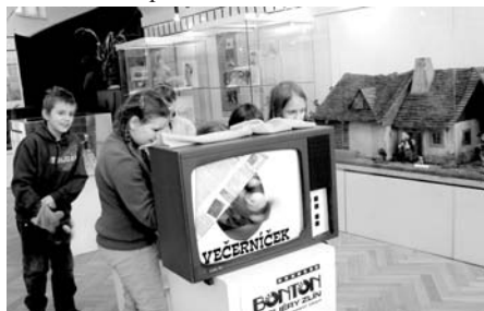
Animací program výstavy Jak se rodí večerníčky

aneb Animovaná tvorba filmů pro děti a mládež.