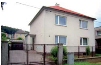
RD Zlín - Podhoří

Částečně podsklepený RD o dvou bytových jednotkách, zimní zahrada. Možno využít i ke komerčním účelům. ☎ 736 785 182 3.970.000 Kč