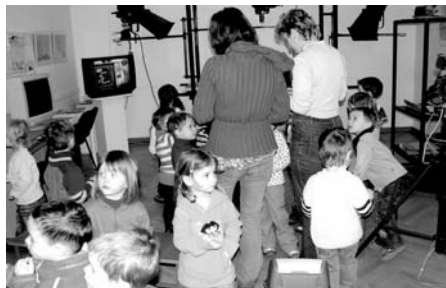
Animací program výstavy Jak se rodí večerníčky

Nejnovější tvorba večerníčků byla zastoupena scénou a loutkami ze seriálu Krysáci , který vytvořilo