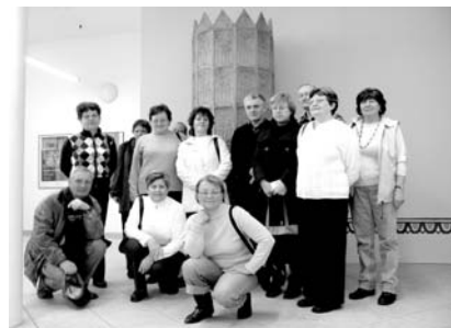
V duchu rčení „Březen, za kamna vlezem“ na výstavě Kráska, která hřeje (Slovácké muzeum)

Kde teď právě kopete a co zajímavého jste zase našli? S podobnými otázkami se na mne jako muzejního archeologa často obracují lidé, kteří mají zájem o archeologii a rádi by se dověděli něco bližšího o nejstarší historii místa, kde žijí. Právě pro ně budou určeny schůzky Archeologického klubu, který letos vznikl při Muzeu jihovýchodní Moravy ve Zlíně. Jeho činnost bude zaměřena nejen na přednášky a besedy o nových objevech a výzkumech - především na Zlínsku, návštěvy tematických výstav s odborným výkladem, ale i na poznávání pravěkých a středověkých archeologických lokalit v okolí našeho krajského města, jehož dějiny - dnes spojované především s „baťovskou“ érou - sahají hluboko do minulosti. Jedním z hlavních podnětů ke vzniku klubu se stal zájem studentů-seniůrů, kteří navštěvovali přednášky nového cyklu Archeologie a etnologie probíhajícího na UTB ve Zlíně v rámci Univerzity 3. věku; v jeho řadách jsou však samozřejmě vítáni všichni další nadšenci, bez ohledu na věk.