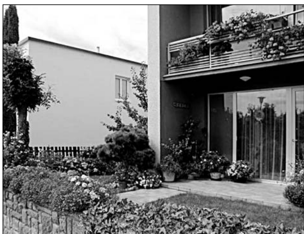
1. místo I. kategorie

1. místo - poř. č. 14 - pan Václav Zálešák, Květná 386, Kostelec