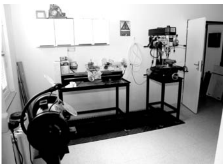
Část nové konzervátorské dílny v Otrokovicích

Každá doba přinesla do oboru muzejnictví nové podněty, které vždy pozitivně působily na jeho úspěšný a dalekosáhlý rozvoj. I dnešní doba přináší nové a nové stimuly, jež muzejnictví musí zpracovat a absorbovat. Chceme-li obstát v evropském kontextu vývoje oboru, je nutno činnost muzeí přizpůsobit novým trendům, a to nejen v oblasti jeho prezentační činnosti výstavní. Stále důležitějším a významnějším polem, na němž muzejní instituce rozvíjejí svou činnost, je široká paleta programů a aktivit určených nejširšímu věkovému spektru návštěvníků.