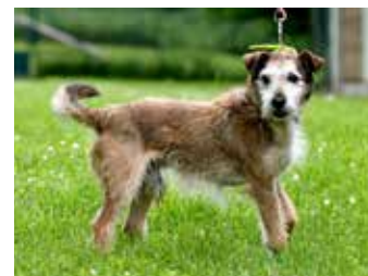
KAREL / kříženec teriéra, 12 let, hodný a přátelský, vhodný pro staršího člověka