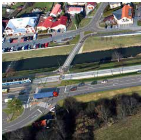
Nové propojení páteřní cyklotrasy na Vizovice

Město Zlín zahájí na jaře 2022 realizaci další z plánovaných strategických staveb, a sice nového dopravního napojení průmyslové zóny a městské části Příluky.