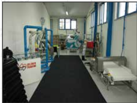
Showroom provozu Zlín