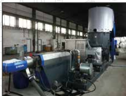
Provoz v Křelově

Provoz v Olomouci-Křelově se primárně zaměřuje na recyklaci nakupovaných plastových materiálů. Z těch jsou vyráběny drtě, regranuláty a kompaundy, které jsou nabízeny obchodním partnerům, nebo použity pro výrobu vlastních vstříkovaných produktů. Obchodování s plasty, které dalo firmě do názvu TRADING, je i nadále velmi aktivní a důležitou součástí společnosti. Tento provoz má zajímavou historii s bývalými pronajatými provozovny v Kojetíně (1992), Hulíně (1995) – odkud pochází první reklama na fotografii nahoře – a první akvírovanou, již prodanou provozovnou ve Zlíně-Štípě (1994). Vše se nakonec po druhé, největší akvizici v roce 2000 přesunulo do velkého areálu v Křelově.