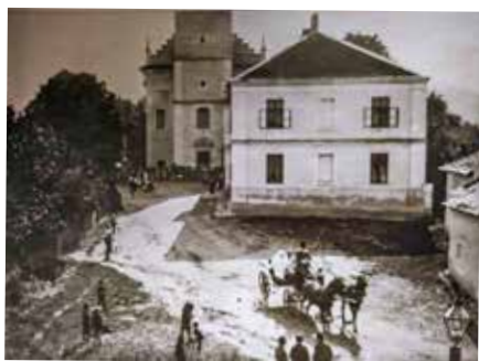
Stará obecná škola u kostela.

Poměry ve Zlíně ještě na konci 19. století byly velmi skromné. Nepříznivá situace byla třeba v oblasti vzdělávání. Vyššího školního vzdělání než obecné školy, což je obdoba dnešního prvního stupně základní školy, tehdy ve Zlíně nebylo možné dosáhnout.