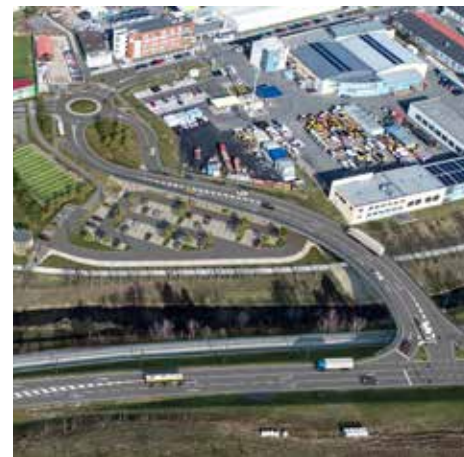
Nové silniční napojení Příluk na I/49 a parkoviště P+R