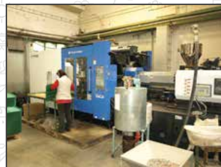
Provoz ve Vrbně pod Pradědem

Vstříkolisovna ve Vrbně p. P. se dostala na několik let do role nejvýkonnějšího provozu společnosti. V roce 2020 ji však po delší době předčil provoz v Křelově, jehož zisky letos rostou ještě více. Pandemie provozy nijak neohrozila a firma se pouští do nových projektů a aktivit.