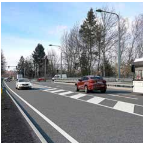
Nové napojení místní části Příluky na I/49