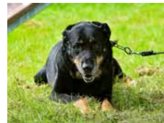
ELIÁŠ / kříženec velkého plemene, 8 let, vhodný do domu se zahradou pro zkušeného majitele