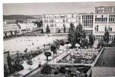
Školní čtvrť se sportovištěm a koupalištěm v roce 1938.

Jak zdůrazňuje Zdeněk Pokluda v publikaci Baťa – inspirace pro Československo, podařilo se takzvaným „pokusným diferencovaným školám“ pod vedením ředitele Stanislava Vrány získat vynikající učitele, kteří vypracovali pozoruhodné experimentální vzdělávací programy. Ty si získaly respekt po celé republice a do Zlína směřovaly za zkušenostmi početné exkurze učitelů.