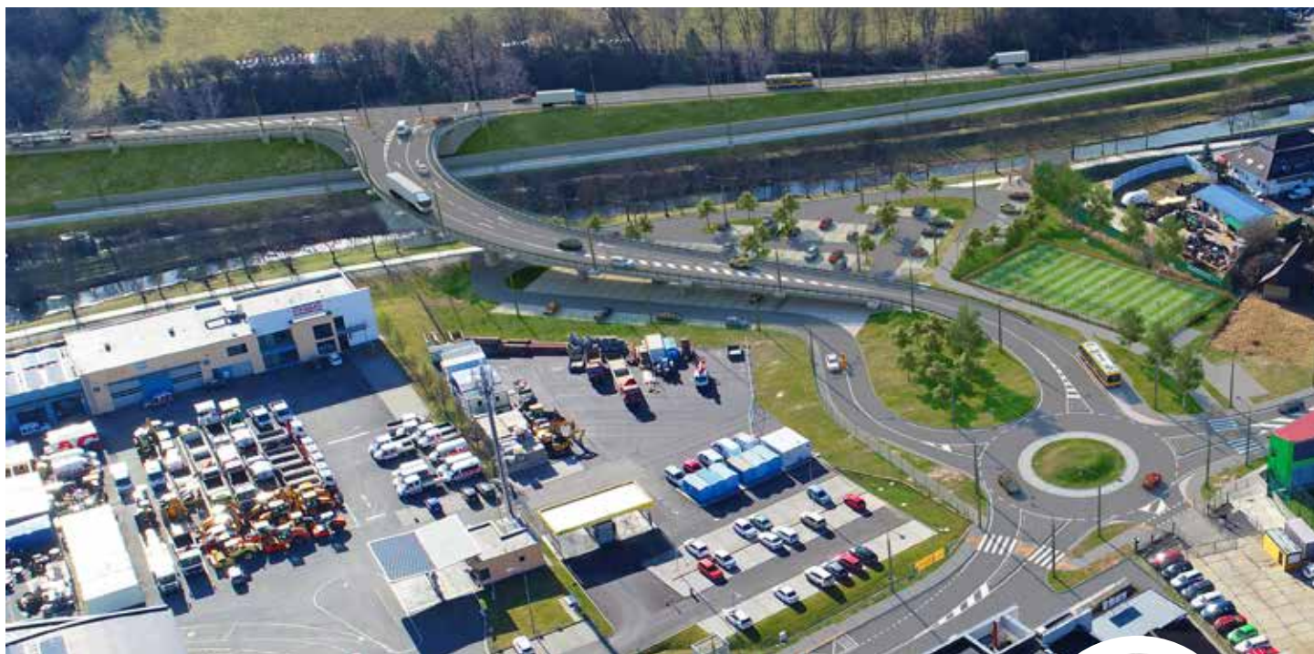
Nové silniční napojení průmyslové zóny v Přílukách na silnici I. třídy