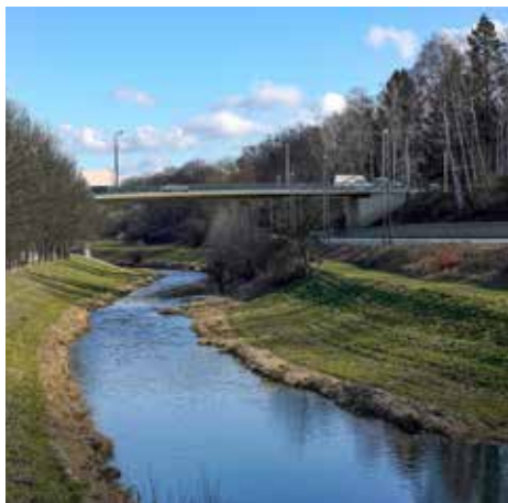
Vizualizace nového mimoúrovňového mostu nad železnicí