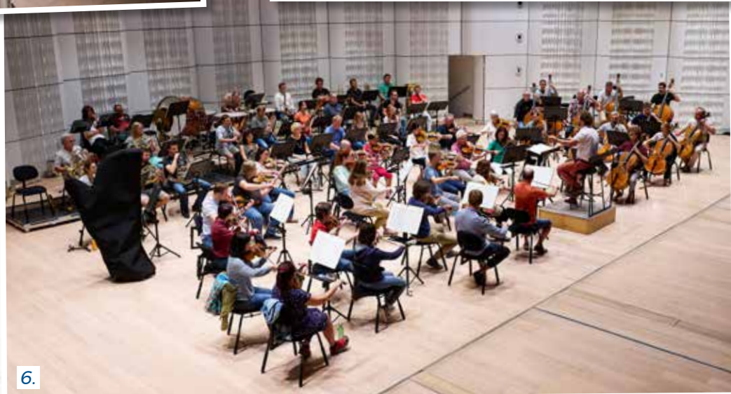
Foto 6: Zkouška orchestru probíhá na pódium Velkého sálu Kongresového centra Zlín

Foto 5: Na rozehrávání se využívají i chodby