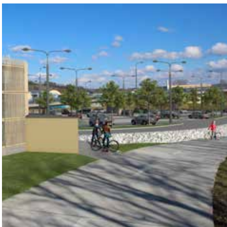
Smišená stezka pro pěší a cyklisty u záchytného parkoviště