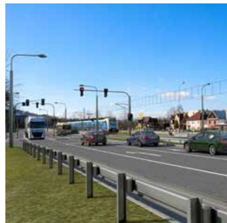
Nová zastávka vlaku s přímou návazností na zastávku autobusu (VHD) a MHD

Bude se jednat o největší dopravní stavbu poslední dekády, na kterou město získalo dotace ve výši cca 190 mil. Kč. Externí zdroje poskytly Státní fond dopravní infrastruktury, Ředitelství silnic a dálnic a fondy Evropské unie.