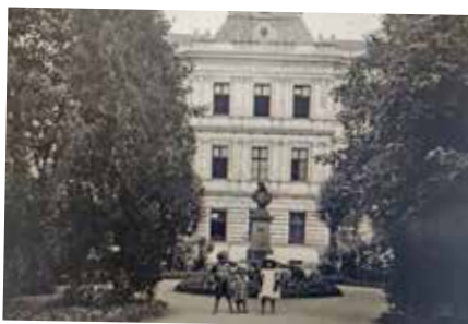
Měšťanská škola s bustou císaře Františka Josefa I.

Továrník a zároveň starosta Tomáš Baťa si uvědomoval důležitost školství a v roce 1925 přišel s velkorysou vizí rozvoje zlínských vzdělávacích institucí. Vyučování podle něj mělo být cílené především k potřebám praktického života. „Každý krejcar, který vydáme na účelné vybudování školy, se nám mnohokrát v životě vrátí, a to nejen na nevyočitatelných požitcích mravních, ale i na zvýšeném blahobytu, kterého dosáhneme,“ řekl Tomáš Baťa.