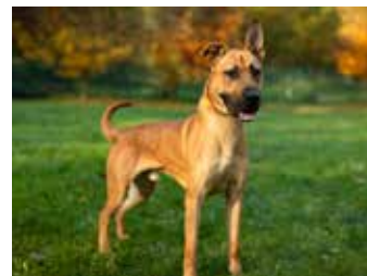
KENT / kříženec NO a dogy, 5 let, kastrováný, vhodný pro aktivního pejskaře, v útulku čeká 1,5 roku

u dalších zvířat. Děkujeme za podporu, zákroky jsou hrazeny z vašich darů. /red/