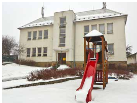
V budově je kromě depozitáře i knihovna.

Během února a března se vystěhuje z městské budovy v Jaroslavicích depozitář a kanceláře přírodovědného oddělení Muzea jihovýchodní Moravy ve Zlíně. Knihy, mikroskopy, počítače, poputují do 14. budovy v bývalém továrním areálu, kde bude nové sídlo muzea. Sbírky budou uloženy na hradě v Malenovicích a v nových depozitářích. Mimo jiné stěhovací firma odveze z Jarosla-