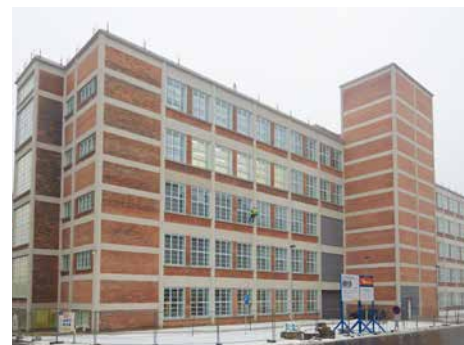
Část depozitáře se přesune do budovy 14.