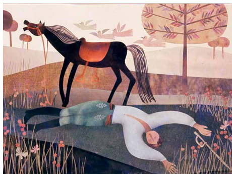
Vystřihovánka.