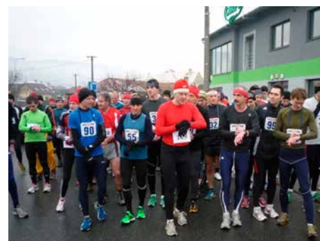
Štěpánský běh.

Celou sérii zakončí Silvestrovský běh, který se uskuteční v poslední den roku. Další podrobnosti, informace o seriálu, pravidla,