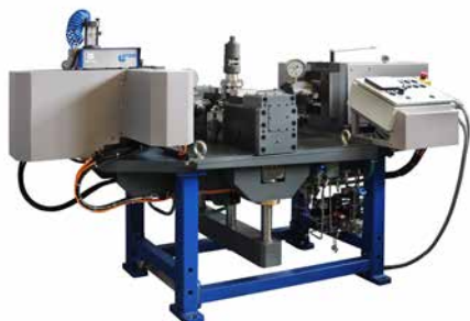
Produkt firmy Flow Tech.

Strojírenství má ve Zlíně tradici dlouhou už 110. let. Jeho úspěchy, současnost i perspektivy představí unikátní výstava, která se uskuteční v květnu a v červnu. Přípravy jsou v plném proudu a připojil se k nim i Magazín Zlín. Na jeho stránkách budete nacházet představení společností, které jsou v oblasti strojírenství pro město velmi důležité.