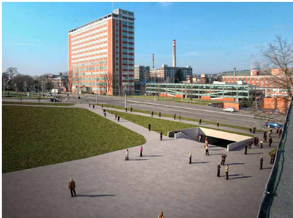
Dolní část náměstí Práce změní podobu. / vizualizace

O moderní informační rozhraní, Virtuální kiosek, rozšířila radnice dosavadní bezplatné předávání informací návštěvníkům Zlína pomocí systému Blueinfo. Ti se teď mohou pomocí WIFI sítě „Zlín“ nebo QR kódu připojit do Virtuálního kiosku města Zlína, který obsahuje přehledné stránky města Zlína upravené pro použití v moderních telefonech. Inovace tak rozšiřuje možnosti získávání informací i vlastníků mobilů, které nemohly být z technických důvodů službou Blueinfo osloveny. Do Virtuálního kiosku města Zlína může vstoupit každý návštěvník, který se pohybuje v okolí informačního střediska na radnici a má mobilní telefon umožňující připojení přes WIFI, případně přes aplikaci snímající QR kódy.