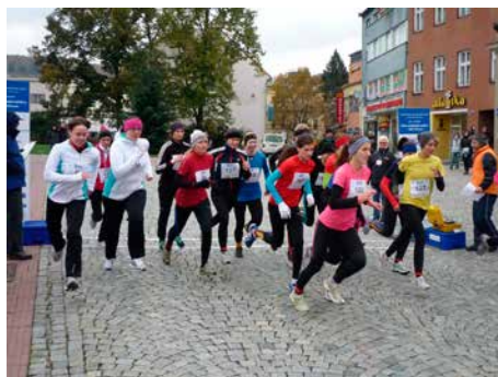
Rada závodů je přímo ve Zlíně.