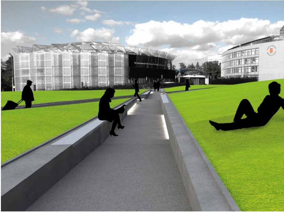
Gahurův prospekt bude příjemným místem k odpočinku. / vizualizace