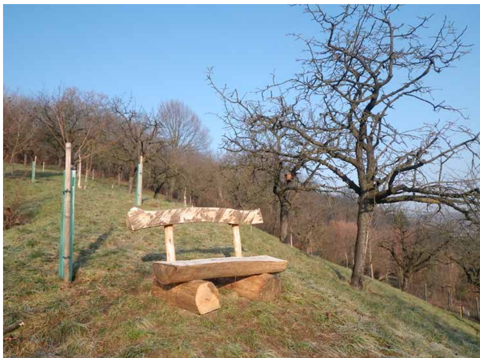
Projekt pomohl zatraktivnit městské ovocné sady.