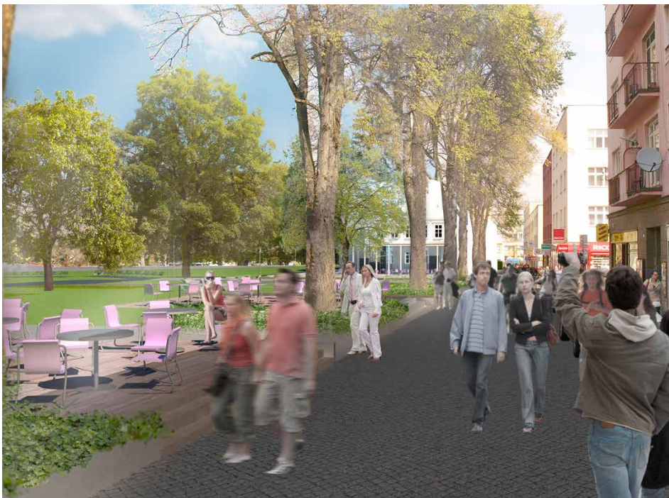
Park Komenského se více propojí s centrem města. / vizualizace

Proměna Gahurova prospektu – předprostoru Kulturního a univerzitního centra vyjde na více než dvě desítky milionů korun. Nejzásadnější změnou bude vytvoření systému chodníků v jeho spodní části, který propojí náměstí Práce se sídlem Filharmonie Bohuslava Martinů a rektorátem univerzity. Jak už avizovaly úvodní řádky tohoto článku, stanou se i místem vhodným pro relaxaci a odpočinek. Zdeněk Dvořák