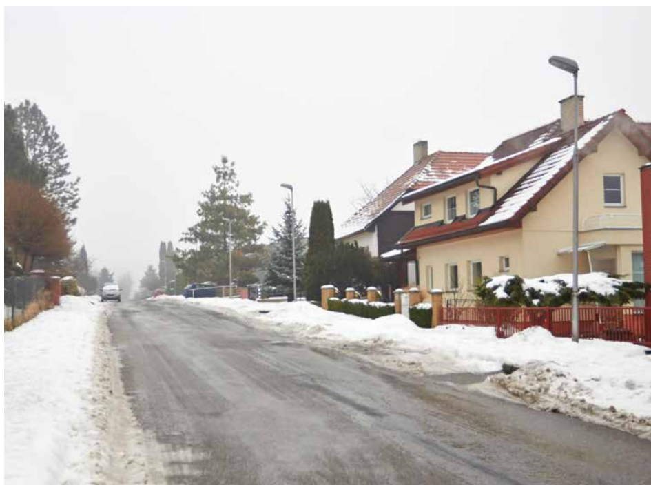
Na Nivách bude maximální rychlost omezena na 30 km a bude zde platit pravidlo pravé ruky.

umístěny ve směru od Vršavy před prvními obytnými domy zpomalovací poštářky. Těmito opatřeními chce radnice dosáhnout zklidnění dopravy v celé lokalitě. „Opakovaně nás o to žádají lidé, kteří na Nivách bydlí. Oprávněnost jejich požadavků nám potvrdil i dopravní průzkum. Jednoznačně ukázal, že tudy řidiči objíždějí kolony na ulici Sokolská a při průjezdu Nivami často překračují rychlost. A tomu je potřeba zabránit,“ sdělil 1. náměstek primátora Jiří Kadeřábek , který má na starosti dopravu. [dvo]