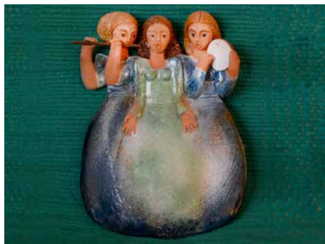
Keramická plastika.

carsku (Basilej), Finsku a na Slovensku. V keramice autorka kombinuje techniku modelování, kombinovanou s prořezáváním. Vystřihovánky mají pak základ v lidové výtvarné technice zdobení oken v Luhačovicím Zálesí. Tuto techniku využila také u návrhů obalů CD a plakátu Hradišťanu, CD Kašava, CD Ondráš, a plakátech (například Krajský festival pěveckých sborů).