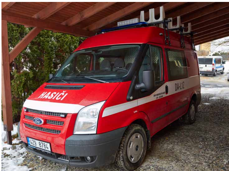
Hasičům ve Velíkové slouží nový vůz.