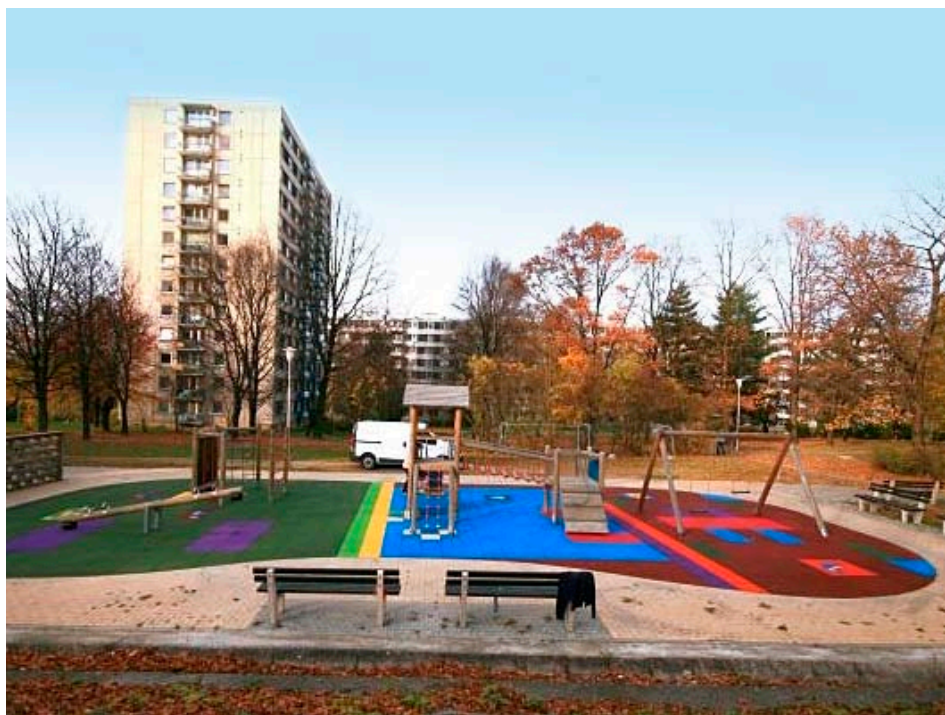
Dětské hřiště na sídlišti Podhoří

občanů a bylo řešeno přes 100 podnětů, které se ve většině případů týkaly údržby a oprav chodníků, komunikací a veřejného osvětlení, odvozu černých skládek, aj. K informovanosti občanů na Podhoří přispívají také tři vývěsní skříňky, které jsou umístěny v Intersparu, u pošty na sídlišti Podhoří a na konečné zastávce MHD č. 4. Především jsou zde vyvěšovány aktuální informace a oznámení o dané lokalitě, usnesení Rady a Zastupitelstva města Zlína. V únoru letošního roku se uskutečnil v Domě seniorů a zdravotně postižených na ulici Svat. Čecha již čtvrté veřejné setkání zástupců Rady města Zlína a Magistrátu města Zlína s občany místní části. Zápisy včetně plnění úkolů jsou zveřejněny na internetových stránkách města www.zlin.eu/podhori v sekci veřejná setkání.