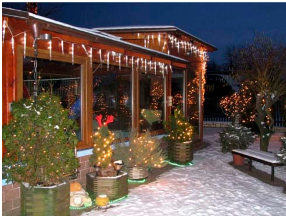
II. kategorie – výzdoba rodinných domů

Z důvodu zahájení prací na výstavbě parkovacího domu od ledna tohoto roku nemohou řidiči zaparkovat svá auta na parkovišti před budovou ředitelství nemocnice. Omezení v důsledku stavby se však dotkne také chodců. Od 10. února bude pro pěší zřízen provizorní chodník vedoucí od vozovky na Havlíčkově nábřeží do budovy ředitelství z jižní strany. Dokončení prací je plánováno na 30. listopad 2010.