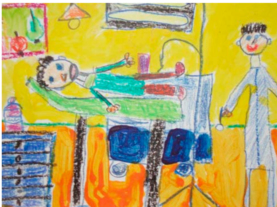
Zubní ordinace / reprodukce kresby dětí

Na II. stupni ZŠ bylo uskutečněno 33 přednášek dentálních hygieniček. Průměrně se každé přednášky zúčastnily 2 třídy. Celkem si zajímavé a poutavé přednášky vypořechlo asi 1 500 žáků. Doufáme, že tyto přednášky z oblasti zubní hygieny alespoň trochu oslovily naše starší žáky a budou se některými odbornými radami ve svém životě řídit. [ošzatv]