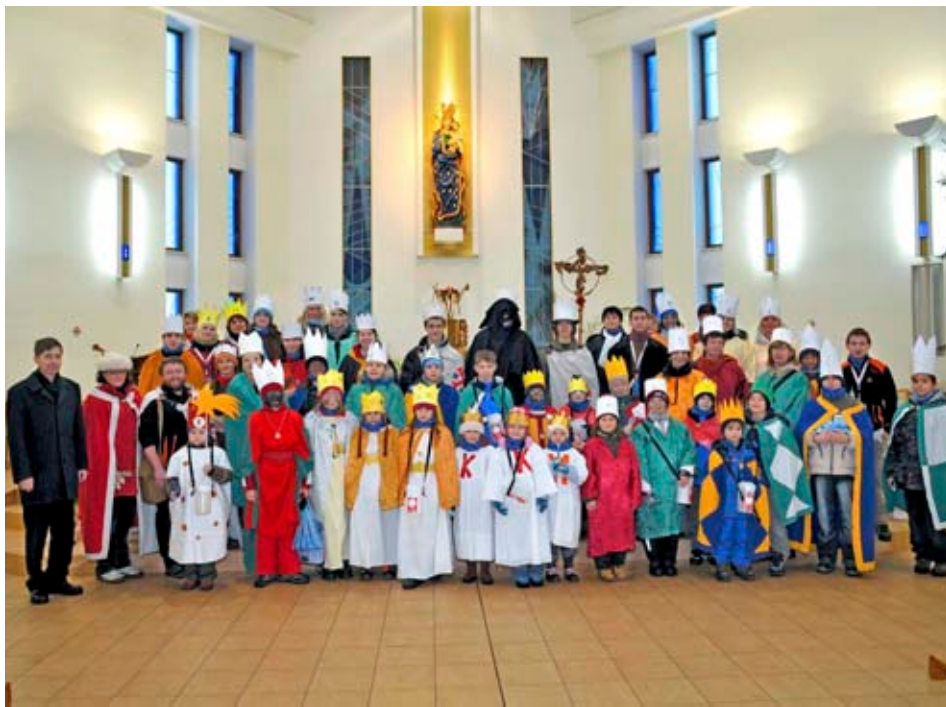
Koledníci shromáždění v kostele P. Marie Pomocnice křesťanů na sídlišti Jižní Svahy