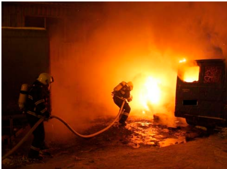
Ilustrační foto