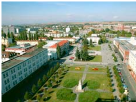
Slovenské město Partyzánske

Partnerství statutárního města Zlína a Nadace Tomáše Bati při přípravě, koordinaci, propagaci a realizaci projektu „Baťovská města v evropském prostoru“ schválili zlínské radní.