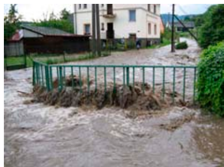
Povodeň ve Skorošicích