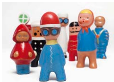
Hračky z Gumotexu Břeclav

Její vůbec první retrospektiva nezapomíná ani na její ranou tvorbu – pískačké gumové postavičky a zvířátka, které tvořila od poloviny padesátých do poloviny šedesátých let pro výrobu v Gumotexu Břeclav. Jméno návrháčky je spjata především s firmou Fatra Napajedla. [tb]