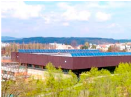
Na střeše lázní přibily kolektory

Od května 2005 je Zlín spolu s třemi dalšími evropskými městy účastníkem mezinárodního projektu Energy in Minds! (Mysleme na energii!). Jeho cílem je prokázat na komunální úrovni, že lze do roku 2010 dosáhnout výrazného snížení závislosti na fosilních zdrojích energie (uhlí, ropě a zemním plynu), aniž by se to jakkoliv dotklo životní úrovně obyvatel či ekonomického rozvoje města. Naopak: občanům a institucím má program přinést úspory ve výdajích za energii, místním firmám pak zakázky při zateplování budov a jejich vybavení moderními technickými systémy, využívajícími obnovitelné zdroje energie. Investiční aktivity se týkají především tzv. demonstrační oblasti, orientačně se jedná o místní části Louky a Podhoří.