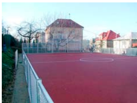
Hřiště v Jiráskově ulici