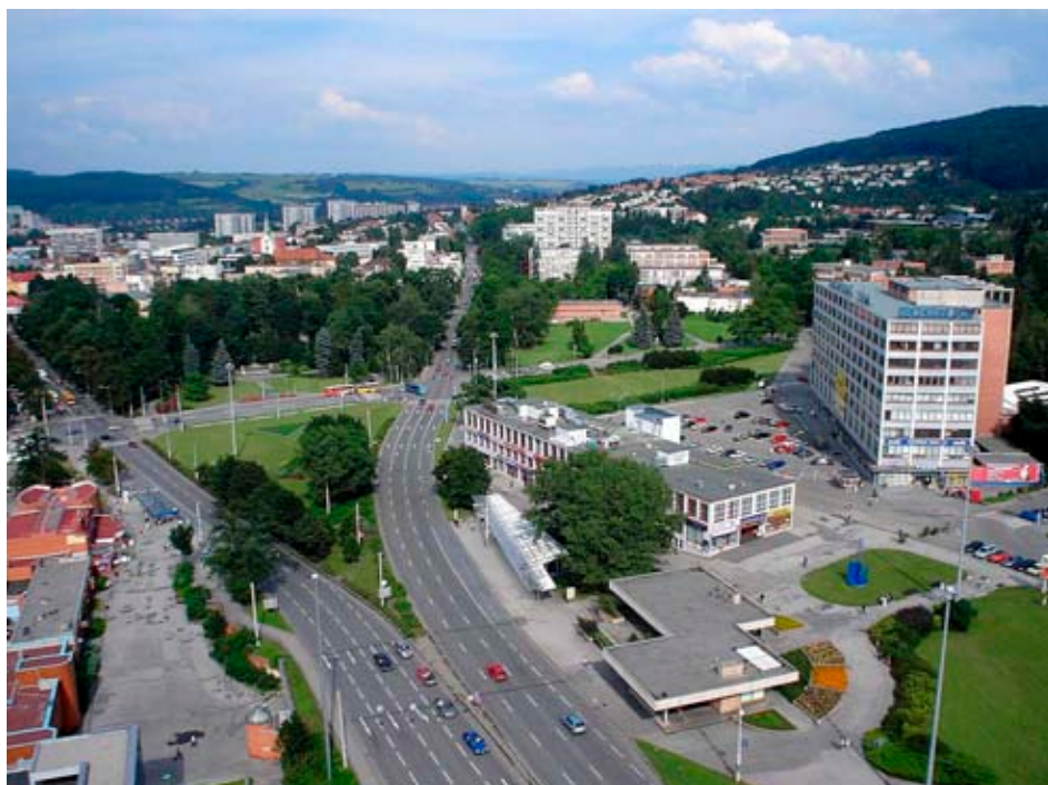
Centrum Zlína při pohledu z 21. budovy továrního areálu

Začátek nového roku byl zároveň i začátkem činnosti Útvaru hlavního architekta (ÚHA) v novém desetiletí. Ze tří architektů v roce 2000 jsme se rozrostli v roce 2007 na 10 pracovníků. Zabýváme se dnes i pořizováním územně plánovacích podkladů (územních studií) a dokumentací (územní plány, regulační plán) a územně analytických podkladů.