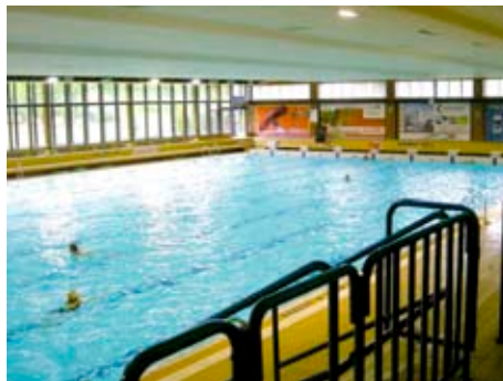
Městské lázně ve Zlíně

Tepelný výkon jednoho tepelného čerpadla činí 15,8 kW. Za předpokladu celoročního kontinuálního provozu obou jednotek tedy jejich tepelná čerpadla dodají vzduchu v hale a bazénové vodě cca 270 MWh tepelné energie ročně, o kterou bude možno snížit odběr tepla z parovodního systému. Protože úspory energie dosahují hodnot stanovených podmínkami programu EU Concerto, získal nový větrací systém nárok na dotaci z tohoto programu. [red]