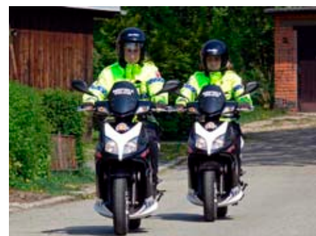
Motorizovaná hlídka MP