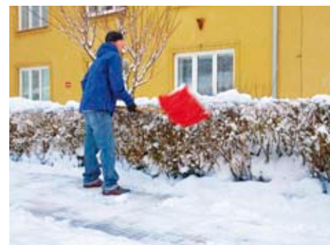
Do úklidu sněhu se zapojili i občané

ky nepůjde zvládnout dostupnými pracovními silami a běžnými prostředky, budou pracovníci technických služeb provádět údržbu jen vybraných nejdůležitějších lokalit vedených v I. a II. pořadí důležitosti, a to opakovaně. To znamená, že po zajištění sjízdnosti a schůdnosti komunikací v I. pořadí důležitosti se bude přecházet k zajištění komunikací II. pořadí důležitosti. Tím, že občan dobrovolně uklidí sníh z městského chodníku nacházejícího se před jeho nemovitostí, na sebe v žádném případě nebere odpovědnost za škodu způsobenou jiné osobě pádem na takovémto chodníku. Tuto odpovědnost má podle zákona o pozemních komunikacích město. Současně děkujeme všem, kteří odklízejí sníh z chodníků, a tak v krátké době usnadní pohyb sobě i svým sousedům. [mm]