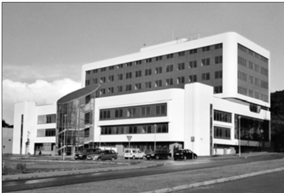
Budova současného sídla Okresního soudu ve Zlíně a Krajského soudu v Brně - pobočka Zlín-Louky.