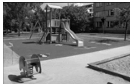
Dětské hřiště na ul. Dětská.

Začnu tou čistotou. Určitě si většinou stěžují ti občané, kteří nejsou spokojeni s nějakým neutěšeným zákoutím. To se jistě může stát a pokud se jedná o pozemek města, snažíme se na upozornění okamžitě reagovat. Je potřeba mít na mysli, že za soukromé pozemky nemůžeme nést město odpovědnost. Pokud ale někdo paušalizuje, je velmi nespravedlivý. Naopak dostáváme množství dopisů ze strany turistů a většina je směřována právě na chválu čistoty a udržované zeleně. Myslím, že odbor zeleně odvádí obrovský kus práce. Stačí jen namátkou vzpomenout na zelené plochy pokryté na jaře narcisy, upravené parky a květinovou výzdobu města. Nebo na drobná sportoviště a dětská hřiště, která se daří postupně obnovovat. Z výsledků práce máme velkou radost, jako například z úrovně zpracování povrchu dětských hřišť na ul. Dětská a ul. Sv. Čecha.