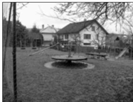
Hřiště ve Velíkově pro nejmenší děti.

V obci funguje pobočka knihovny, která je otevřena každý čtvrtek.