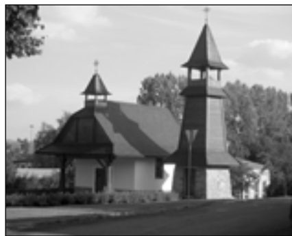
Kaplička zasvěcená věrozvěstům Cyrilu a Metodějovi.

Ve Velíkově jsou 3 hřiště ke sportovnímu využití - u budovy kanceláře místní části hřiště s průlezkami a travnatou plochou pro nejmenší děti, na Horním konci antukové hřiště, které je využíváno především mužskou částí obyvatelstva, a fotbalové hřiště v Chrástě, kde se každoročně pořádá fotbalový turnaj "Ženatí proti svobodným".