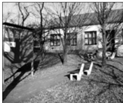
Budova kanceláře v místní části Velíková.

Velíková bývala poměrně malou obcí o rozloze cca 360 ha, v nadmořské výšce 350 m nad mořem. V roce 1834 měla 33 domů a 213 obyvatel, v roce 1900 měla 54 domů a 305 obyvatel. K 1. 3. 2001 měla již místní část Zlín - Velíková 155 domů s 474 obyvateli. V roce 2007 je to 544 obyvatel, z toho 271 mužů a 273 žen, průměrný věk činí 43,7 let, stojí zde 179 domů a další jsou rozestavěny. K 1. 1. 1980 byla Velíková připojena ke Zlínu (tehdejší Gottwaldov) a stala se městskou částí.