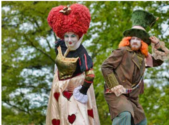
Bavit budou pohádkové postavy.

odměnit jinou nabídkou programu. Pozvali jsme artisty a chůdaře z Cirkusu trochu jinak, opět se můžete těšit na show s Brdíkem, i tentokrát zahraje pro děti kontaktní pohádku Divadlo Scéna,