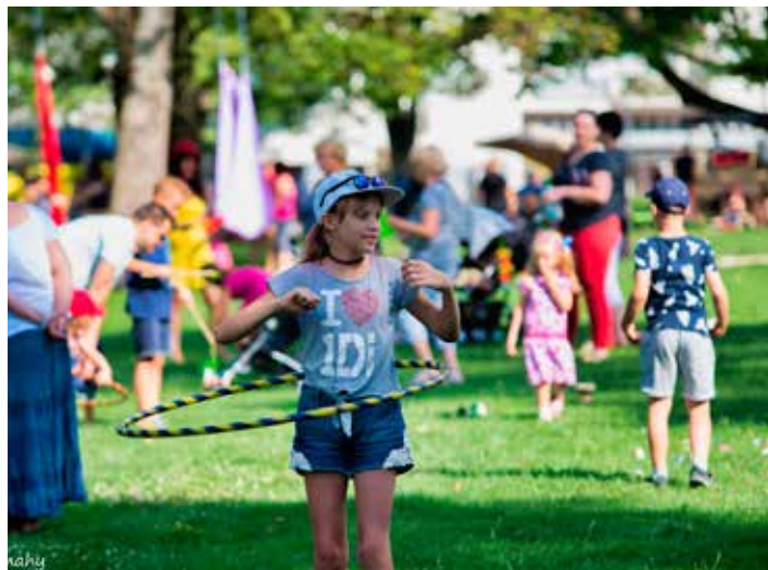
Bude možné si vyzkoušet i různé dovednosti.

Téměř 40 let už slavíme svátek hudby, tentokrát se pořadající Hudební kutloch rozhodl pozvat i zajímavé hudební hosty a nabídnout hudební zážitky napříč žánry a věkovými kategoriemi. Před zámekem navíc bude tvořivá dílna pro děti a malování na obličej.