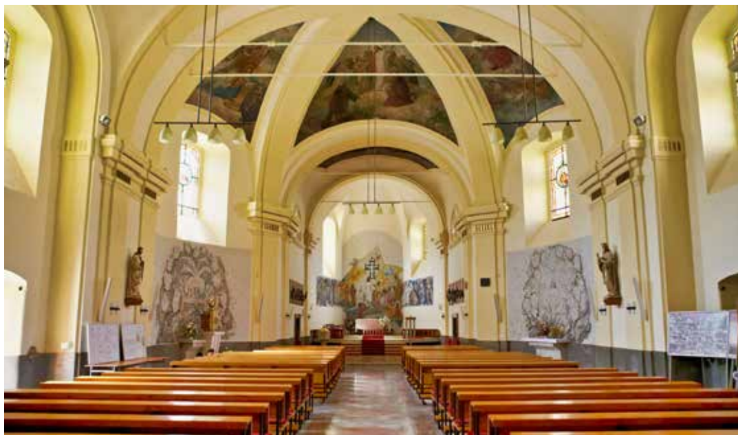
Kostely mají svou jedinečnou atmosféru.