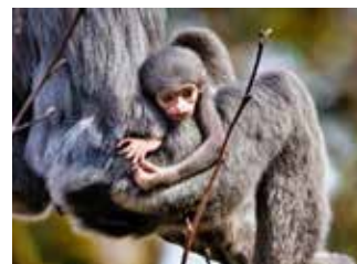
Gibon stříbrný.

Již podruhé vám nabídneme speciální řetězové prohlídky zámku Lešná. Partnerem této akce se stalo Gymnázium a Jazyková škola s právem státní zkušky Zlín. Studenti, kteří se v průběhu školního roku seznamovali s historií Lešné a s příběhy bývalých majitelů, hraběcí rodiny Seilern-Aspang, budou v neděli 23. června od 9.30 do 16.30 čekat na návštěvníky zámecké expozice. Přijďte se podívat, jak mladí zvládnou roli průvodců. [buj]