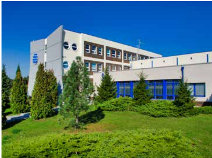
Úpravná vody Klečůvka se otevře veřejnosti.