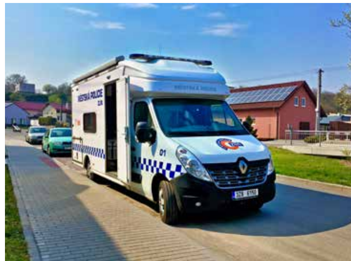
Mobilní služebna slouží dle pravidelného rozpisu.

A kdy a kde tedy bude mobilní služebna městské policie přistavena? Každé první pondělí v měsíci bude v době od 13 do 17 hodin přítomna na Velíkové a každé druhé pondělí v měsíci na Mladcově. V Loukách zastihnete strážníky každé první úterý v měsíci a každou druhou středu v měsíci budou zajíždět do Lhotky-Chlumu. První čtvrtek v měsíci bude mobilní služebna umístěna v Jaroslavicích, druhý čtvrtek v měsíci na Klečůvce, třetí čtvrtek připadá na Lužkovice a konečně čtvrtek na Salaš. O plánované přítomnosti strážníků v příměstských částech se lze také informovat v kancelářích místních částí. [pj]