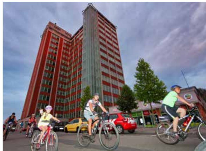
Navzdory kopcovitému terénu je ve Zlíně cyklistika populární.

Otrokovice a okolí se budou označovat výsledky a předávat hodnotné výhry od lokálních partnerů dne 6. června v Otrokovících na náměstí 3. května. Připravuje se i zajímavý kulturní program. [red]