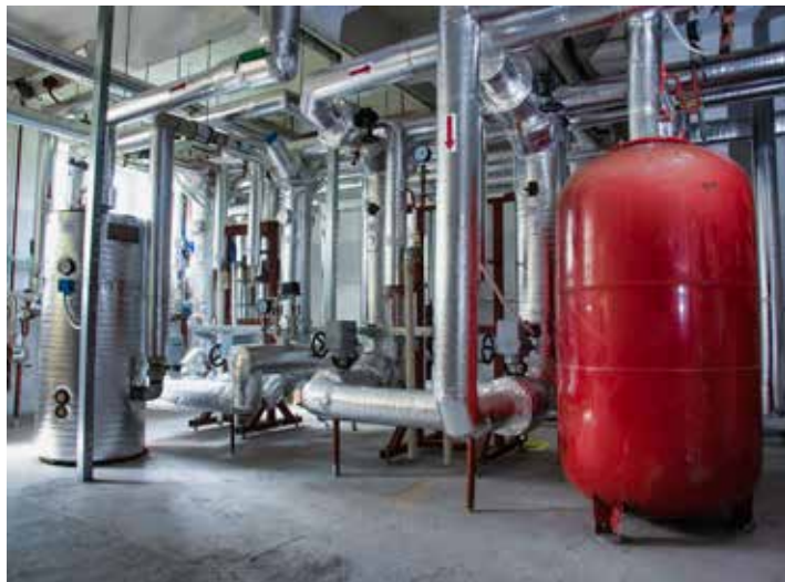
Topná sezona se obešla bez poruch.

Pokud průměrná denní teplota nesestoupí pod 13 stupňů dva dny po sobě a v těch následujících se neočekává ochlazení. Takové jsou legislativní podmínky pro ukončení topné sezony. V podmínkách Zlína k tomuto okamžiku dochází zpravidla v průběhu května. Přesto, že i v těchto dnech se akciová společnost Teplo Zlín stále stará o tepelnou pohodu svých zákazníků, už nyní lze končící sezonu hodnotit – spolehlivost na 100 procent. Odběratelé, tedy každá druhá zlínská domácnost, navíc za komfort zaplatí díky mírnější zimě méně než v minulém topném období.