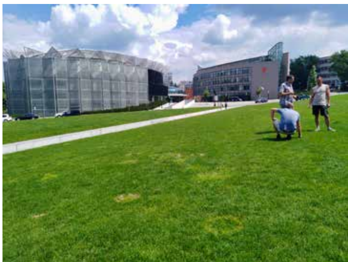
Trávník trápily i plísňe. / foto: MMZ

„Vzhledem k typu použitého záslahu v rámci rekultivace trávníků je nyní nutné pro trávník období klidu po dobu 3 týdnů. Prosíme veřejnost, aby toto respektovala, čímž si budeme moci všichni zanedlouho užít lepší a po několika let odolnější trávníky,“ vysvětlila Zuzana Hegmonová , zahradní architektka Odboru městské zeleně. [fab]