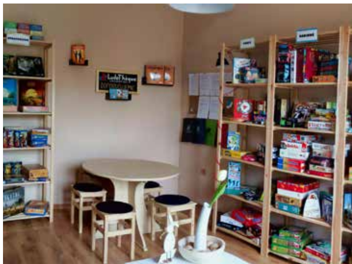
Deskových her je k půjčení opravdu hodně.