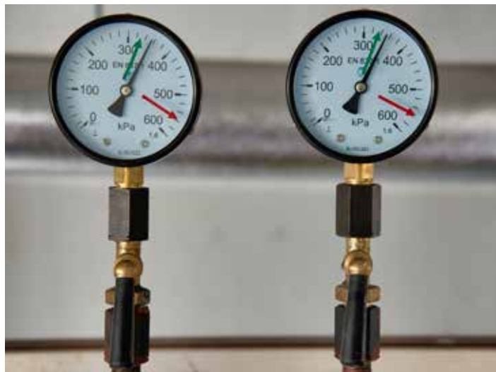
Centrální zásobování teplem je spolehlivý zdroj.

Zákazníky městské společnosti Teplo Zlín navíc může „hřát“ i další fakt – využívají služeb nejvíce ekologického způsobu dodávek tepla a teplé vody. To, že zhruba polovina všech domácností ve Zlíně je napojena na systém centrálního zásobování teplem, se projevuje na výrazné prevenci smogových situací. „Pro ilustraci uvádíme často jeden příklad. Jeden rodinný dům vytápěný starším kotlem na tuhá paliva vypustí do ovzduší stejné množství prachu jako teplárna při výrobě tepla pro 300 bytů,“ doplňuje Jaroslav Kovařík . [ljn]