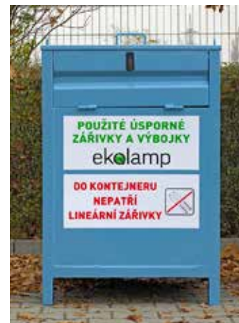
Zářivky obsahují rtuť.

Ze sběrných míst EKOLAMP sváží zářivky k ekologické recyklaci, při které jsou z nich pro opětov-