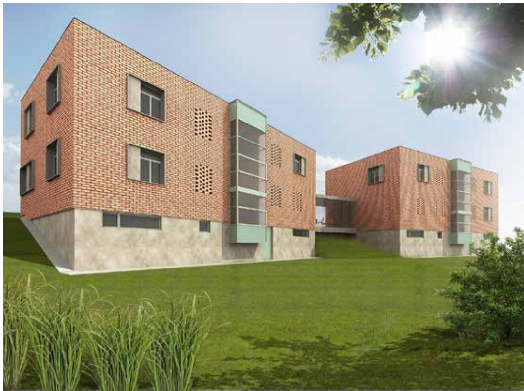
Bytové domy mají svým vzhledem zapadnout do stávající výstavby. / vizualizace: MMZ

V přípravě výstavby družstevních bytů v poslední době výrazně pokročilo město Brno. Vyrůst by zde mohlo v následujících letech až několik stovek nových bytových jednotek. Postup, který v jihomoravské metropoli zvolili, je podle rady města vhodný i pro Zlín. „S kolegy z Brna jsme proto v kontaktu. Bude určitě dobré využít dobré praxe odjinud. Je velká šance, že se tím vše u nás urychlí,“ uvedla náměstkyně primátora. [dvo]