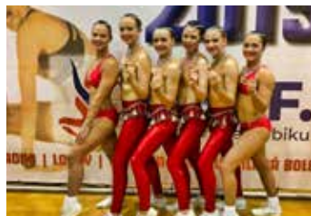
Aerobik Team Zlín.

Klub Aerobik Team Zlín byl pořadatelem celorepublikové soutěže 1. výkonnostní třídy ve sportovním aerobiku a fitness týmech FISAF.CZ, která se ko-