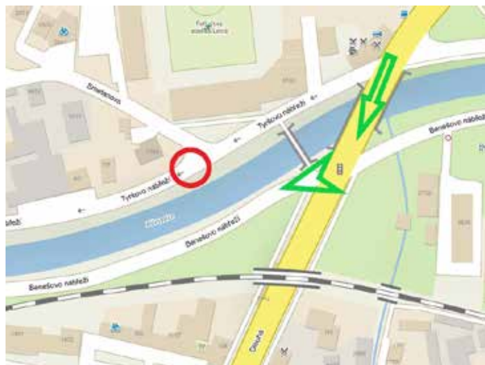
Objížděná trasa je vedena po Benešově nábřeží.

Cílem rekonstrukce je kromě obnovy uličního prostoru také zajištění větší bezpečnosti a s tím související propojení páteřních úseků cyklostezek ve městě. Nedílnou součástí celé rekonstrukce je umožnit místním občanům i lidem, kteří dojíždějí z okolních obcí, využít bezpečnou, rychlou a ekologickou formu dopravy. [fab]