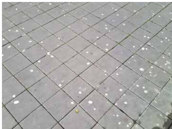
Žvýkačky na chodníku města.

Pavel Sekula , nezávislý zastupitel zvolený za SPD