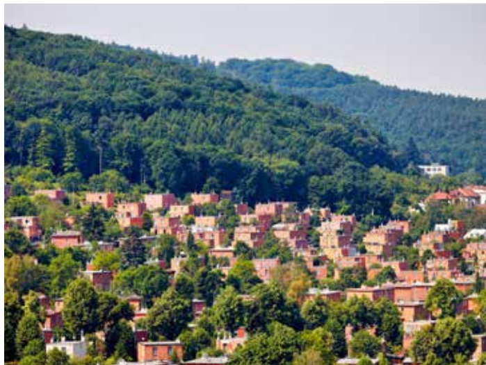
Ve čtvrti Letná již působí Centrum služeb a podpory.

A co bych chtěl sdělit lidem, kteří z nás mají strach? Ne, my nejsme nebezpeční. Nebezpečné z nás dělají jen média.