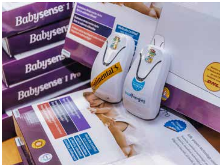
Nemocnice má k dispozici další monitory dechu.