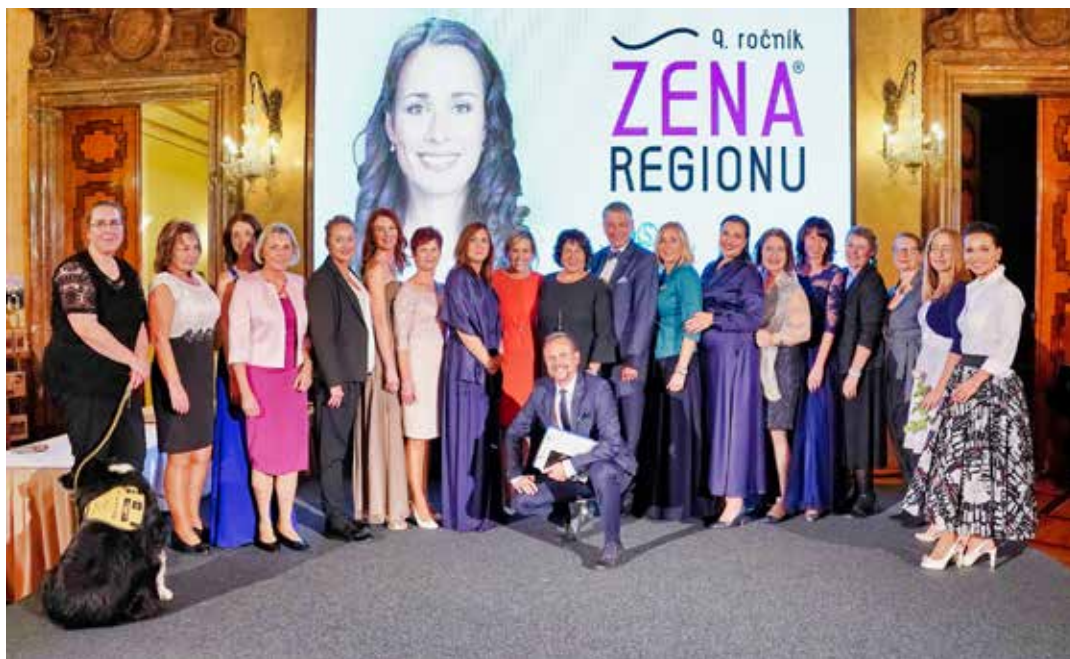
Nominovat Ženu regionu můžete do 14. června