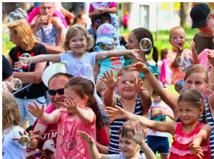
Akce jsou nejčastěji zaměřeny na rodiny s dětmi.

Krásný program nabídnou procházky s odborníky z architektury z cyklu procházek po Zlíně: Potkej Zlín. Lákají vás šifry? Pak zpozorněte – šifrovací akce se skrývá pod názvem Luštěniny! Krásnou rodinnou akci si připravila Unie Kompas, za pozornost stojí také pro veřejnost (od 6 let) otevřený koloběžkový biatlon či vždy velmi úspěšné hudební rozloučení