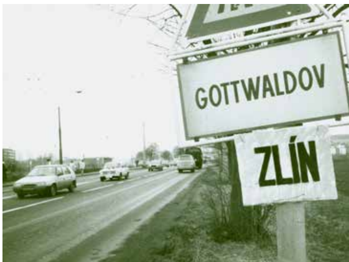
Prosinec 1989.