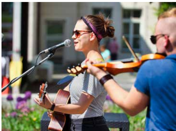
Na akcích Živého Zlína nechybí ani zpívání.

Hned první červnová akce vás láká na Jižní Svahy – pod názvem Živý Jižňáky se skrývá událost, kde se pobaví celé rodiny. Pro děti ZUŠ Zlín – Jižní Svahy připravila tvořivou výtvarnou dílnu i program, kde se představí především hudební čísla – a tak se můžete těšit třeba na teenagerskou kapelu a popové i rockové pecky, ale také výlety do jazzu či klasiky. V parku Komenského se pak ještě několikrát setkáte s pouličními muzikanty a Živý Zlín pro vás připravil například pouliční šicí dílnu s Retrace či workshop cirkusových dovedností. Vítány jsou děti i dospělí!