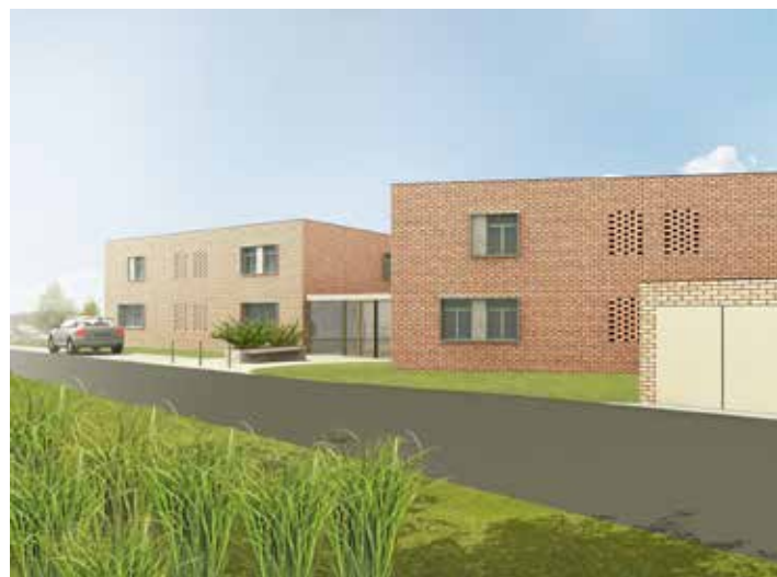
Jde celkem o 11 bytů. / vizualizace: MMZ

Také podle psychiatra a zlínského zastupitele Pavla Konečného se lidé z Letné nemusí nájemníků nových bytů obávat. „Podstupují léčbu, berou léky a jsou pod pravidelným lékařským dohledem. Nejsou tedy nebezpeční. Více bychom se měli bát lidí, kteří konzumují ve velkém množství alkohol,“ uvedl během projednávání v zastupitelstvu. Tvrzení, že by mohli být klienti léčeni se schizofrenií