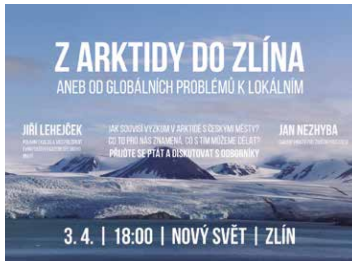
Přednášku zpestří fotografie z cest.

zajímavým tématem. Plánujeme pozvat do Zlína také další hosty z řad odborné veřejnosti, nejen z oblasti vědy a výzkumu ale také z dalších oborů. Chceme tak otevírat témata, která se přímo týkají života nás všech,“ dodává Irena Drofová , koordinátorka projektu ve Zlíně. [red]