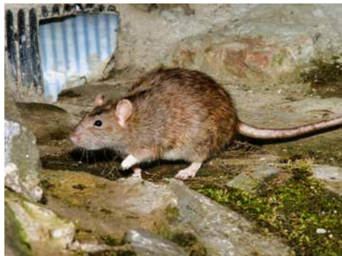
Deratizace je zaměřena na hubení potkanů.

- Montáž nového satelitu u Vás zdarma – dostanete: parabolu, LNB, držák, koaxiální kabel a technik u Vás vše provozní a máte DVB-T2 VYŘEŠENO! - Zvýšil se Vám na satelitu servisní poplatek? – Přejděte, poradíme jak, je to jednoduché a zdarma! Tel. 778 527 899, www.satelitnidotace.cz