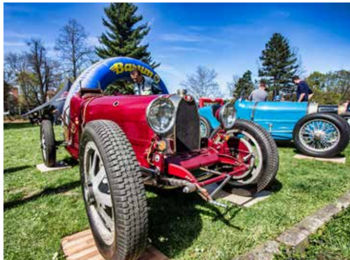
Výstava nabídne opravdové skvosty.

měly u široké veřejnosti praktické ukázky záchranných složek, které se opět chystají na náměstí před radnicí. Rozlehlý park kolem zámku opět obsadí nablýskané automobily i motocykly, chystáme jak historické veterány, tak závodní