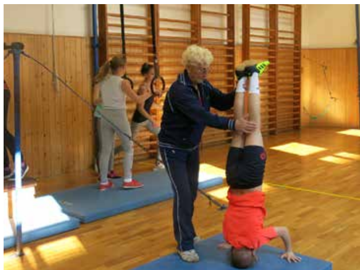
Bývalá Sokolka předává dětem lásku ke sportu.

Mně velice vadí, že si neváží jídla. My jsme celou válku měli velký nedostatek jídla. Naštěstí v ulici bydlel řezník, který nám i přes zákaz nechával polévky ze zabíjaček, které dělal pro Něm-