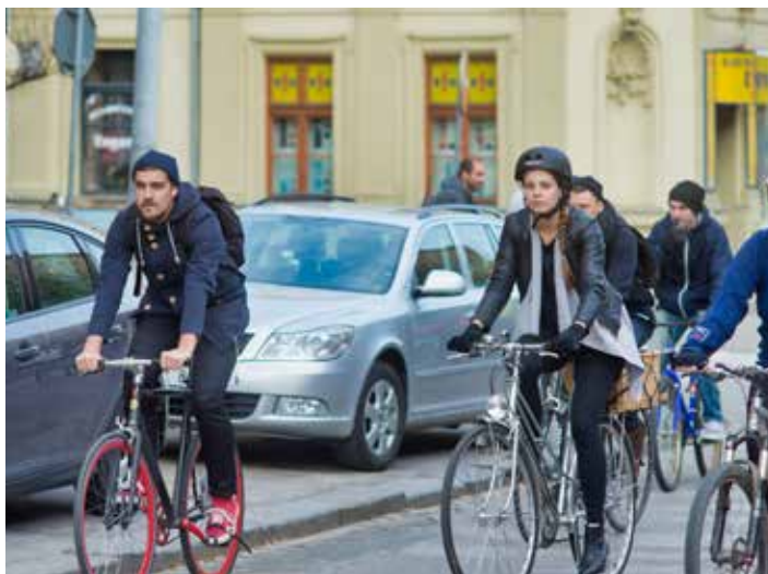
Projekt si získává stále větší pozornost.