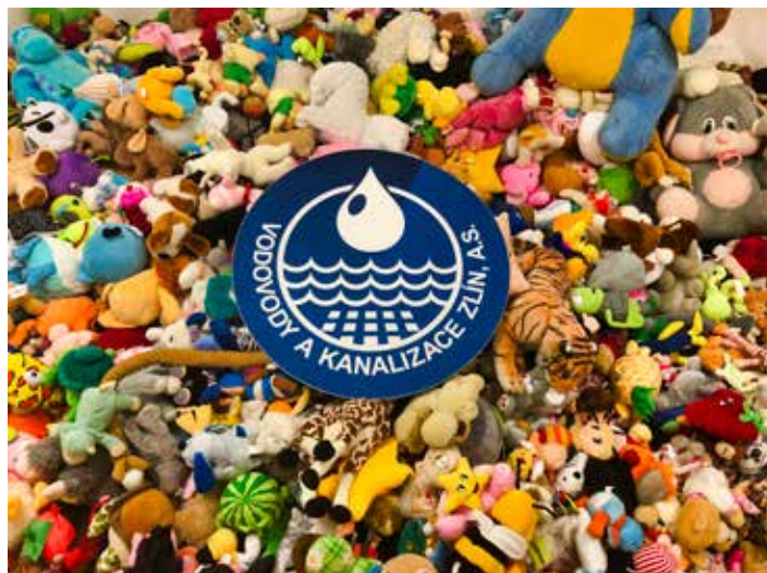
Plyšáci od VaK Zlín budou pomáhat.

Téma ekologie je pro VaK prioritou. Právě z toho důvodu dokončujeme rekonstrukce dvou čistíren odpadních vod za 80 milionů korun – v Luhačovicích a v Kašavě. Co se týká pitné vody, dokončíme v letošním roce jednu významnou akci přesahující hranice regionu, a tou je posílení soběstačnosti a dostatku vody z našeho zdroje ve Štítně nad Vláří. Vodou z tohoto zdroje bude možno zásobovat Valašské Klobouky, Brumov-Bylnici, Štítnou nad Vláří, Jestřabí, Rokytnici a po připojení na síti i další obce regionu. Zrovna v tomto případě jde o technologicky špičkovou stavbu, kdy je tato metoda použita v našem regionu vůbec poprvé. Zjednodušeně řečeno do původního potrubí o průměru 150-200 mm je zataženo „složené“ nové polyetylenové potrubí, které se následně natlakuje párou, tím přilne a natvaruje se zevnitř na staré potrubí. Investujeme tak do naší budoucnosti, do zdrojů vody a do ochrany životního prostředí. Letos