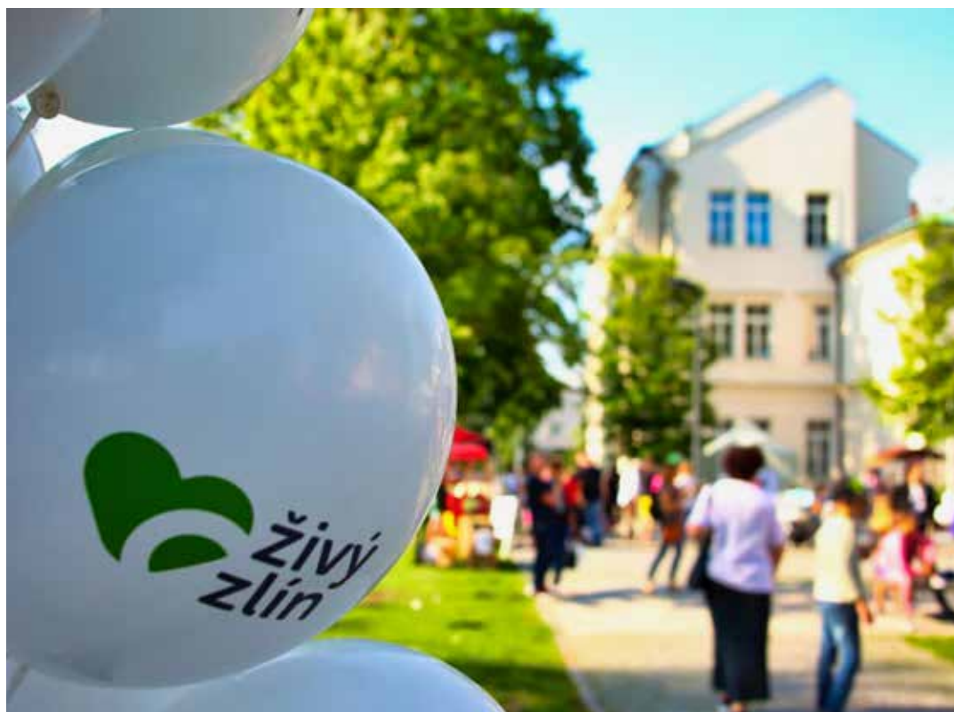
Živý Zlín je už pevnou součástí společenského života ve městě.

■ 74. výročí vypálení Ploštiny Statutární město Zlín se zúčastní květinovým darem vzpomínky na vypálení obce Ploština, ke kterému došlo 19. dubna 1945 (termín vzpomínky na webu města).