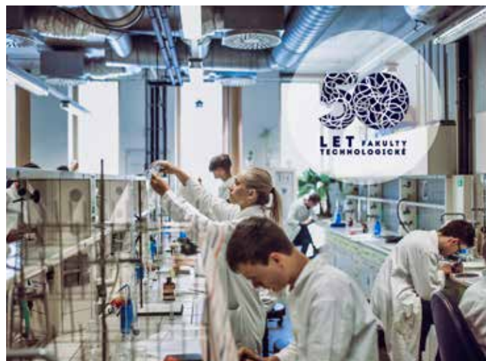
Výuka má na této fakultě dlouhou tradici.

Vstup na všechny akce je zdarma, na workshopy je však z kapacitních důvodů nutná rezervace. Blíží informace, časy konání a rezervační formulář jsou k dispozici na webových stránkách 50let.ft.utb.cz/zazij-vedu. [ft]