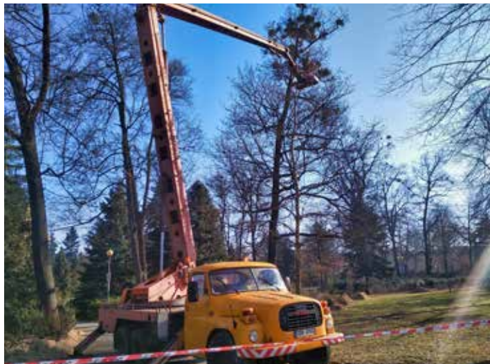
Preparát se aplikoval pomocí vysokozdvíže techniky.

V rámci této spolupráce byly ošetřeny cca tři desítky stromů. Použitá technologie působí postupné opadání asimilačního aparátu, pokles vitality a následující rozpad keřů jmelí bez poškození hostitelské dřeviny. Jmelí je cizopasník, který je napojen na cévní systém stromů, čerpá z nich vodu a v ní rozpuštěné látky. Dosud není jednoznačně znám účinný způsob likvidace jmelí. Mimo zkoušený boje se jmelím speciální technikou postřiku aplikační látkou se jmelí doposud muselo odstraňovat ořezem napadených větví. [fab]