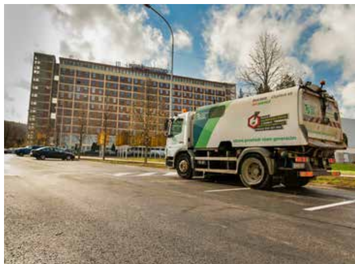
Blokové čištění se provádí od dubna do října.

Technické služby Zlín jsou plně vlastněny městem, zaměstnávají asi 200 pracovníků, kteří mají k dispozici bezmála stovku vozidel a strojů. Starají se o odpadové hospodářství, údržbu komunikací a chodníků, provoz parkovišť a veřejného osvětlení. [jln]