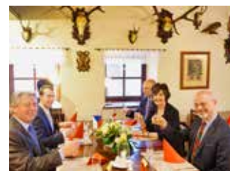
Pracovní oběd.