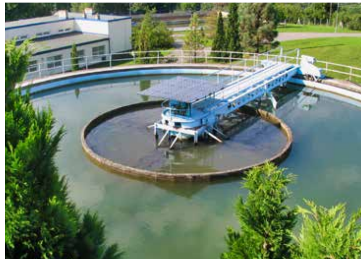
Objem peněz do vodohospodářské infrastruktury se daří navyšovat.

vody a kanalizace Zlín (VaK). Daří se tak navyšovat například objem investic do vodárenské infrastruktury.