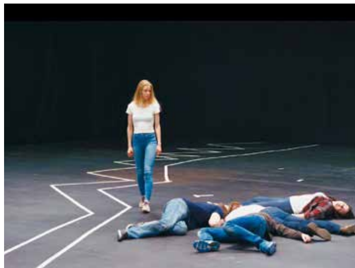
Kdo jsem a kam patřím? Festival hledá odpovědi.