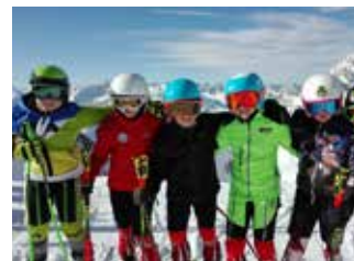
Zlínské naděje.