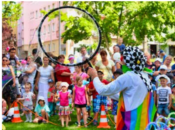
Projekt nabízí spoustu zábavy.