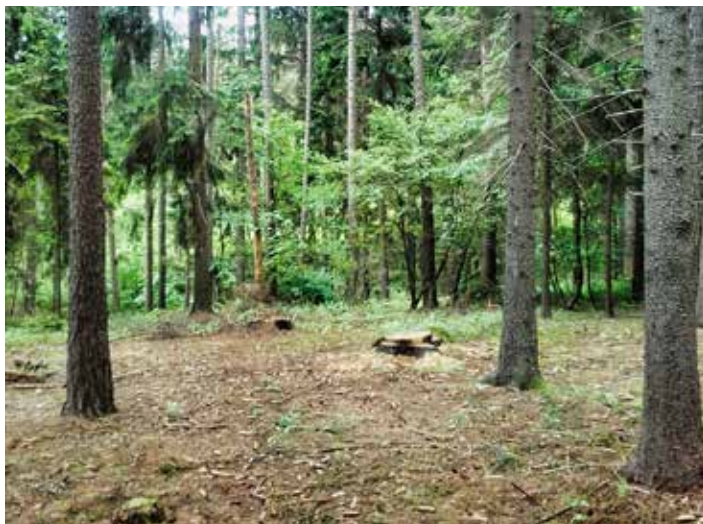
Lesy města Zlína se chovají k přírodě šetrně.