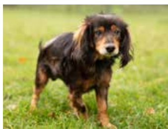
NERO II.

čeká bohatý program. Akci zpříjemní hudební vystoupení. Pro děti bude připraveno malování na obličej, soutěže a šikovné ruce zabaví tvořivé dílničky. K zakončení bude i občerstvení. Těšit se tak můžete na osvěžující pivo, špekáčky nebo oblíbené cupcakes. Chybět nebudou ani dárkové a upomínkové předměty. Veškerý výtěžek z akce bude předán útulku a rozzáří psí i kočičí oči. Návštěvníci mohou útulek podpořit i tím, že přinesou chovatelské potřeby či krmivo. [kv]