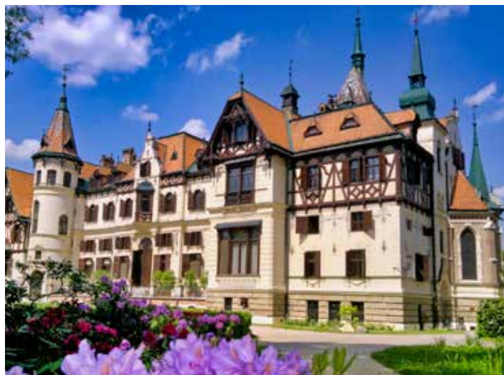
Zámek Lešná nabídne překvapení.

Nové překvapení nabízí zámek Lešná i pro školáky. „Loni byly velmi úspěšné prohlídky zámku s výukou etikety. Program byl primárně pro školy, v září jsme však téma etikety využili i při speciálních dětských prohlídkách pro veřejnost. Letos jsme pro děti z prvního stupně připravili zábavnou pátrací hru Zámecká šifra . S žádostí o rezervaci tohoto programu se již ozvaly desítky škol. Během prázdnin dětskou Zámeckou šifru nabídneme také veřejnosti,“ uvedla Romana Bujáčková ze Zoo Zlín. Zámecká šifra je pro všechny, kteří se bojí,