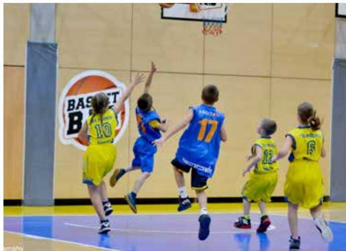
Utkání žáků SKB Zlín.

Každý rok, jak jsem již zmínil, zájem o basketbal v našem klubu SKB Zlín stále roste, a nejinak tomu bylo i letos. V klubu trénují jak dívky, tak chlapi. Všem bez rozdílu se snažíme vytvářet co nejlepší podmínky pro trénink a rozvoj dovedností. [red]