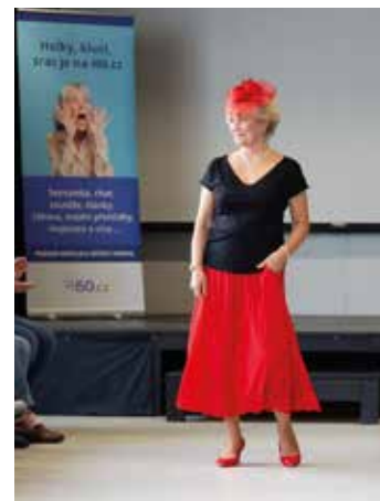
Modelky měly úspěch.