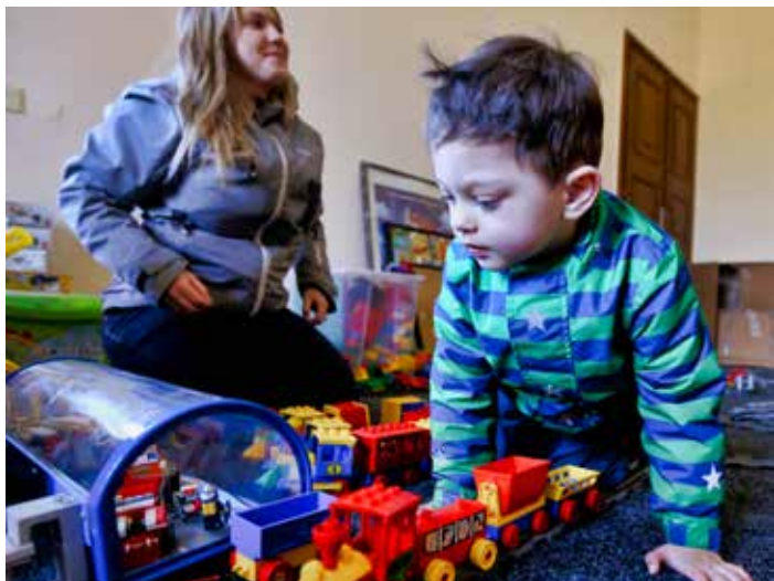
Stavebnice je určena i pro menší děti.

K výstavě Svět kostiček® je připravena herna pro školní kolektivy, zaměřená na rozvoj imaginace, jemné motoriky a kreativity dětí z mateřských a základních škol. Otevírací doba bude 8.00–12.00 a 13.00–17.00. Výstavu podpořilo statutární město Zlín. [vs]