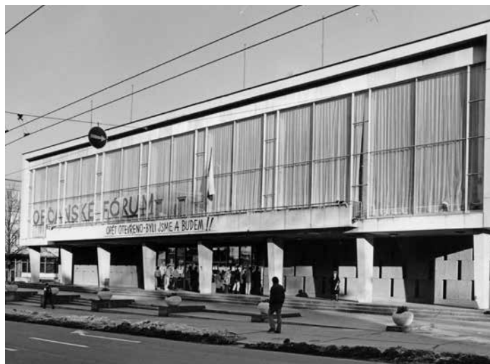
Divadlo byla významným centrem revoluce.

Městské divadlo Zlín Místo a čas konání: v 10:00 hod.,