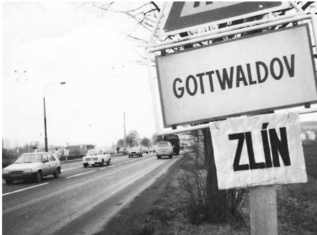
Příjezdová cesta do Zlína v revolučních dnech roku 1989.