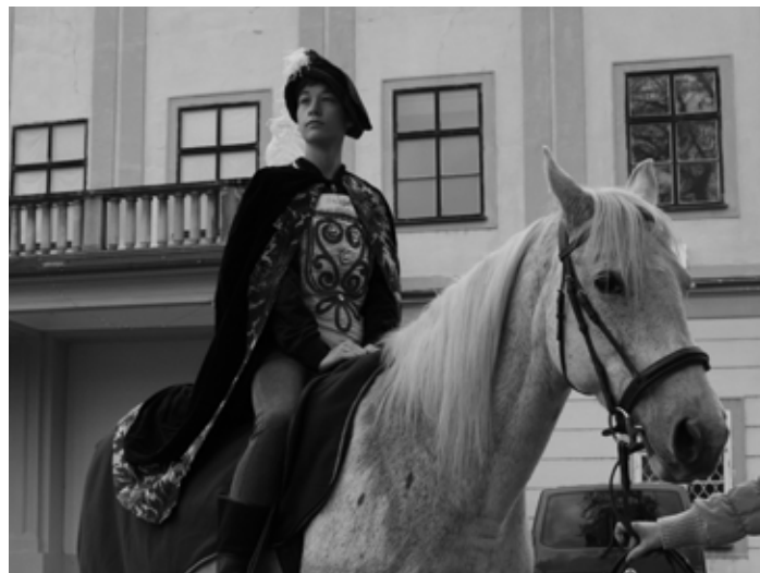
Martin přijede na bílém koni.

Potěšit se svátkem sv. Martina pak bude možné ještě o týden později – v sobotu 16. listopadu na náměstí Míru ve Zlíně. Můžete ochutnat mladá svatomartinská vína od významných moravských vinařů a pochutnat si na pečené huse a jiných husích specialitách. [red]