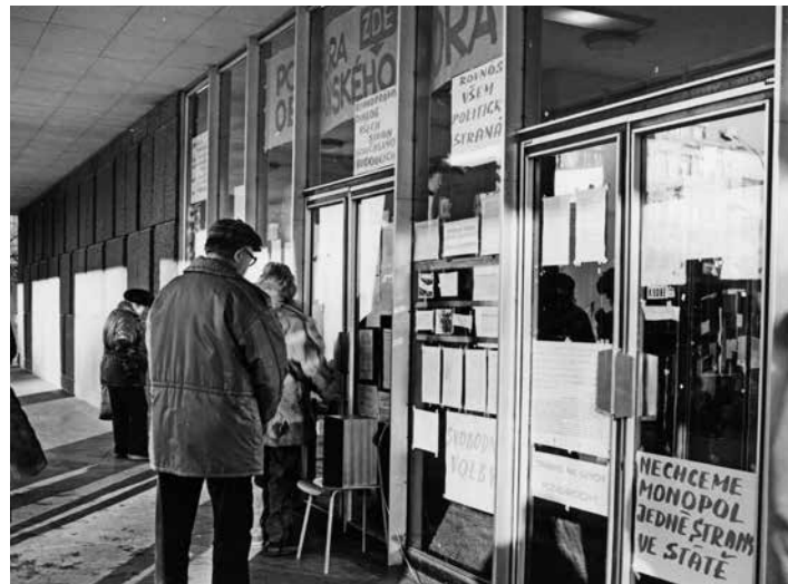
Vizuální projevy sametové revoluce na vchodu do divadla.

Organizátor: Iniciativa pro instalaci lavičky Václava Havla ve Zlíně Místo a čas konání: Obchodní dům ve Zlíně, 2. patro, od 20:00 hod. Debatu s hosty, navazuje na předchozí program organizátora