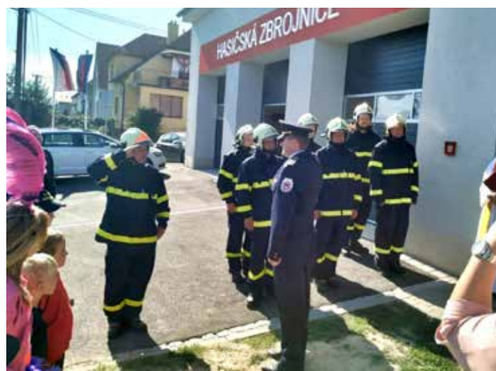
Slavnostní otevření hasičské zbrojnice.