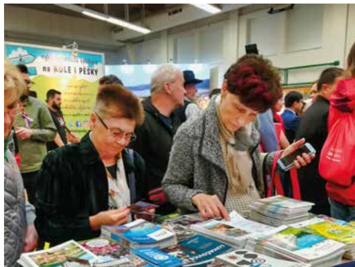
Na veletrh míří každý rok kolem 10 000 návštěvníků.

Nadace Dobrý anděl přijme průměrně 107 nových rodin měsíčně. Rodinám pomoc Dobrých andělů doporučují lékaři, sociální pracovníci, ale i lidé z jejich okolí. Hlavní podmínkou pro přijetí je fakt, že se jedná o rodinu s nezaopatřenými dětmi, v níž se rodič nebo dítě potýká s onkologickým onemocněním, nebo kde dítě trpí jinou vážnou nemocí. Žádost, kterou rodina vyplňuje, musí vždy potvrdit lékař. Přijetí do systému pomoci, a tedy i odeslání příspěvku, pak trvá pouhých pár dnů. [da]