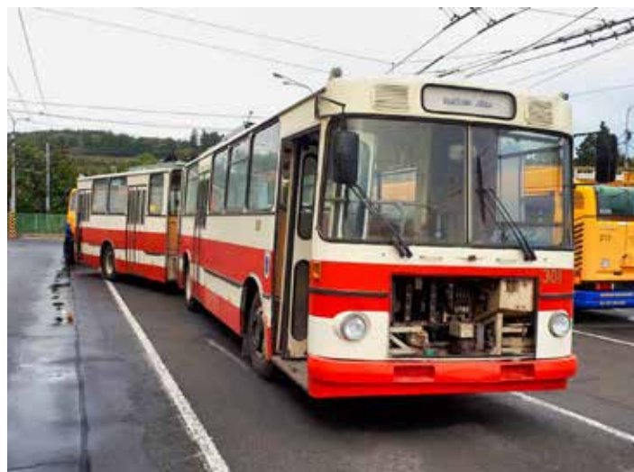
Historický trolejbus dostane ve Zlíně nový kabát.

Publikaci lze zakoupit za 50 korun na pracovišti předprodeje jízdenek v sídle DSZO v ulici Podvesná XVII. [dp]