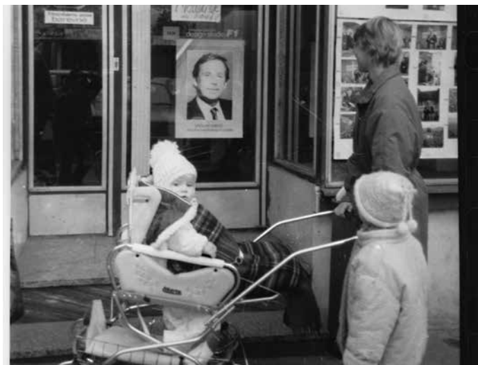
Dobová vzpomínka.

Zatímco někteří pronásledovaní zemědělci ještě dnes bojují o své majetky ukradené komunisty, zatímco někteří propuštění vězni z komunistických žalářů se domáhají svých práv, soudí jejich kauzy soudci, kteří stranické legitimace ani nestačili schovat, zaměňují soudcovskou nezávislost za nedotknutelnost a s bohorovným klidem odkládají kauzy a soudí několikrát za sebou stejné případy po odvolání, vyhlašují stejné nebo opačné rozsudky nezbajíce nic na své přísahy, které složili před nástupem do funkcí. Havlova pravda vítězí strašně pomalu a Klausova všemocnost trhu se jaksi nepotvrdila. Politici dělají všechno pro udr-