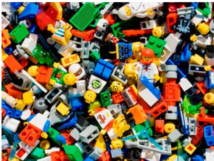
S legem si hrají generace dětí od roku 1932.