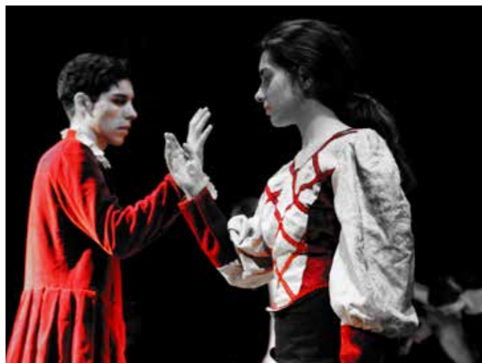
Ukázka z představení „dramatáku“.

Poslední léta mnoho našich žáků začalo studovat herectví na pražské DAMU obor činohra, stejně tak na alternativní větvě