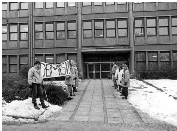
Občanští aktivisté u vstupu do sídla ONV Gottwaldov.

Organizátor: Muzeum jihovýchodní Moravy ve Zlíně, p. o. Místo a termín konání: Vavrečkova 7040, 14. budova baťovského areálu, 1. NP prostor krátkodobých výstav, 17. 11. 2019 – 16. 2. 2020 Výstava fotografií připomíná, že jednou z událostí, které s sebou přinesl listopad 1989, byl i návrat našeho města k jeho původnímu jménu. Fotografie připomenou proměny známých míst Zlína od počátku 20. století i lokality, které ve své původní podobě dnes už neexistují.