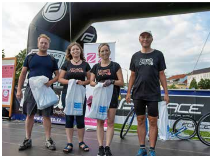
Ti nejlepší zvládli za týden i více než 1 200 kilometrů.

V Otrokovcích byla snídaně zdarma na odpočívadle vedle splavu u Trávníků. [cyz]