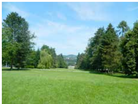
Ve Zlíně je více než 100 tisíc stromů.

Původní městečko Zlín mělo jen malé náměstí s lipami před radnicí. V okolí obnoveného zámku byl asi začátkem 19. století založen park v přírodním tzv. anglickém slohu. Travnaté plochy byly osázeny skupinami listnatých stromů a keřů, domácích i cizokrajních, ojediněle i jehličnany. Součástí parku byl i rybník. Pod strmým svahem na severní straně zámku byly do břehu částečně za-