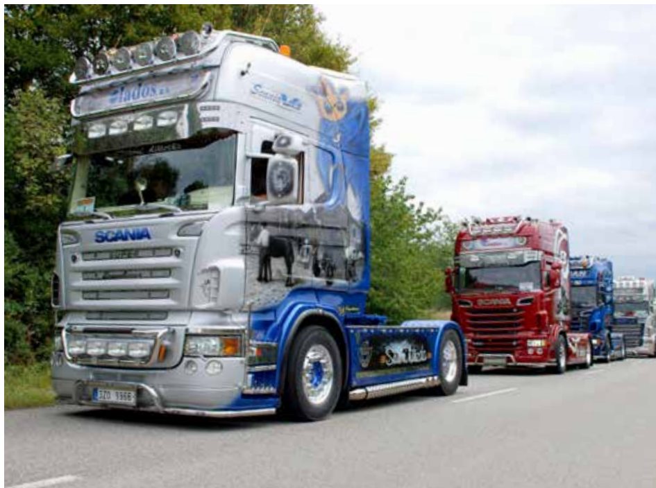
Nablýskané vozy si vždy najdou své obdivovatele.

Zlatý hatrick v podání dobrovolných hasičů ze zlínské místní části Louky se nekonal. Po dvou vítězstvích za sebou v soutěži o Putovní pohár primátora města Zlína skončili tentokrát čtvrtí. Na pomyslném trůnu je vystřídal Jaroslavice. O primátorský pohár se soutěžilo už po čtrnácté a také tentokrát se na start postavilo 12 hasičských jednotek, které jsou zařazeny pod město Zlín. Na druhém místě za Jaroslavice skončili dobrovolní hasiči ze Salaše, třetí místo obsadily Lužkovice.