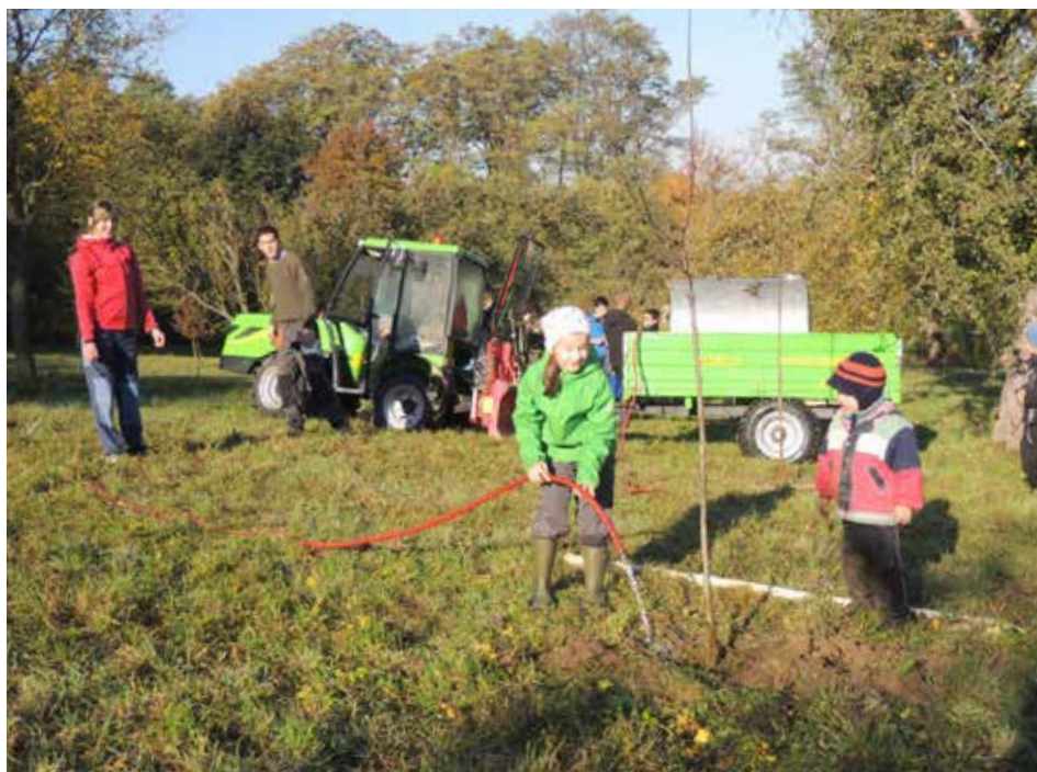
Sázení stromů se rády účastní i malé děti.

„Naším cílem je, aby v konečné fázi bylo možné v ní najít informace ke každému z asi sto tisíc stromů, které na území Zlína rostou,“ řekl Bedřich Landsfeld . [dvo]