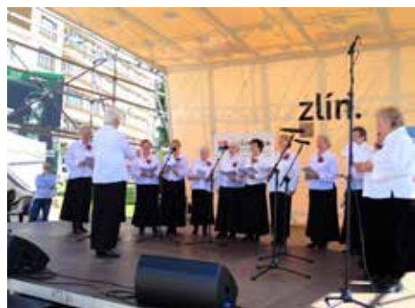
Vystoupení měla velký úspěch.