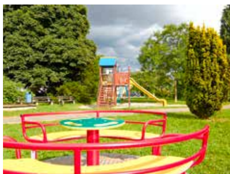
Hřiště v místní části Lhotka-Chlum. / foto: Ivo Hercík

Ve Lhotce-Chlumu je nutné zpevnit část komunikace. Další prioritou této místní části je odvodnění komunikace mezi Lhotkou a Chlumem, opravy propustků a příkopů. Krásnější bude také okolí kašny, kterou obklopuje malý parčík. Dřeviny nahradí květinová výsadba. A na přilehlém dětském hřišti přibudou hrací prvky – kolotoč a kreslicí tabule. Silnici a chodník potřebují opravit v ulici K Cihelně v Loukách. Stejně tak požádala komise místní části o úpravu zastávky MHD U Hřiště včetně rekonstrukce mostu přes Chlumský potok, který je