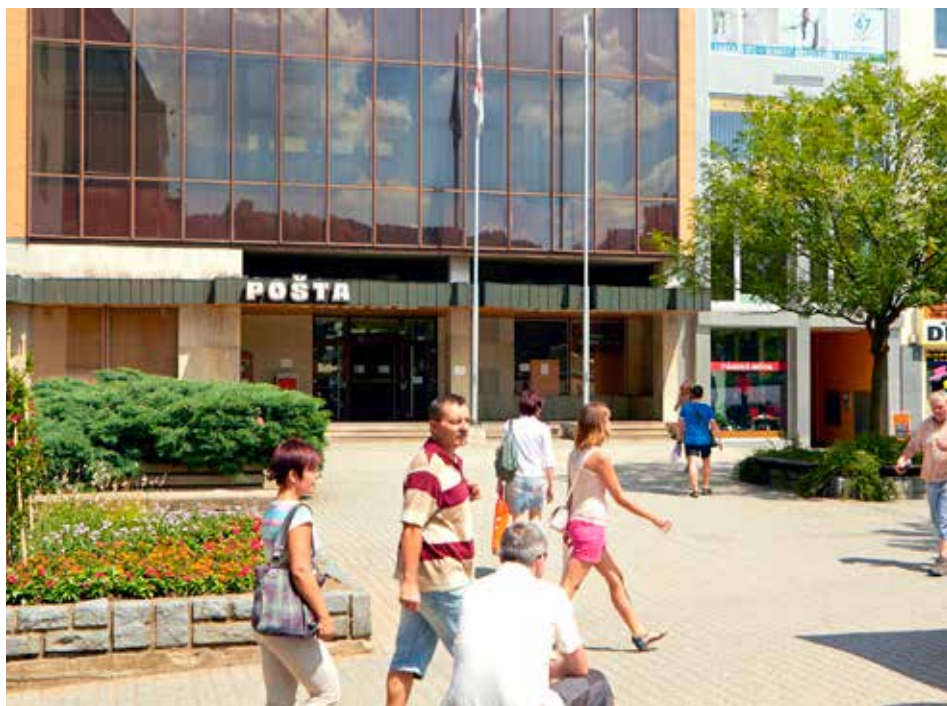
Hlavní pošta na náměstí Míru už je minulostí. Státní podnik se rozhodl odejít do jiné lokality.