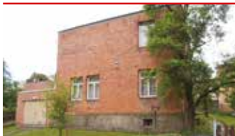
Zlín - Nad Ovčírnou I N08366

Jednodomek 3+1 v centru města se zahradou a garáží, ideální k rekonstrukci, klidné bydlení v žádané lokalitě.