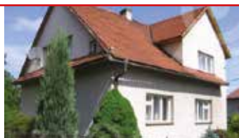
Želechovice u Zlína N08333

Pěkný a udržovaný rodinný dům 5+1, prosklená veranda, okrasná zahrada s pergolou, dvě garáže a dílna.