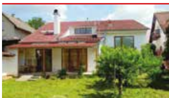
Zlín - Kostelec N08493

Nový rodinný dům v příjemné lokalitě s krásnou zahradou, 2 bytové jednotky 3+kk a 2+kk, 2 parkovací místa.