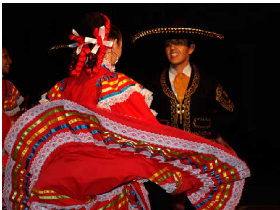
Mexický soubor.