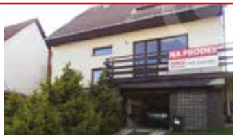
Zlín - Lhotka N07756

Rodinný dům 5+1 s garáží nedaleko Zlína. U domu se nachází prostorná zahrada s venkovním posezením.