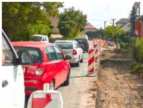
Oprava chodníku na Mladcové.

V Malenovicích se zaměřili na opravy chodníků, kromě toho se řeší také přístřešek u točny MHD v ulici Masarykova nebo rozšíření kamerového systému o další body.