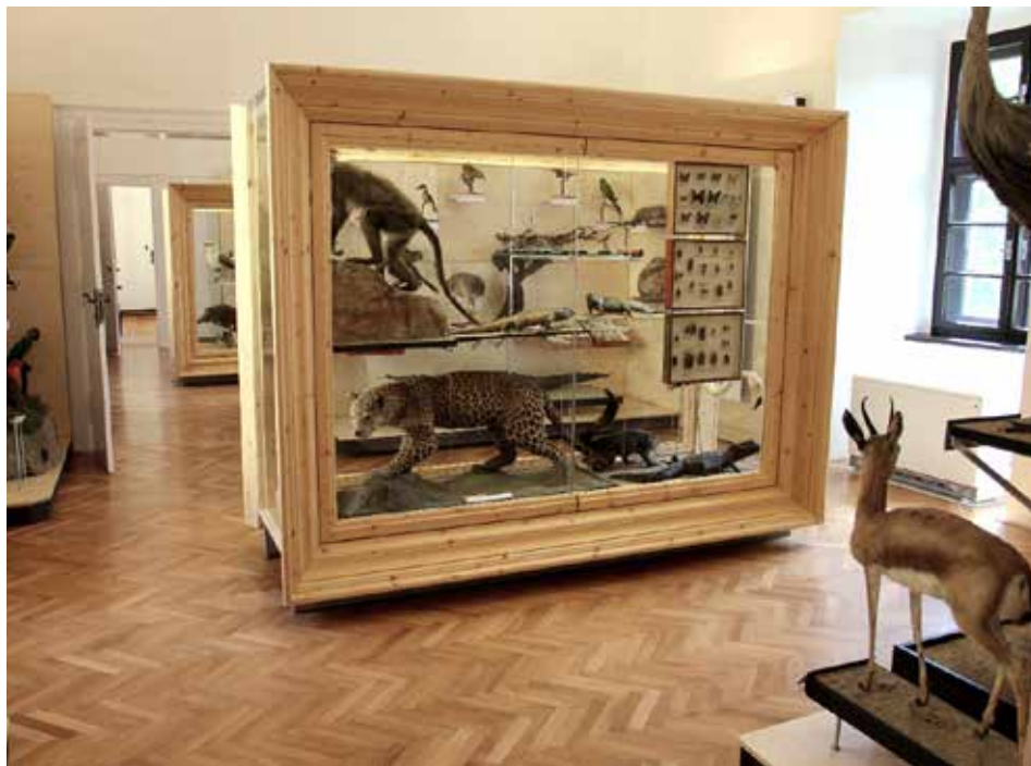
Přírodovědná expozice se nachází ve třech sálech hradu Malenovice.

Rozhodnutí, zda zůstat na noční prohlídku děti mladší šesti let, nechávají organizátoři na rodičích, za příliš vhodné to ale nepovažují. Více na www.muzeum-zlin.cz . [sve]