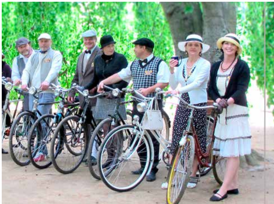
Club S.K. Baťa tvoří parta nadšenců.