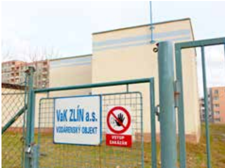
Zlín doplácí na solidární ceny.

Solidární cena se dá zjednodušeně vysvětlit tak, že všichni uživatelé z dané oblasti platí za výrobu a dopravu vody stejnou částku, bez ohledu na to, jaké jsou skutečné náklady. Stejnou částku tedy platí obyvatelé