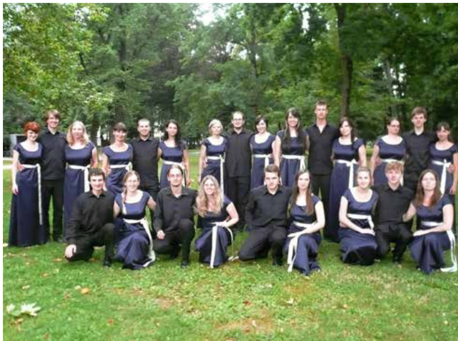
Sbor sbírá jedno ocenění za druhým.

Školáci i jejich rodiče se mohou v létě pobavit i u Vycházky mezi stromy. Na úvod dostanou zábavný kvíz, básničky, říkanky, písňe o stro-mech. Vyrobí si Knihu stromu – svůj osobní zápisník. Dvouhodinový program bude probíhat v zámeckém parku, kde se dětem stane průvodcem jejich vlastnoručně vyrobená knížka. Ve středu 7. srpna se navíc v Muzeu jihovýchodní Moravy, ve 14. budově továrního areálu, koná tvořivá dílna Hlasy fantaskních zvířat. Účastníci workshopu si v době od desíti do dvanácti nebo odpoledne od dvou do čtyř hodin ozvučí kresby svých fantaskních zvířat. Naučí se, jak vytvořit hrozivý řev, skřehotavý zpěv či tiché zvonivé kroky. Dílna se váže k expozici Princip Baťa: Dnes fantazie, zítra skutečnost. Určena je pro děti od deseti let. Kapacita všech akcí je omezená a je nutné provést rezervaci na adrese objednávky. skoly@seznam.cz či na telefonním čísle 573 032 3xx (19, 20 či 21). Užitečné informace jsou na adrese www.muzeum-zlin.cz.