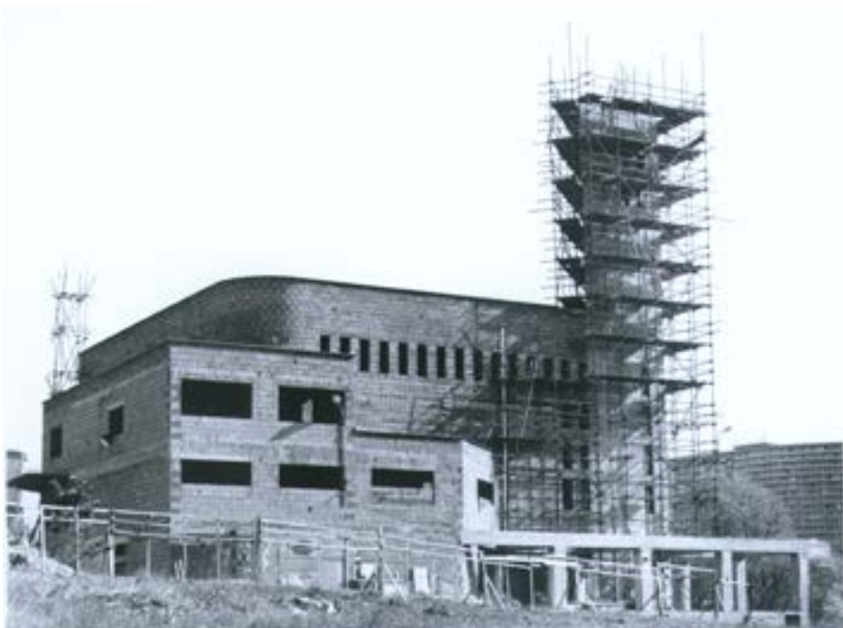
Stavba kostela Panny Marie Pomocnice křesťanů od západu, jaro 2001

Kostel na Jižních Svazích svou architekturou dvou křídel protínajících se s vertikálou věže připomíná otevřenou náruč zvoucí k návštěvě. Pro věřící je navíc naplněním snu o druhém důstojném svatozátku, který snily generace předků. A pro všechny Zlíňany je štíhlá bělostná věž kostela důstojnou dominantou elegantně se uplatňující v nejrůznějších průhledech jejich města.