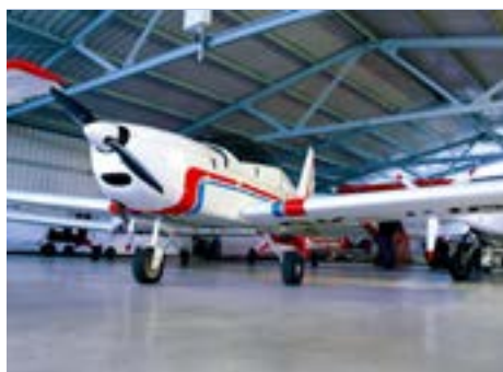
Hangár ve Štípe.

V roce 1984 vzniklo ve zlínské části Štípa malé letiště pro potřeby místního družstva. Startovaly z něj žluté břichaté stroje, takzvané čmeláci, s nákladem chemického hnojiva. Práškovací letadla jsou už minulostí a zemědělci využívají štípskou runway maximálně jednou do roka. Vystřídali je piloti ultralightů, subtilních dvoumístných letadel. V místním hangáru jich mají dvanáct a jednoho větroně. Letiště je veřejně přístupné a po dohodě s provozovatelem je možná i prohlídka hangáru. Zastavit se zde mohou na občerstvení pěší turisté i cyklisti, které sem zavede cyklostezka ze Štípy či od Hvozdné. Autem se dá dojet až na místní parkoviště. Majitel letiště Josef Habrovanský provozuje i leteckou školu.