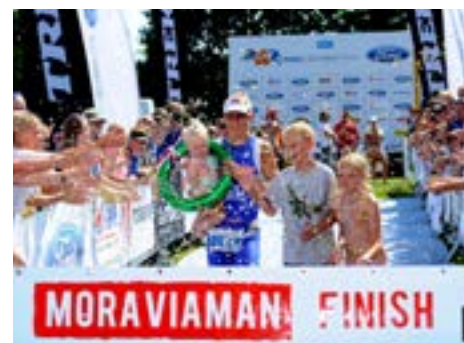
Pocit vítězství zažívá pravidelně

Zkoušela to spousta lidí, ale u nikoho dalšího to nefungovalo. Nemám důvod něco skrývat, ale vždy dodávám, že kaž-