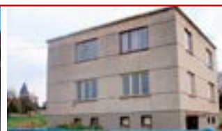
Zlín - Kostelec N04712

Prostorný RD se započatou rekonstrukcí a s pozemky o velikosti cca 4.200 m 2 . Garáž, v blízkosti ZOO Lešná.