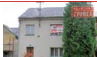
Zlín - Malenovice N05011

RD 3+1 Malenovice v lokalitě u kostela, ihned volný, ústřední plynové topení, zahrada, nutná rekonstrukce.