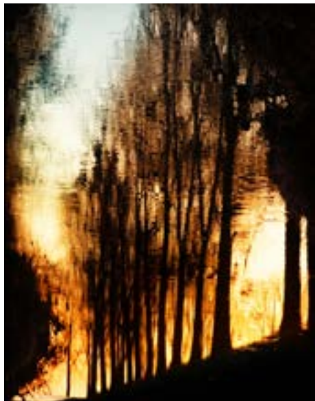
Vodní malůvky.

Třetí ročník fotosoutěže na téma Chráněná území Zlínska, kterou vyhlásil Odbor životního prostředí a zemědělství magistrátu, už zná své vítěze. Vybrala je odborná porota v čele se zlínským fotografem Josefem Klimšou. Výherci budou odměněni poukázkami na nákup fotografického vybavení: