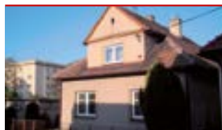
Zlín - centrum N04540

Rodinný dům umístěný v centru města Zlína (Potoky - blízko městské policie), ideální pro komerční účely i pro bydlení.