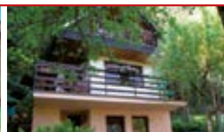
Břežnice / okr. ZL N06763

Chata k celoročnímu bydlení se stavebním pozemkem o ploše 910 m 2 na okraji obce Břežnice, příjezd k pozemku.