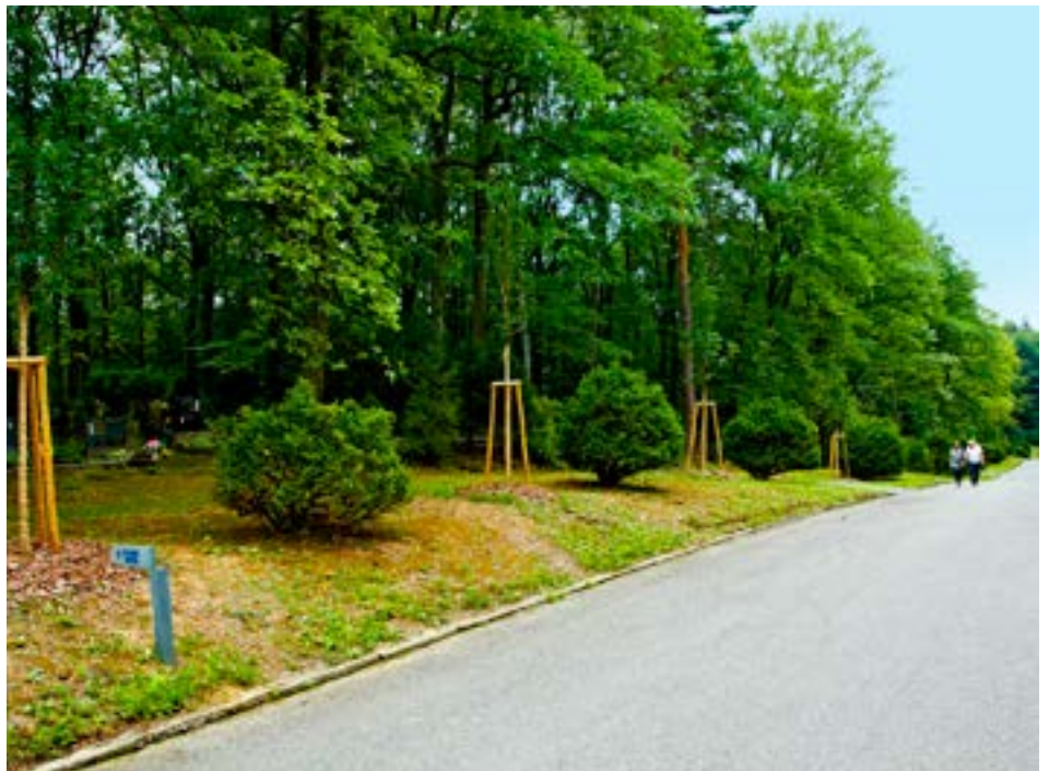
Hlavní stromová alej byla obnovena.