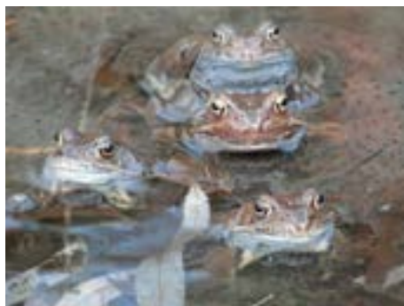
U žabí tůňky.

Celkem se fotosoutěže bohužel narodil od minulých ročníků zúčastnilo podstatně méně autorů, což byl zřejmě následek poměrně úzkého, lokálního tématu. Z tohoto důvodu pořadatel ruší avizovanou vernisáž. Ceny za umístění budou autorům předány individuálně, přímo v prodejně Foto CZ, OC Čepkov Zlín. Umístěné fotografie budou s několika dalšími, porotou vybranými fotografiemi, vystaveny od 18. července do 31. srpna v Galerii 2. patro ve zlínské radnici. Gratulujeme vítězům, a ostatním autorům, kteří se zúčastnili letošního ročníku, tímto děkujeme za zaslání fotografie a přejeme hodně úspěchů do budoucna. [vp]