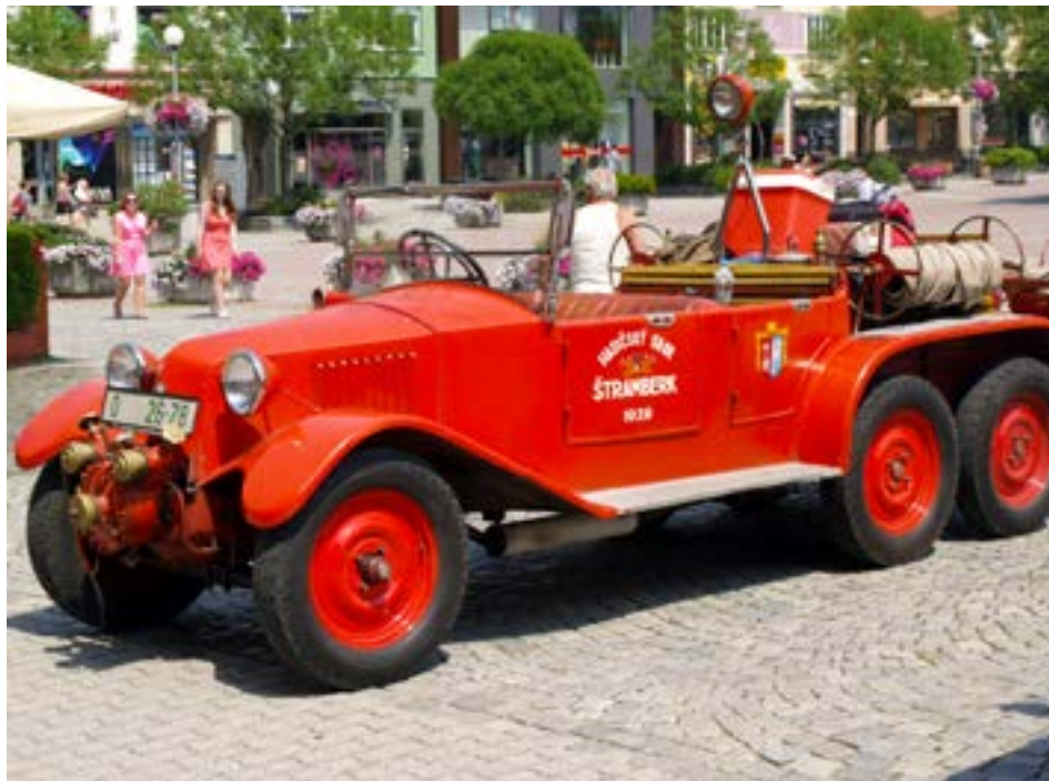
Na náměstí Míru dorazil i hasičský speciál Tatra 72

Dohody usnadní podnikatelům přechod na nové podmínky, které začnou platit v roce 2015. Tehdy nastanou některé z účinků nové obecně závazné vyhlášky o zákazu provozování některých druhů loterií a jiných podobných her na území Zlína. Na jejím základě dojde k úplnému zákazu výherních automatů a dalších zařízení tohoto typu v centru města. Ve zbývajících částech Zlína budou herny fungovat pouze na základě výjimek. Smyslem nové vyhlášky je omezit počet těchto přístrojů ve Zlíně. [dvo]