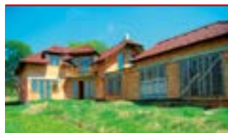
Lukov / okr. ZL N06815

Rozestavěný RD s bazénem, pozemek 2.000 m 2 . Vhodné k bydlení i podnikání, např. rehabilitační středisko, penzion.