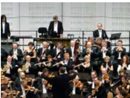
Koncert v Kongresovém centru.

Největší zájem je o populární řadu C, kde naši předplatitelé zakoupili již asi tři čtvrtiny kapacity sálu pro koncerty této řady. V minulé sezoně všechny koncerty této řady byly buď zcela, nebo skoro vyprodány. V této řadě nabízíme opravdu zajímavé a různorodé koncerty. Letos například písňe Beatles, šansony Edit Piaf, filmovou hudbu, balet, jazz, vše ve spojení s naším orchestrem. Naší filozofií je přilákat na koncert filharmonie ty posluchače, kteří by na koncert vážné hudby asi nepřišli. Pro mě je pozitivní zjištění, že hodně našich abonentů z této populární řady si pro novou sezonu zakoupilo předplatné v řadě klasické hudby. [sve]