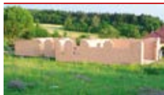
Lukov / okr. ZL

Stavební pozemek na okraji obce s rozestavěným RD (bungalov), zast. plocha 263 m 2 , plocha pozemku 1.325 m 2 .