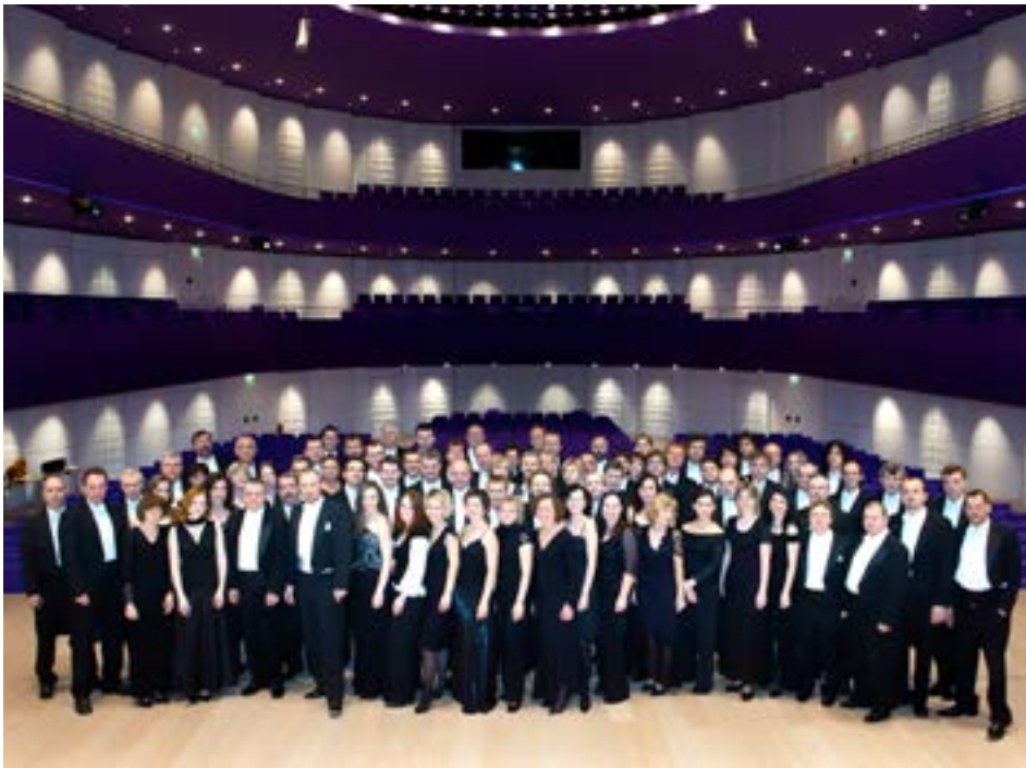
Na koncerty Filharmonie Bohuslava Martinů chodí víc posluchačů.