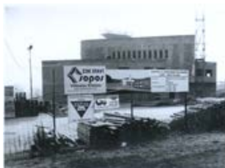
Staveniště kostela, únor 2001

Do Prštěného byly situovány také první poválečné návrhy filiálního kostela z roku