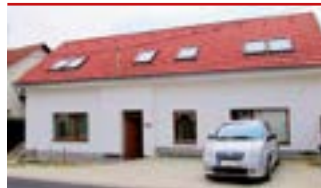
Zlín - Kostelec / okr. ZL N05821

Atraktivní RD 5+kk s velkým podkrovím, krásná zahrada. Zastřešená terasa, krb, MHD. Vhodné k bydlení i podnikání.