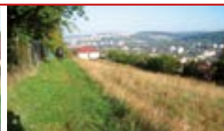
Zlín - Boněcko N04784

Svažitý pozemek, umístěný ve velmi pěkné a klidné lokalitě Zlín - Boněcko. Všechny inženýrské sítě, plocha 608 m 2 .