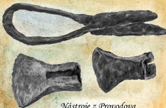
Nástroje z Provodova