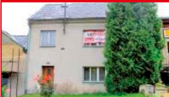
Zlín - Malenovice N05011

RD 3+1 Malenovice v lokalitě u kostela, ihned volný, ústřední plynové topení, zahrada, nutná rekonstrukce.