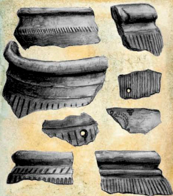
Zlomky nádob „zlínských Keltů“ nalezených na náměstí Míru