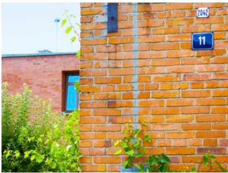
Přečíslování půldomků / ilustrační foto: Ivo Hercik

Přečíslování půldomků, které se dotklo obyvatel hned v několika místních částech Zlína, je v plném proudu. Ve druhé polovině července začala instalace tabulek s novými čísly popisnými na baťovské domky, které prošly procesem přečíslování. Jako první se tabulky vyměňovaly ve čtvrti Zálešná. Těm majitelům, kteří o to požádali prostřednictvím formuláře, instaluje magistrát nové číslo popisné na fasádu jejich obydlí zdarma.