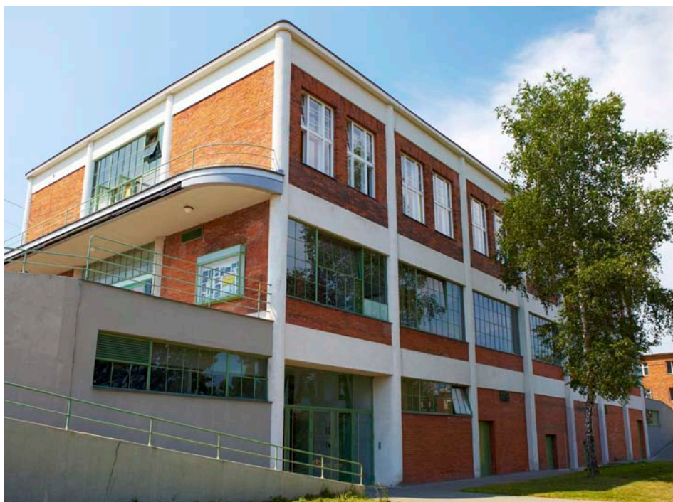
Budova Malé scény