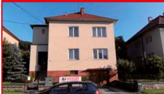
Zlín - Podhoří N02857

RD vhodný pro bydlení (i dvougenerační) i pro komerční využití. Má 3 nadzemní podlaží, ústřední topení - plyn.