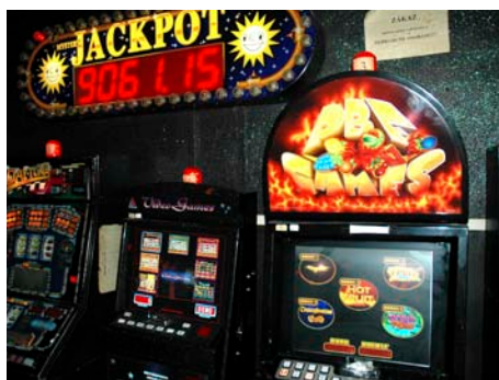
Hazard nemá podporu radnice

Odpovídal: Ondřej Běťák, náměstek primátora Zdeněk Dvořák