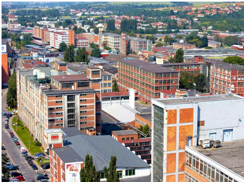
Areál v centru Zlína se pomalu začíná proměňovat

2) Podaří se vyřešit problém s umístěním Základní umělecké školy Zlín – Malenovice?