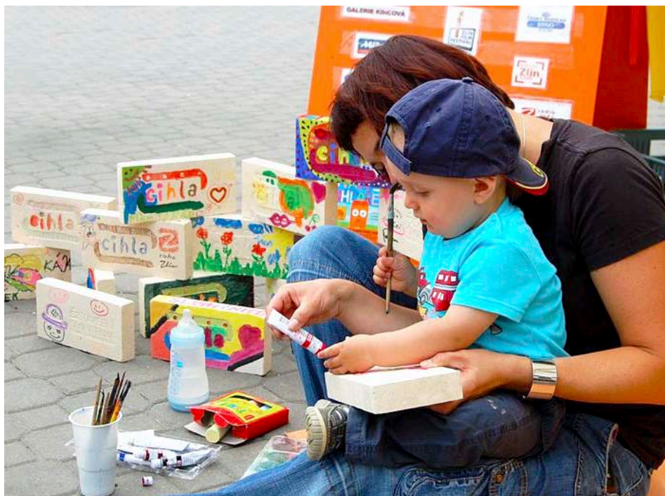
Akce letos vynesla 84 332 korun