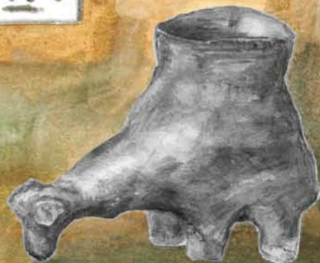
Zoomorfni plastika z Kvítkovic