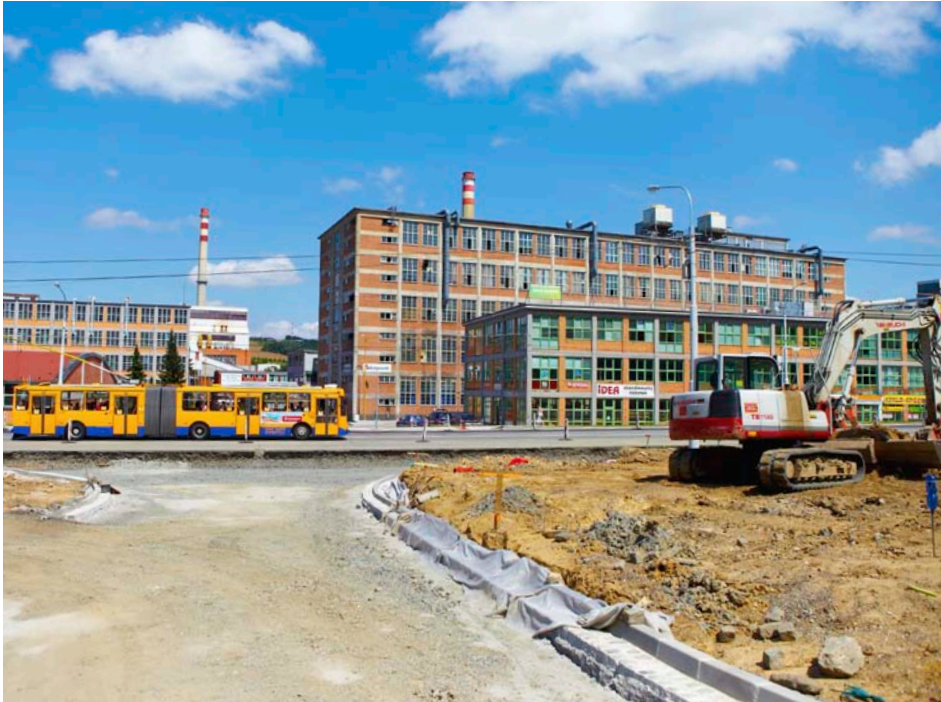
Práce na křižovatce finišují