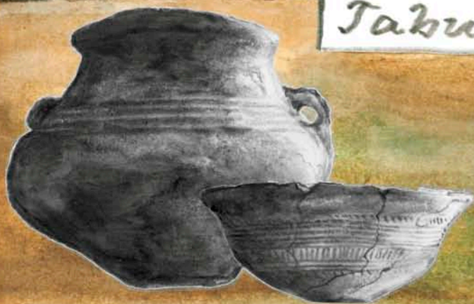
Nádoby z hrobů na Hornomlýnské ulici