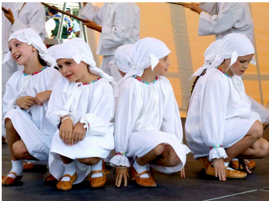
Na festivalu Zlínské besedování jsou k vidění i dětské soubory