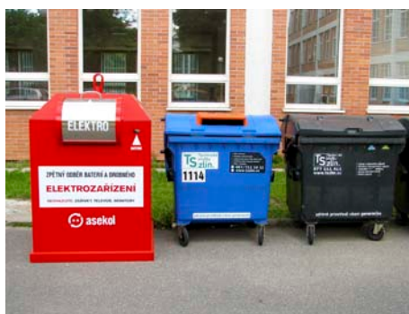
Kontejnery na elektroodpad jsou červené / foto: archiv

Stacionární kontejnery jsou umístěny na území města Zlína od konce června a usnadní lidem odevzdávání vysloužilých spotřebičů blíže místu jejich bydliště. S drobnými elektrospotřebiči tak obyvatelé nemusí až na sběrný dvůr, ale mohou je kdykoliv a pohodlně odevzdat do připravených kontejnerů. Kontejnery jsou většinou umístěny u již vzniklých separačních stání na tříděný odpad. Do stacionárních kontejnerů mohou občané ukládat drobná elektrozařízení, jako jsou např. kalkulačky, rádia, drobné počítačové vybavení, discmany, telefony a další.