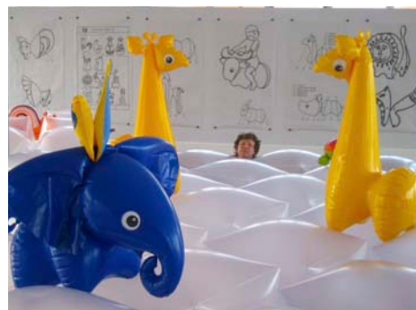
V expozici věnované matce