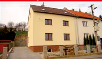
Zlín - Louky N04214

RD Louky po kompletní rekonstrukci, dispozičně 4+kk, 2+kk pro větší rodinu, nebo k podnikání, zahrada 980 m 2 .