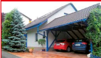
Zlín - Jaroslavice N05061

Udržovaný dům v klidné lokalitě, s terasou a výstupem na zahradu, splňující nároky nízkoenergetického bydlení.