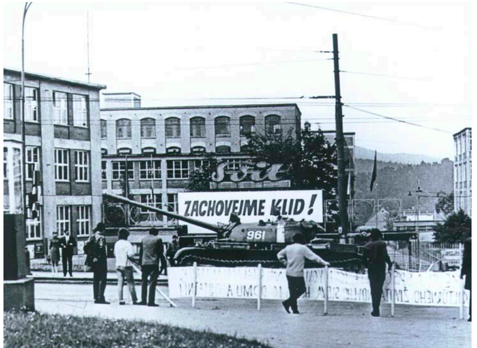
Sovětské okupační jednotky v prostoru před n. p. Svit v srpnu 1968

strážce ideologické čistoty, zpravidla delegovaný ve spolupráci s StB. Tady byli dva. Soudružka okresní vedoucí kulturní byla neprodleně informována o diverzantovi-basistovi a jeho zákeřném činu nahledávajícím mírové soužití mezi národy. Dopis byl vyzvednut, zabaven a na svolaném ideologickém školení souboru došlo k slavnostnímu aktu – dopisu otevření, agenta odhalení.