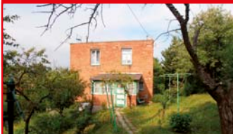
Zlín - Letná N04845

Půldomek Zlín - Pod Rozhlednou na pěkném místě s velkým pozemkem, v původním stavu, s verandou a přístřeškem.