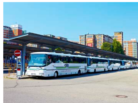
Autobusové nádraží / ilustrační foto: Ivo Hercík