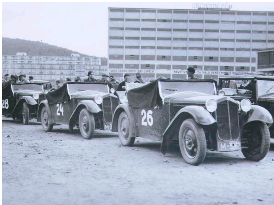
Tým vozů Z dorazil do cíle etapy závodu spolehlivosti Československem r. 1933, foto: J. Vaňhara, Státní okresní archiv Zlín