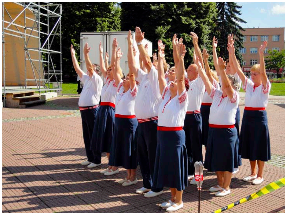
Vystoupení na zlínském náměstí