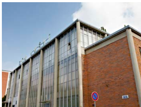
Dům umění získá nový plášť.

Další etapa obnovy anglických dvorků kolem budovy Městského divadla Zlín, obnova nátěrů vnitřních dveří, dokončení restaurování dřevěných přepážek zlínské radnice a zahájení opravy obvodového pláště Domu umění jsou další práce na obnově památkově chráněných objektů v městské památkové zóně Zlín spolufinancované z Programu regenerace městských památkových rezervací a městských památkových zón Ministerstva kultury ČR prostřednictvím Zlínského kraje, které v těchto dnech začínají.