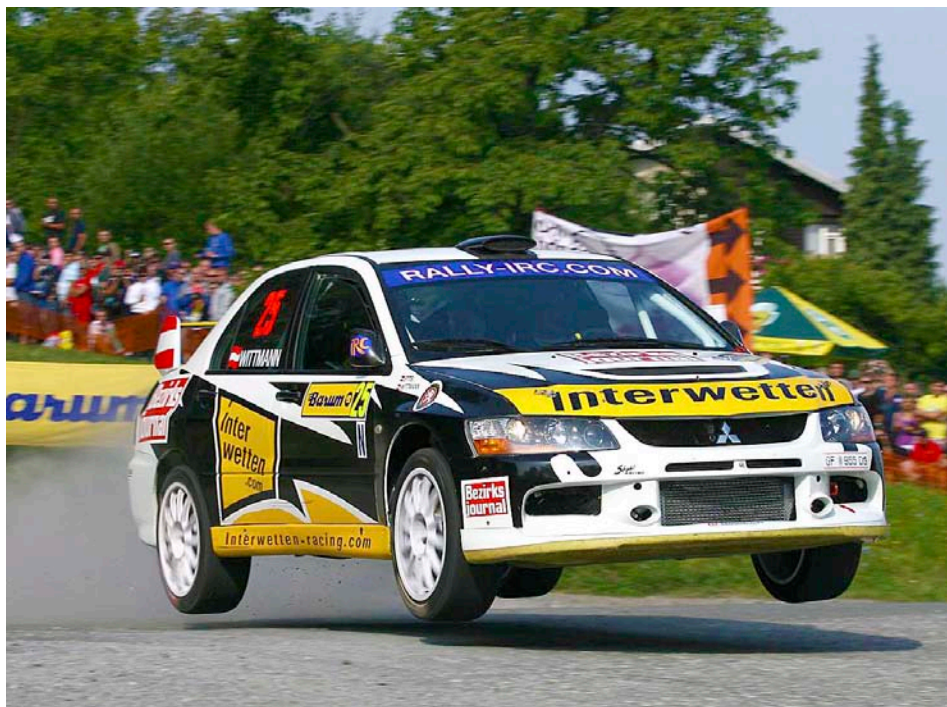
Barum rally již čtyřicet let nabízí atraktivní divácký zážitek.