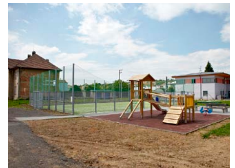
Sportovní areál v Prštném.

osazení příčného prahu pro zpomalení dopravy - křižovatka ul. Hrabůvky - ul. Boční, předpokládaná částka 10 tis. Kč ;