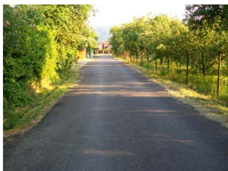
Místní komunikace v Mladcově. / foto: Irena Orságová