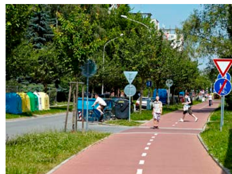
Kombinovaná stezka v Malenovicích.

Z celkového objemu uvádíme nejvýznamnější investiční akce a v několika případech finančně náročnější provozní akce (např. opravy komunikací nebo mateřských škol). Aby tato čísla nebyla zavádějící, je třeba si uvědomit, že se jedná o výdaje pouze za r. 2009.