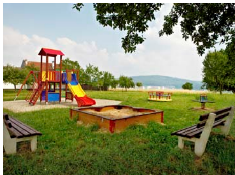
Dětské hřiště v části Chlum.

opravy kanálů v ul. Za Humny, předpokládaná částka 130 tis. Kč ; zpevnění krajnice v zatáčce ul. Zlínská, předpokládaná částka 555 tis. Kč (z toho v r. 2009 uhrazeno 45 tis. Kč ); projektová dokumentace ke zřízení zastávky MHD u ul. Medová, 90 tis. Kč ; zpevnění parkoviště u obchodu, 185 tis. Kč (z toho v r. 2009 uhrazeno 25 tis. Kč).