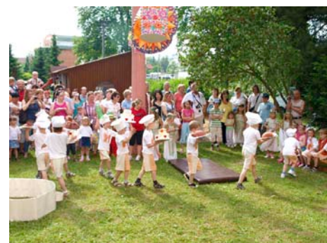
Dotovány jsou i akce.

projektová dokumentace k úpravě zastávky MHD U Hřiště - ul. Hasičská, předpokládaná částka 50 tis. Kč ; oprava chodníku ul. Pod Vinohrady – I. etapa a projektová dokumentace k opravě komunikace ul. Pod Vinohrady, předpokládaná částka 480 tis. Kč ; projektová dokumentace k lávce pro pěší přes řeku Dřevnici k Ternu a OBI, předpokládaná částka 56 tis. Kč ; projektová dokumentace k opravě komunikace a chodníku ul. K Cihelně, předpokládaná částka 82 tis. Kč ;