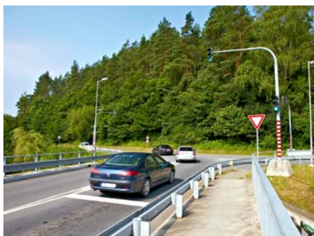
Světelná křižovatka u Kostelce.

oplocení hřiště č. 290, ul. Chelčického, předpokládaná částka 80 tis. Kč .