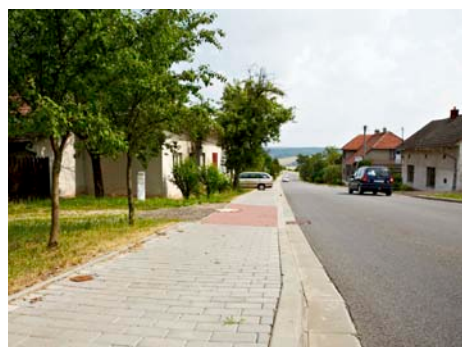
Místní část Salaš prochází nový chodník.