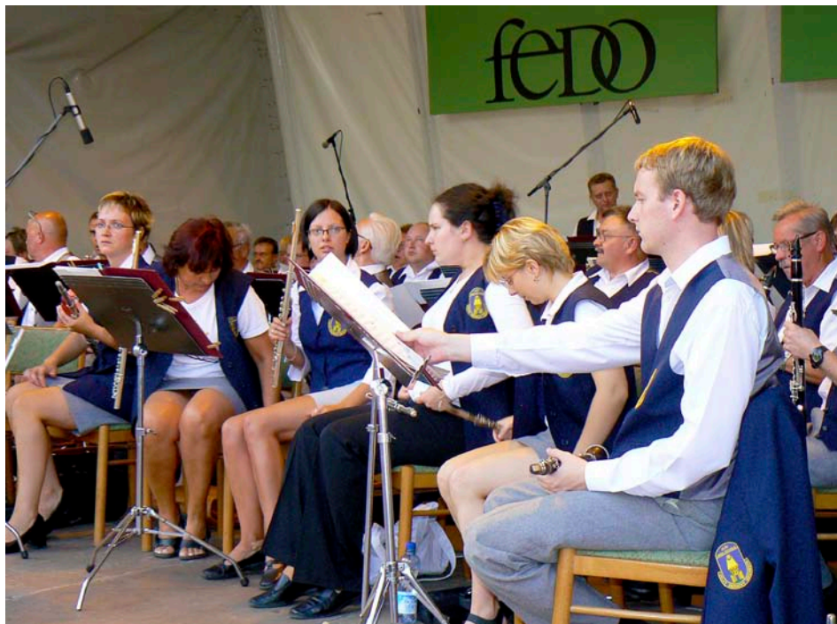
Velký dechový orchestr města Zlína patří k nejlepším v České republice.