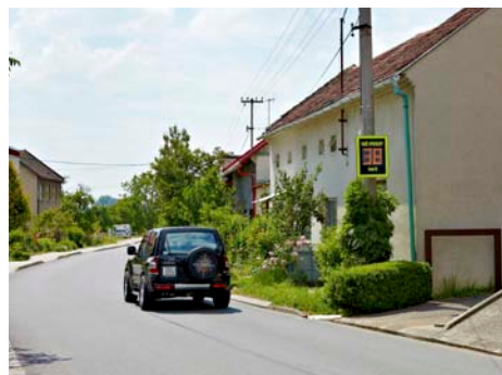
Měřič v Loukách.

V prvním díle našeho miniseriálu představíme místní (tzv. příměstské) části Kostelec, Lhotka – Chlum, Louky, Malenovice, Mladcová, Prštná a Salaš. V příštím čísle budeme pokračovat místními částmi Jaroslavice, Klečův-