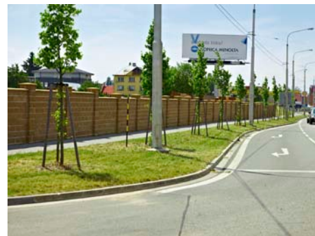
Chodník k MHD v Malenovicích.

bezpečný přechod pro chodce - ul. Tyršo-