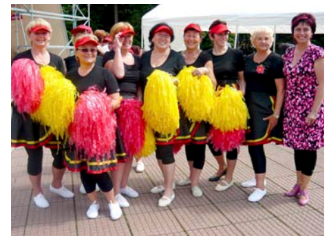
Z vystoupení na náměstí Míru.