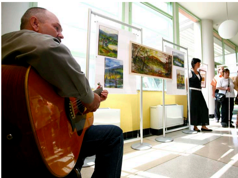
V Alternativě - kulturním institutu Zlín se koná mnoho akcí.

Vážený spoluobčané, kultura, jako typicky lidský fenomén, se někdy (tu více, tu méně) objevuje v centru pozornosti odborné, laické, aktivní i obvykle pasivní části veřejnosti.