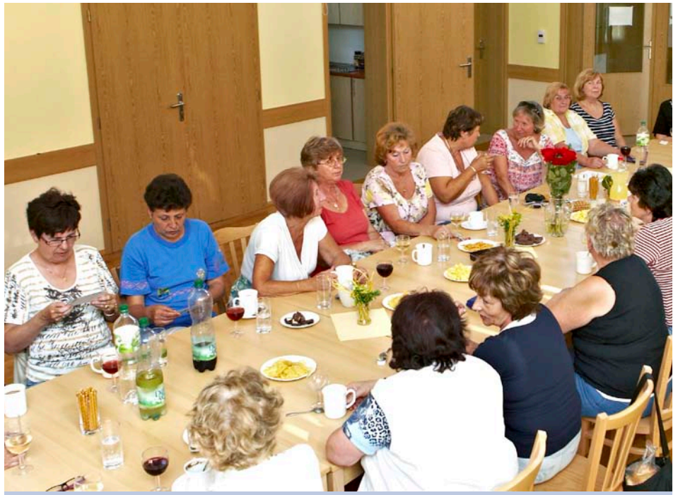
Klub seniorů U Majáku se schází v nových prostorách.

Zaměstnanci Odboru sociálních věcí Magistrátu města Zlína touto cestou děkují Charitě Zlín, která z Tříkrálové sbírky věnovala rodině s těžce zdravotně postiženou dcerou 50 tisíc korun na zakoupení automobilu pro její přepravu. Díky sponzorům z celé ČR a státnímu příspěvku tak bylo možno zadat výrobu tohoto speciálně upraveného vozu.