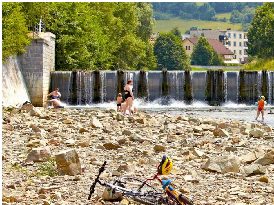
Oblíbeným místem Zlíňanů se v horkých dnech stává Dřevnice v Příluku.

K péči o zeleň potřebuje v tyto horké dny Odbor městské zeleně cca pět tisíc litrů vody denně. Zalévá 200 nově vysazených stromů, trvalkové záhony, mobilní zeleň na sloupech veřejného osvětlení, letničkové záhony i nově vysazené květinové záhony.