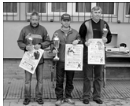
Vítězové hlavního závodu na loveckém kole