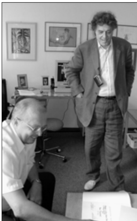
Na snímku T. Stoppard při návštěvě odd. nukleární medicíny Krajské nemocnice T. Bati v roce 2004.

Hru s příznačným názvem Rock'N'Roll napsal anglický autor českého původu Tom Stoppard a byla uvedena v Royal Court Theatre. České premiéry se příští rok dočká v Národním divadle.