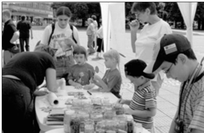
Své aktivity představil i Dům dětí a mládeže Astra