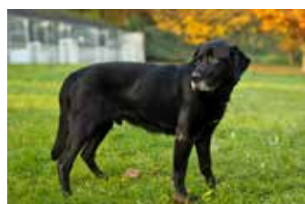
DAN / labradorský retrívr, 10 let, klidný a přátelský, hledá domov na dožití.