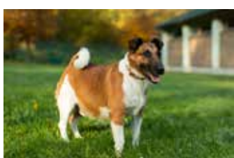
RON / hladkosrstý foxteriér, 7 let, čipovaný, hodný, zvyklý na druhého psa, vhodný i do bytu.