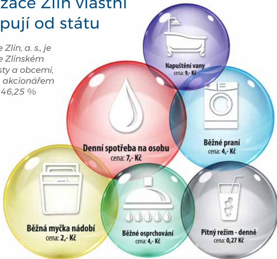
Kolik stojí ve Zlíně...

VaKu Zlín se podařilo od roku 2015 zvýšit inkasované nájemné od MOVO ze 111 mili-