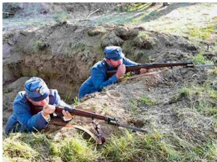
1. světová válka probíhala především v zákopech.