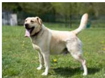
NODY. / foto: útulek

hubky, které čumák psíci zcela stáhnou. Na výlet je potřeba vzít psíkovi dostatek vody. Jak poznáme, že je pesek přehřátý a jak postupovat? Hlavními příznaky jsou velmi rychlé a těžké dýchání, časté posedávání, apatie, suchá kůže, hodně zarudlé dásně a jazyk, zvracení nebo průjem. Psíka rozhodně prudce neochlazuje. Přeneseme ho do stínu, snažíme se mu vlažnou vodou ochlázovat tlapy, hrud, břicho a hlavu. Po takovém prvotním ošetření by bylo vhodné navštívit veterinárního lékaře. V srpnu bychom vás chtěli pozvat na benefiční Agility závody pořádané v sobotu 17. srpna v areálu kynologického cvičiště na Příluku.