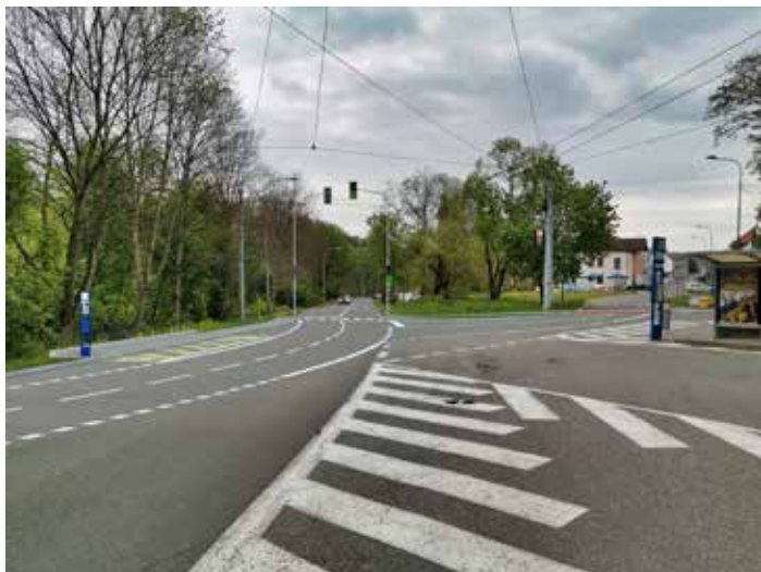
Vizualizace výsledné podoby rekonstrukce.

„Zvyšování kvality MHD ve Zlíně je jednou z mých priorit. Pevně věřím, že komplikace v dopravě v době realizace stavby vyváží výsledná podoba a funkčnost daného úseku, který byl do teď v neutěšeném stavu,“ dodal radní pro dopravu Michal Čížek . [tsz]