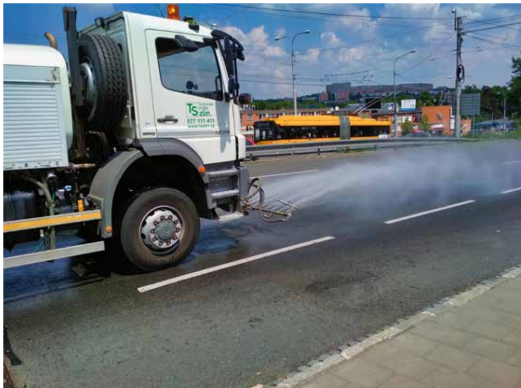
Kropicí vůz pomáhá chladit zlínské ulice.