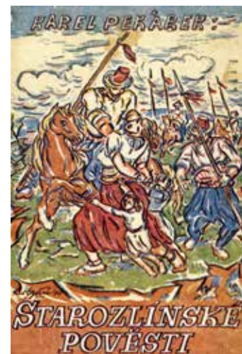
Obálka knihy.

Začál se modlit f téj hrúzi Očenaš, ale nepomohlo, bestman ho dusil furt. Modlil se k Panence Maryji a zaz nic, už enom vodu glgál, atož se začál modlit ke Fšeckým Svatým. Noa najednúc