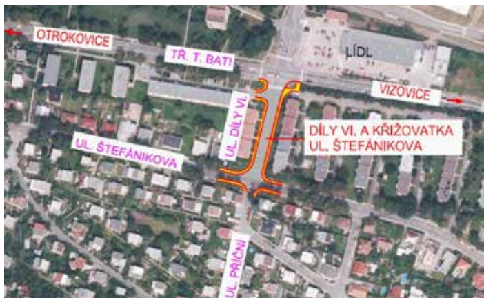
Ulici Díly VI čekají úpravy.