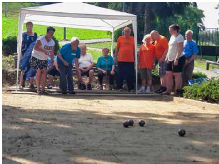
Jde o společenskou hru, které se lze věnovat v každém věku.

Pétangue se začal do Evropy šířit z Francie, český překlad jeho názvu zní koulená. Jde o společenskou hru, které se lze věnovat v každém věku. Poskytuje nejen radost ze soutěžení, ale také ze setkávání a navazování přátelství. Proto je nyní už velmi oblíbený i mezi českými seniory. Zlínský turnaj vyhrálo družstvo z pořádajícího Domova pro seniory Burešov, které ve finále porazilo seniory z Nedašova. Oba celky postoupily do celomoravského kola soutěže s názvem MORAVA CUP. Také to uspořádá Burešov. [dvo]