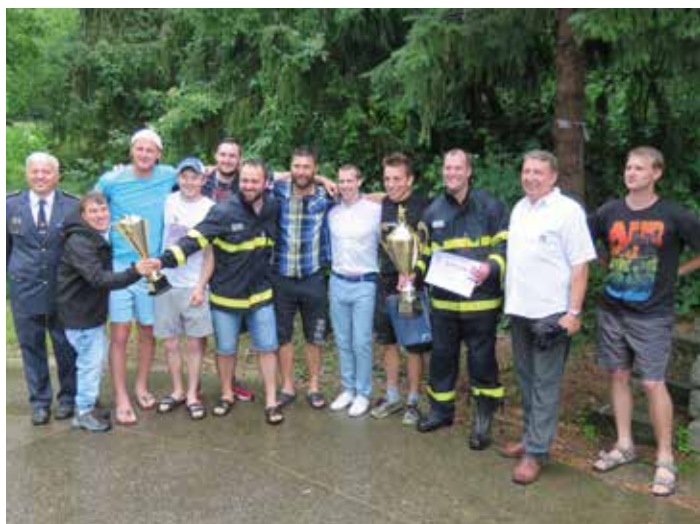
Mladcovští byli nejlepší.