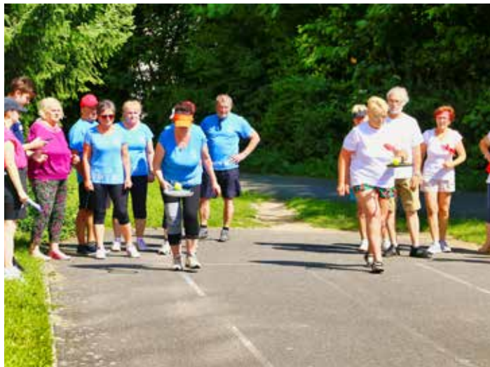
Kluby poměřily síly.

Poděkování Krajské rady seniorů Zlínského kraje patří všem, kdo pomohli, ať už finančně či svojí prací, aby se druhý ročník Sportovní her seniorů mohl uskutečnit. Zejména pak pedagogickým pracovníkům, studentům a vedení Střední a Vyšší zdravotnické školy na Bartošově čtvrti, kde se hry s jejich pomocí konaly. [io]