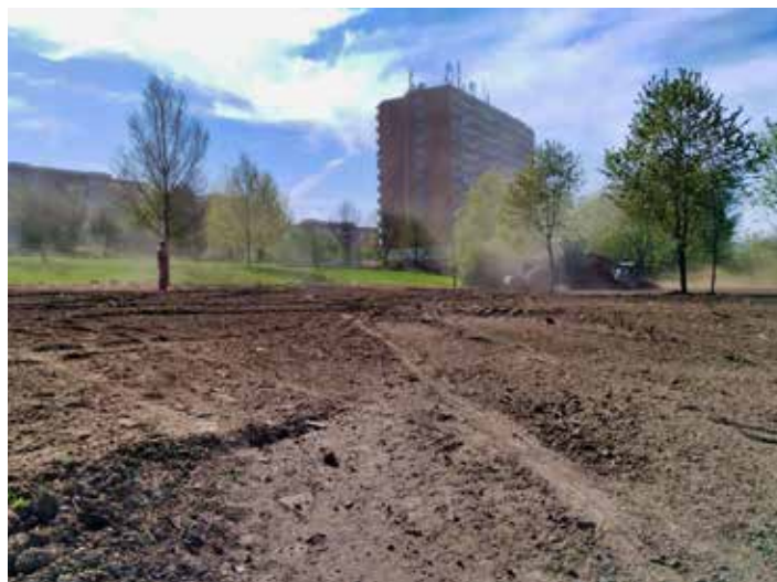
Užívat si plodů z vlastní zahrádky půjde i uprostřed sídliště.

Jak tedy taková komunitní zahrada funguje? Komunitní zahrada spravuje nejčastěji spolek, tedy skupina aktivních lidí, která se o chod a udržování zahrady stará. Zájemce si pronajme svůj záhonek a společně s ostatními sdílí zázemí zahrady. Jde tedy o pozemek, vybavení, vodu, místo pro relaxaci atd. Tento sdílený prostor často slouží také k sousedskému setkávání. Lidé zde mohou sdílet své poznatky ohledně pěstování,