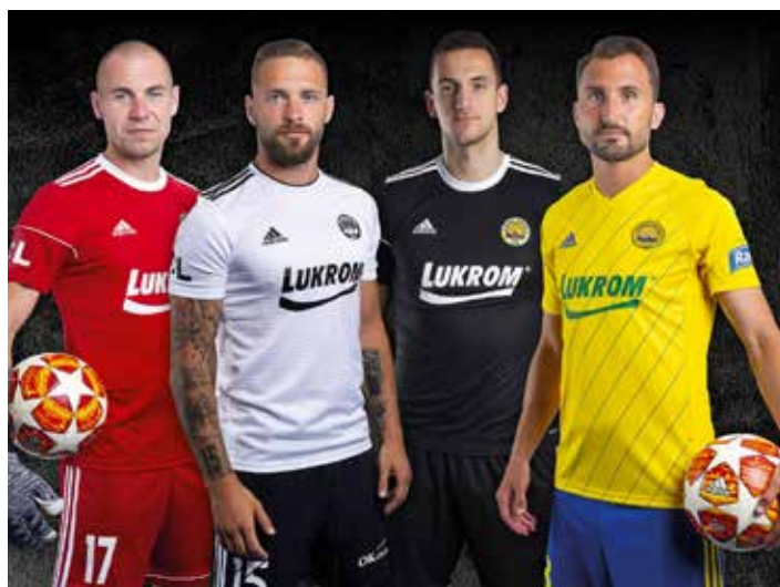
Nové dresy fotbalistů Zlín na sezonu 2019/2020.

„Jsem rád, že se ve Zlíně začaly měnit dresy na každou novou sezonu, má to svoje kouzlo. Nová venkovní barva je zajímavá a určitě ji fanoušci ocení. Domácí varianta je krásná, líbí se mi moc.