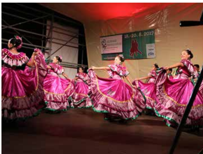
Festival se letos koná v termínu od 23. do 25. srpna.

Vztahy mezi oběma školami jsou teprve na začátku, ale základy dobré spolupráce a budoucích výměnných pobytů mezi Altenburgem a Zlímem už jsou položeny. [dk]