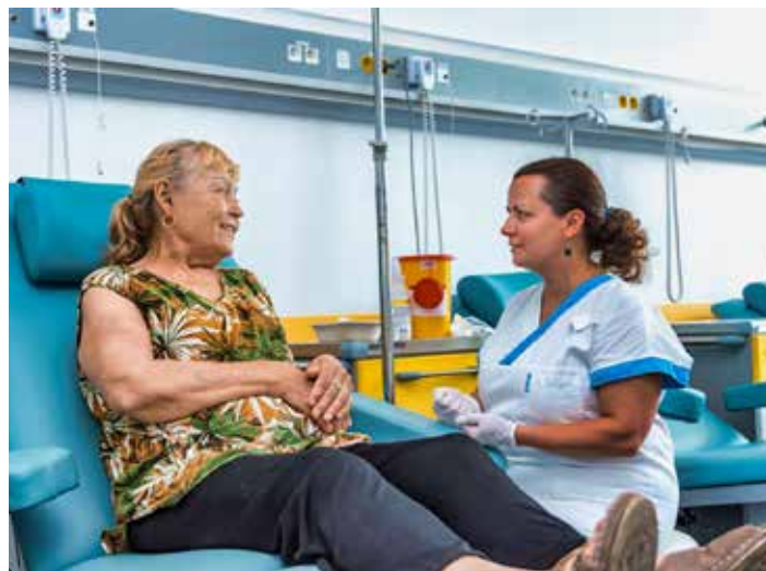
Zdravotnické zařízení investovalo do úprav pavilonu 12 milionů korun.

„Rozsah těchto úprav bude ovšem záviset také na tom, jestli bude dále pokračovat projekt výstavby nové nemocnice v Malenovicích. Podle toho bychom se rozhodovali, zda udělat jen to nejnútnejší, nebo přistoupit ke kompletní rekonstrukci,“ doplnil Radomír Maráček . [kntb]