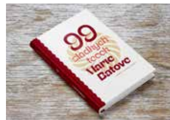
Nová kniha. / foto: archiv NTB

Knihu 99 sladkých teček Marie Baťové lze objednávat na internetové adrese www.hithit.com . [io]