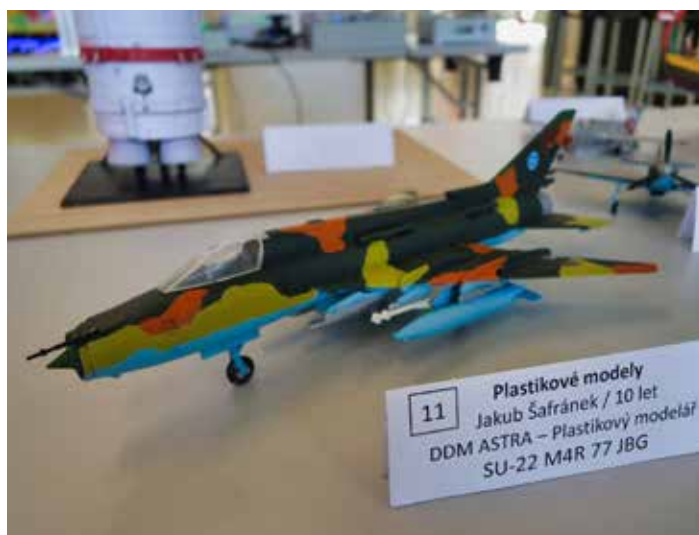
Hojné zastoupení měly plastikové modely.

Přehlídka se konala v rámci projektu Místní akční plán rozvoje vzdělávání v ORP Zlín II, který je podporován z Evropských strukturálních a investičních fondů prostřednictvím Operačního programu Výzkum, vývoj a vzdělávání. [ps]