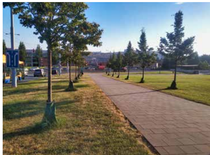
Zavlažovací vaky jsou lepším řešením než přímá závlaha.

Výhodou zavlažovacího vaku je rychlé zalití. V praxi to funguje tak, že je voda během několika málo sekund vpuštěna do vaku a pak 9 až 10 hodin odkapává ke kořenům stromu do tzv. závlahové mísy. „Pokud by závlaha probíhala bez vaku, trvala by déle, voda by se rozlívala do okolí a zřejmě by obsluha nedodala takové množství vody. Po ukončení vegetačního období vaky uklídíme a budeme instalovat zase v příštím roce. Věřím, že se nám osvědčí a další přikoupíme,“ doplnila arboristka Odboru městské zeleně Marie Su-