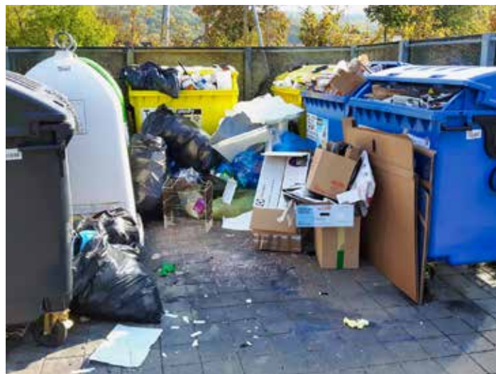
Je-li kontejner plný, lze papír i plast vyhodit později či využít sběrný dvůr.

„Tímto bychom chtěli velmi poděkovat všem dětem, které se soutěže zúčastnily, jejich pedagogům za péči a přípravu obrázků do soutěže. Rozhodnutí o vítězích bylo poměrně náročné, protože nám přišla spousta krásných kreseb, maleb a koláží,“ dodává k tématu radní Michal Čížek . [red]