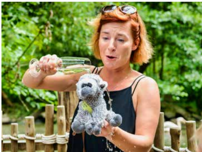
Malý gibbon nese jméno Hope (naděje).