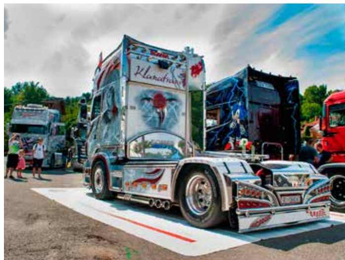
Zdobení na kamionech je plně fantazie.