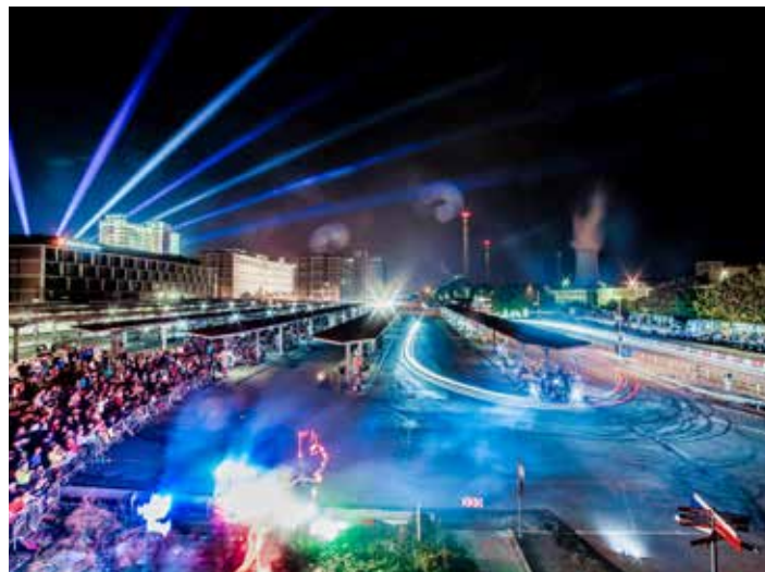
Noční rychlostní zkouška má u diváků úspěch.

na 2019. Barumku zařazuje vysoká divácká účast do pozice jednoho z nejvíce navštívených sportovních podniků na území České republiky. I letos se čeká v rámci FIA Mistrovství Evropy v rally (ERC) kvalitní podívaná a nabitá startovní listina s řadou předních jezdců z evropského šampionátu. Barumka se pojede jako závěrečný podnik Autoklubu Mistrovství České republiky v rally 2019.