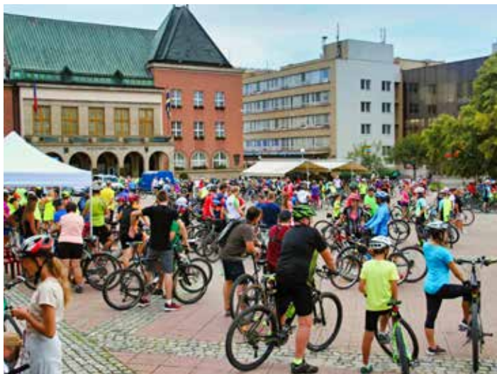
I přes kopcovitý reliéf je ve Zlíně o cyklopravu zájem.