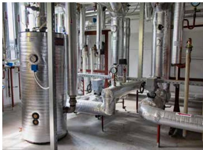
Teplu Zlín zajišťuje dodávky pro zhruba 16 000 domácností.

Hlavní činností společnosti Teplu Zlín, jejímž jediným akcionářem je statutární město Zlín, je distribuce tepelné energie – zajišťování dodávek tepelné energie pro vytápění a přípravu teplé vody do objektů odběratelů. Teplu Zlín, a.s., zásobuje téměř 16 000 zlínských domácností prostřednictvím 124 výměňkových stanic a 374 objektových předávacích stanic o celkovém tepelném výkonu ve výši 244 MW. Celková délka tepelných rozvodů činí zhruba 25 kilometrů.