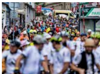
Cyklistická vyjížďka.

Kdo se může přihlásit? Závod je vypsán ve třech kategoriích: muži, ženy a děti (mládež) od 12 do 18 let. Do závodu se mohou bezplatně přihlásit nejen jednotlivci, ale i vícečlenné týmy. Přihlásit se můžete do 13. srpna prostřednictvím online formuláře na adrese www.zlinska-kola.cz . Před závodem je nutné se osobně prezentovat v čase od 12.00 do 15.30 v parku Svobody, kde se nachází zázemí akce. V případě volné kapacity se lze přihlásit přímo při prezentaci před závodem. Účastníci jsou povinni mít během závodu nasazenou přílbu. Trasa vede po městském okruhu převážně v továrním areálu a v prostoru autobusového nádraží, start a cíl je umístěn na Bartošově ulici. [ror]