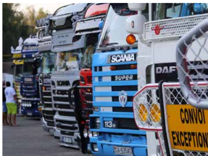
Letos se koná již 14. ročník.

V areálu na Březůvkách se v tenže den od 10.00 uskuteční doprovodný program pro veřejnost. Návštěvníci se mohou těšit na různé soutěže pro jednotlivce i týmy, hry pro nejmenší, ukázky RC modelů či soutěž o nejkrásnější truck. O hudební doprovod akce se postará country kapela Pěšáci a až se setmí, nebude chybět světelná show. Celý den bude k dispozici bohatá nabídka občerstvení. Ani Zlíňané nepřijdou zkrátka. Pořadatelé pro ně zajistí kyvadlovou dopravu z Kudlova (konečná MHD č. 32) do Březůvek a zpět. Podrobné informace, včetně jízdních řádů a trasy spanilé jízdy, najdete na www.truck-sraz-zlin.cz . [io]