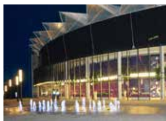
Akci hostí kongresové centrum.

Místem konference, která se koná jednou za pět let, budou prostory Kongresového centra a rektorátu UTB ve Zlíně. Díky tomu, že se organizátorům podařilo získat více než 50 osobností z firemního, akademického a veřejného života pro účast v moderovaných diskusích na plenárním zasedání a v sedmi sekcích, je ojedinělou příležitostí pro setkání a vytvoření živé a kreativní