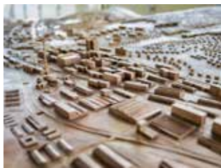
Model města.

Výsledný model města vznikl vzhledem ke svému velkému rozměru postupně, po 12 dílech, které pak následně byly svařeny. Vzhledem ke své velikosti musel být model do Zlína dopraven rozdělený na dvě poloviny a složen byl až na místě. K dopravení obou dílů z přezemí na terasu byla využita historická pojízdná Baťova kancelář – výtah. Do běžného výtahu se totiž model nevešel. [io]