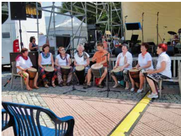
Dámy ze Zlínského klubu seniorů v Příluku.