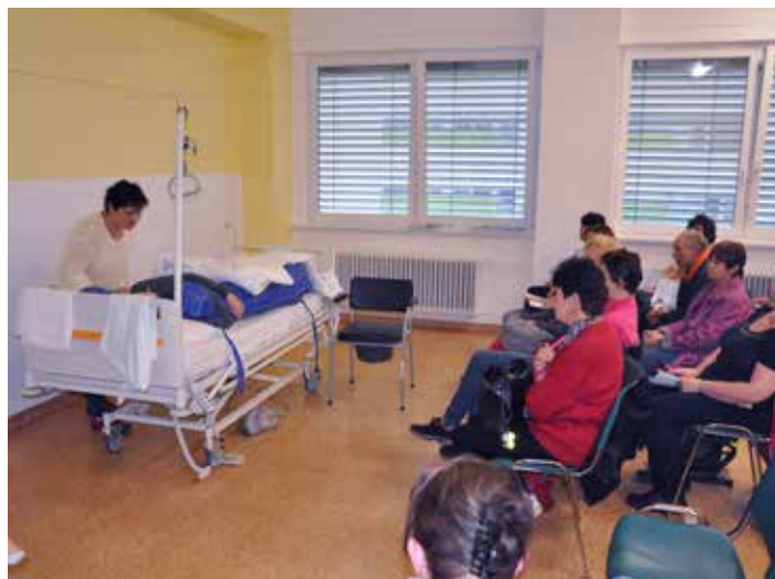
Školení péče o nemocné blízké.

Více o podpoře domácí péče na www.zustanemedoma.cz . [io]