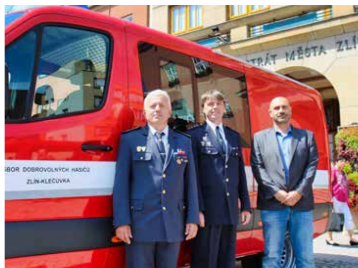
Přesuny hasičů budou rychlejší a bezpečnější.

Celková cena vozidla činí 2 105 884 korun včetně DPH, z toho na pořízení vozidla čerpalo město Zlín dotaci 450 000 korun od generálního ředitelství HZS ČR v rámci programu Ministerstva vnitra. Částku 300 000 korun se podařilo získat jako individuální podporu z Fondu Zlínského kraje na pořízení nové požární techniky. Úhrada ze strany města Zlína činí tedy jen 1 355 840 korun. [red]