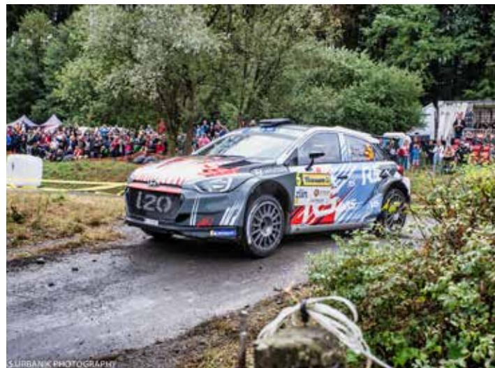
Téměř polovina trati byla pro letošní ročník obměněna.