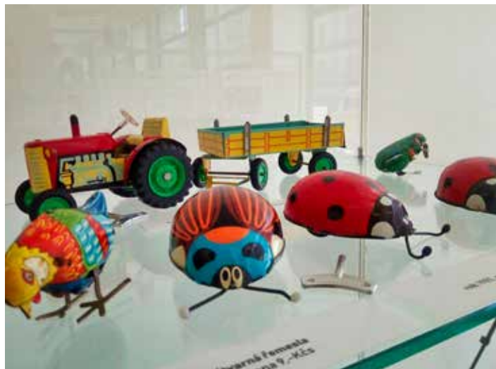
Generace čtyřicátníků a padesátníků si jistě vzpomenou...

Výstava je otevřena denně vždy od 10.00 do 18.00 až do konce srpna. [io]