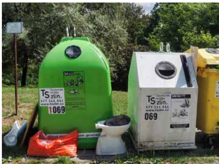
Mísa patří do sběrného dvora. Za odložení hrozí i pokuta 50 tisíc Kč.

„Žádáme občany města Zlína, aby nakládali se svým odpadem svědomitě a dodržovali obecně závaznou vyhlášku. Odpad neodkládejte nikdy ke kontejnerům, ale odevzdávejte v prodejních elektra, na sběrných dvorech nebo při mobilních svezích odpadů,“ doplnila vedoucí odboru. [fab]