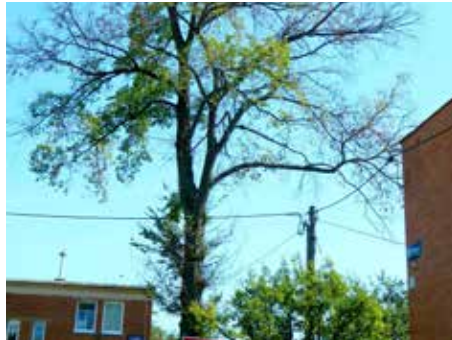
Usychající strom.

K sázení stromů zve magistrát také veřejnost. Pro ni pořádá ve dnech v pátek 19. a sobotu 20. října Stromové slavnosti. V pátek se program uskuteční od 10 do 15 hodin v parku Svobody, kromě výsadby si bude možné vyzkoušet také zážitkové stro-