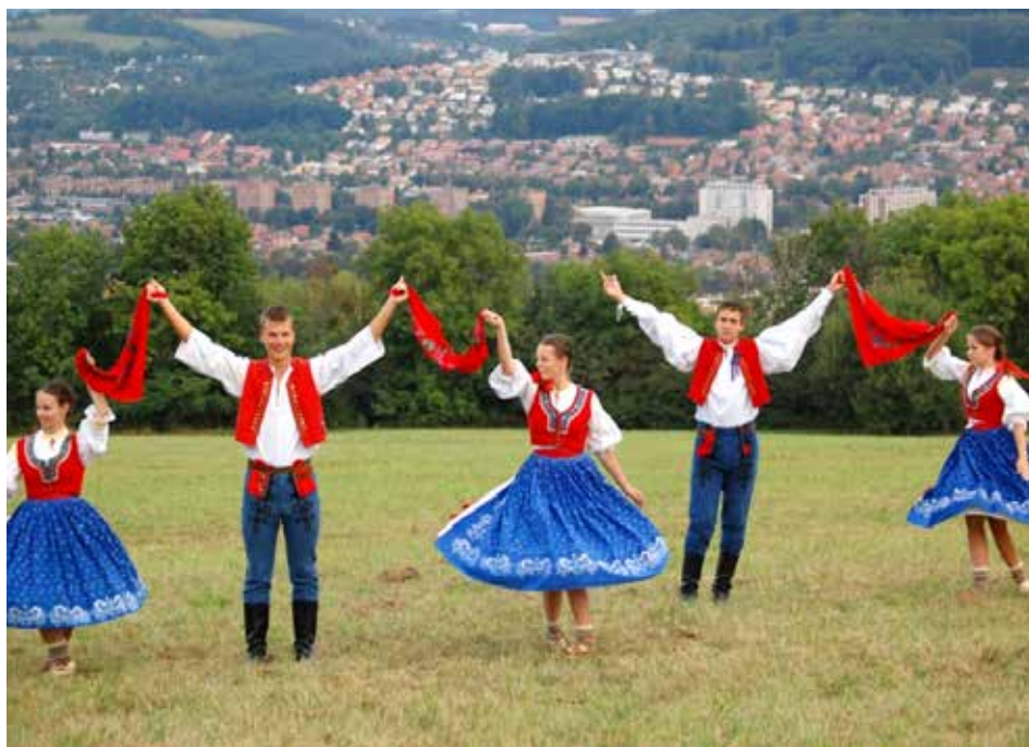
Bartošův soubor obohacuje kulturní život regionu již od roku 1952.