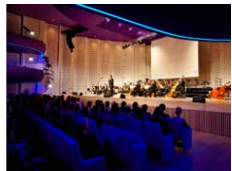
O stavbě rozhodlo minulé vedení radnice.

vání volných finančních prostředků na financování dotace a rovněž odčerpání dalších peněz z rozpočtu na nutnou spoluúčast při financování těchto projektů. Pro město by bylo mnohem výhodnější, kdyby dostalo celých 40 milionů korun v rámci splátky za výstavbu Kongresového centra a mohlo s nimi plně disponovat. Jenže to se už nestane,“ mrzí Bedřicha Landsfelda . Kongresové centrum se začalo stavět v červnu roku 2006, otevřené bylo v září roku 2010. Náklady na výstavbu dosáhly výše 725 milionů korun včetně DPH, z nichž 331 milionů měla tvořit evropská dotace. Kongresové centrum tvoří komplex s nedalekým Univerzitním centrem. [dvo]