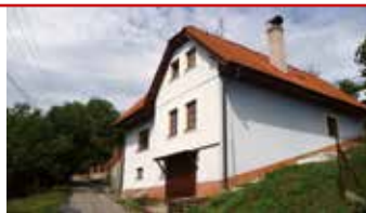
Jaroslavice / okr. ZL N07050

RD 4+kk v Jaroslavicích, dvě koupelny a WC, garáž, v klidném prostředí na okraji obce, pergola, zastávka MHD.