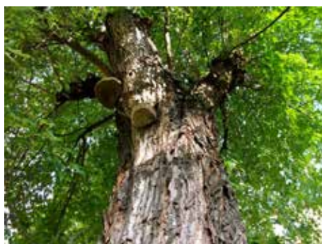
Plodnice dřevokazných hub.

Vodítkem, zda je či není strom zdravý, není ani zelené listy v koruně. „I takový strom může mít strukturální vady v kmeni, může mít poškozený kořenový systém. To ale odhalí jedině odborníci, kteří mají k dispozici řadu metod, jak zjistit zdravotní stav stromů,“ prohlásil Jaroslav Kolařík , uznávaný odborník ze společnosti SAFE TREES, který se stromy ve Zlíně zabývá už mnoho let. Rozhodnutí o pokácení každého stromu - s výjimkou akutních případů, které se vyskytují například po vichřici nebo úderu bleskem - předchází důkladný odbor-