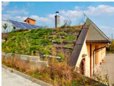
Domy kryté hlínou.

Lidé si staví extrémní ekologické domy ze slámy a hlíny. Obyvatelé „zelených“ domů ve zlínské části Chlum tak radikální nejsou. Zelený svah jim „kryje záda“, o teplo se stará slunce, a když už je hodně zima, zatopí v peci. Odpadní vody čistí kořenová čistírna. A na střeše si mohou udělat bylinkovou zahrádku. Obyvatelé domů na Jižním Chlumu si totiž postavili obydlí chráněná zemí.