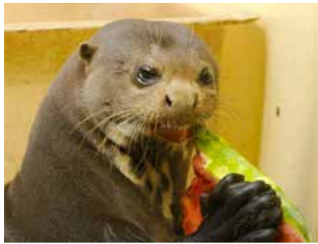
Vydra obrovská.

Na africkou vesničku navazují expozice pro hyeny, surikaty, antilopy kudu velké a zebu. Chybět nebudou ani ptáci - v nové