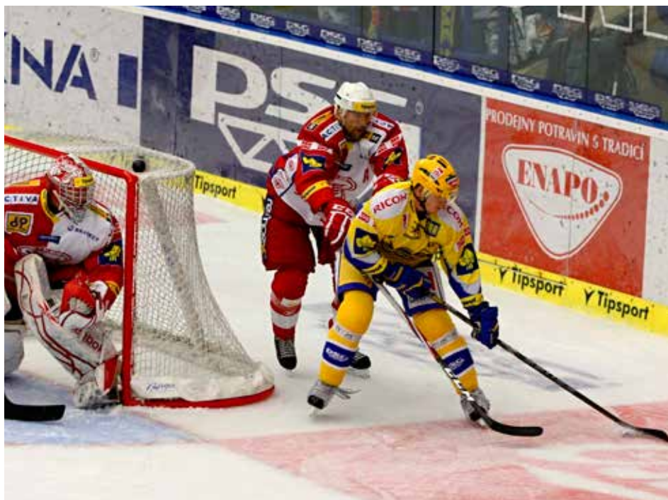
Zlínský tým má stabilizované finance i kádr.