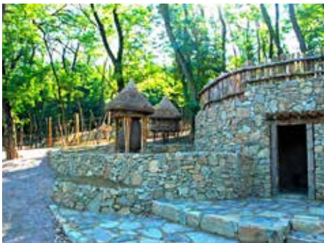
Etiopská kuchyň s vesničkou.

Vydry jsou vzhledem ke své hravosti a činnostem velmi atraktivní zvířata. Dva samci vyder obrovských přicestovali do Zlína z německého Tierparku Hagenbeck v Hamburku, kde se také oba dva narodili. Je to vůbec poprvé, co se tento druh objevil v některé z českých nebo slovenských zoologických zahrad. Ve venkovním výběhu u tropické haly mají tato čiperná stvoření dostatek prostoru nejen k aktivnímu plavání a potápění, ale i k pohybu po souši. Vydry obrovské jsou totiž velmi aktivní živočichové, kteří si rádi hrají. „Jsou to obratní a zruční lovci sladkovodních ryb, které tvoří podstatnou součást jejich jídelníčku. A kdo někdy viděl, s jakým mimořádným apetitem tyto vydry požírají jednu rybu za druhou, musí jim jejich chuť k jídlu doslova závidět. Za jeden den jsou schopny sežrat až tři kila ryb,