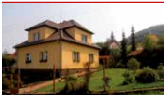
Zlín - Příluky / okr. ZL

Zrekonstruovaný dům 5+1 v klidné lokalitě, krásná zahrada, vnitřní krb, veranda, bazén, pozemek 825 m 2 , garáž, MHD.