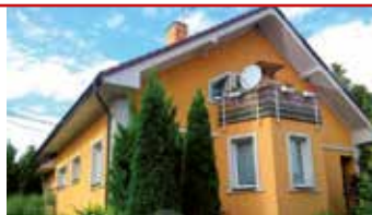
Zlín - Štípa / okr. ZL N06978

Atraktivní RD v klidné lokalitě, zahrada 674 m 2 , v přízemí byt 3+1, v podkroví 3+1 s balkonem, prostorný suterén.