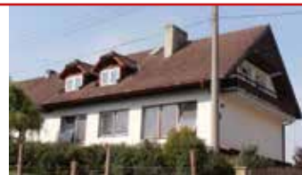
Želechovice / okr. ZL N07031

Samostatně stojící rodinný dům 5+1 v krásné a klidné lokalitě Paseky. Dvě garáže, zahrada o ploše 1.200 m 2 .