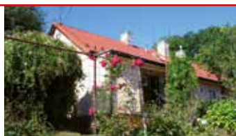
Zlín - Mokrá / okr. ZL N07003

Půldomek 3+1 s podkrovím a zahrádkou v klidné a žádané lokalitě na Mokré ulici, nová okna a fasáda, zahrada.