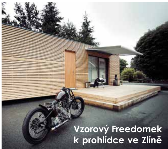
Vzorový Freedomek k prohlídce ve Zlíně