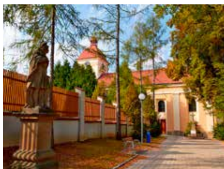
Současný vzhled kostela.

Po dlouhá staletí se osudy městečka Malenovic a města Zlína odvíjely nezávisle na jejich blízkosti. Třebaže leží v podřevnickém údolí téměř na dohled, náležely po většinu času každé k jiné vrchnosti, která obě obce spravovala jako střediska svých panství. K tomu nezbytně patřilo důkladné panské sídlo, v případě Malenovic mohutný gotický hrad, který vzhledem ke své stísněné poloze na ostrožně nad potokem Baláš neztratil ani po renesančních přestavbách a barokních úpravách nic ze strohé výrazu středověké pevnosti. A samozřejmě také farní kostel v uličce vedoucí z jednoho rohu náměstí, tedy v poloze obvyklé, jak ostatně vidíme i ve Zlíně, pro středověká založení.