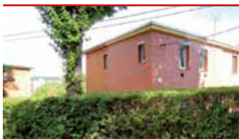
Zlín - Kotěrova / okr. ZL N06954

Batovský čtvrt domek v klidné lokalitě poblíž centra, původní stav, vhodný k rekonstrukci, velká zahrada, parkování.