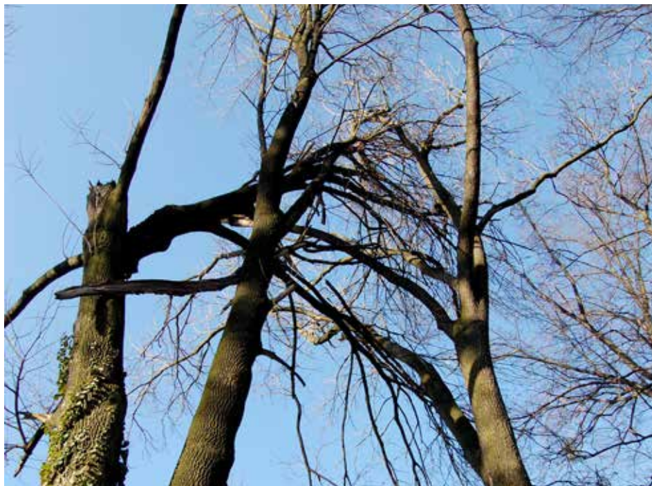
Prasklé větvení a zlom v koruně.

Svátek všech gurmánů a milovníků valašské kuchyně: to je Karlovský gastrofestival, jedinečná gurmánská akce, jejíž 4. ročník se uskuteční 5. až 7. 10. v údolí Léskové ve Velkých Karlovicích. V sobotu a neděli od 10.00 do 18.00 bude pro návštěvníky opět připravena Gastro tour s ochutnávkami krajových specialit a farmářským trhem. Letos se do ní zapojí již deset podniků v údolí Léskové, mezi nimiž hosty svezou vláček, historický autobus či koňský povoz. Gastrofestival nabídne i doprovodné akce - galavečeře, kuchařské show, lidovou veselici, barmanské večery i zábavu pro rodiny s možností hlídání dětí. Zpestřením bude účast kuchařů a producentů z Maďarska v čele s držitelem michelinské hvězdy, který svůj um předvede v sobotu 6. 10. při Michelinském obědu a Galavečeři. Gastrofestival vyvrcholí v neděli 7. 10. soutěží o nejlepší valašský frgál. Podrobnosti na www.karlovskygastrofestival.cz .