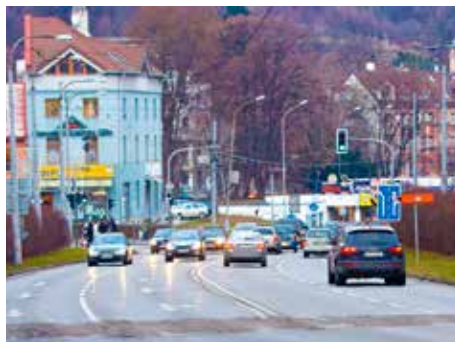
Ulice města denně trápí kolony aut.

Chybějící objízdny trasy k silnici I/49, nevyhovující podmínky pro cyklisty a chodce, problémy s parkováním. Zlín celá desetiletí trápí velké problémy v dopravě, které brzdí jeho rozvoj a komplikují životy jeho obyvatelům a návštěvníkům. Podle současného vedení radnice je už nejvyšší čas tyto problémy začít účinně a komplexně řešit.