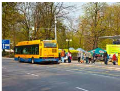
Vyhrazený pruh pro veřejnou dopravu.

Část návrhová přinese možnosti řešení, s ohledem na maximální eliminaci negativních jevů, tedy znečištění ovzduší, hluk nebo prašnost. Nepůjde o žádné nereálné vize, navrhovaná řešení budou vycházet z ekonomických a prostorových možností Zlína. „Prostě nezačínáme dělat žádnou studii do šuplíku. Máme opravdový zájem problémy v dopravě začít řešit, i když je jasné, že