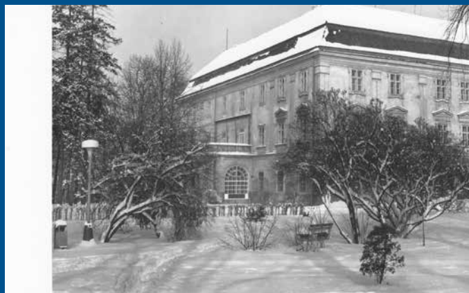
VÁNOČNÍ A NOVOROČNÍ POZDRAV