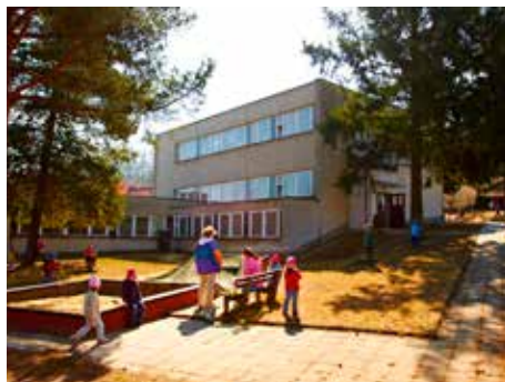
V MŠ Slínová vzniknou nové třídy.

Problém s chybějícími místy v mateřských školách město intenzivně řeší. V loňském roce otevřelo čtyři nové třídy pro předškoláky, jednu z nich pro 24 dětí v zařízení zřizovaném Univerzitou Tomáše Bati, kde tak vzniklo odloučené pracoviště MŠ Dětská.