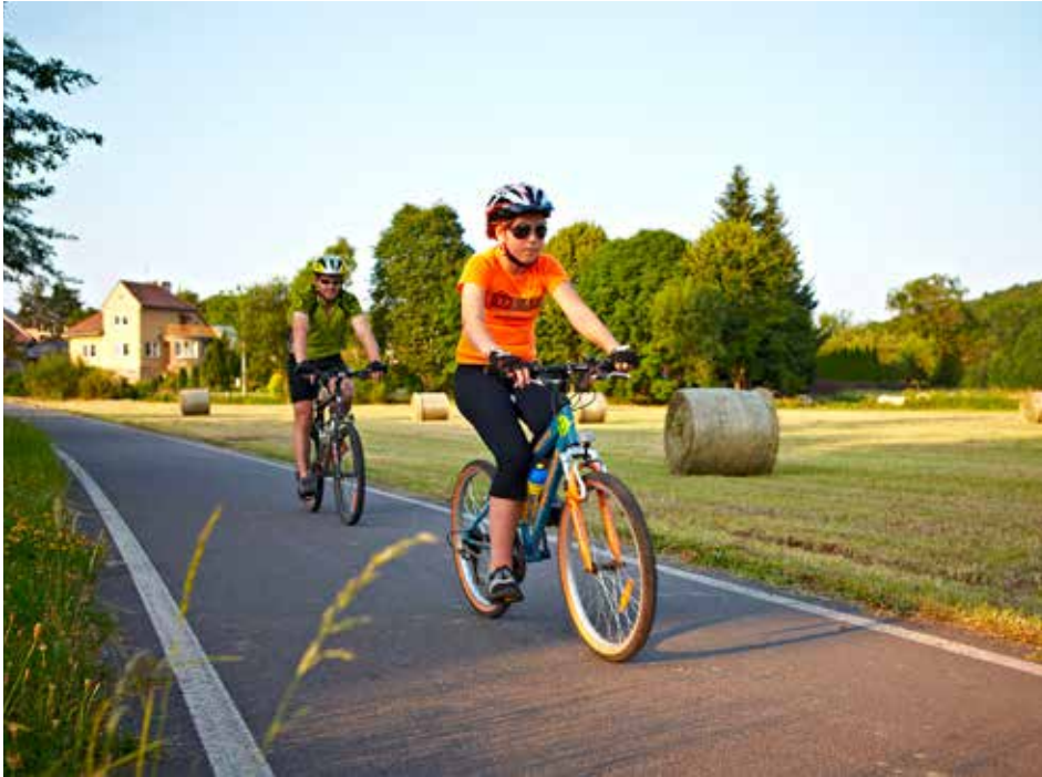
Zájmem radnice je posadit více obyvatel města do sedel jízdních kol.