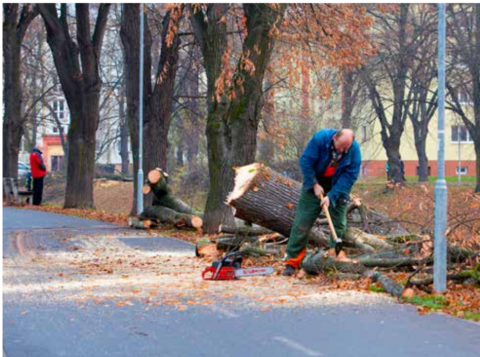
O kácení - ale i sázení - stromů chce město veřejnost co nejpodrobněji informovat.