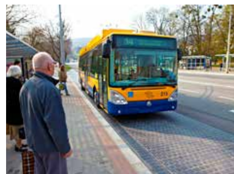
Význam MHD by měl růst.

Vytyčení alternativní trasy pro odvedení dopravy z I/49 je vysloveně nutné v úseku Prštňné – Obeciny, v ideálním případě až po Příluky. Ke zklidnění dopravy přispěje také vylepšení podmínek pro cyklo-dopravu. Pokud se to podaří, je velmi pravděpodobné, že řada lidí dosud usedajících do svých aut přeseďne na jízdny kola.