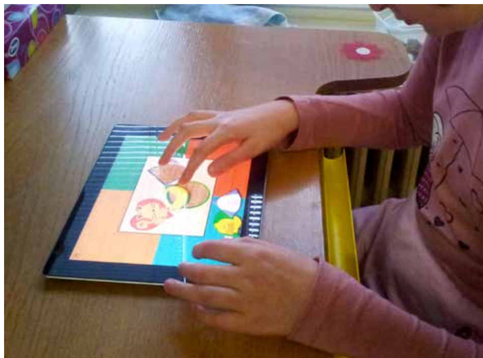
Školáci používají k vzdělávání moderní techniku.

lostí, dovedností a komunikace zábavnou formou. „Používáme vzdělávací programy pro rozvoj smyslového vnímání, rozumových schopností, komunikace, čtení, grafomotoriky i početních operací. Výhodou je, že nám jeden přístroj dokáže vynahradiť slabikář, čítanku, písanku, výkres, soubor příkladů do matematiky, kalkulačku, katalog zvířat se zvuky i obrázky a spoustu dalších věcí. Pro děti je to něco nového, jiného a zábavnějšího. Pořád je to ale jen jedna z možností,“ vysvětlila Vladislava Siegllová z ZŠP a ZŠS Zlín. [red]