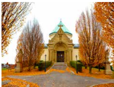
Hřbitovní kaple s hrobkou ve Štípkě.

V něm konali své bohoslužby také baptisté a adventisté, kterým se však v posledních