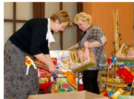
Pracovnice MŠ balí hračky.

Na práce spojené s nadcházejícím zimním obdobím mají Technické služby Zlín v rozpočtu vyčleněnou celkovou částku 11,5 milionu korun. [dvo]