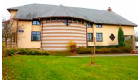
Modlitebna v Malenovicích.