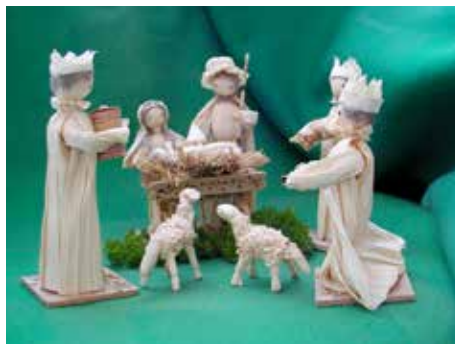
Ilustrační foto. / foto: archiv

Na malém hospodářství v horách pod Syrákovem se narodili dva beránci. Jejich matkou byla nejstarší ovce ze stáda, kulhavá na jednu zadní nohu, říkali jí chromá Teruška. Zvěrolékař zdvihl oba čerstvě narozené beránky do vzduchu a povídá: „Vidíš, Teruško, zas máš dva pořádné klacíky! Jako každý rok!“ A beránci krátce zabekli a štrachtali se na ty svoje křivé noženyky. Teruška je olizovala,