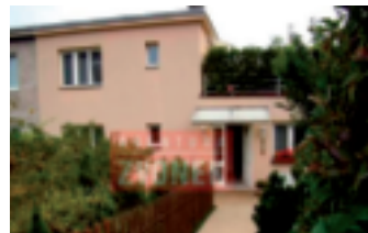
Půldomek Zlín - Lesní čtvrť

Půldomek 5+1 s přístavbou a parkováním, po rekonstrukci v roce 2002, krbová kamna, velká terasa (40 m 2 ); oplocená zahrada.