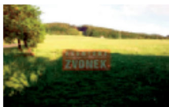
4 stav. pozemky Provodov (okr. ZL)

Prodej 4 atraktivních pozemků nedaleko Zlína. Orientace na JZ, rozloha 1.200 - 1.500 m 2 (šířka 18 - 22 m), všechny IS jsou v dosahu.