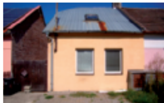
RD Zlín - Louky se zahradou

RD 3+1 se zahradou (120 m 2 ), u domu je velký dvůr s posezením. Vhodná investice pro firmu, jako sídlo společnosti.