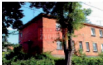
Čtvrtdomek Zlín - Mostní SLEVA!

Čtvrtdomek nedaleko centra Zlína, provedeny mírné úpravy, částečně podsklepený, předzahradka, možnost parkování.