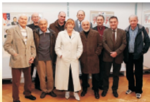
Zakladatelé a hlavní osobnosti OF ve Zlíně po 20 letech v Alternativě

Pozvat nejvyššího představitele římskokatolické církve - jeho Svatost - k návštěvě Zlínského kraje v roce 2013 odletěli v listopadu do Vatikánu zástupci Zlínského kraje a statutárního města Zlína. Návštěva Svatého otce by se mohla uskutečnit u příležitosti oslav 1150. výročí příchodu sv. Cyríla a Metoděje na Moravu, v den jejich svátku 5. července 2013.