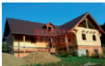
Rozestavěný RD Držková SUPER!

Hrubá stavba podsklepené dřevěnice s travnatými pozemky o výměře cca 1.5 ha v krásné přírodě Hostýnských vrchů.