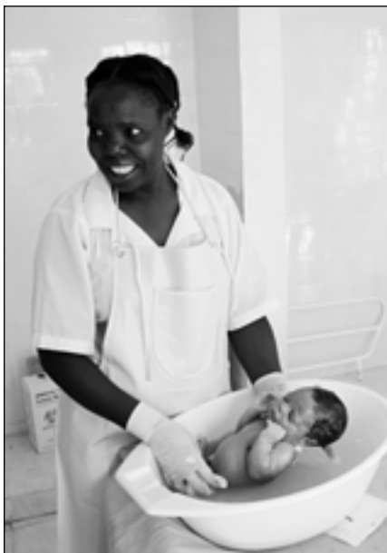
Novorozenec v porodnici v Keni.