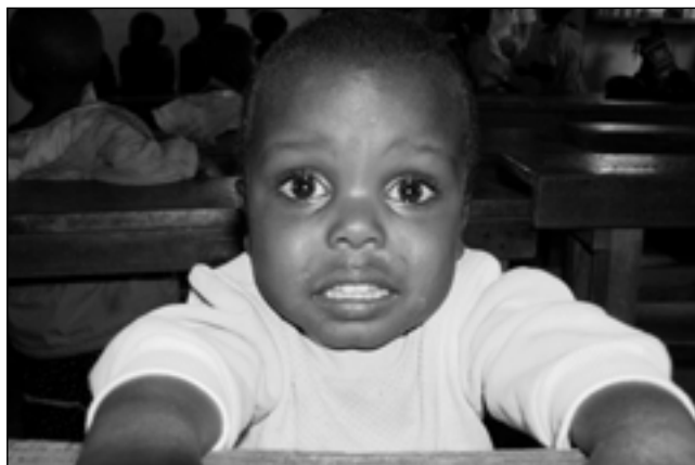
Sirotek z Keni.