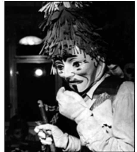
Maska „laufřa“, Žlutava 1969.

vé sáčky se zlatými stužkami, do nichž zákazníkům nakoupené dárky rovnou balili. Noviny doporučovaly jako mikulášské dárky nejen hračky a sportovní potřeby pro děti, ale i kolekce punčoch pro maminky, rukavice, kabelky či límečky na šaty pro dcery, kožené obaly