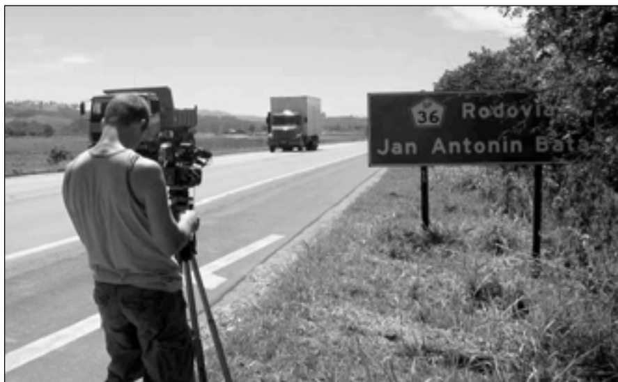
Po J. A. Bařovi jsou v Brazílii pojmenována nejen města, ale i silnice či mosty.