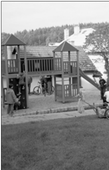
21. října 2006 se konala v Jaroslavicích na novém dětském hřišti (před bývalou školou) akce "Setkání před školou". V hraní k poslechu se střídaly místní dechovka a country kapela, které si přišlo poslechnout asi 50 lidí s dětmi. Setkání se moc líbilo a pořadatelé již plánují jeho jarní reprízu.