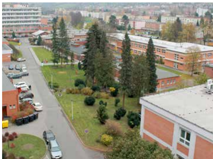
Nemocnici založil ve Zlíně Tomáš Baťa.

Město Zlín se snaží pomáhat KNTB dlouhodobě. Vyčlenilo například byty pro zdravotnický personál nemocnice, pro který se tak práce ve Zlíně stala atraktivnější, pomáhá se zkvalitňováním prostředí nemocnice, podporuje projekty, které mají za cíl vylepšovat její vybavení a funkčnost. Dlouhodobě podporuje dárcovství krve a různé charitativní akce, například Život je dar nebo Malé mimi. Ve stádiu příprav jsou zásadní dopravní opatření, která mají zvýšit dostupnost KNTB, půjde například o vznik nových parkovacích míst na Havlíčkově nábřeží, výstavbu cyklostezky, v úvahu přichází i zavedení MHD do areálu nemocnice. Již několik let funguje tzv. centrální linka MHD, která na své trase propojuje nemocnici s různými institucemi a klíčovými částmi Zlína. „Pozitivně vnímáme, že hospodaření nemocnice se nyní dostalo do plusových čísel,“ dodal Miroslav Adámek . [dvo]