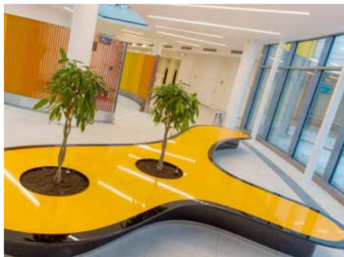
Nové univerzitní prostory jsou funkční i elegantní.

S Janem Kaplickým spolupracovala na návrhu části obchodního domu Harrods. V roce 1999 založila společně s Petrem Vágnerem atelier AI - DESIGN, s.r.o. Všeobecnou známost jí přinesly zejména interiéry módních domů a butiků v mnoha světových metropolích. V České republice patří mezi její nejznámější realizace Nová oranžerie na Pražském hradě, Kongresové a univerzitní centrum ve Zlíně, hotel Josef nebo rekonstrukce kostela sv. Anny v Praze. V roce 2011 obdržela čestný doktorát od zlínské univerzity za celoživotní dílo a přínos v oblasti architektury a interiérového designu a za excelentní prezentaci Univerzity Tomáše Bati ve Zlíně v ČR i v zahraničí. [jm]