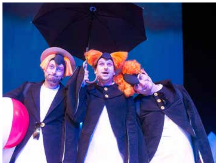
Tučňáci na ledu.

I dresscode akce je předem dán: Tučňáci přijdou na stadion ve fraku a Berani nastoupí k zápasu v retrodresech ze sezony 1960-61. [mdz]