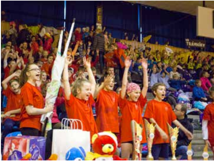
Školáci vytvořili v hledišti fantastickou atmosféru.