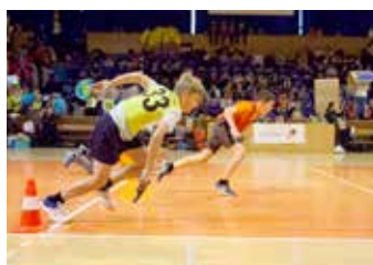
... důraz na rychlost.