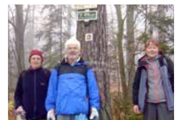
Pomoc přírodě.

„Než jsme došli na Soudnou, naplnili jsme další dva pytle. To už jsem zavolal na Odbor životního prostředí zlínského magistrátu a oznámil, kde jsme pytle zanechali, aby je bylo možno odvézt. Za závorou po žluté směr Zboženské rybníky odpadky téměř nebyly, takže jsme si mohli už-