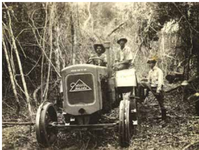
Firma expandovala do celého světa.