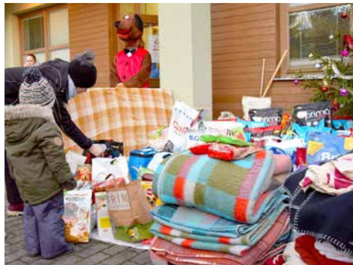
Vánoční pomoc útulku byla opět veliká.

První lekce zdarma. Formování těla, harmonizace, posílení imunity, relaxace.