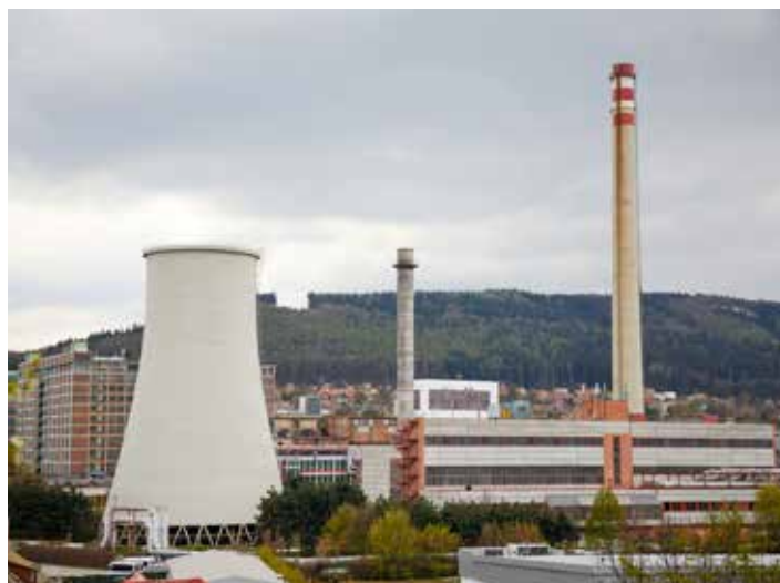
Cena tepla pro odběratele společnosti Teplo Zlín poklesne.

V pořadí měst v ČR podle ceny vody už Zlín klesl z nelichotivého 2. místa v roce 2011 do čtvrté desítky. Může za to tzv. „mrazení“ cen vody, což znamená, že od roku 2012 se cena mění pouze o inflaci, kterou město nedokáže ovlivnit. Letos bude klesání pořadím díky snížení ceny vody nadále pokračovat. Za svou denní spotřebu vody Zlíňan zaplatí cca 8 korun. Více informací z oblasti vodárenství zájemci naleznou v banneru Voda ve Zlíne, který je umístěn na hlavní stránce webu www.zlin.eu.