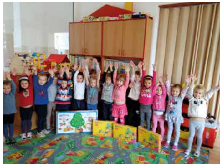
z Mateřské školy Zlín, Kúty.

Tradiční předvánoční dárek od města letos obdrželo devět zlínských mateřských škol. Hračky v hodnotě 10 tisíc pro každou z nich převzaly jejich ředitelky na společném slavnostním setkání