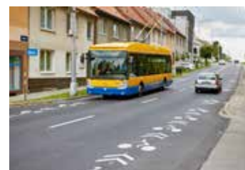
MHD je dostupné.

K poslední změně cen jízdného došlo v roce 2011 a od té doby se jezdí v MHD za stejné částky.