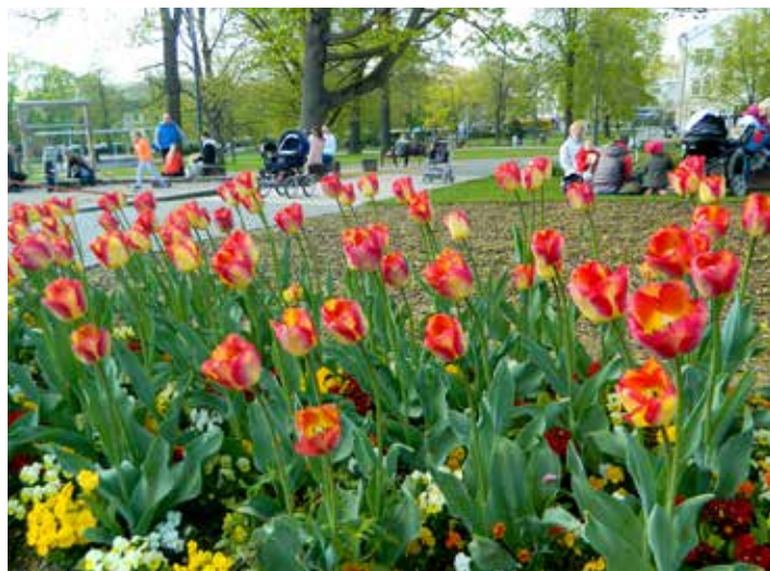
Město zdobí stále více květin.

„Ročně si v naší okrasné školce vypěstujeme kolem jednoho tisíce sazenic keřů a trvalek a provozujeme také vlastní skleníky pro květinové výpěstky letniček a dvouletek,“ uvedl vedoucí odboru. Dalším oddělením je oddělení dětských hřišť, které jak už název napovídá, pečuje o všech 250 dětských hřišť ve městě, včetně stezky zdraví na Tlusté