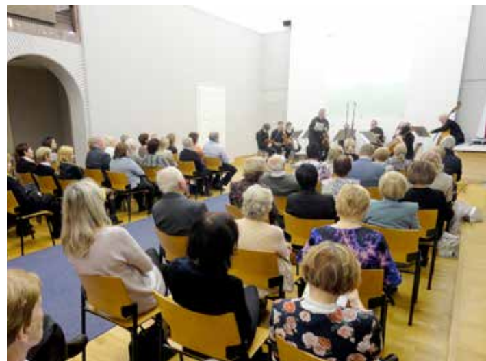
Obřadní síň radnice se zaplnila hosty.