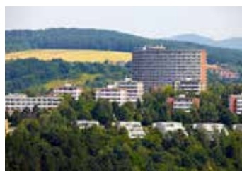
Nájemné zůstává stejné.

Snížení ceny, první od roku 2004, je výsledkem několika-měsíčních jednání mezi městem Zlínem a společnostmi Vodovody a kanalizace Zlín (VaK) a Moravská vodárenská (MOVO). Pokles ceny vody o jednu korunu se projeví na dalším snížení zisků Moravské vodárenské a to o osm milionů korun. Navíc tato soukromá společnost slíbila navýšit o pět milionů roční nájemné, které platí VaK.