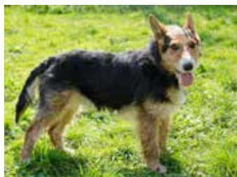
LEOŠEK.

je to pevné rozhodnutí. Velkou solidaritu jsme pocítili i v případě velmi staré feny křížence staforda, která trpěla inkontinencí a vrátili nám ji po šesti letech z pěstounské péče. Pěstouni nám posílají fotky a my jim děkujeme za velkou obětavost. Bohužel hodný 12letý labrador Peron se šťastného konce nedočkal, praskl mu nádor v dutině břišní a veterinář se rozhodl jeho trápení ukončit. Stalo se to zrovna v den Vánoce v útulku, takže měly bohužel i trochu smutný nádech. Ale to tak v útulku je a vždycky bude, to je útulkový život. Spíše jsme vždy smutní, když se tak hodný pes nedočká pocitu svého domova.