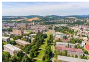
Město Zlín. / ilustrační foto

vyhlášky. Osoby pobírající jakýkoliv druh důchodu, který je jejich jediným zdrojem příjmů, platí po prokázání 200 Kč. Splatnost tohoto poplatku je při roční periodě platby 30. dubna a při nahlášené pololetní periodě platby, kdy část-