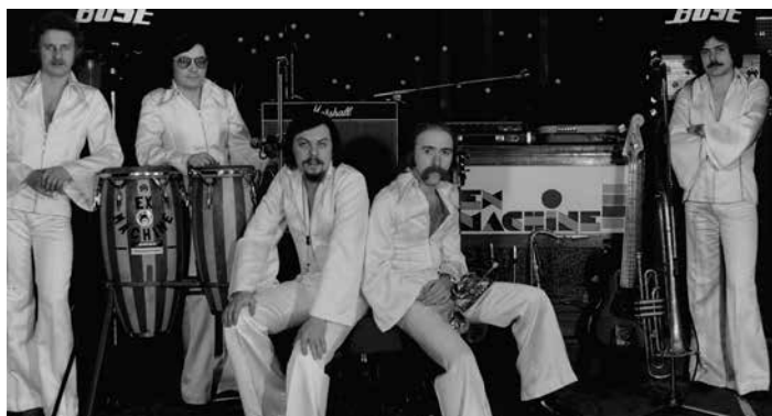
Ex Machine.

V minulém vydání jsme na straně dvě formou starých fotografií připomněli bigbeatovou hudební scénu v tehdejší Gottwaldově. Snímek skupiny Ex Machine nebyl bohužel otištěn celý. Omlouváme se. Proto se k tématu ještě vracíme a fotografii uveřejňujeme znovu. [red]