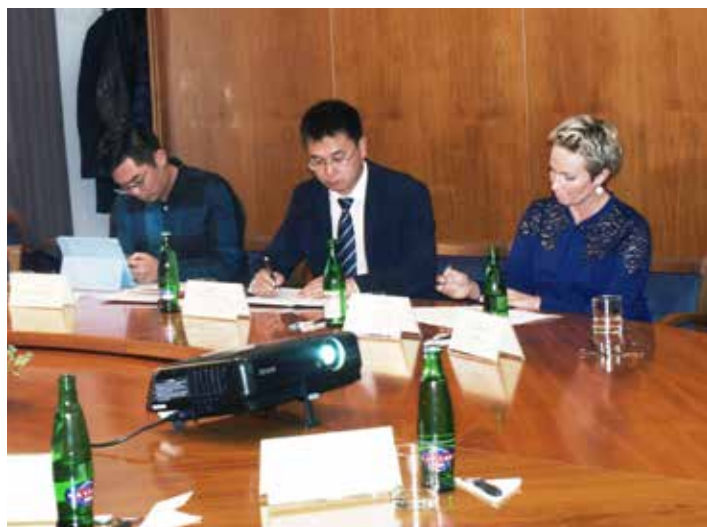
Atraktivitu Zlína pro investory zvyšuje univerzita.

být i možnost výměnných pobytů a stáží,“ prozradil Liu Wenchao (Adams Liu) . [fab]