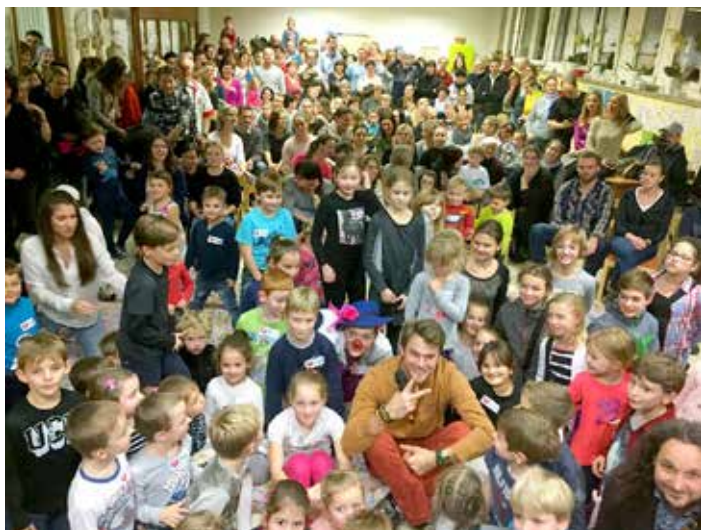
Akci podpořil i zpěvák a herec Vojta Dyk.

Rekordních 408 tisíc korun vynesl charitativní Den pro Zuzanku, který se uskutečnil v úterý 12. prosince ve Zlíně. Tato tradiční akce se koná každý rok před Vánoci na památku Zuzanky Oškerové, která v roce 2012 v necelých pěti letech podlehla akutní leukémii.