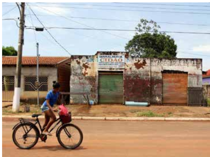
Snímek z natáčení filmu Batalives.