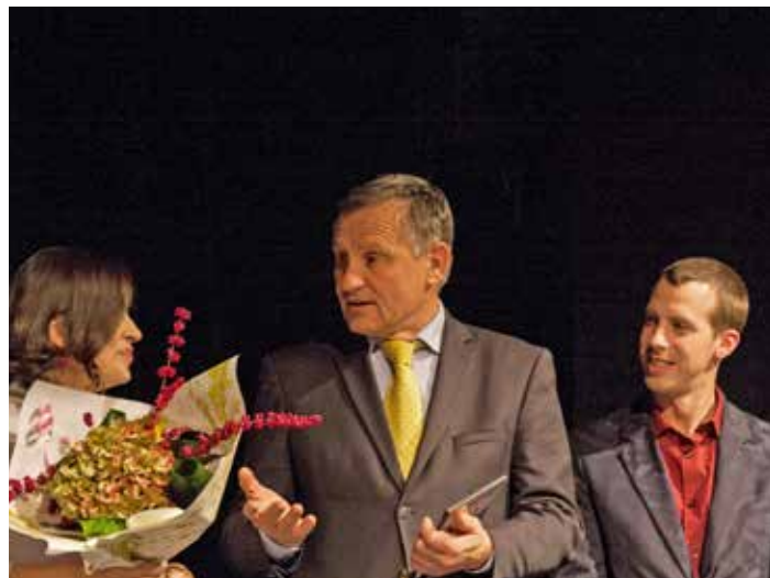
Premiéra dokumentu.

Jaké to je být muzikantem? Ustojí vybraných 70 žáků z krajských zúšek tvrdou prací po boku „starších kolegů“ z Filharmonie Bohuslava Martinů Zlín a dokážou naplnit očekávání a požadavky dirigentů? Štáb trávil s akterky historicky nejrozsáhlejšího projektu veřejných základních uměleckých škol v kraji několik měsíců, zachytil řadu myšlenek, pozadí toho, jak funguje orchestr, jakou roli hraje motivace, úspěchy i nezdary... Koncerty se odehrály na jaře 2017 v Kroměříži, Uherském Brodě a ve Zlíně. [fab]