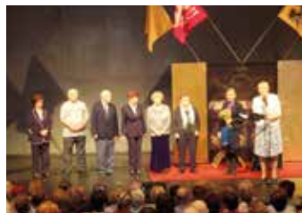
Ze setkání v divadle.