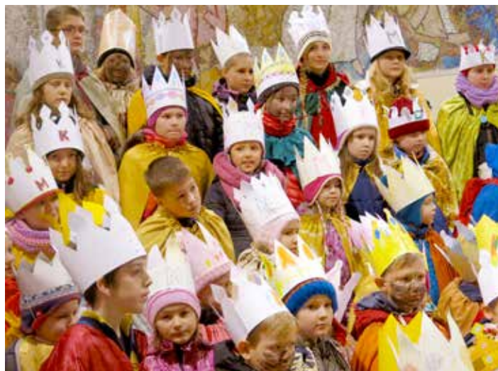
Do ulic vyrazí koledníci.

Při péči o lidi bez domova spotřebuje Oblastní spolek Českého červeného kříže ve Zlíně velké množství oblečení a potravin. Obzvláště v zimních měsících se potýká s nedostatečnou zásobou těchto věcí a naléhavě prosí veřejnost o pomoc. Vítá potraviny ve formě konzerv, potraviny trvanlivého charakteru, brambory, luštěniny, kávu, čaje aj. Dále uvítá i hygienické potřeby, teplé oblečení, deky, spacáky a obuv. Více o možnostech pomoci v OS ČČK Zlín, Potoky 3314, tel. 577 430 011, e-mail: nizkoprah.cckzlin@volny.cz . [jo]