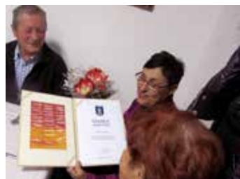
Poděkování za spolupráci.

jim, vzít na sebe roli posluchačů, posedět a strávit s nimi chvíli. Je to pro ně velmi důležité, stávají se součástí jejich osudů,“ promluvila