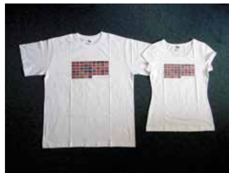
Nová trička s motivem 50 Shades of Zlin.

nila Eva Manišová . Trička jsou k zakoupení na „íčku“ na náměstí Míru. V nabídce je dámské (S – L) i pánské (L – XL) provedení. Cena je 199 korun za kus. [ond]