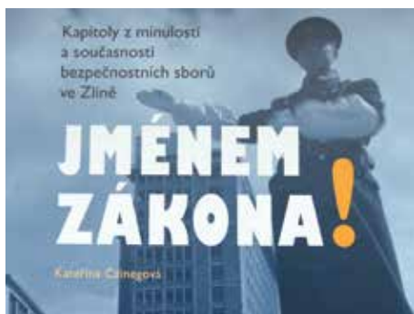
Titulní strana knihy.

Publikace je k dostání na recepcích v budovách 14 a 15 Baťova institutu a ve vybraných zlínských knihkupectvích. [kc]