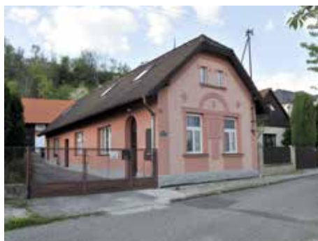
Na Výsluní.

Zlín tu stojí sedm století a domy nesoucí historickou pečeť jsou ve zdejších poměrech nenahraditelné. Stojí tu vedle supermoderní, funkcionalistické baťovské