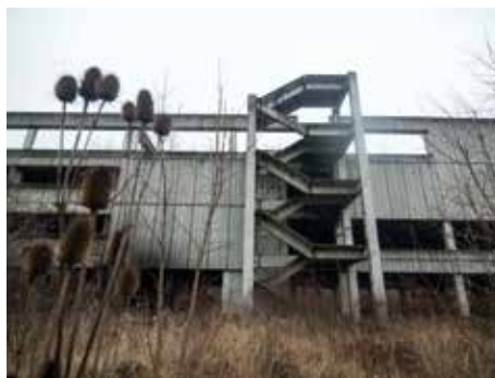
Nechvalně známé „torzo“.

Železobetonový skelet na Jižních Svazích, tržiště Pod Kaštany, bývalá budova okresního soudu, Velké kino či bývalé kino Květen. Jak to aktuálně vypadá se zlínskými „torzy“?