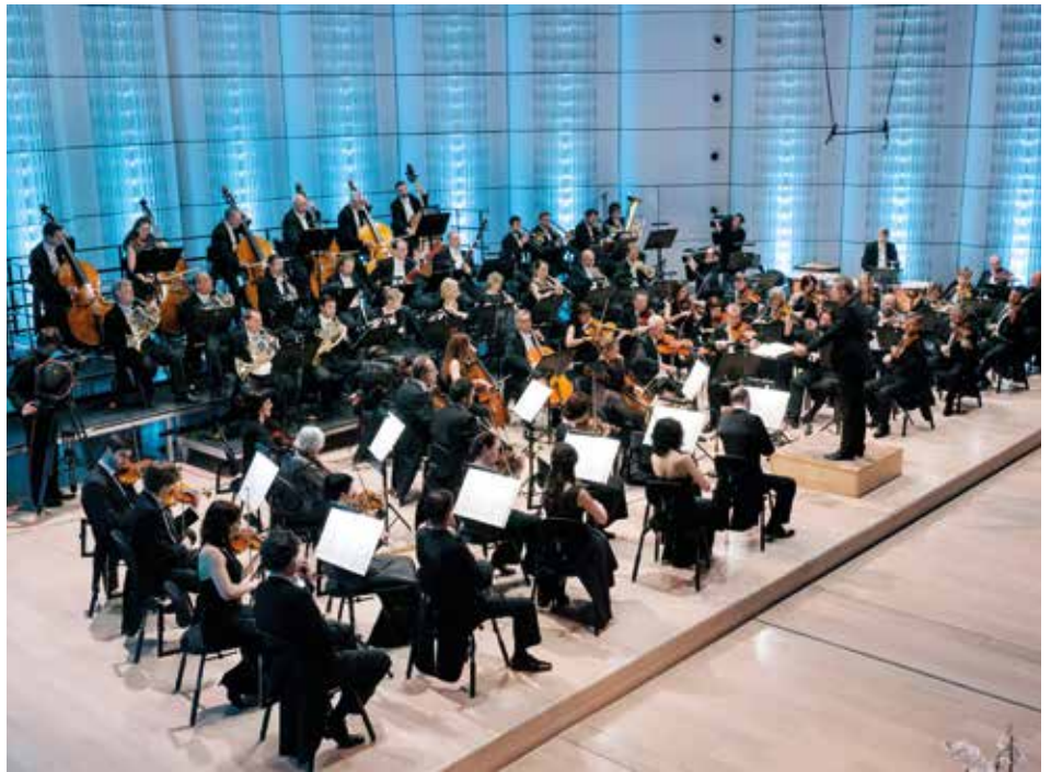
70. výročí Filharmonie Bohuslava Martinů.

Odbor městské zeleně, který poté bude hřiště udržovat, dobuduje k prvkům vhodnou dopadovou plochu. [dvo]