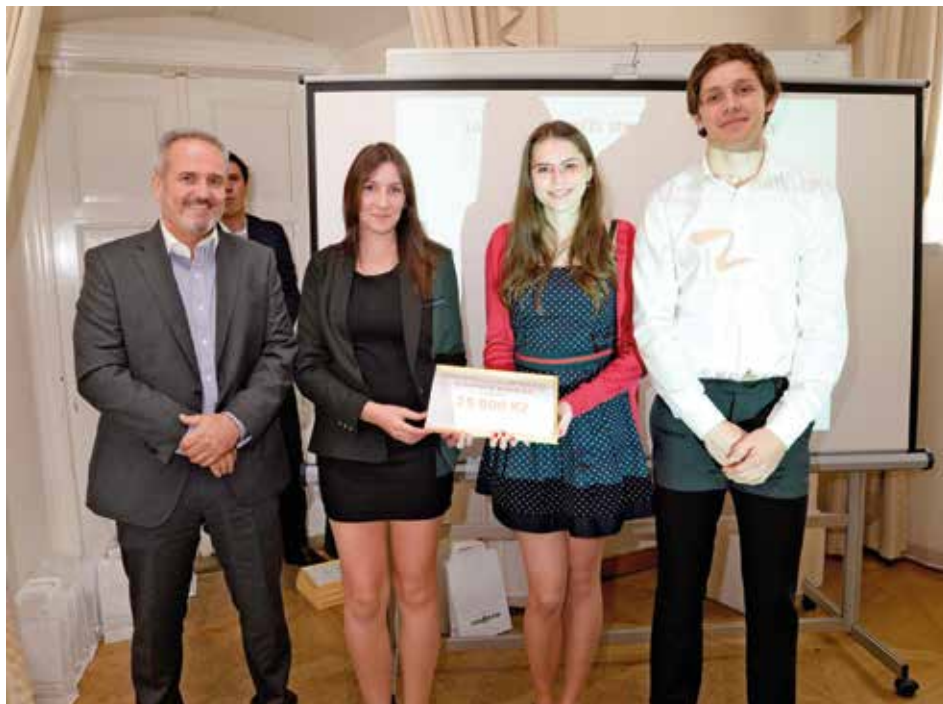
Vítězný tým ze Střední průmyslové školy Zlín.

JAR má dva a půl tisíce kilometrů mořského pobřeží a vysokou rozmanitost klimatických podmínek. [dvo]