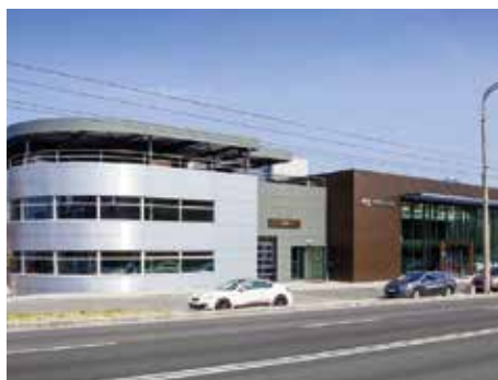
Oceněn byl i tento autosalon.

tegorii Průmyslové a zemědělské stavby , „Anvis AVT – dostavba haly Drnovice“, projektovaná S-projektem plus, a „PWO Czech Republic – rozšíření výroby komponentů pro automobilový průmysl, Valašské Meziříčí“. Vzhledem k náročnosti řešení a celkovému kvalitnímu zvládnutí realizace byly obě stavby ohodnoceny shodně čestným uznáním.