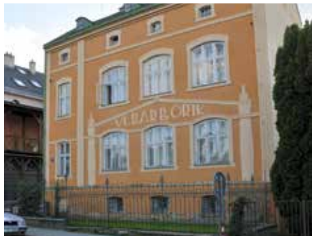
Dům na Lešetíně.