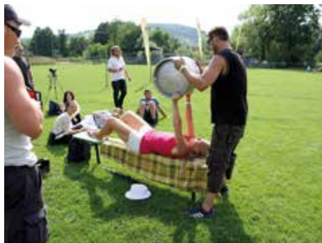
Pivní slavnosti Lužkovice.

Na 9. ročník Lužkovických pivních slavností zve místní část Lužkovice. Akce proběhne v sobotu 30. července od 14.00. Těšit se můžete na vystoupení 5 hudebních kapel – Martin Motýl s kapelou, Overband, Iron Maiden – revival, Tabák – Kabát – revival, ZZ Bar. Pro děti je připraven dětský koutek se skákacím hradem a různými soutěžemi. „Na ochutnání zde bude 60 druhů piva. Pro dospělé jsou taktéž připraveny různé soutěže, například hod pivním sudem, pití piva na čas, apod.,“ zve Zdeněk Richter z Kanceláře místní části Lužkovice.