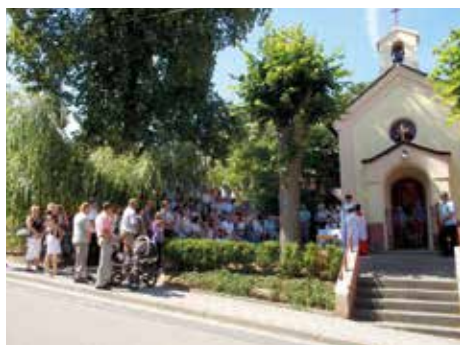
Anenská pouť v Jaroslavicích.

Červencový Magazin Zlín přináší tipy na zajímavé akce ve Zlíně a okolí, které se uskuteční v první polovině prázdnin. Těšit se můžete na vycházky, poutě, pivní slavnosti, výstavy či prohlídky hradů (dětská, strašidelná, noční). Stačí si jen vybrat.