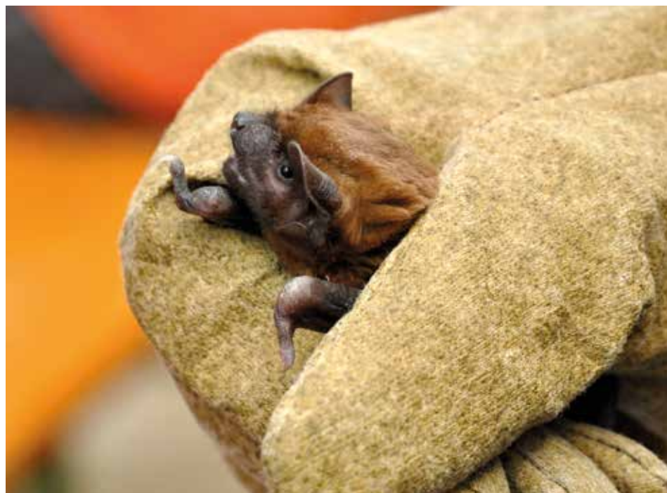
Netopýř rezavý tak zblízka, jak často k vidění není.

Město pomáhá k ochraně netopýřů trvale. Pořádá osvětové akce pro veřejnost, například Večerní vycházky za zvířecími obyvateli Zlína s praktickými ukázkami moderních metod používaných při výzkumu těchto živočichů, podporuje výukové programy zaměřené na netopýří tematiku pro školy, v rámci akcí pořádaných radnicí jsou veřejnosti k dispozici netopýří poradny s ukázkami hendikepovaných netopýřů. [dvo]