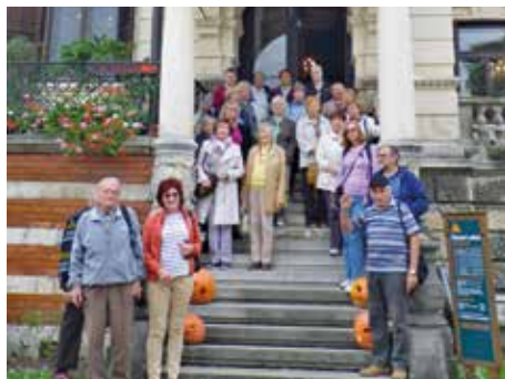
Spojuje je výtvarné umění.

Šedesáté výročí od svého vzniku si letos připomíná Klub přátel výtvarného umění a knihy. Byl založen v roce 1956 v Praze Českým fondem výtvarných umění při podniku Dílo. V dobrovolném seskupení, které navázalo na dlouholetou tradici sahající až ke Společnosti vlasteneckých přátel umění, se scházeli lidé, které spojoval společný zájem o dějiny a současnost výtvarného umění.