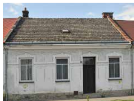
Dům na Sokolské.

architektury a vzájemné sousedství různých stylů mluví samo za sebe. V kontrastu starého a nového je (ač si to někdy málo uvědomujeme) síla a přitažlivost Zlína, který přece ani za Bati nebyl funkcionalistickou monokulturou, ale organicky utvářeným lidským sídlem. Se zbouráním každého starého domu ztrácí Zlín kus pestrosti a mnohotvárnosti, kus sebe samého. Vývoj dospěl k tomu, že každý z hrstky starých domů má stále vyšší morální hodnotu.