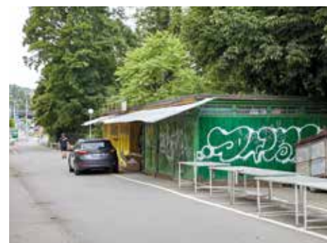
Trh Pod Kaštany.