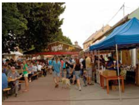
Prštnenské slavnosti piva.

Již 6. ročník Prštnenských slavností piva se uskuteční v sobotu 16. července na návsi ve Zlíně-Prštném. Program začíná ve 13.00. „Pro návštěvníky máme připravenou spoustu druhů piv různých pivních stylů, bohaté občerstvení, živou hudbu i zábavu pro děti,“ zve za SDH Prštné Pavel Samohýl . Součástí slavností bude od pravého poledne 2. ročník letního turnaje kolové v místní sokolovně. Na tradiční akci, která se koná za každého počasí, zvu místní hasiči.