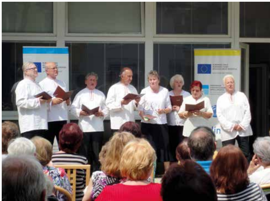
Zpívaly se také lidové písničky.

Město Zlín pořádá v rámci Evropského týdne mobility akci s názvem Den jízdního kola na náměstí Míru, uskuteční se 22. září. V jeho rámci se budou moci prezentovat prodejci a výrobci jízdních kol, elektrokol, koloběžek, elektrokoloběžek, dalších obdobných dopravních prostředků a jejich komponentů. Prodejci se mohou na akci přihlásit do 31. srpna, a to nejlépe na e-mailové adrese: martinhabuda@zlin.eu . [mh]