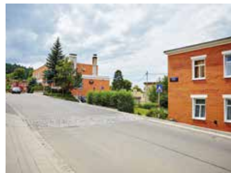
Ulice se mění k nepoznání.

Mostní bude po dokončení širší v průměru o tři čtvrtě metru. Kluzké a značně poškozované kostky nahradí asfalt. „Křižovatky budou mírně vyvýšené, aby řidiči museli přibrzdit, což zvýší bezpečnost chodců. Na to, že najíždí na křižovatku, bude automobilisty upozorňovat i dlažba,“ uvedl primátor Miroslav Adámek . [dvo]