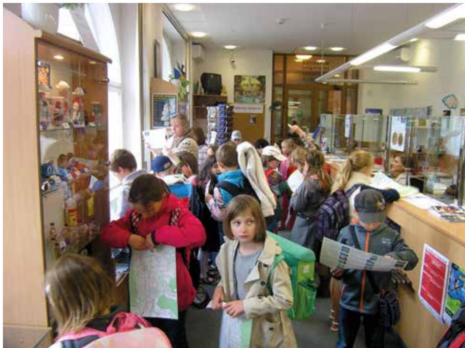
Školáci při návštěvě takzvaného „ička“ v přízemí radnice na náměstí Míru.