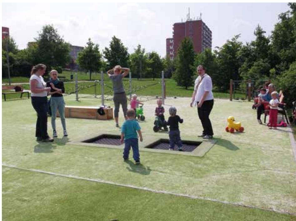
Hřiště je od otevření velmi oblíbené.