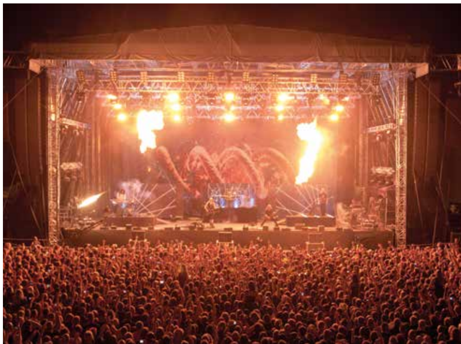
Koncerty přinášejí neopakovatelnou atmosféru.