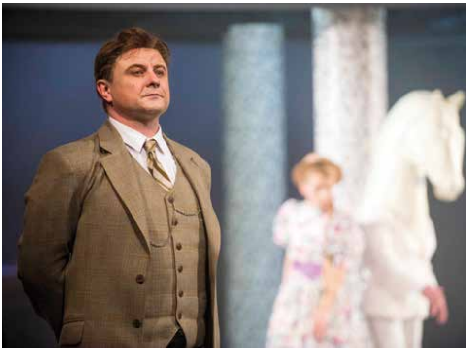
Inscenace si získá další diváky díky televizi.