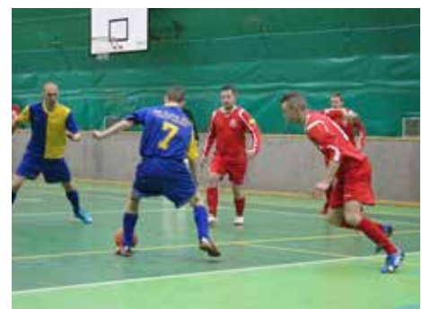
Turnaj nabízí dramatické boje. / foto: archiv

Výsledky turnaje a další informace, včetně historie celé akce, jsou k dispozici na stránkách www.zlinskypohar.cz .