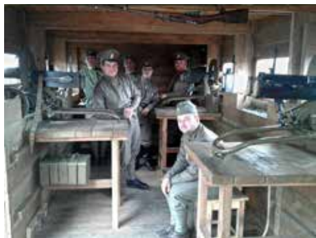
Rekonstruovaný interiér.

Nejvýznamnějším počinem v rámci projektu je Legiovlak, který projede do roku 2020 celou Českou republiku a zavítá i na Slovensko. Ve Zlíně si jej mohli fanoušci historie prohlédnout v průběhu listopadu. Legiovlak se skládá z 11 zrekonstruovaných vagonů, které představují vojenský ešalon. Takovými vlaky se desetitisíce čs. legionářů přepravily napříč Ruskem po Transsibiřské magistrále a průjezd si často museli vynutit bojem s bolševiky.