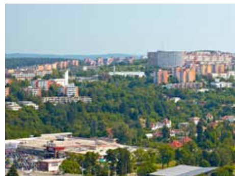
Daň z nemovitosti zůstává stejná.