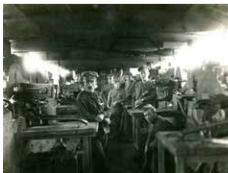
Dobový snímek.

Obrněné vlaky se poprvé začaly používat ve válkách v druhé polovině 19. století. Jejich úkolem bylo nejen zajišťování bezpečnosti na trati, ale v době války rovněž zapojení se do bojových operací, odehrávajících se v blízkosti železnice. Poprvé byl improvizovaný obrněný vlak našimi vojáky použit v březnu 1918 při bojích s německou armádou u železničního uzlu Bachmač. V rámci otevřených bojů čs. legionářů s bolševiky od května 1918 byly obrněné vlaky jedním z nejdůležitějších bojových prostředků armády. [pb]