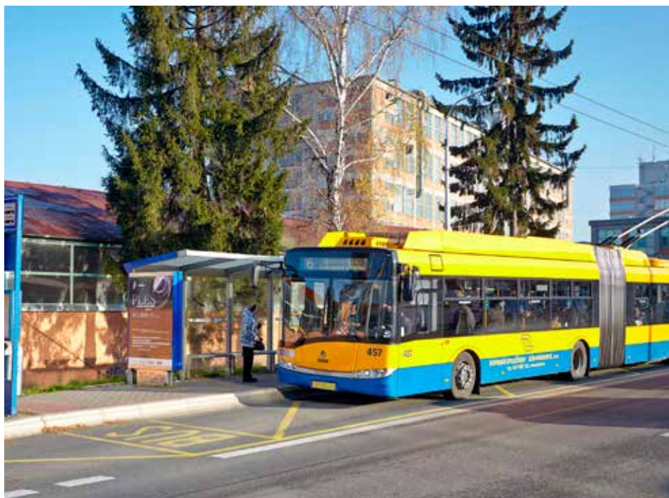
Podmínky pro cestování MHD se průběžně zlepšují.