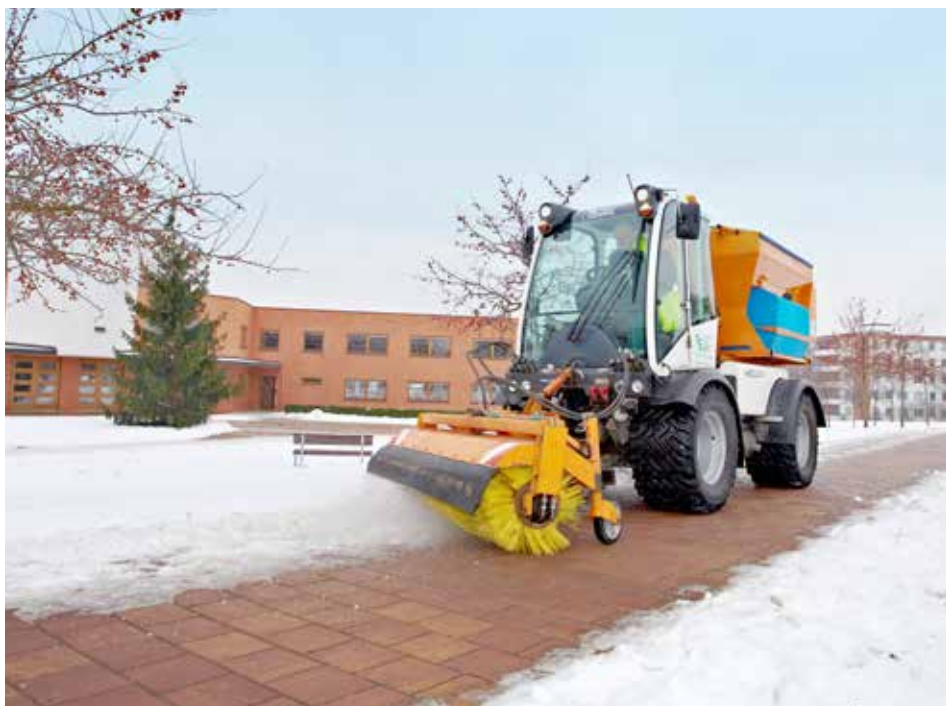
Na příchod zimy jsou TS Zlín připraveny.