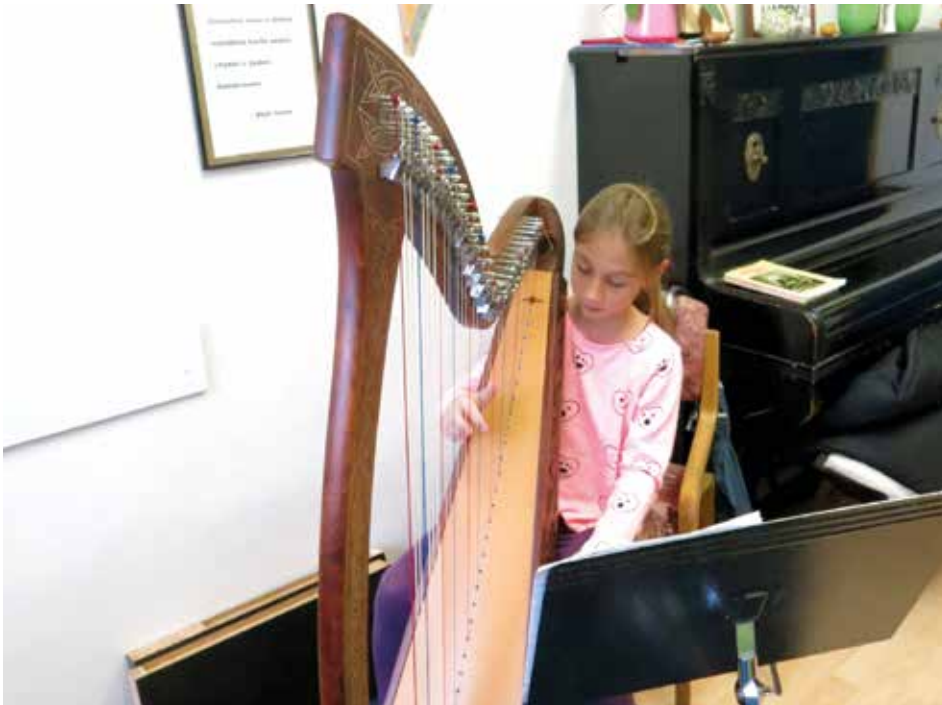
Harfová škola Zlín.