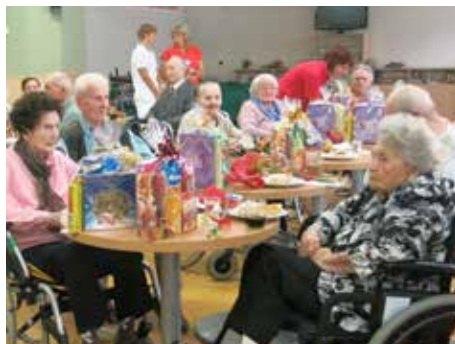
Město pravidelně přeje jubilantům.