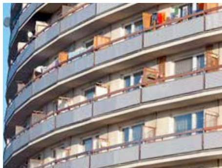
Nájemné se nemění.

Společnost VaK Zlín, ve které je největším akcionářem město, uzavřela letos se společností Moravská vodárenská, která je