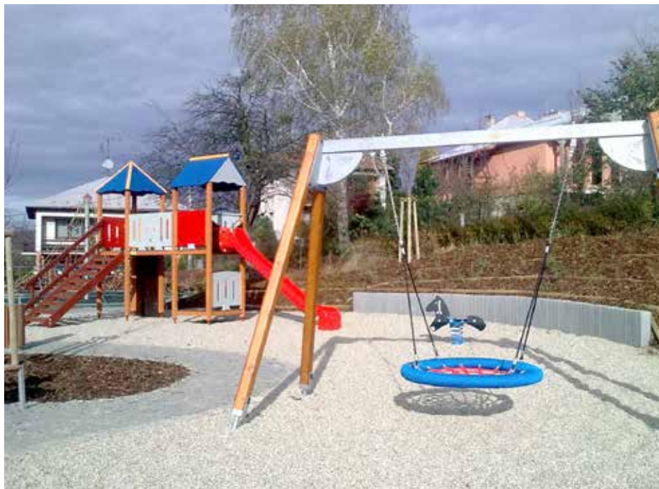
Rekonstrukce hřiště v MČ Kudlov hrazená z prostředků přidělených MČ.