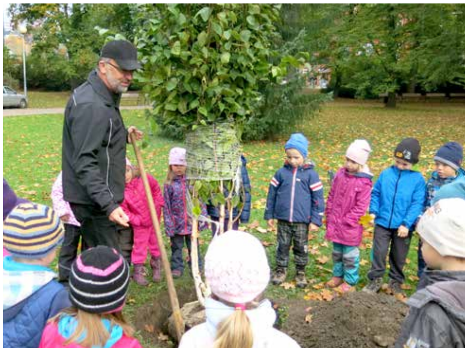
Sázení je pro děti zážitkem.

Cílem televizní stanice je rozšíření povědomí o České republice a její kultuře. Toto veřejné a nekomerční vysílání má formu videodokumentů, ve kterých se anglicky mluvící divák dozví informace o českých regionech, městech nebo památkách. Nabízí také kurzy českého jazyka, řadu reportáží mapujících místní folklor nebo vaření pokrmů typických pro Česko. Současný tým, který vysílání Czech-American TV pomáhá utvářet, je složený z více než čtyřiceti mediálních profesionálů. [dvo]