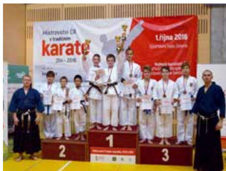
Hromada medailí zůstala ve Zlíně.

Vůbec poprvé hostil Zlín Mistrovství ČR v tradičním karate a hned při této premiéře se zlínské karatisté dokázali před domácím publikem řádně předvést.