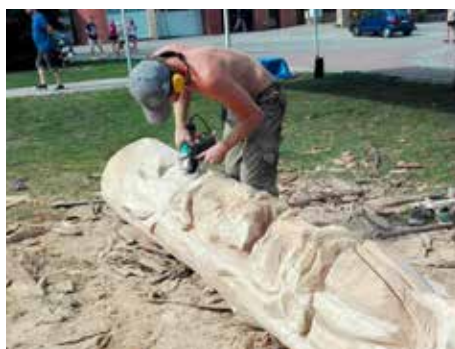
Totem poputuje na hřiště.

Indiánský totem, stonožka a šnek. To jsou dřevěné sochy, které vznikly při sochařském sympoziu, které bylo součástí Kejkliřského jarmarku ve Zlíně. Tyto sochy nyní potěší především nejmenší obyvatele města. Indiánský totem řezbáře Romana Mikuše ze Vsetína vyzdobí dětské hřiště na Lesní čtvrti.