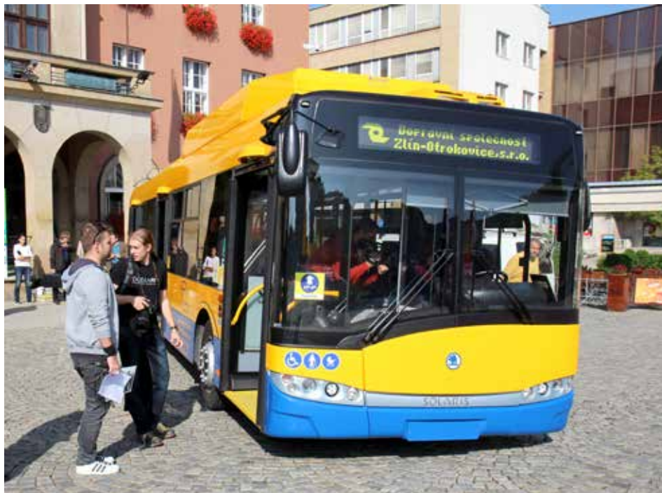
Zlín je prvním městem v ČR a na Slovensku, které má tento typ trolejbusů.

Město Zlín se snažilo budovu bývalého okresního soudu opakovaně zhodnotit. Poslední zájemce chtěl v objektu vybudovat minipivovar, nabídl však za něj pouze sedm milionů korun, což je podle rady města málo. Budova je nyní zajištěná proti zatékání vody, byl také instalován systém zabraňující vniknutí nežádoucích osob. Opatření vyšla na cca 300 tisíc korun. Přízemí radnice využívá jako sklad ztrát a náleží. [dvo]