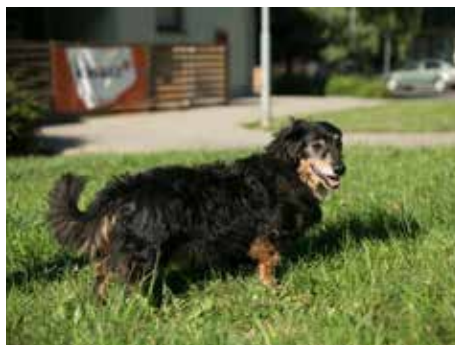
ČERTÍK.