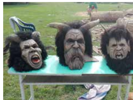
Masky valašských čertů.