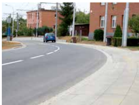
Ulice Mostní se proměnila. / foto: archiv

sítí mnohdy neodpovídaly skutečným,“ konstatoval primátor Miroslav Adámek . Práce na Mostní vyšly na 55 milionů korun, šlo tak o jednu z nejvýznamnějších dopravních investic města za poslední roky. Původně se náklady odhadovaly na 68 milionů, snížit se je podařilo veřejným soutěžením zakázky. [dvo]