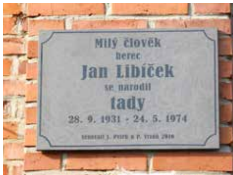
Rodný dům.