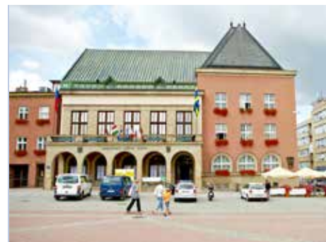
Hospodaření města je v dobré kondici.