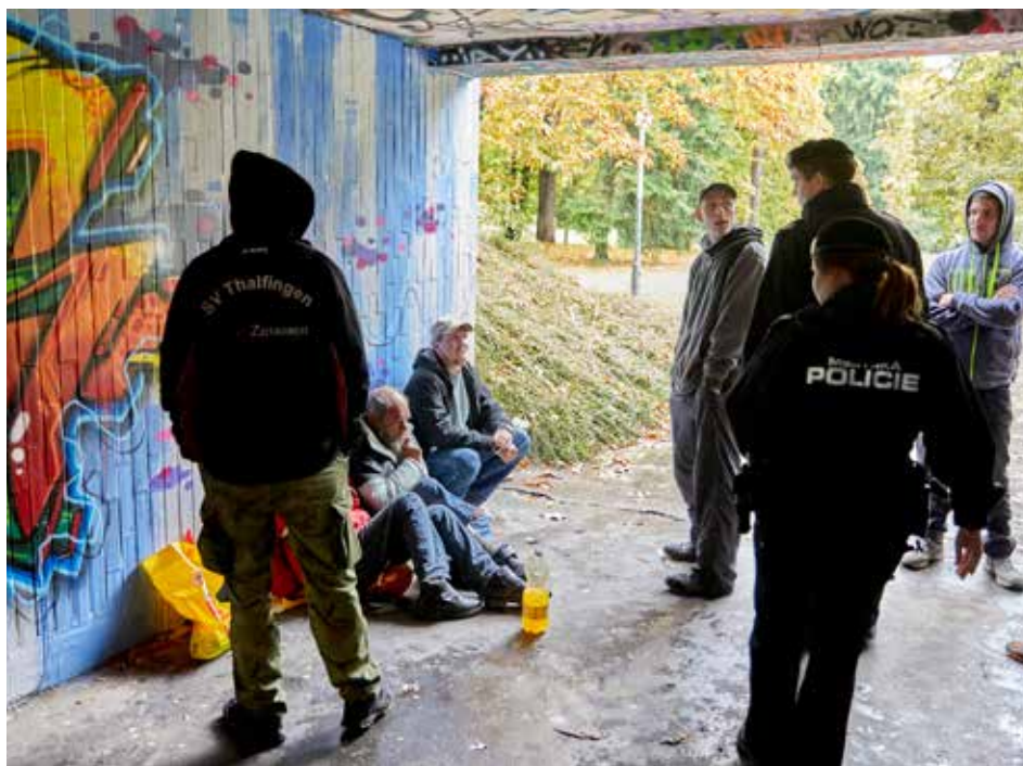
Lidí bez přístřeší nepřibýlo, ale jsou více vidět.

Volby ve Zlíně se obešly bez zásadních komplikací. „Neřešili jsme žádné problémy,“ potvrdil Tomáš Lang z volebního štábu. „Provedli jsme celkem 828 kontrol a zjistili pět nedostatků, vždy šlo o špatně vyvěšené státní vlajky,“ uvedl Milan Kladníček, ředitel Městské policie Zlín. V rámci celého Zlínského kraje dosáhla volební účast výše 38,5 procenta voličů. Pětiprocentní hranici nutnou pro vstup do krajského zastupitelstva překročilo osm stran. Z celkových 45 mandátů KDU-ČSL získalo 12, ANO 8, ČSSD 6, STAN 6, KSČM 4, Svobodní a Soukromníci 4, ODS 3 a SPD – Tomio Okamura 2. [dvo]