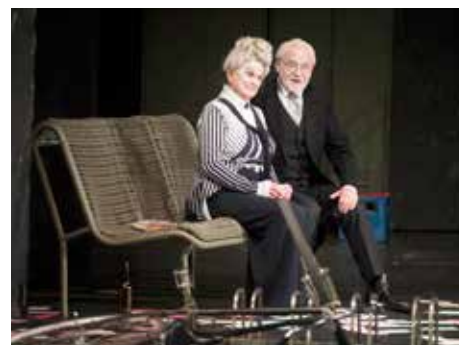
Prodaná nevěsta.

Pro čtenáře, kteří nemají detailní přehled o divadle, prozradte, v jakých rolích je vás možné aktuálně ještě vidět.