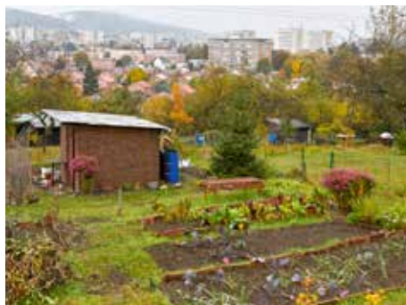
Odbor řeší i pronájem zahrádek.

Odbor ekonomiky a majetku je jedním z největších odborů zlínského magistrátu. Pracuje v něm čtyřicet tři zaměstnanců a ti mají na starosti téměř veškeré ekonomické a majetkové činnosti související s hospodařením a majetkovou správou města. A nejedná se o malé položky. Vždyť Zlín hospodaří s rozpočtem 1,4 miliardy korun a jen pozemky města mají účetní hodnotu vyšší než 3,6