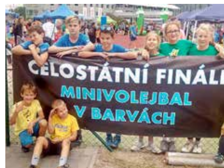
Úspěšní hráči a hráčky.