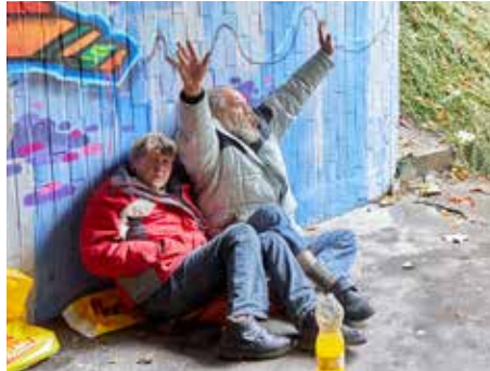
Tito lidé se často zdržují v podchodech.

Uvedené lavičky v drtivé většině obývají jen bezdomovci a lidé znalí poměrů by