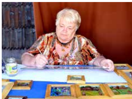
Malířka během tvorby.