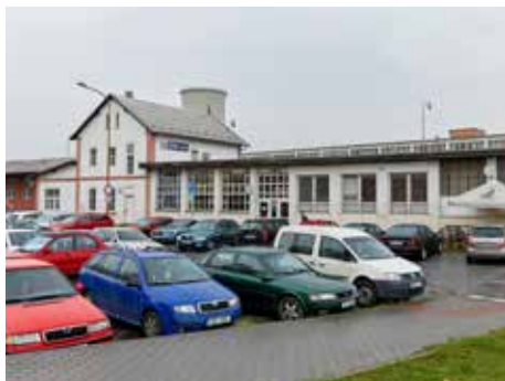
Celý prostor se výrazně změní.

Spolu s modernizací a elektrifikací železniční trati Otrokovice–Zlín–Vizovice vznikne ve Zlíně nový dopravní terminál hodný krajského města. Na základě dohody mezi účastníky Memoranda o spolupráci vznikla „Urbanistická studie dopravního terminálu ve Zlíně“, která jasněji určuje polohu a rámcovou podobu nového dopravního terminálu a tak dává konkrétní základ pro navazující projektovou přípravu.