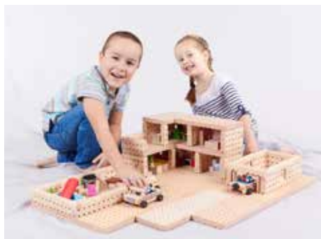
Akce je určena pro děti.

Dvoudenní festival stavebnic se uskuteční od soboty 12. do neděle 13. listopadu ve 14|15 Baťově institutu ve Zlíně. K vidění budou tradiční i méně obvyklé stavebnice z nejrůznějších materiálů. Návštěvníci si budou stavět z plastových kostiček Sluban, kovových součástek legendárního Merkuru, z magnetických tyčinek Geomag, ale také třeba z dřevěných stavebnic zlínského vý-