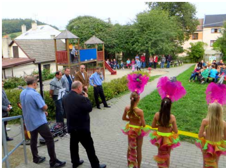
Slavnostní otevření pro veřejnost.

ve bylo provedeno statické zajištění, celkové odvlhčení, generální rekonstrukce střechy, zateplení, výměna veškerých oken a dveří, výměna veškerých rozvodů, nové jsou železobetonové stropy, podlahy, omítky a upraveno bylo také okolí a parkoviště. Ve víceúčelové budově jsou kromě sociálních bytů a klubovny pro seniory také prostory vyhrazené úředníkům a členům komise místní části, je zde zázemí pro cestáře, uskladnění techniky a i pro malé děti. K dispozici je také polyfunkční sál. [fab]