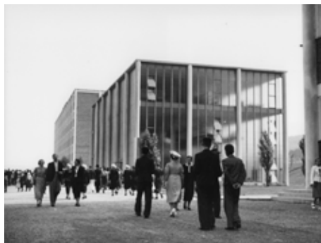
Podoba památníku z 30. let.

Dojde k odstranění přístaveb a k restaurování stavebních prvků. Náklady obnovy Památníku Tomáše Bati dosáhnou výše cca 58 milionů korun bez DPH. Z městské kasy půjde asi polovina této částky, hned 32 milionů korun formou dotace se podařilo vyjednat na ministerstvu kultury. Radnice hledá i další zdroje, například evropské dotace. K projektu přizvala obě větve rodiny Baťů, kanadskou a jihoamerickou.