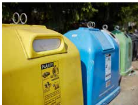
Zlíňané třídí ve velkém

Zástupci Zlínského kraje a kolektivních systémů EKO-KOM, Asekol a Elektrowin předali ocenění v jubilejním 10. ročníku soutěže pro samosprávy Zlínského kraje „O keramickou popelnici 2016“. Město Zlín získalo od společnosti Elektrowin, která se zabývá zpětným odběrem vysloužilých elektrozařízení, certifikát „Skokan roku 2015“ za meziroční zlepšení ve sběru o 29 tun. Celkové výsledky soutěže měst a obcí ve třídění jsou na http://www.tridenijestyl.cz/o-keramickou-popelnici-2016-374.htm .