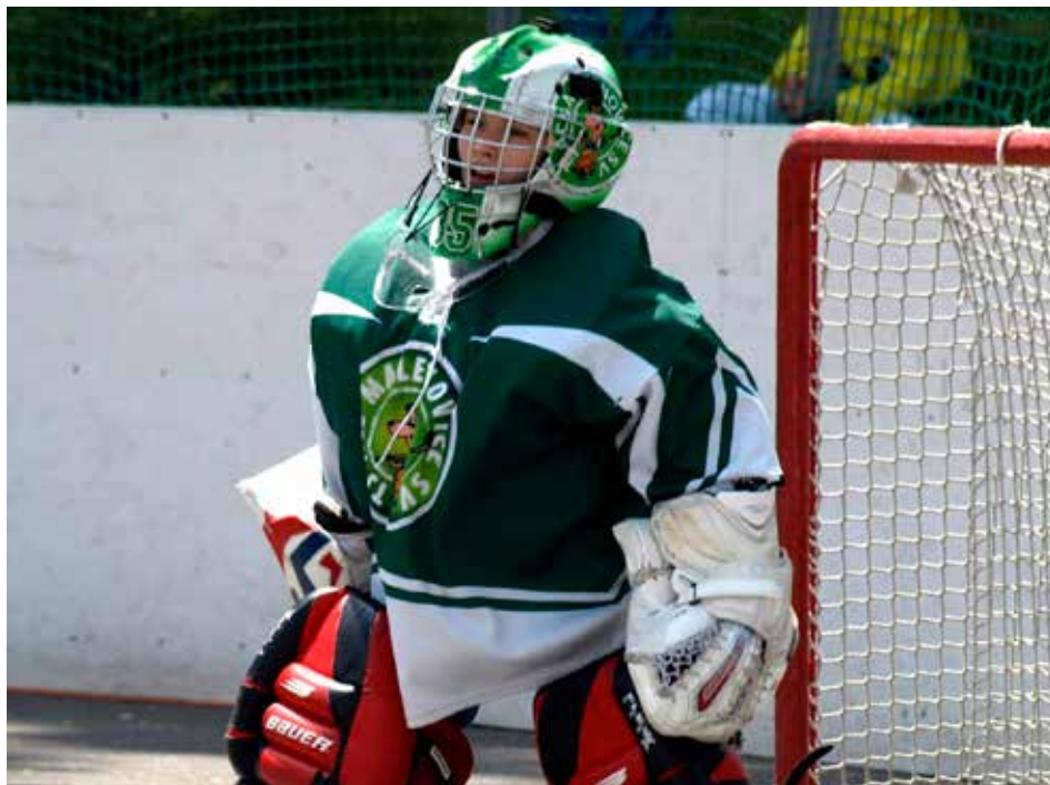
Malenovický dres oblékajú malí i veľcí hráči