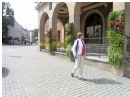
Radnice i náměstí - spousta květů

v parku Komenského, kde pracovníci zeleně už dříve vytvořili z květin oblíbený obraz motýla či ženy. [red]