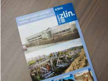
Městský časopis se líbí

obecní a městský zpravodaj 2015 se umístil na třetím místě. V letošním roce získal Magazin Zlín už druhé ocenění. V soutěži Zlatý středník získal certifikát vysoké profesionální úrovně TOP RATED v kategorii Nejlepší časopis a noviny veřejné a státní správy.