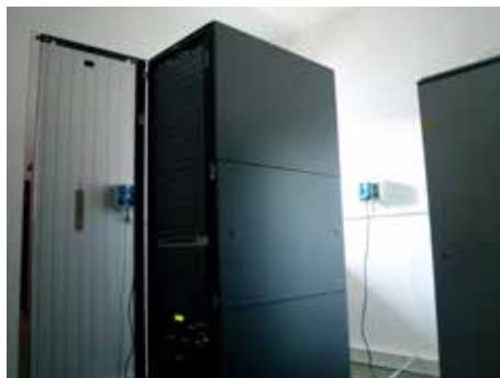
Serverovna neboli datacentrum

Jejich velkým úkolem je také dbát na elektronizaci veřejné správy. To znamená, aby se veškeré dokumenty uchovávaly také v digitální podobě a ne jen v papírové formě v šanonech. Úřady tak spolu mohou komunikovat mnohem rychleji a bez papírů. V konečném důsledku IT oddělení může trochu pomoci i ekologické stránce věci. Vždyť díky elektronizaci dokumentů se nemusí už vše tisknout na papír. Odpadl například tisk některých účetních dokladů. V hodně velké nadsázce řečeno, dbají pracovníci IT oddělení částečně i o duševní zdraví úředníků. Vždyť „zasekaný“ počítač nebo program, který vám takzvaně „spadne“ těsně před dokončením práce, to dokáže vytočit i největšího klidáse. [fab]