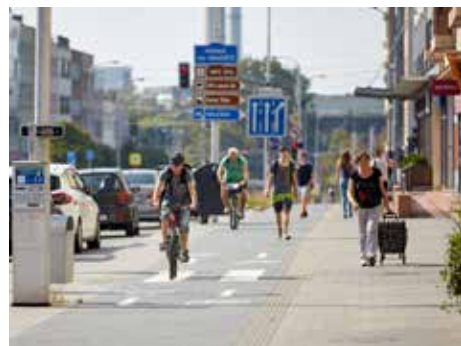
Síť cyklostezek se prodlužuje

Nasvětlování přechodů pro chodce pokračovalo i v letošním roce, například na ulicích Zarámí (u VZP), Kvítková (u parkovacího domu), a Podvesná VI na Benešově nábřeží. Kromě nasvícení jsou přechody upravovány tak, aby byly snadno přístupné pro vozíčkáře a lidi se zhoršeným zrakem. S nasvětlováním přechodů začalo město Zlín v roce 2012. Vybírány jsou především ty, které se nachází na frekventovaných ulicích nebo méně přehledných místech. Tím, že je prostor pro přecházení nasvícen, se výrazně zvyšuje bezpečnost chodců.