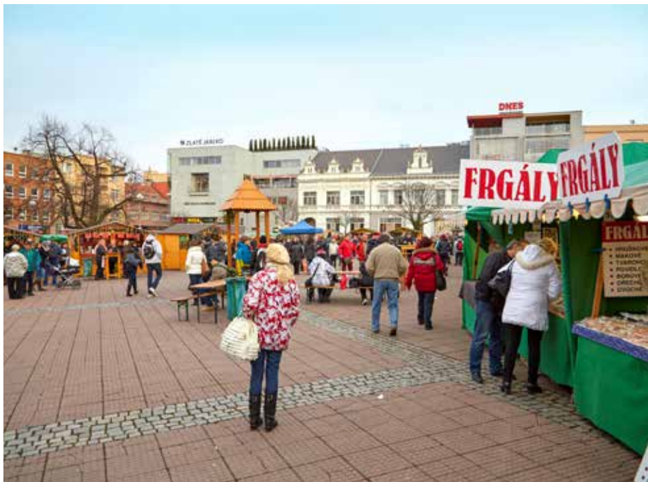
Předvánoční jarmark nabídl spoustu akcí a nádhernou atmosféru