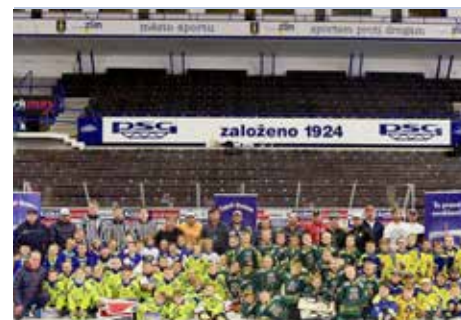
Společné foto účastníků