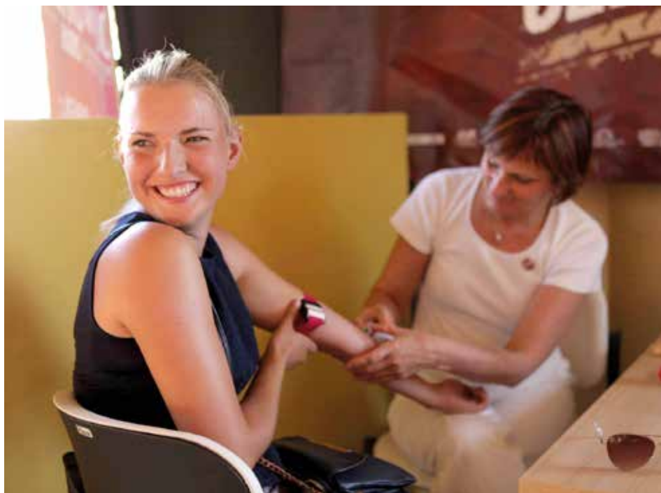
S úsměvem. Pomáháme dobré věci. / foto: Reklamní inženýři