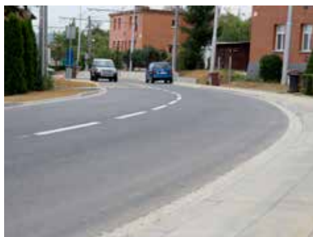
Práce na Mostní trvaly celý rok

Rekonstrukce Mostní je u konce. Dlouhé roky nezanedbanější ulice ve Zlíně se zásadním způsobem proměnila. Práce trvaly více než rok a šlo o jednu z nejvýznamnějších dopravních investic města za poslední roky. Ulice Mostní je nyní mnohem bezpečnější. Došlo k jejímu rozšíření v průměru o tři čtvrtě metru, kluzké a na mnoha místech značně poškozené čedičové kostky nahradil asfalt, chodník pokrývá dlažba o velikosti 30x30 centimetrů. Náklady na rekonstrukci se původně odhadovaly na 68 milionů korun. Radnici se však podařilo veřejným soutěžením zakázku tuto cenu výrazně snížit na 55 milionů korun.