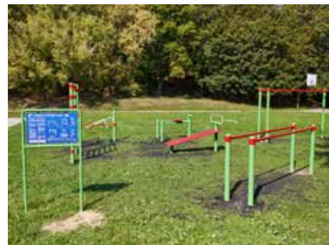
Venkovní posilovna je oblíbená

Prostřednictvím Portálu občana je možné také přistupovat k dalším elektronickým službám, jako je například vyplňování elektronických formulářů či elektronické platby místních poplatků (komunální odpad, psi).