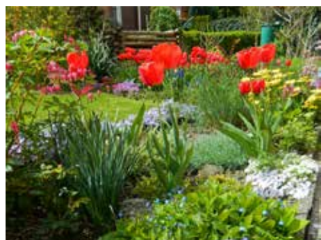
Jedna z hezkých zahrádek