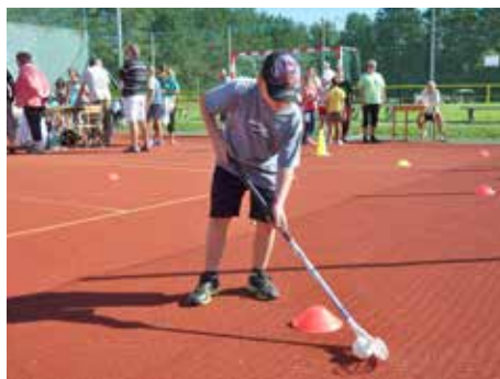
Děti čeká zábava. / ilustrační foto