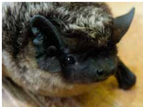
Netopýři potřebují ochranu

Přestože jsou rekonstrukce a zateplování panelové zástavby v mnoha ohledech pozitivní, paradoxně dochází ke střetu zájmů ochrany životního prostředí. Rorýs obecný