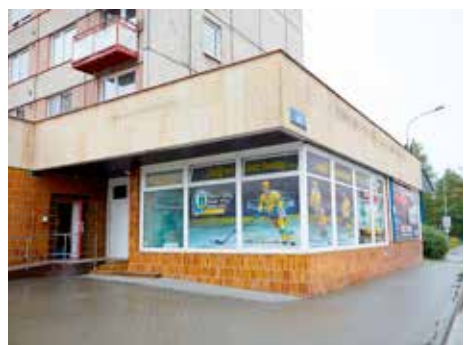
Zde bude pobočka Pohřebnictví Zlín.

Rozhodně ne, naše společnost se stále rozvíjí a zkvalitňuje své zázemí a služby, samozřejmě ve spolupráci s radnicí, jsme totiž městská společnost. Namátkou mohu jmenovat dokončenou opravu cest na hřbitově Mladcová a úpravu odběrných míst vody na hřbitovech, opravené už je také veřejné osvětlení na hřbitově v Jaroslavicích. Zahá-