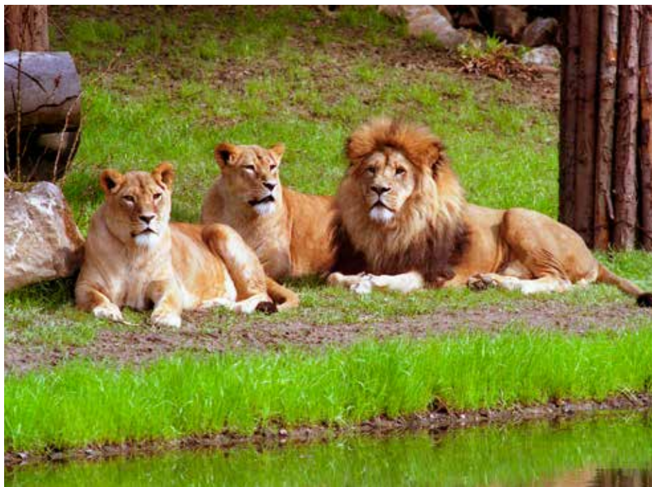
Zlínská zoo je jedním z nevyhledávanějších cílů na celé Moravě.

oceňují nejen nové chovatelské aktivity zoo, ale také vysoce hodnotí jedinečnost areálu zoo, péči o zeleň a vznik nových botanických zákoutí. Zářijové otevření Zátoky rejnoků přineslo rekordní počet návštěvníků v měsících říjnu, listopadu i prosinci. Obdobný trend pokračoval na začátku roku 2015. Pavilon s mořskými rejnoků tak výrazně přispěl k zvýšení zájmu o návštěvu zoo i mimo období hlavní sezony. Vzrůstající oblíbenost zlínské zoo potvrzují také statistiky uplynulých sedmi měsíců roku 2015. Ve srovnání se stejným obdobím roku 2014 zlínská zoo eviduje nárůst přes 30 000 návštěvníků. Pokud se návštěvnost v druhé polovině roku 2015 bude vyvíjet v obdobných tendencích, s velkou pravděpodobností zoo zopakuje úspěch loňského roku. Kromě Zátoky rejnoků jsou velkými magnety pár medvědů pyskatých či dětský lanový labyrint s expozicí veverek. [red]