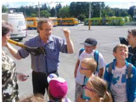
Děti se podívaly i do DSZO.

v Malenovicích či Stezku zdraví na Tlusté hoře. A samozřejmě nechyběly špekáčky či koupání.