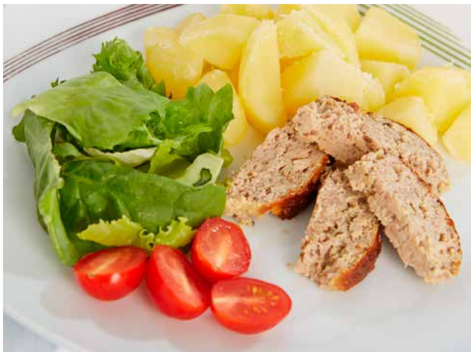
Školní kuchyně. Co dětem chutná?

Na Mistrovství světa Intersteno, které se konalo v Budapešti, se dařilo Anně Mičkové. Studentka Gymnázia Zlín-Lesní čtvrti vybojovala zlatou medaili a stala se tak juniorskou mistryní světa v soutěži Note taking & reporting. Úkolem soutěžícího v této disciplíně je zachytit diktovaný, postupně zrychlovaný desetiminutový text. Zachycený text musí upravit tak, aby byl logicky správný, musí vybrat podstatu daného textu a přitom má stanovený přesný počet slov pro jednotlivé části, které může použít.