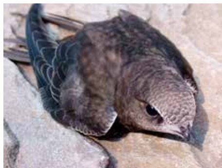
Rorýs obecný