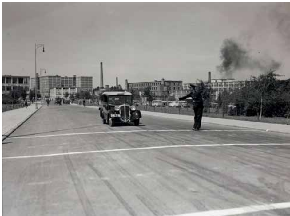
Pravidelně prováděné zkoušky brzd motorových vozidel, foto Josef Vaňhara 1935, Státní okresní archiv Zlín.