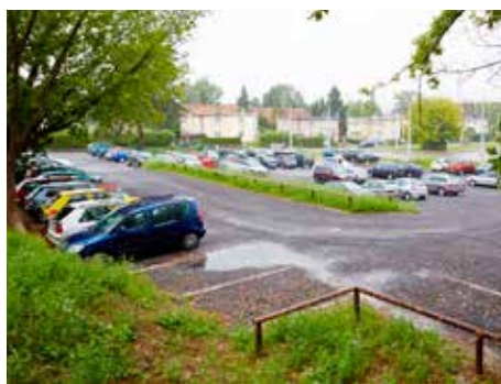
Počet parkovacích míst se zvyšuje.

Dlouhodobě radnice zvyšuje počet parkovacích ploch na Jižních Svazích. Letos