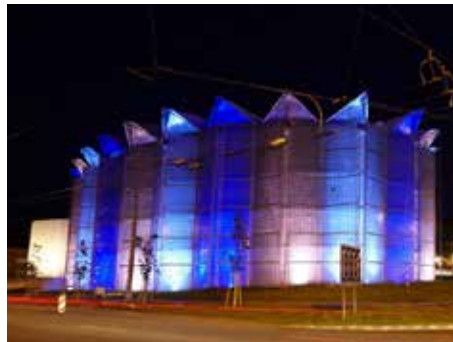
FBM sídlí v Kongresovém centru.

V dramaturgii jsou velmi zajímavé programy a u většiny z nich je řada více či méně kulatých výročí skladatelů. Také mnohé skladby dlouho či vůbec ve Zlíně nezazněly. V nové sezoně vystoupí velmi atraktivní sólisté.