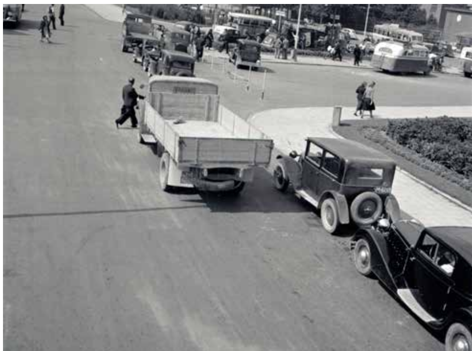
Automobily u benzinové stanice na dnešním náměstí Práce, foto Josef Vaňhara 1939, Státní okresní archiv Zlín.