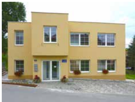
Multifunkční objekt Příluky.