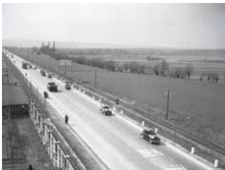
Silnice Zlín-Otrokovice koncem 30. let