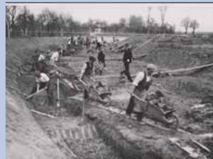
Stavba kanálu u Spytihněvi, 1935.

Závěrečná přednáška na téma „voda“ se bude konat ve středu 2. prosince. Blanka Petráková z Muzea luhačovického Zálesí na ní seznámí posluchače s vodními prvky, které určují charakter lázeňského území v Luhačovicích. V prostoru Lázeňského náměstí vyvěrají minerální prameny, známé po dlouhá staletí a cíleně využívané za léčebnými účely nejpozději od druhé poloviny 17. století. Kromě vyvěrajících léčivých pramenů je protáhlé lázeňské údolí vytýčeno osou protékající Horní Olšavou, kolem níž jsou rozloženy hlavní lázeňské budovy a pavilony pramenů. Přednáška bude postihovat jejich uspořádání a proměny od počátku do současnosti.