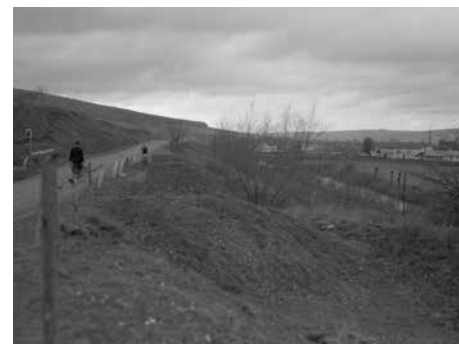
Silnice do Želechovic, foto J. Vaňhara 1935, SOkA Zlín

Fuchs ve Zlíně například sledoval frekvence průjezdů motorových i nemotorových vozidel na nejdůležitějších komunikacích ve městě v časovém horizontu několika let, z čehož se pokusil vysledovat možné vývojové tendence v letech následujících. Na základě rozboru zjištěných dat konstatoval, že hlavní uliční tepny prozatím plně