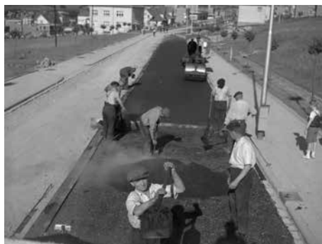
Asfaltování Štefánikovy ulice roku 1939

Když B. Fuchs promítl vývojové tendence do roku 1940, dospěl k zjištění, že ze stávajících hlavních ulic bude zvýšenému dopravnímu zatížení vyhovovat pouze Bartošova, Školní a Štefánikova. Naproti tomu ulice T. Bati by při předpokládaném vývoji měla být rozšířena na čtyři dopravní pásy. Zajímavé výsledky vycházely Bohuslavu Fuchsovi při porovnání zlínské automobilové dopravy se situací v tehdejší Němeci.