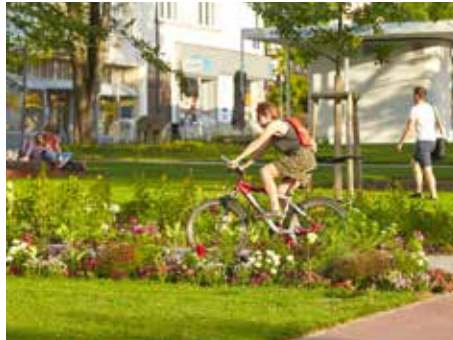
Cyklistů ve městech přibývá.

V červencovém čísle jsme zahájili tento miniseriál, jehož prostřednictvím bychom vás rádi seznámili se základními prvky cyklistické infrastruktury a s pravidly, jak se na nich mají různé skupiny uživatelů chovat. V tomto díle vám přiblížíme problematiku přerušování cyklistických stezek, přejezdy pro cyklisty a přechody pro chodce přes cyklistické stezky.