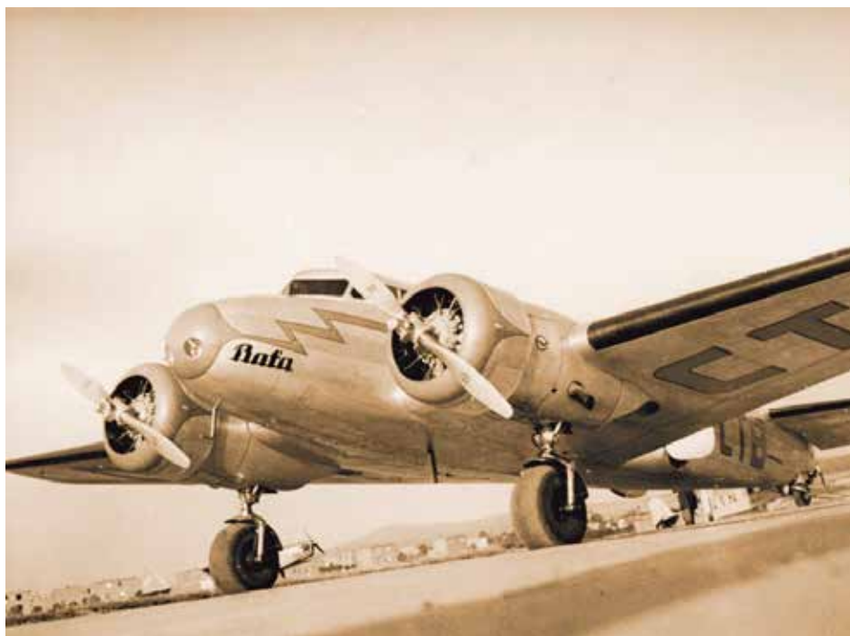
Lockheed Electra.