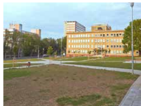
Poliklinika získává dostojné okolí.

Prostor před Zlínskou poliklinikou je už v novém. Dokončená je i rekonstrukce chodníků v jejím okolí, po nich se nyní mohou mnohem snadněji pohybovat vozíčkáři a také cyklisté, pro které byla vybudována cyklostezka navazující na už dříve zhotovené úseky vedoucí přes centrum. Celkové náklady na obnovu prostoru před poliklinikou a půldruhého kilometru chodníků včetně vybudování komunikace pro cyklisty dosáhly výše téměř 20 milionů korun. „Hned pětadesát procent této částky, tedy téměř 17 milionů korun, jsme pokryli z evropské dotace, konkrétně z Regionálního operačního programu Střední Morava,“ prohlásil radní pro oblast dopravy Josef Novák . Dodal, že práce na projektu Rekonstrukce přístupových cest v centrální části města Zlína probíhaly od srpna loňského roku a skončily před několika týdny. Téměř dvouhektarový prostor před poliklinikou prošel zásadní proměnou. Je zde nová zeleň, lavičky, odpadové koše i stojany na kola. „S výsledkem jsme spokojeni,“ řekl Josef Novák . Opravené jsou také