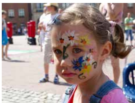
Náměstí Míru v létě ožívá.

19. září 9.00–18.00 . . park Komenského NOVÝ CIRKUS V PARKU