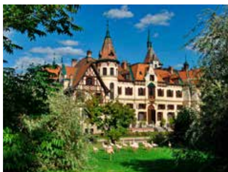
Zámek Lešná.

15. srpna. Noční prohlídky hradu Malenovice, 20.00–23.00.