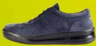
PRESTIGE AIR | semiš | vel. 38 - 47 | 1.000,-