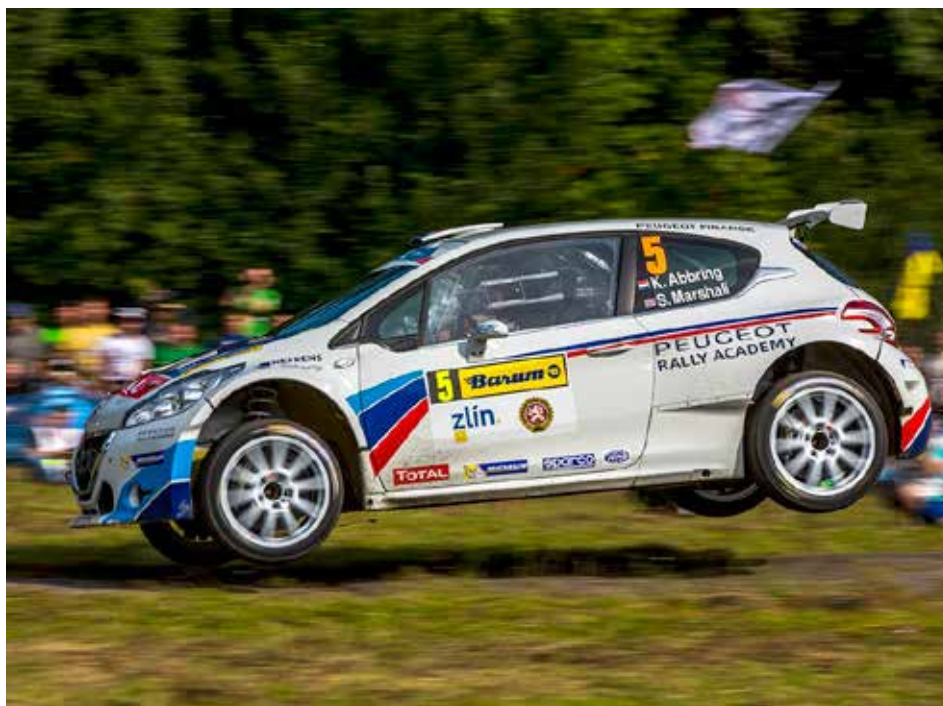
Zlínská rally vždy hostí domácí i evropskou špičku.