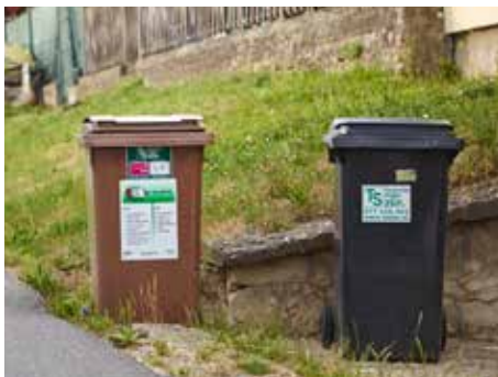
Bioodpad lze třídit prakticky v celém městě.

Do nádob na bioodpad mohou občané ukládat bioodpad ze zahrad a z domácností. Bioodpad se odváží na nově vybudovanou kompostárnu v areálu skládky Suchý důl, kde bude zpracován na kompost, nebo na stanoviště biofermentoru tamtéž, kde bude zpracován na palivo k energetickému využití. Speciální kompostovatelné škrabové ani papírové sáčky do nádob nedávejte, jsou určeny pro kompostování v kompostérech či