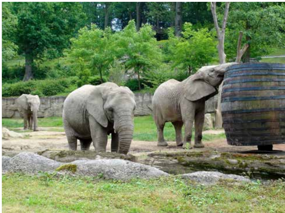
Zoologická zahrada je bezesporu jedním z největších lákadel regionu.

Tato akce letos nezískala podporu z Kulturního fondu města Zlína. Podavatelé žádali o částku 300 000 korun. Přednost dostaly tentokrát jiné akce.