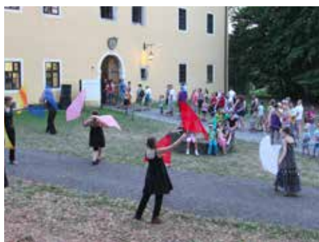
Malenovický hrad nabízí atraktivní program.

Až do 30. srpna. Příběh chleba. Od zrnka k bochníku za dob našich staříčků – výstava. Dílny v rámci výstavy 20. srpna (10.00–12.00, 14.00–18.00) a 27. srpna (10.00–12.00, 14.00–18.00), nutná rezervace 573 032 319. Komentovaná prohlídka k uvedené výstavě se uskuteční 5. srpna v 17.00.