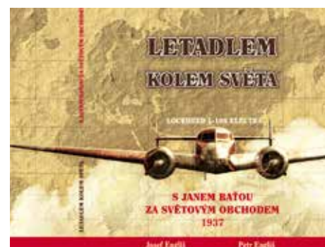
Obal připravované knihy.

Nakladatelství ATELIER IM již více než dvacet let vydává zajímavá originální literární a odborná díla. Bližší informace na adrese www.atelierim.cz . [ai]