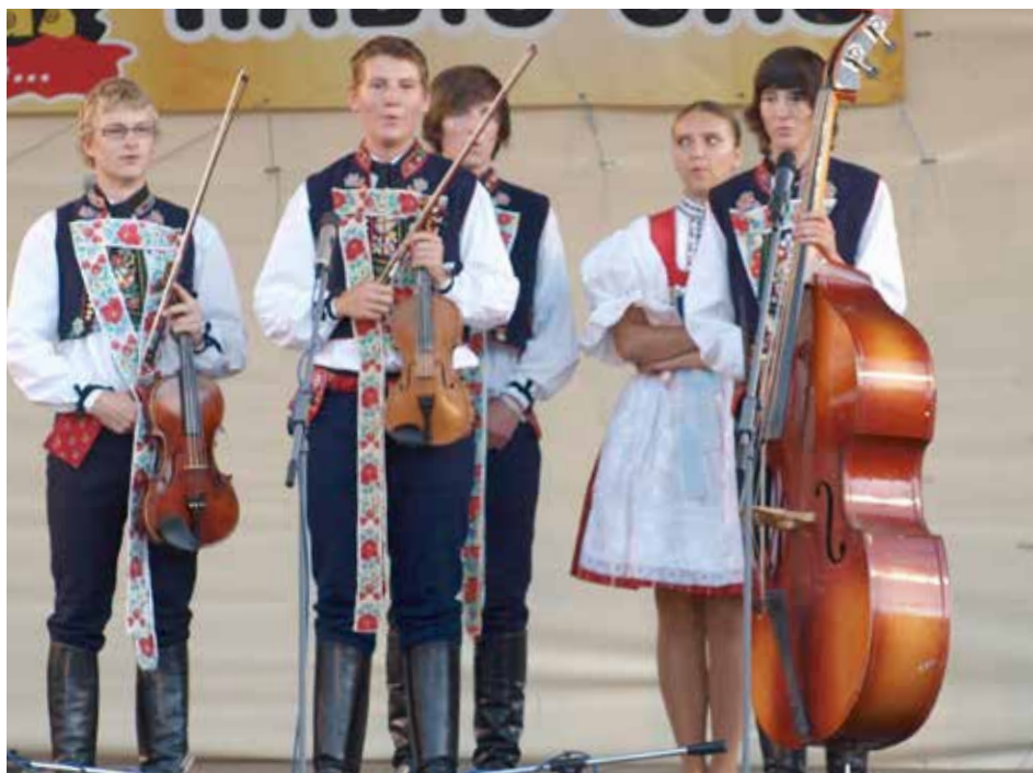
Festival patří ke Zlínu již 11. let.

Blíží se také první zářijová akce – 9. ročník Pohádkového lesa, letos s podtitulem 50 let českého Večerníčku s námi, který se koná 12. září. Více informací na www.ddmastra.cz .