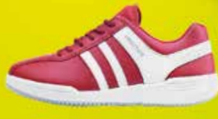
PRESTIGE SPORT | vel. 35 - 45 | 900,-