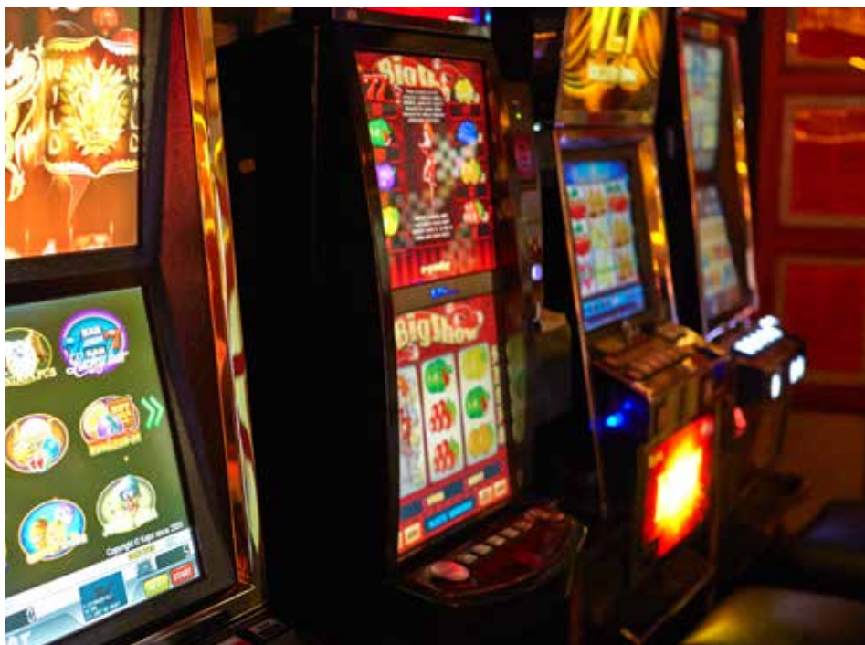
Možností, kde lze umístit automaty, ve Zlíně ubývá. Díky vyhlášce.