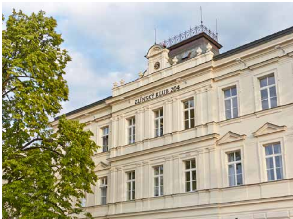
Bývalá knihovna dlouho bez využití nezustala.