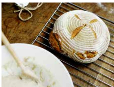
Příběh chleba. / foto: MJMV

26. srpna. Big Band Zlín. Na náměstí Míru na pódiu vystoupení kapely s Lubomírem Morávkem, začátek v 17.00.