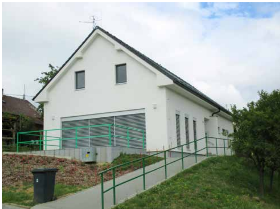
Kancelář místní části v Mokré.