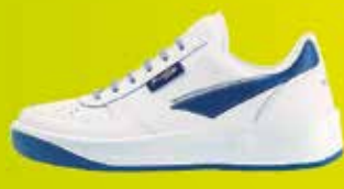
PRESTIGE | vel. 35 - 49 | 900,-