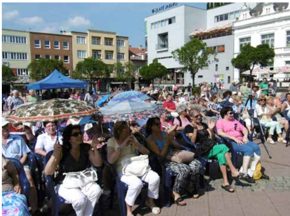
Senioři se umí bavit.