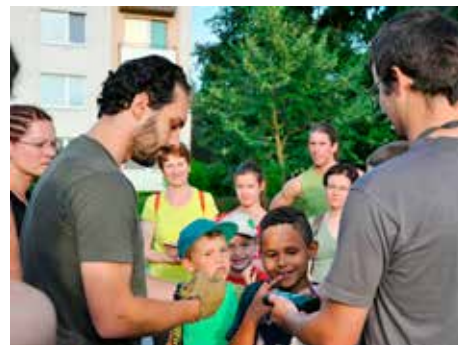
Na netopýry s batdetektory.

Soutěž Město stromů vyhlašuje Nadace Partnerství ve spolupráci s městem Strakonice od roku 2006. Zúčastnit se mohou všechna města na území ČR. Úkolem soutěžících měst je navrhnout kampaň, která by zajímavými aktivitami motivovala veřejnost k péči o stromy a ochraně přírody. Může zahrnovat například soutěže, výstavy, přednášky, výsadby stromů, úklidové brigády, veřejná projednání úprav prostranství a další akce pro obyvatele. Ve vítězném městě pak kampaň probíhá po dobu jednoho roku. Přináší konkrétní výstupy, například v podobě vysazených stromů, a zároveň posiluje společenský život a vztahy mezi lidmi i místními organizacemi.