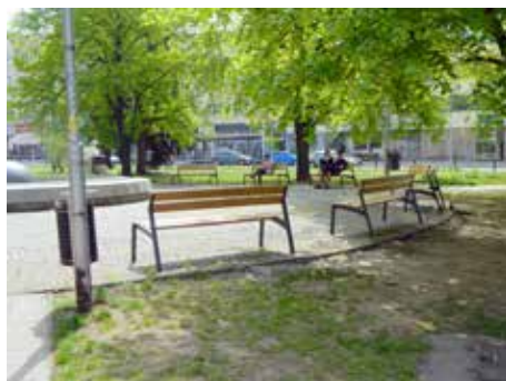
Stejný typ laviček slouží i na náměstí Míru.

Vysloužilé kovové lavičky ve spodní části parku Svobody, který vytváří okolí zámku, jsou vyměněné za nové. Jde o typ, který město nechalo instalovat i na náměstí Míru v okolí kašny. V parku Svobody bylo nainstalováno celkem 35 nových laviček. Výměna stála 210 tisíc korun včetně DPH. Investorem je město Zlín. [dvo]