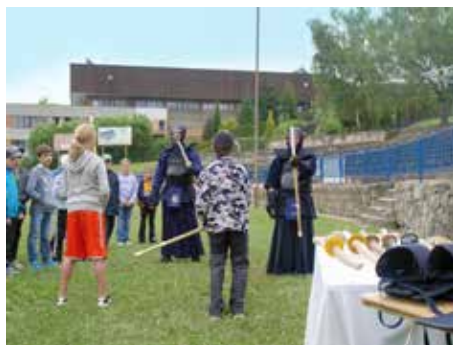
Kendó, japonské bojové umění.

80 a půl milionu korun. V roce 2011 to bylo dokonce více než 100 milionů korun, z nichž 48 milionů korun sloužilo k dofinancování stavby koupaliště Panorama na Jižních Svazích. V podstatně větší míře než v minulosti také začalo podporovat přímo z rozpočtu oddíly, které se věnují výchově mládeže, například volejbal, házenou nebo basketbal. [dvo]