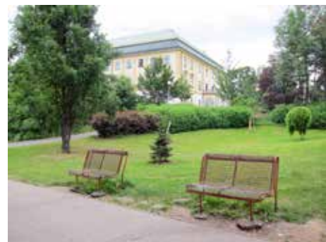
Tyto lavičky už ve spodní části parku nejsou.