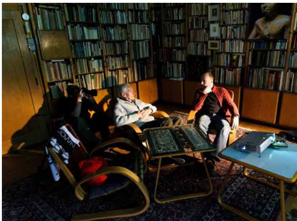
Debata v proslulé knihovně Miroslava Zikmunda.

Miroslav Zikmund a Jiří Hanzelka se řadí mezi nejnámější cestovatele. Během dvou cest, které podnikli ve vozech Tatra v letech 1947 až 1950 a 1959 až 1964, navštívili přes 80 zemí. Jsou autory dvaceti knih, 147 dokumentárních, krátkometrážních či televizních filmů a čtyř celovečerních filmů.