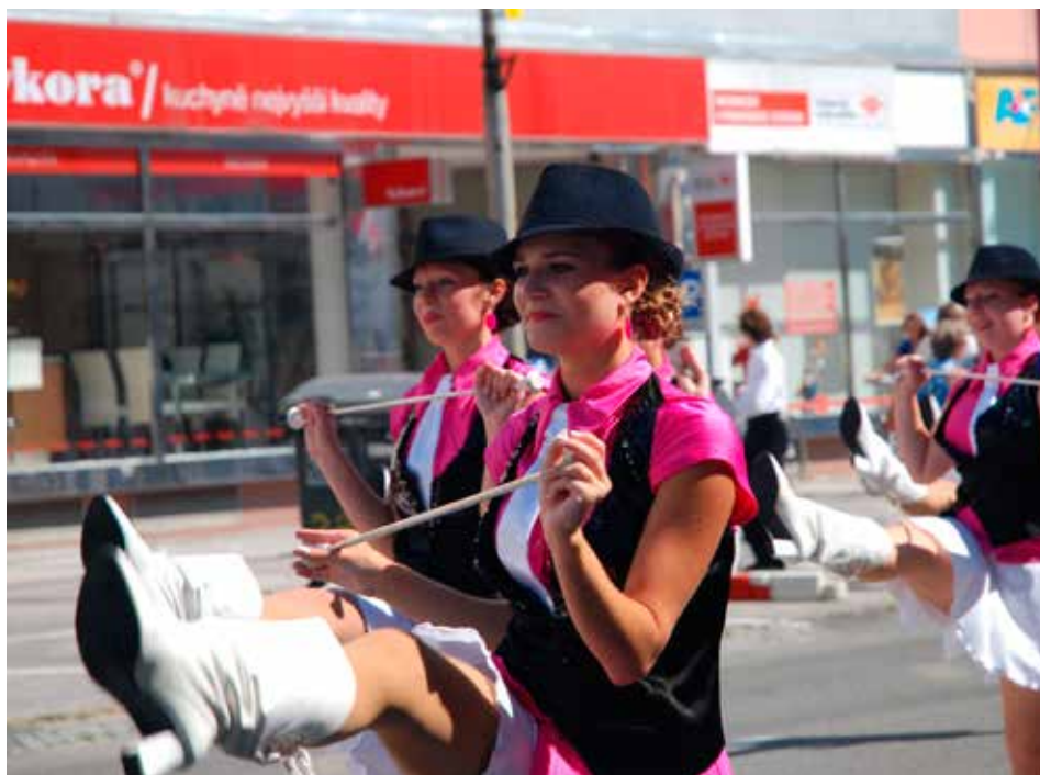
Festival nabízí pastvu nejen pro uši.