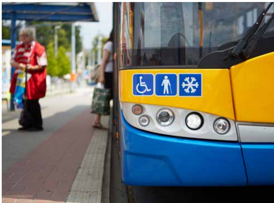
Ve Zlíně jezdí 11 klimatizovaných trolejbusů.

přizpůsobeno i cestujícím se zrakovým postižením. Takto označený trolejbus má akustické hlášení zastávek. Zrakově postižení si mohou pomoci zvláštního dálkového ovládnutím zapnout i vnější reproduktor na vozidle, ze kterého se už na nástupišti při příjezdu vozidla dozvědí, o jakou linku jde a kterým směrem jede. Ve vozovém parku DSZO je v současnosti 6 klimatizovaných autobusů a 11 klimatizovaných trolejbusů. [red]