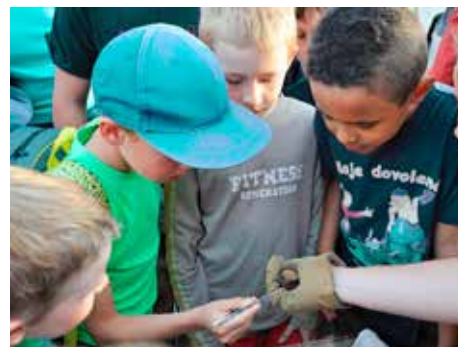
Děti si vyzkoušely krmení dospělé samice.

Zoologové předvedli klasické metody i moderní techniky používané při výzkumu netopýrů, batdetektory, noktovizor ad., které si účastníci mohli v terénu sami vyzkoušet. Všichni si z blízka prohlédli a někteří dokonce i nakrmili samiči netopýra rezavého, kterou kvůli jejímu hendikepu chovají v záchranné stanici. Podvečerní procházka kolem Dřevnice s povídáním o fascinujícím životě rorýsů a netopýrů trvala přes tři hodiny, až do úplné tmy.