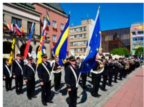
Festival se koná každé dva roky. / foto: archiv

14.00 . . . . . náměstí Míru, podchod u Svitů, Jižní Svahy UPOUTÁVKY SOUBORŮ