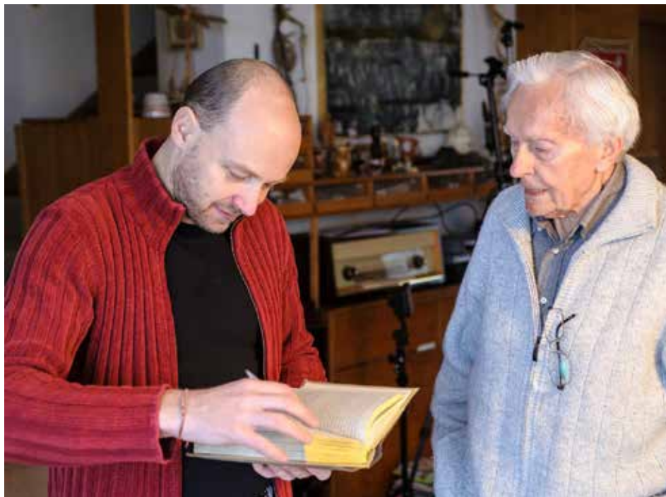
Miroslav Zikmund zpřístupnil Petru Horkému své osobní deníky.

Určitě ano. Miroslav Zikmund je významná osobnost a zajímavé budou určitě i zážitky, které se ve filmu objeví. Očekávám velký zájem hlavně ve Zlíně, protože jde o váženou osobnost našeho města.