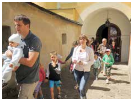
Malenovický hrad je rájem pro děti.

všeho věku připraveny i dvě noční prohlídky hradu, zpestřené o řadu kostýmovaných vystoupení. První noční prohlídka se koná v sobotu 19. července a druhá v sobotu 16. srpna. Začátek nočních prohlídek je ve 20 hodin a trvají tři hodiny. [red]