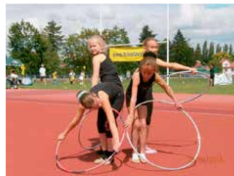
Sportovní gymnastika je úspěšný zlínský sport.

Sport, ať již amatérský nebo profesionální, považuje radnice za velmi důležitou oblast. Každý rok do něj směřuje desítky milionů korun. V minulém roce šlo o částku téměř 79 a půl milionu korun. Za rok 2012 poslalo město na sportování ve Zlíně celkem