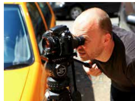
Během natáčení.

Zajímavostí je, že společně s filmem vzniká i televizní seriál pro televizi Prima. Poprvé se s ním diváci budou moci setkat už na podzim. „Seriál je koncepčně zcela odlišný od filmu, jsou to dva samostatné projekty, které by se měly doplnit, ale nemohou se navzájem nahradit.“ Dodává Petr Horký .