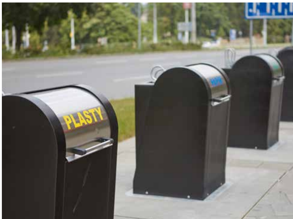
Ve Zlíně přibývá kontejnerů pro tříděný odpad.

Magistrát města Zlína, Odbor ekonomiky a majetku, zveřejňuje záměr na nájem nebytových jednotek - garáží v termínu od 20. 8. 2014 do 9. 9. 2014: podzemní parkovací stání v hromadných garážích na Jižních Svazích, Na Honech I, II, Podlesí II, III; garážové boxy na Jižních Svazích, Podlesí IV; garážové stání v hromadných garážích na Jižních Svazích, Středová, Slunečná, Luční, Družstevní, Jílová; garáže Vodní, Padělky IX. Bližší informace naleznete na www.zlin.eu v sekci Občan / Úřední deska / Majetek SMZ – objekty. Dohoda o složení jistoty a přijetí podmínek výběrového řízení a další informace jsou k dispozici na Odboru ekonomiky a majetku MMZ, oddělení bytovém, Zarámí 4421, přízemí budovy, dv. č. 103 (tel. 577 630 315).