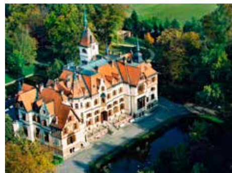
Zámek Lešná obklopují staleté stromy.

vyšších rostlin, které se sice poprvé objevily už v druhohorách, jejich zástupci však rostou na planetě Zemi dodnes. V nejbližším okolí této expozice rostou nejrozmantější jehličnany, z nichž mnohé náležejí k nejstarším vývojovým typům rostlin (sekvoje, metasekvoje, taxodia, pajehličníky, araukárie, jinany a další). Mnohé z nich jsou doslova tzv. „živé fosilie“ a pamatují jako druh éru dinosaurů, neboť tehdy byly jehličnany jedny z dominantních druhů rostlin a prožívaly největší období svého rozvoje. Děti zde najdou také archeologické naleziště, kde mohou „objevovat“ pozůstatky dinosaurů. Celou vzdělávací stezku doplňují modely dinosaurů - lebka či kosti Allosaura, Styracosaura, Brachiosaura či Parasaurollopha. V blízkosti archeologického naleziště jsme navíc umístili obří modely dinosaurů vajec, ve kterých se mohou děti vyfotografovat. [sve]