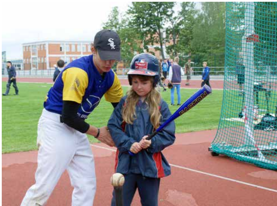
O baseball byl velký zájem.

Sportovní kluby policie Zlín – oddíl Judo pořádá dne 1. září nábor chlapců a děvčat do oddílů, který se uskuteční v tělocvičně města Zlína na Zálešné od 15.00 do 17.00. Přihlásit se mohou děti ve věku od 6 do 8 let. V případě nenaplnění počtu dětí v oddíle je možné přihlásit dítě dodatečně vždy v úterý a ve čtvrtek od 15.30 do 17.00 v průběhu měsíce září. Činnost oddílů je finančně podporována městem Zlínem. Blíže informace na 736 114 621 nebo 603 178 865.