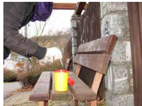
Drogy se týkají také Zlína.

Práci streetworkera v naší organizaci provádí dvě dlouholeté a zkušené pracovnice. Jejich „kancelář“ je přirozené prostředí uživatelů, tedy především ulice, restaurační zařízení,