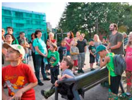
Pozorování rorýsů.

Právě na Bartošovu čtvrtě se vypravila skupina třiatřiceti zvědavců, kteří se zúčastnili netradiční podvečerní vycházky s pozorováním nočních živočichů. Vycházku uspořádal zlínský magistrát v rámci projektu