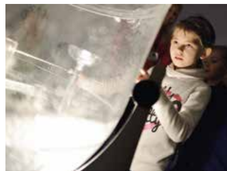
Fontána libosti.

18. září 2016. Tato část projektu bude prezentovat především objekty a instalace pracující se světlem nebo optickými efekty. Návštěvníci budou doslova fyzicky vtaženi do procesu míchání barevného světla, zrcadlení, prostorové iluze vytvářené hrou světla a stínu a podobně. Výstavní prostor galerie v přízemí budovy 14 je pro tento účel kompletně zatemněn, takže jeho podobu udávají výhradně světla a zvuky interaktivních instalací. „Kromě objektů, které již byly v rámci projektu Orbis Pictus vystavovány, vzniklo i několik zcela nových uměleckých realizací, které byly připravovány výhradně pro naši výstavu. Je to například interaktivní datová instalace od Pavla Mrkuse. Jde o speciální