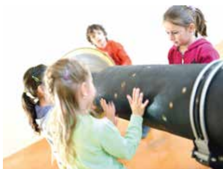
Chřestící tubus.

Autory projektu jsou Jiří a Radana Waldovi a umělecký koncept kolektivních interak-