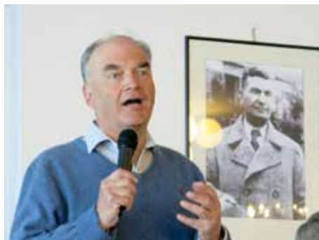
Thomas George Bata.

Klub absolventů Baťovy školy práce (Klub ABS) vznikl v roce 1933 jako dobrovol-