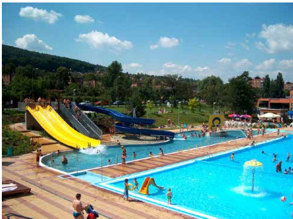
Koupaliště Zelené je dlouhodobě oblíbené.

Věřím, že se nám v budoucnu podaří uspokojit i tyto potřeby obyvatel města.