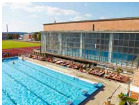
Areál na ulici Hradská.

V době 9.00 – 16.30 se vybírá vstupné. Po skončení této otevírací doby zdarma.