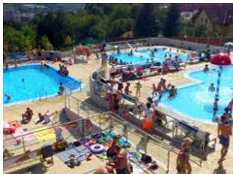
Koupaliště Panorama.

Červenec a srpen – celodenní vstup dospělí od 16 let 90 Kč; děti 6-15 let, ZTP, ZTP-P, senioři nad 65 let 50 Kč; děti 1-5 let 30 Kč.