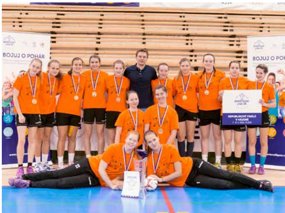
Vítězné družstvo bezprostředně po finále.

Město Zlín připravuje na 25. června akci Zlín v pohybu. Návštěvníci se mohou těšit na bohatý program. Připravena je například cyklojízda městem, několik hudebních vystoupení, soutěže pro děti, informační stánky pro cyklisty a chybět nebude ani občerstvení. Průběžné informace o celé aktivitě najdete na www.zlin.eu nebo také na www.ic-zlin.cz . Akce je součástí projektu Zlín v pohybu – zdravě, bezpečně, na pohodu.