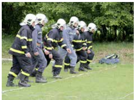
Na startu před požárním útokem.