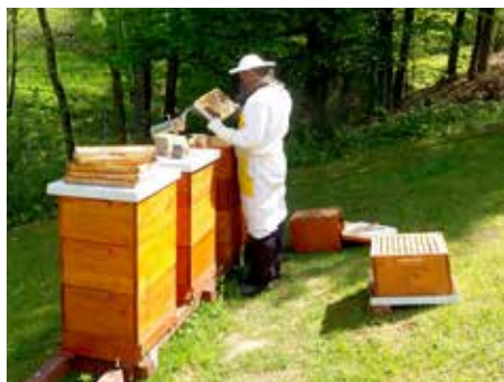
Včelař při práci.