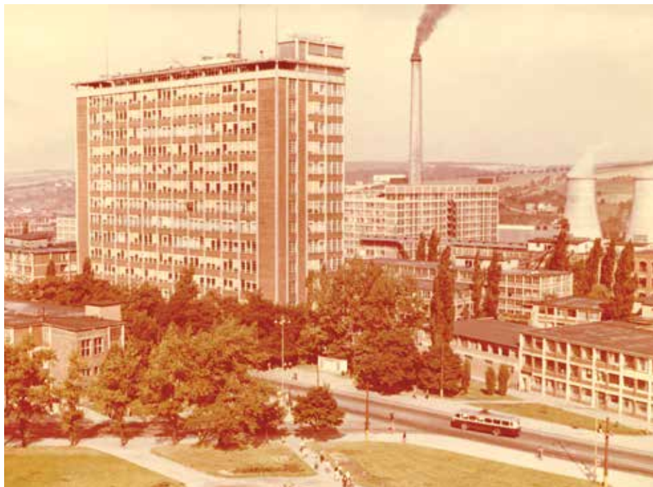
Pohled na náměstí Práce počátkem 60. let 20. století.