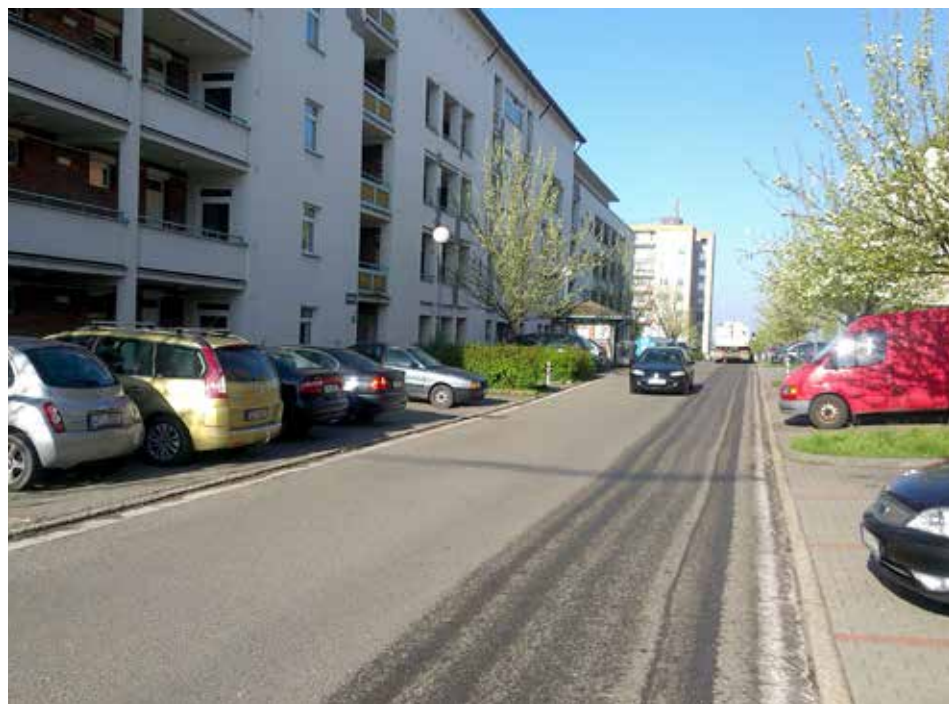
Podlesí vyčistit nešlo, řidiči auta nepřeparkovali.

Přehled termínů blokového čištění města mohou občané nalézt na webu www.tszlin.cz v sekci „pozemní komunikace“. [dvo]