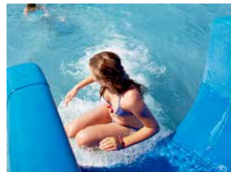
K létu koupání patří.

v červnu otevřeno v závislosti na počasí, červenec a srpen – přes týden od 6.00 do 20.00, víkendy a státní svátky od 9.00 do 19.00