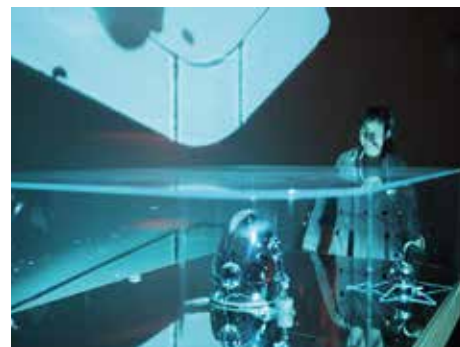
Magnetický stůl.