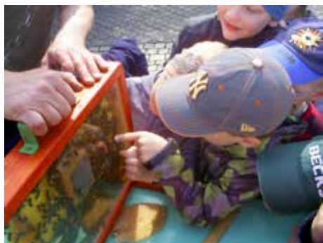
Děti se o včely zajímají.

Služba, kterou včely zdarma poskytují přírodě a lidem, je nedocenitelná. Spektrum věcí, které bychom bez jejich opylovací činnosti neměli, je široké a těžko představitelné. Nezodpovězenou otázkou je, zda by lidstvo bez včel vůbec přežilo, už Albert Einstein uvedl: „Kdyby včela zmizela z povrchu země, potom by měl člověk pouze čtyři roky života. Žádné včely, žádné opylování, žádné rostliny, žádná zvířata, žádný člověk.“