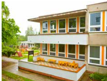
Změnit jesle na školy, ano či ne?

Jesle jsou zařízení pro děti ve věku od jednoho do tří let. Provozování jeslí je služba občanům, kterou by mělo svým občanům zajistit město. Není pravdou, že tato služ-