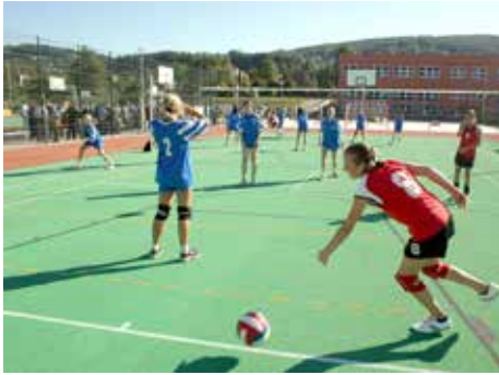
Peníze z loterií míří do sportu...

Na druhou stranu zůstává nesporným faktem, že výherní automaty nejsou stejným podnikáním jako třeba prodej pečiva nebo knih. Na výnosy z hazardu se lze dívat „skrz prsty“ a řada lidí to tak dělá, stejně jako v případě alkoholu nebo cigaret.