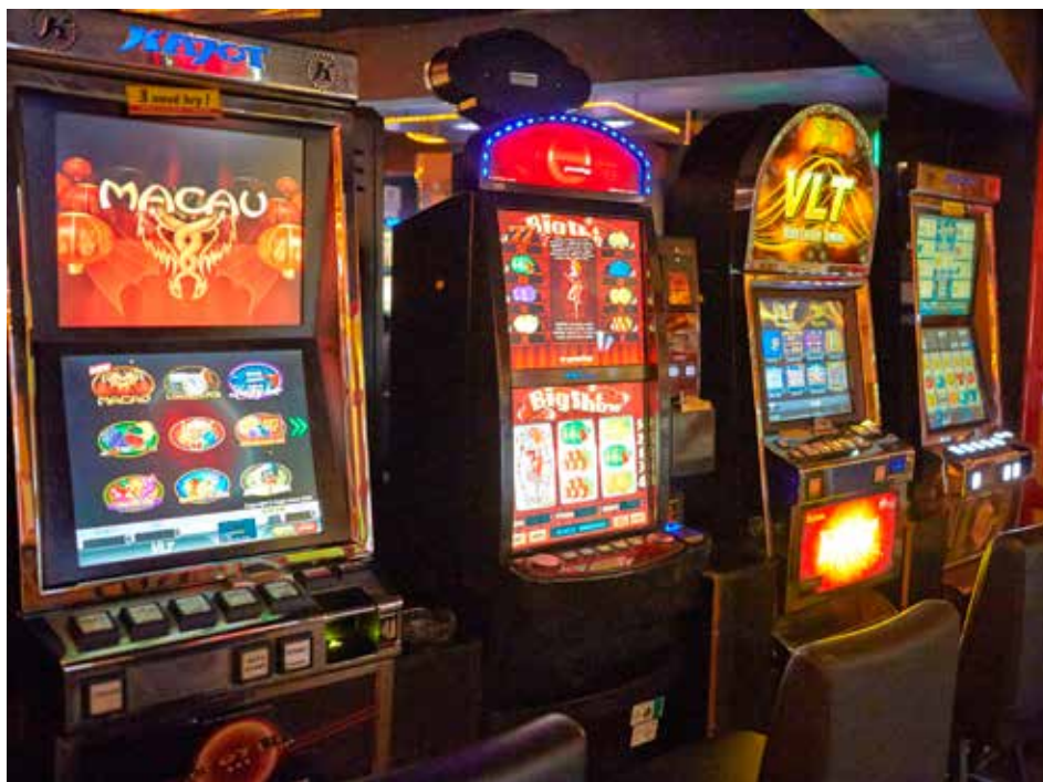
Ve Zlíně počet automatů klesá. I díky razantní vyhlášce města.