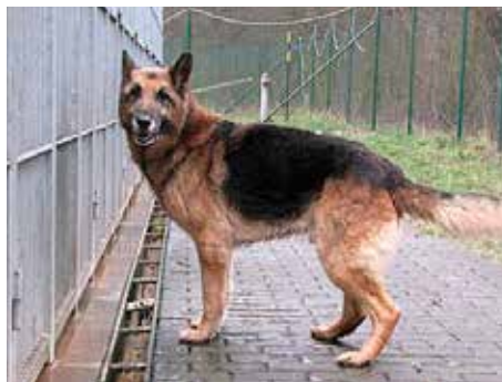
Brix II.

Kromě nabídky nově přijatých nalezených psů máme dnes na vás dosti naléhavou prosbu. Jde totiž o to, abyste nám pomohli vrátit do života tyto dva pejsky - německé ovčáky. Brix II - německého ovčáka typu Rexe, který je starý 8 až 9 let, a Brita - německého ovčáka s tmavší srstí a světlejším pálením, jehož věk odhadujeme na