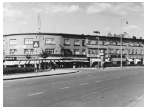
Firma stavěla i celé bloky. Foto Vaňhara, 1938, SOkA Zlín