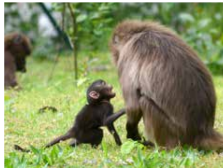
Mládě dželady se drží u matky.

„Asmera se o mládě výborně stará. Je to jedenáctiletá samice, která je vynikající matkou. Mladší samice v ní navíc mají ideální vzor, jak se starat o potomky,“ uvedl zoolog Pavel Shromáždil ze Zoo Zlín. Pohlaví mláděte zatím zůstává tajemstvím. „Jasno bude teprve za pár měsíců, až to poznáme vizuálně například podle zbarvení,“ dodal. Paviáni dželada se moc rádi pasou na zelené trávě, stejně tak ale rádi přicházejí za ošetřovatelem, který jim do výběhu nosí