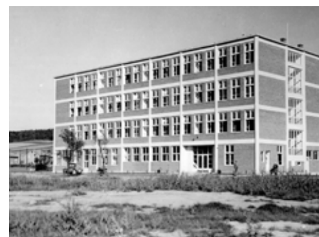
Škola na Zálešné, foto Josef Vaňhara 1933, SOkA Zlín