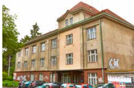
Tady se vařilo pivo i trestalo.

Budovu bývalého soudu a přilehlé pozemky město získalo ve druhé polovině roku 2011, kdy se ukázalo, že má na tento majetek nárok, a to podle zákona z roku 1991. Budova je ve špatném technickém stavu. Protože pro ni radnice nemá využití, snaží se ji prodat. V budově se ještě na počátku minulého století vařilo pivo. Po první světové válce byla přestavěna na okresní soud. Tento význam ztratila na počátku tohoto století, kdy se soudci přestěhovali do nové budovy v Loukách. [dvo]