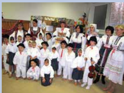
Zobáček baví již tři desítky let.

Dětský folklorní soubor Zobáček pracuje při MŠ, tř. Svobody 835, v Malenovicích. Více informací o činnosti souboru či jeho vystoupeních na www.mssidlmal.estranky.cz .