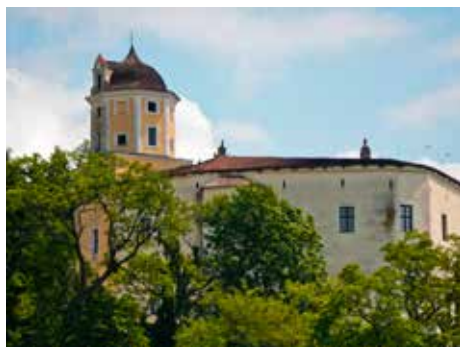
Hrad Malenovice byl založen ve 14. století.

Spanilé princezny, udatní rytíři, princové a královská družino! Na vědomost se dáva, že Vás v sobotu 14. června 2014 od 10.00 do 16.00 na hradě Malenovice čeká dobrodružné hledání hradního pokladu. Nevšední prohlídky hradu s příběhem, jehož tajemství odhalíte na konci při nalezení pokladu. Běžné prohlídky nečekejte, tento den patří hrad výhradně dětem. Otevřena bude i hájenka a její expozice Dřevo, proutí, sláma. Připraveny jsou speciální dětské prohlídky hradu s příběhem a hledáním pokladu