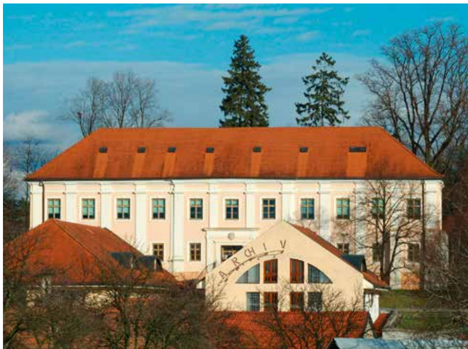
Klečůvský zámek – sídlo Státního okresního archivu Zlín.