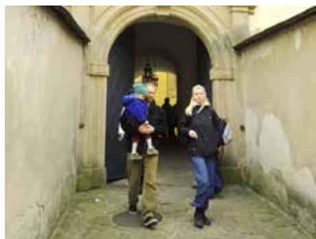
Děti jsou na hradě vítány.

Spanilé princezny, udatní rytíři, princové a královská družino! Na vědomost se dáva, že Vás v sobotu 14. června 2014 od 10.00 do 16.00 na hradě Malenovice čeká dobrodružné hledání hradního pokladu. Nevšední prohlídky hradu s příběhem, jehož tajemství odhalíte na konci při nalezení pokladu. Běžné prohlídky nečekejte, tento den patří hrad výhradně dětem. Otevřena bude i hájenka a její expozice Dřevo, proutí, sláma. Připraveny jsou speciální dětské prohlídky hradu s příběhem a hledáním pokladu