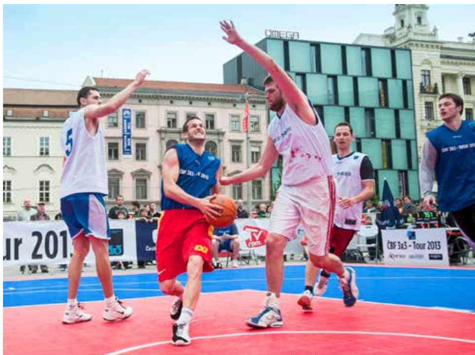
Basketbal 3x3 slavil úspěch už třeba v Brně.