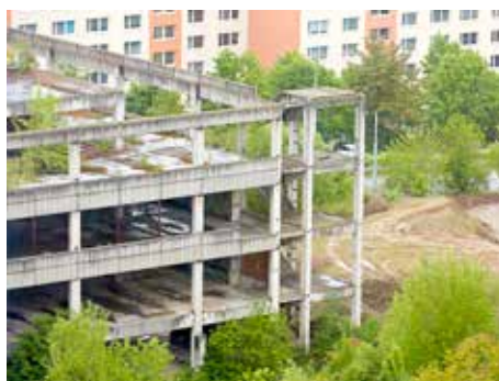
„Torzo“ není bezpečné.

deset milionů korun, bude následně nucen uhradit vlastník stavby. Betonový skelet obchodního centra vyrostl na sídlišti Jižní Svahy v roce 1988. V minulých letech radnice opakovaně prohlašovala, že chce chátrající objekt i s pozemky získat do svého vlastnictví, jednání ale nikdy nedotáhla do úspěšného konce. „Doufáme, že obyvatele Jižních Svahů zbavíme tohoto vředu ještě