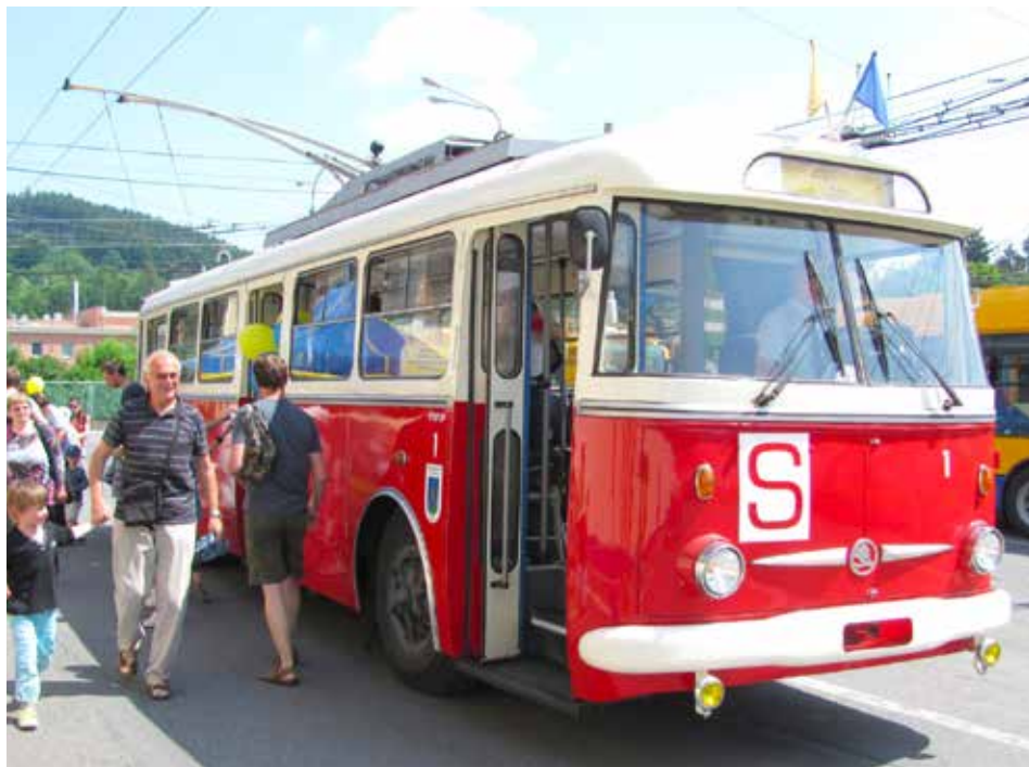
Trolejbusy už ke Zlínu neodmyslitelně patří.