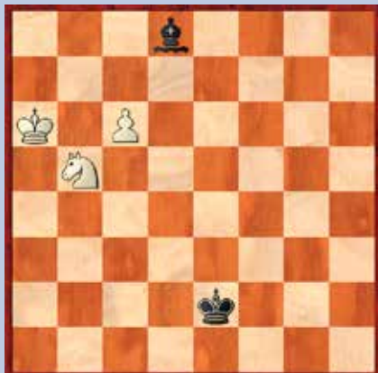
Diagram pro vás

Na následujícím diagramu se snaží bílý pro- sádit svého pěšce do dámy. Ovšem tomu brání černý střelec, který hlídá pole c7. Po- kud by na ně pěšec vstoupil, střelec jej vez- me, a i když by bílému zůstal navíc celý kůň, k výhře by to nestačilo, protože král s jezdcem mat nedají a partie by skončila remízou. Proto je nejdříve nutné vytěsnit střelce z diagonály a5-d8. Bílý k tomu využije špatného posta- vení černého krále: 1. Jd4+ Kd3 2. Je6. Jez- dec a král vzali černému střelci všechna pole na krátké diagonále. Po jeho ústupu již nic nezabrání bílému pěšci v cestě do dámy.