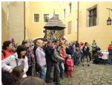
Hradní nádvoří ožije programem.

za pomoci kostýmovaných průvodců. Středověké hry před hradem: házení kroužků na meč, strelování řemdihem do hrnce, střelení z kuše, vyšívání, výroba čelenek a opasků. Po celý den budou na vás z výšky dohlížet draví ptáci, neboť uvidíte ukázky sokolnictví. Bohaté občerstvení místních cukrářských mistrů i tradiční nabídka stánkového občerstvení.