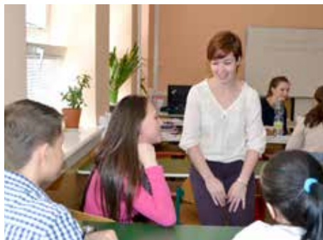
Škola má portugalskou asistentku.

Zlín je nové, moderní město. Ovšem není to chladná skleněná moderna, ale ukázka