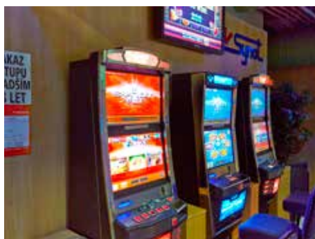
Hazard je kontroverzním tématem.

Při zavedení plošného zákazu hazardu by z příjmů města vypadla částka v řádu desítek milionů korun ročně. Například v roce 2013 to bylo asi 60 milionů korun, z nichž 20 milionů radnice hned poslala do sportu, po deseti milionech do kultury a sociální oblasti. „Díky těmto penězům jsou třeba členské poplatky na současné úrovni. Bez nich by vše bylo dražší, i pro rodiče sportujících dětí nebo těch, které se věnují kultuře v různých kroužcích,“ upozornil Pavel Chwaszcz , předseda Sportovních klubů Zlín.