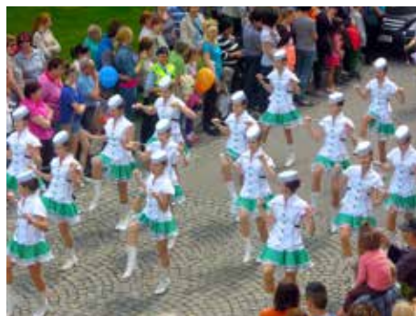
... i kultury a sociální oblasti.

Radnice se ptá na váš názor. „Vydali jsme se cestou omezování hazardu a myslíme si, že je to cesta správná. Jde ale o tak významný a složitý problém, že byste se k němu měli vyjádřit také vy. I proto, že situace kolem hazardu se stále vyvíjí. Vy- užijte proto možnost a odpovězte na zadané otázky. Pro příští vedení města, které vzejde z podzimních voleb, by váš názor měl být velmi důležitý,“ vzkázal Ondřej Běťák . Zdeněk Dvořák